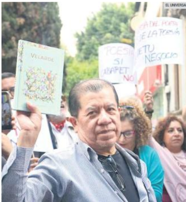
CONTROVERSIA. Un grupo de escritores se reunió para protestar en contra de la secretaria de Cultura de la Ciudad de México.