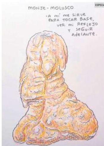
DISCURSO. La exposición aborda temas como el esoterismo y la espiritualidad.

"Yo pensaba que por mi estilo medio pachecho iba a tener una vida bastante aislada, en mi torre de marfil, pero resultó que mucha gente se empezó a identificar con estos monos extraños y con lo cotidiano. Así me empecé a hacer de mucha gente para cotorrear muy bien".