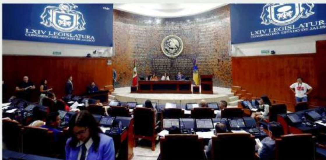
■ El Congreso local sigue sin ponerse de acuerdo sobre el "Plan B" electoral.

La reforma, secuela del "Plan B" federal, contempla topar regidurías a un máximo de 15 en los Ayuntamientos, limitar el presupuesto del Congreso local a un máximo del 0.70 por