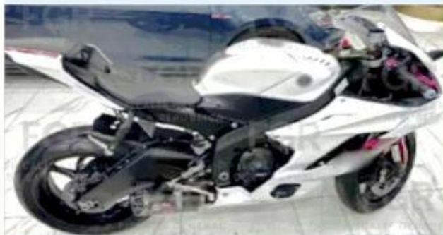
■ La FGR aseguró cinco camionetas y una moto.