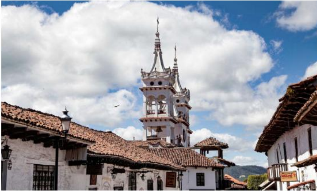
El Pueblo Mágico es de los más visitados de Jalisco.