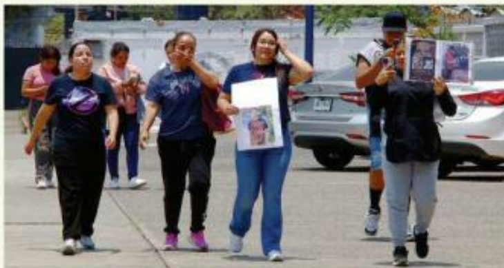
La protesta fue realizada frente a la base de la UEPCBJ.