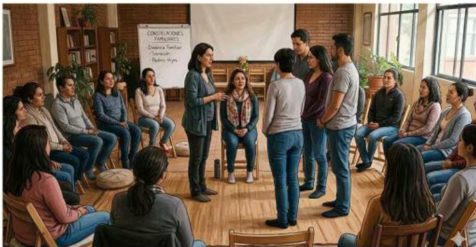
Ilustración: LA GRUPO REFORMA

Por otro lado, el Gobierno de Tepatlán en 2021 lo