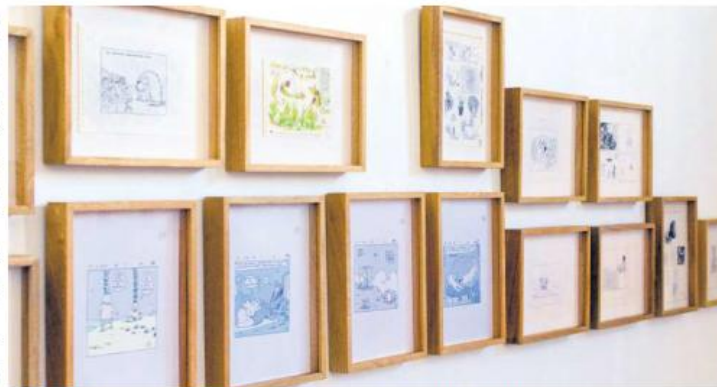
COLECCIÓN. La exposición reúne 190 piezas creadas en distintas etapas de la trayectoria de su creador.

otras sí aparecen la burla y el cuestionamiento hacia ciertos comportamientos humanos.