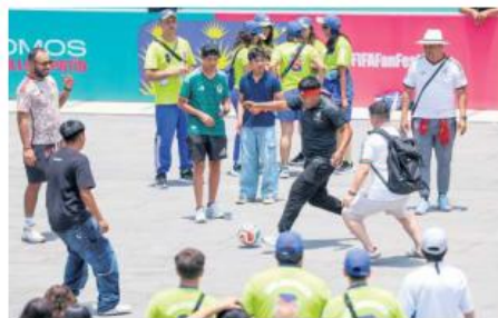
Los aficionados llevaron su pasión por el deporte más allá de la pantalla con una "cascarita" dentro del Fan Fest.