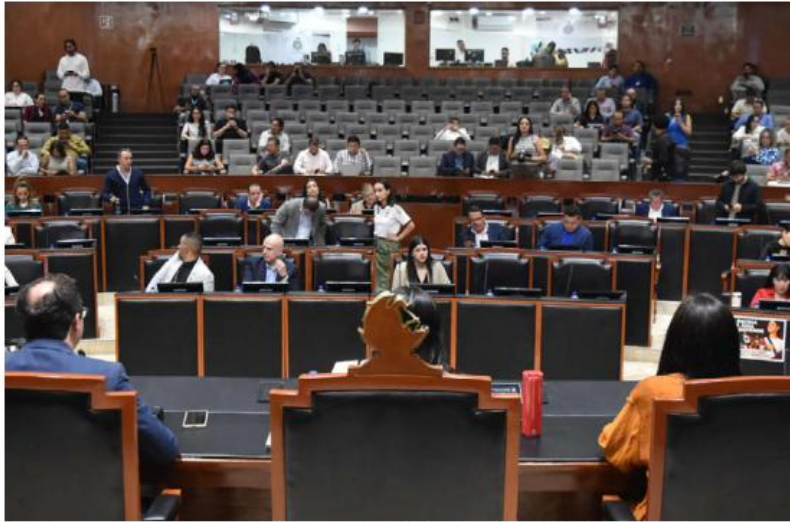
Rechazaron discutir el tema en el Congreso local.