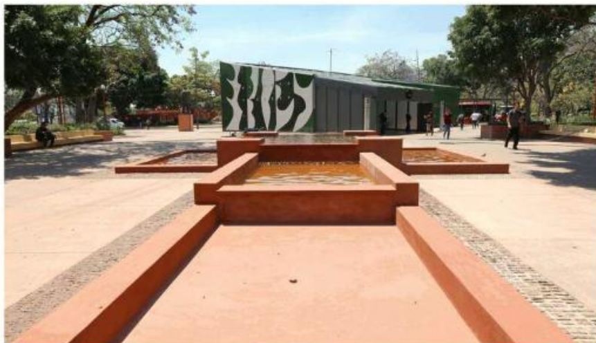
La remodelación del Parque Rojo tuvo un costo superior a los 28 millones de pesos.

to en la obra, sino una inversión justificada y ampliada para proteger el patrimonio: La variación del presupuesto inicial ($24.1 mdp) al monto final contratado ($28.3 mdp) corresponde estrictamente a adecuaciones técnicas y restauraciones especializadas que no estaban contempladas en el proyecto ejecutivo original",