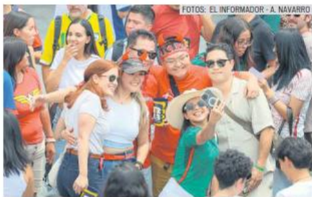
Entre la multitud podían verse camisetas de México, Canadá, Corea del Sur, Estados Unidos y Colombia.