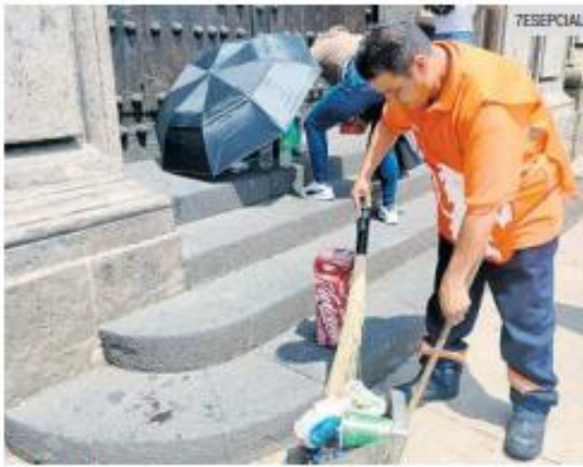
LABORES. Más de 180 trabajadores de servicio de limpieza se desplegaron entre los aficionados.

El primer día de actividades del FIFA Fan Fest en Guadalajara dejó la recolección de 36.8 toneladas de residuos en Plaza Liberación, Plaza Guadalajara, La Minerva, el corredor Chapultepec y zonas aledañas, informó el Ayuntamiento tapatío.