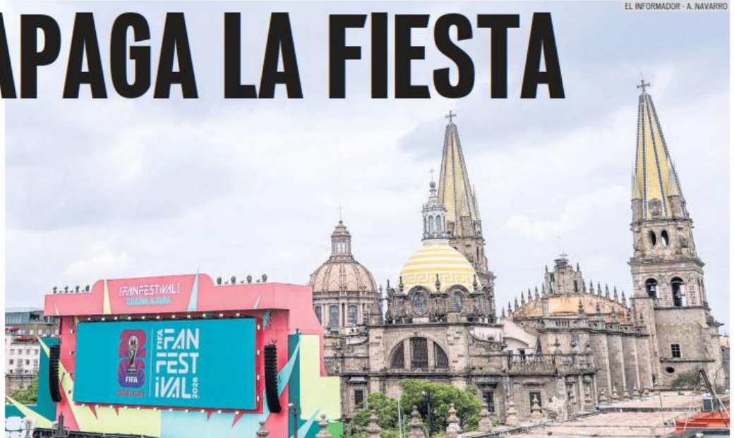
El Fan Fest, enmarcado por la imponente arquitectura de la Catedral de Guadalajara, ha superado las expectativas de tapatíos y visitantes.

Como medida preventiva, fueron apagadas las pantallas gigantes, el sistema de sonido y parte de la infraestructura operativa del festival. La transmisión del partido quedó suspendida temporalmente mientras