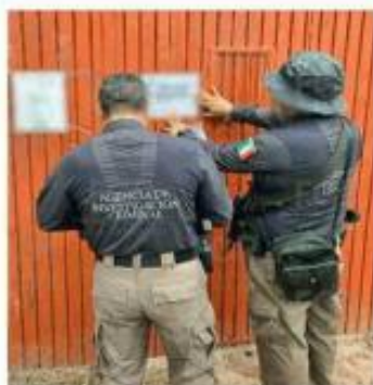
■ La finca fue clausurada.

Informaron del caso a un agente del Ministerio Público de la Fiscalía Especializada de Control Regional,