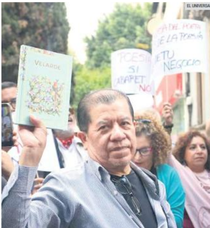
CONTROVERSIA. Un grupo de escritores se reunió para protestar en contra de la secretaria de Cultura de la Ciudad de México.