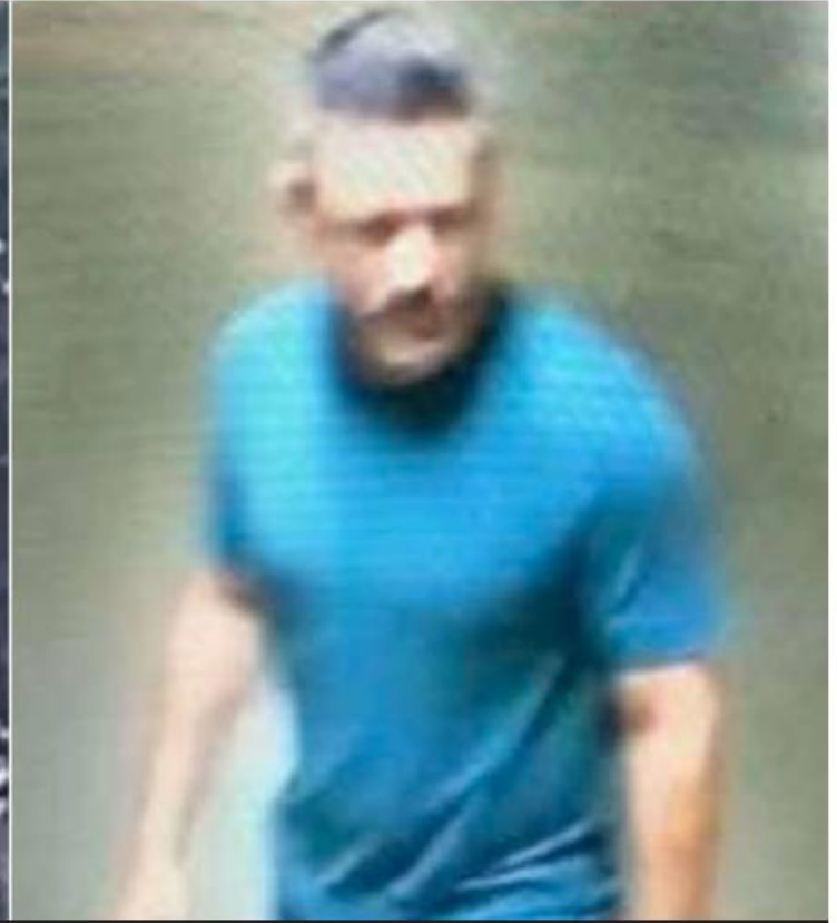
El empresario sinaloense de 44 años fue visto saliendo de un domicilio en la colonia Country Club.