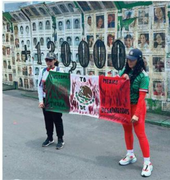
Tres colectivos de Jalisco participaron en la protesta.

“(Para viajar) recabamos dinero a través de rifas, aportaciones voluntarias, etcétera”, explicó Flores.