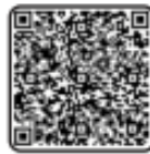
Bases de la convocatoria.

Con la misión de reconocer a quienes, desde la investigación, el desarrollo tecnológico, la innovación y divulgación científica, contribuyen a resolver los desafíos de Jalisco y mejorar la calidad de vida de las personas, el Gobierno del Estado, a través de la Secretaría de Innovación, Ciencia y Tecnología (SICyT), declaró abierta la convocatoria de la edición 25 del Premio Estatal de Innovación, Ciencia y Tecnología (PEICyT) 2026. La bolsa económica para la edi-