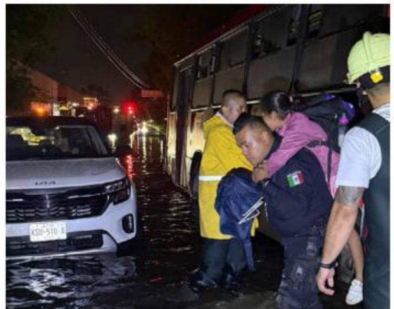
Oficiales ayudan a ciudadanos.

Las condiciones meteorológicas también impactaron actividades relacionadas con el Mundial de Fútbol. Debido a la tormenta fue cancelada la transmisión del partido entre Estados Unidos y Paraguay en el FIFA Fan Festival instalado en Guadalajara. —