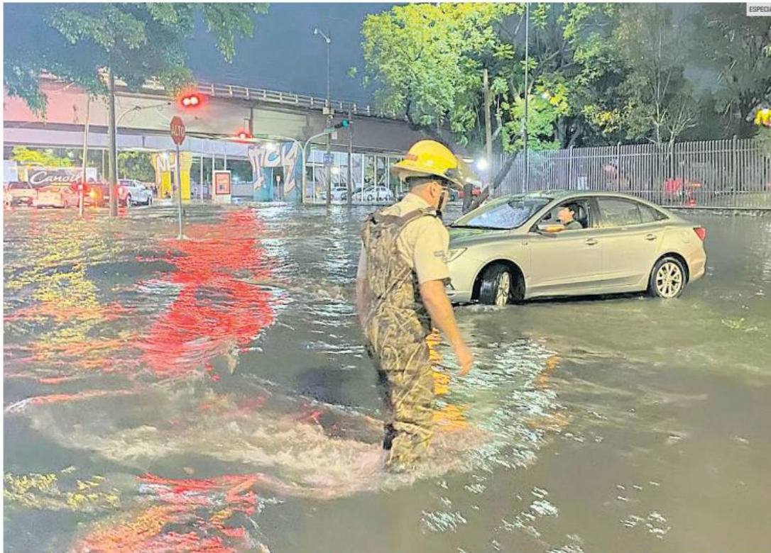
REACCIÓN. Elementos de emergencia y seguridad atendieron múltiples reportes de inundaciones, vehículos varados y caída de árboles tras la intensa lluvia que azotó a la metrópoli anoche.