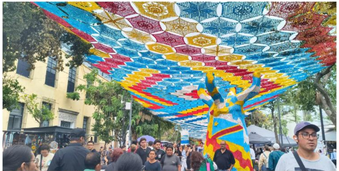
Miles de turistas aprecian y difunden en redes sociales la riqueza de esta tradición. FÁTIMA BRICEÑO

En cada puntada permanece la memoria de una familia, el trabajo de una comunidad y el orgullo de un municipio que, con paciencia y creatividad, logró tejer su nombre en la historia. ■