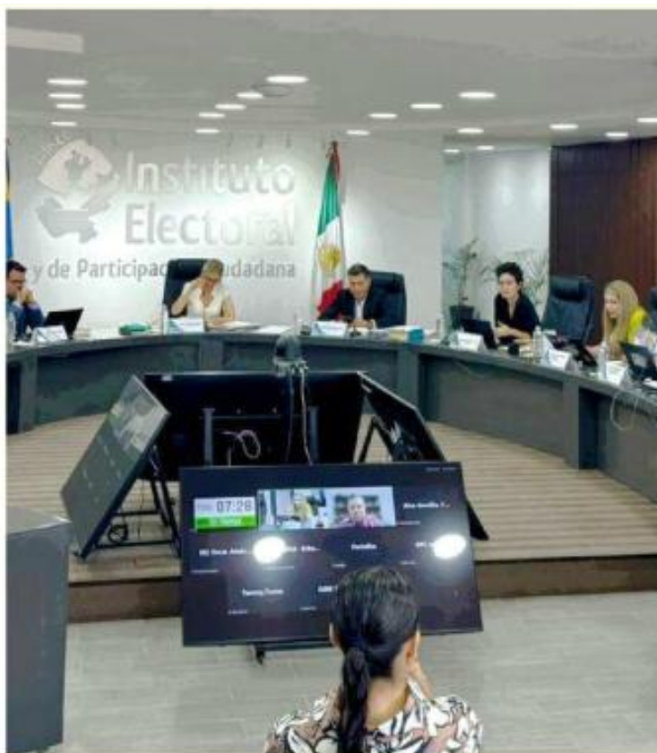
■ El IEPC avaló el registro del Partido Humanista el 5 de junio; ese mismo día le extendió su primera multa.

Esta multa se le fincó al Partido Humanista en la misma sesión del Consejo General de IEPC donde avalaron su registro como partido político y, a su vez, le otorgaron un financiamiento público de 5.3 millones de pesos para los restantes seis meses de 2026.