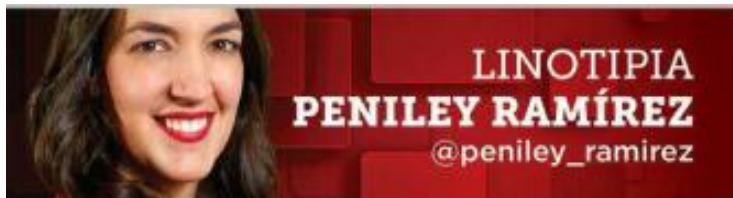
LINOTIPIA PENILEY RAMÍREZ @peniley_ramirez

Tras una nueva amenaza en su contra, la diputada sinaloense Paola Gárate no piensa guardar silencio; tampoco confía en la protección federal.