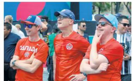
Buena parte de la atención también la acapalaron los aficionados canadienses presentes en Guadalajara.