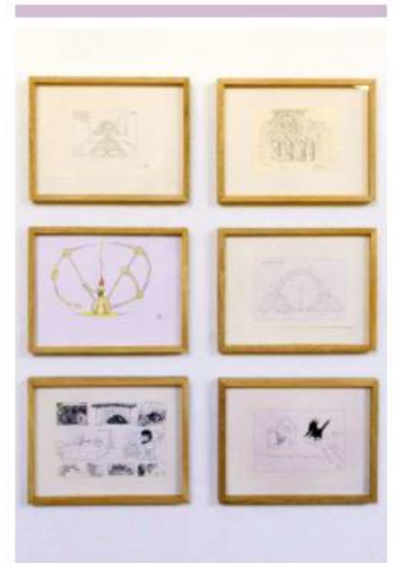
CULTURA. La muestra fue curada por Diego Orduño.

"Yo sigo en una especie de estado de asombro permanente, en una especie de pasmo. Quizá por eso me siento hermanado con un sentimiento que yo llamo místico. No soy religioso en el sentido de pertenecer a una religión organizada, nunca lo he sido, pero sí me siento participante de ese sentimiento místico. La vida es una cosa fantasmagórica".