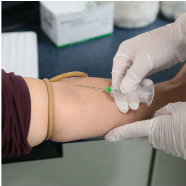
El reto es lograr que la donación se convierta en una práctica habitual. CORTESÍA

En Jalisco, la cifra es incluso menor, "el porcentaje de donación altruista es de un 5 por ciento y 95 por ciento de donación familiar". Mientras la donación de reposición ocurre cuando un paciente ya necesita sangre para una cirugía, tratamiento o emergencia, la donación altruista permite mantener reservas disponi-