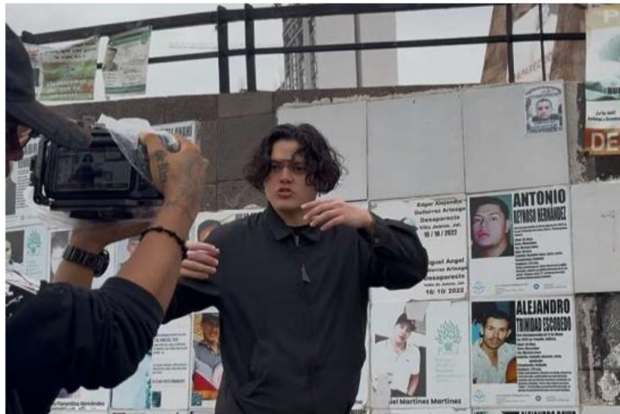
Buscan visibilizar la crisis de desaparecidos en la entidad. MARIO C. RODRÍGUEZ

El como miles de personas en territorio nacional, conoce ya sea el abuso por parte de autoridades o alguien que ha sido víctima de desaparición. "Amigos, lejanos, amigos, claro que han sido víctimas y