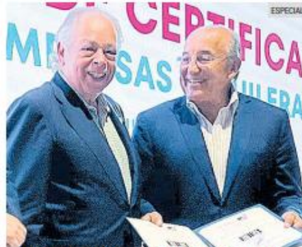
CONSEJO REGULADOR DEL TEQUILA. El certificado fue entregado ayer a 23 tequileras.