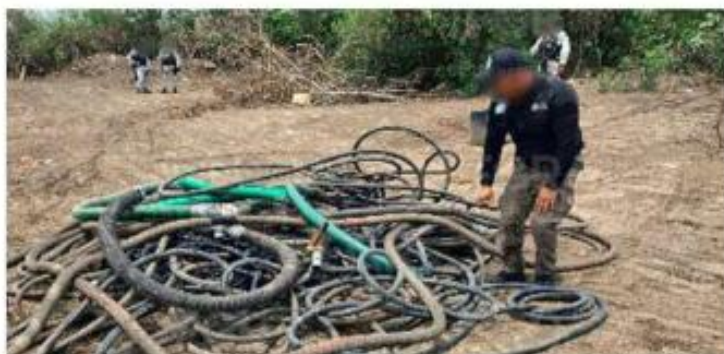
■ Agentes localizaron tomas clandestinas.

puesto a disposición de la Fiscalía General de la República (FGR), cuyo personal continúa con la investigación para sancionar a quien resulte responsable por Delitos en Materia de Hidrocarburos.