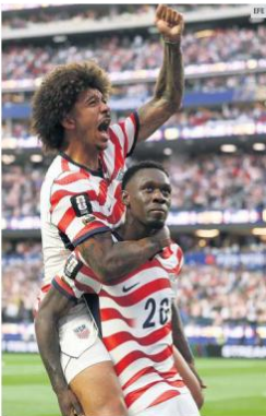
LA FIGURA. Con dos goles y una actuación determinante, Folarin Balogun (#20) fue elegido como el jugador más valioso en el triunfo de EU ante Paraguay.