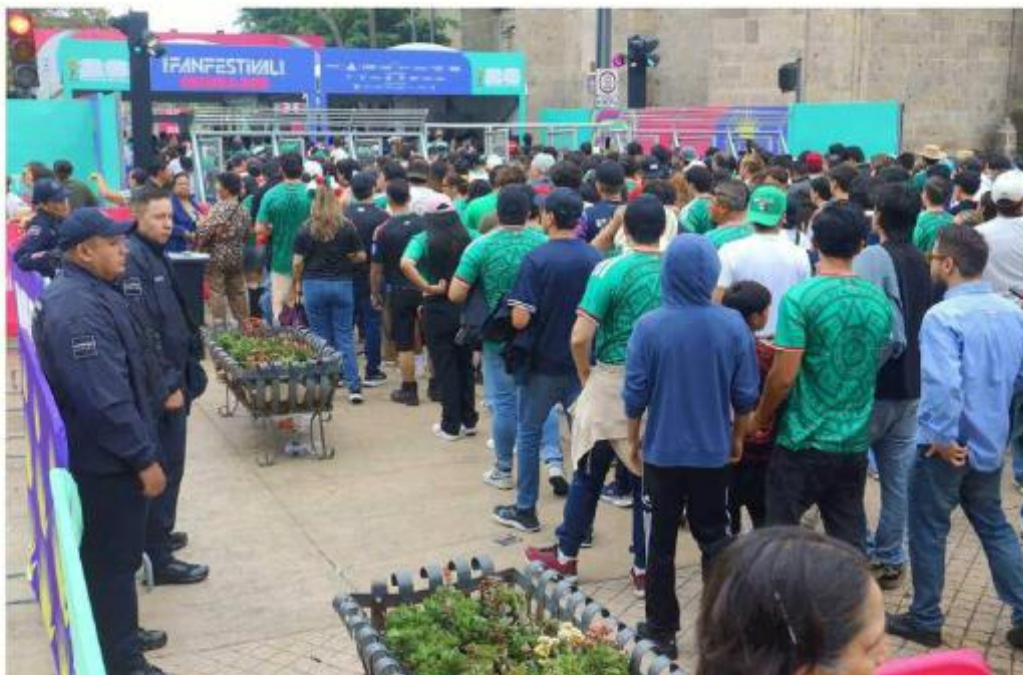
El FIFA Fan Festival abarca diversas zonas del primer cuadro de Guadalajara.

Codeni, cuya misión es dar acompañamiento a menores de edad con necesidad de un empleo, acusó que las medidas impactan directamente en el sustento de fa-