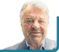
X:@JorgeGCastaneda Jorge Castañeda G.