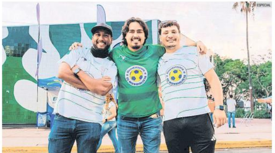
ESPARCIMIENTO. Uno de los principales puntos a los que llegan los recorridos es el Parque de la Revolución.

Se puede consultar el calendario completo en las redes sociales de @tequierogadajalajara en Instagram y Facebook. Para participar es necesario realizar un registro previo y presentarse al menos 30 minutos antes de la salida.