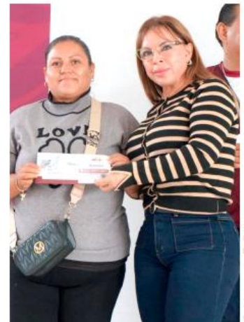
La presidenta, María Elena Farías encabezó la entrega.

"Estas acciones demuestran que cuando hay voluntad institucional, los recursos llegan de manera oportuna a quienes más los necesitan. Agradecemos a la presidenta Nena Farías por su compromiso y cercanía con la población", subrayó el funcionario federal.