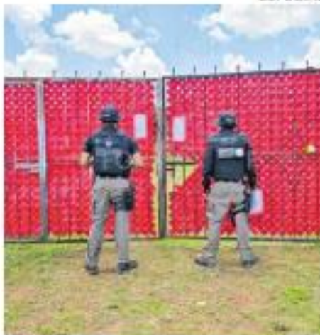
MUNICIPIOS. El hidrocarburo ilegal se decomisó en Tala y Tepatitlán de Morelos.