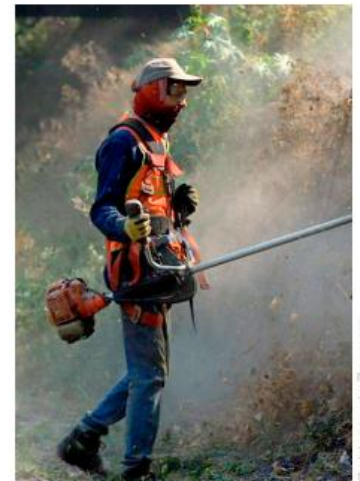
De los 35 afluentes, 33 ya fueron intervenidos.

Uno de los puntos que recibe atención permanente es la zona de La Martinica, donde el Gobierno de Zapopan trabaja de manera coordinada con la Dirección de Obras Públicas e Infraestructura para mantener limpios los cauces y fortalecer la capacidad de regulación hidráulica mediante obras como la construcción de un vaso regulador.