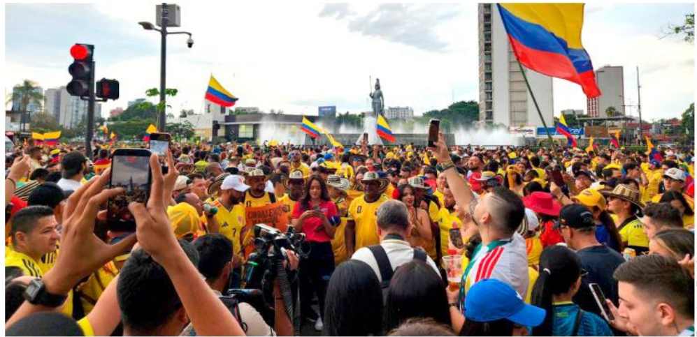
Con banderas, playeras, sombreros típicos y música, armaron su fiesta.