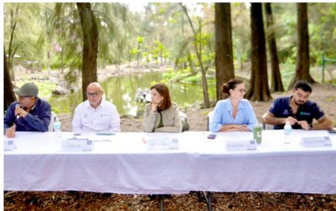
Funcionarios explicaron que la estrategia contempla tres tipos de intervenciones.

en 278 hectáreas y logró cerrar con más de 160 mil árboles plantados".