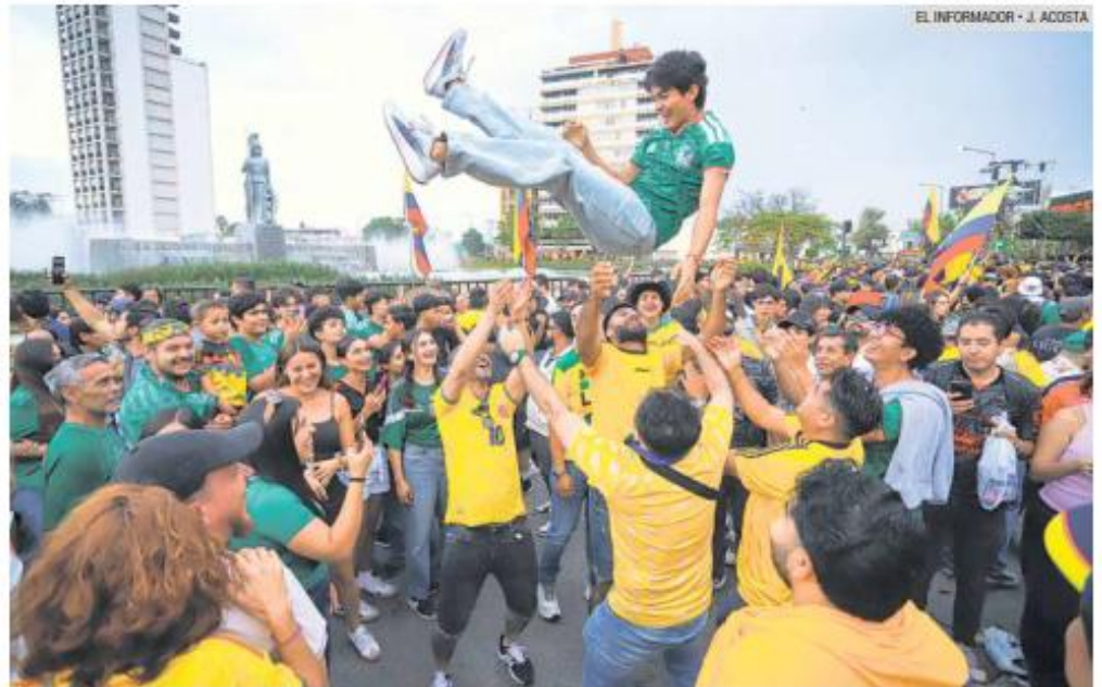
EUFORIA. Entre banderas, sombreros vueltiaos y cánticos, aficionados colombianos y tapatíos celebran en Guadalajara y muestran su apoyo incondicional a la Selección cafetera.

La celebración también sirvió para fortalecer los lazos entre dos países unidos por una profunda pasión futbolera. Lejos de cualquier rivalidad, mexicanos y colombianos convivieron durante varias horas en un ambiente de respeto,