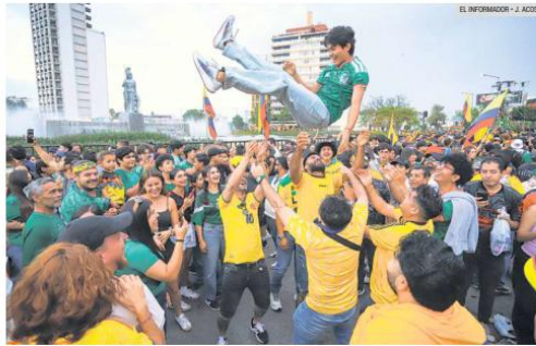
EUFORIA. Entre banderas, sombreros vueltajos y cánticos, aficionados colombianos y tapatíos celebran en Guadalajara y muestran su apoyo incondicional a la Selección cafetera.

La celebración también sirvió para fortalecer los lazos entre dos países unidos por una profunda pasión futbolera. Lejos de cualquier rivalidad, mexicanos y colombianos convivieron durante varias horas en un ambiente de respeto,