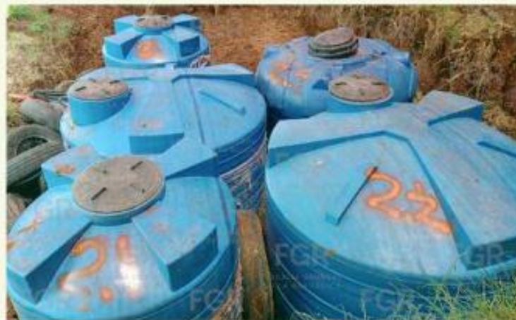
■ En Tepatitlán encontraron contenedores semienterrados.

una carpeta de investigación contra quien o quienes hayan participado en la comisión de delitos previstos en la Ley Federal para Prevenir y Sancionar los Delitos en Materia de Hidrocarburos.