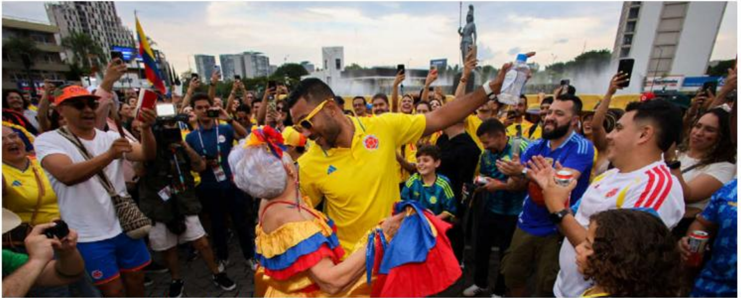
El baile se apoderó de la glorieta con los extranjeros y mexicanos. FARIDSANTOS