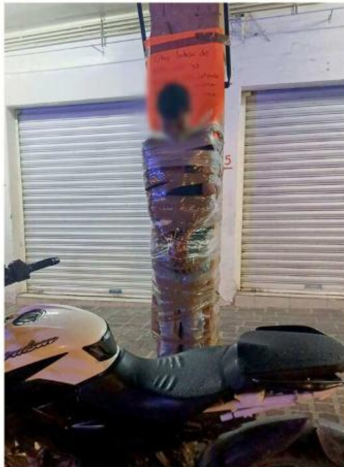
Al menos cinco sujetos han sido atados a postes en Lagos de Moreno en los últimos días.

Las estadísticas muestran que el mes con mayor incidencia en este 2026 ha sido marzo, cuando hubo 25 denuncias. El mes con más casos del periodo analizado del año pasado, por su parte, fue enero, con 15.