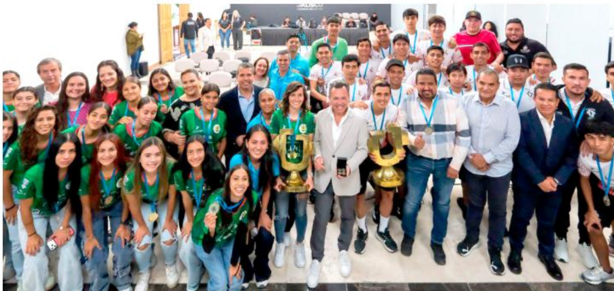
Recibieron medallas y boletos para un partido del Mundial de Fútbol.

La Copa Jalisco se consolida como el torneo de fútbol amateur más importante de México, impulsando el talento deportivo en las distintas regiones del estado y fortaleciendo la participación comunitaria a través del deporte.