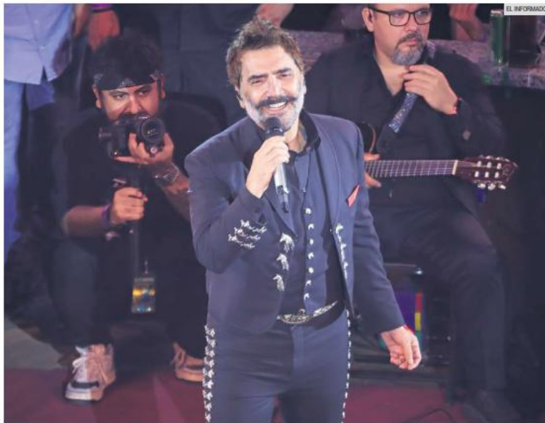
ALEJANDRO FERNÁNDEZ. El intérprete anunció un concierto donde tocará todos sus éxitos.

Este 25 de junio, el cantante ofrecerá un concierto al pie de La Minerva donde compartirá el escenario con Julión Álvarez