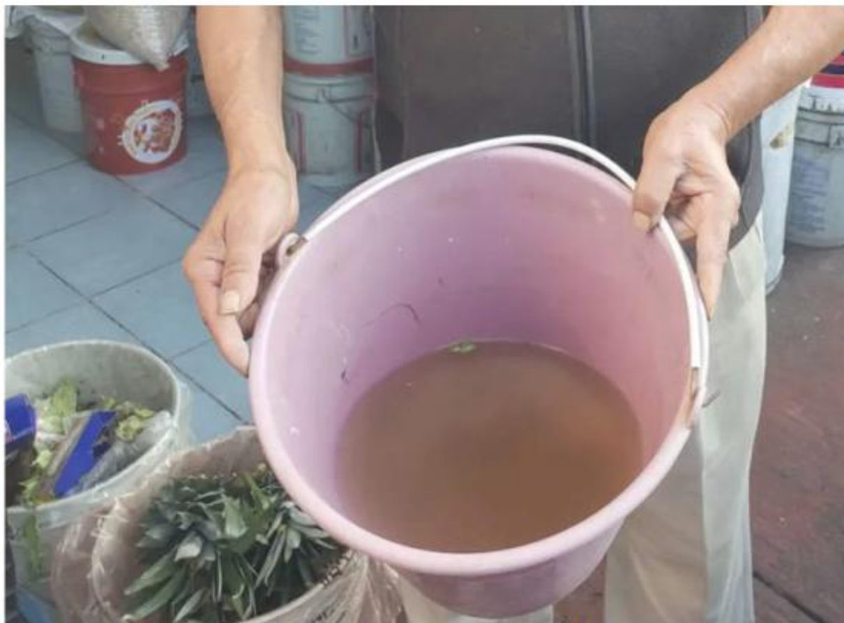
En la colonia Altamira, Zapopan, las condiciones vuelven inutilizable el agua.