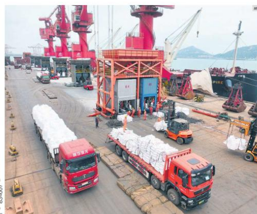
MEDIO ORIENTE. Las tensiones y la incertidumbre sobre la operación del Estrecho de Ormuz han encarecido combustibles, fertilizantes (foto) y servicios logísticos, generando presiones sobre sectores estratégicos, como el agroalimentario y la industria manufacturera.

Y propuso ampliar el catálogo de delitos que pueden denunciarse por internet. Actualmente, únicamente es posible reportar ilícitos cibernéticos y el extravío de documentos.