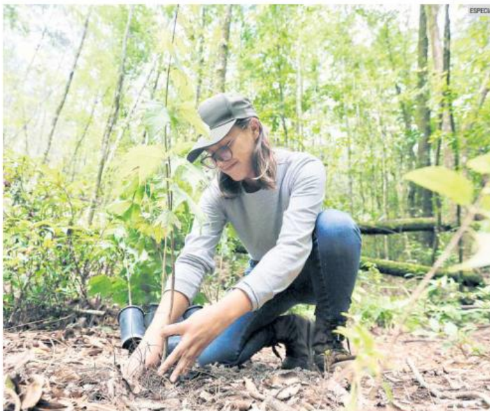
ACCIONES. La reforestación incluye la plantación de especies nativas adaptadas a las condiciones de cada región del Estado.

Entre los puntos prioritarios destacan la Meseta de Tapalpa, Cerro de Quila y el Bosque La