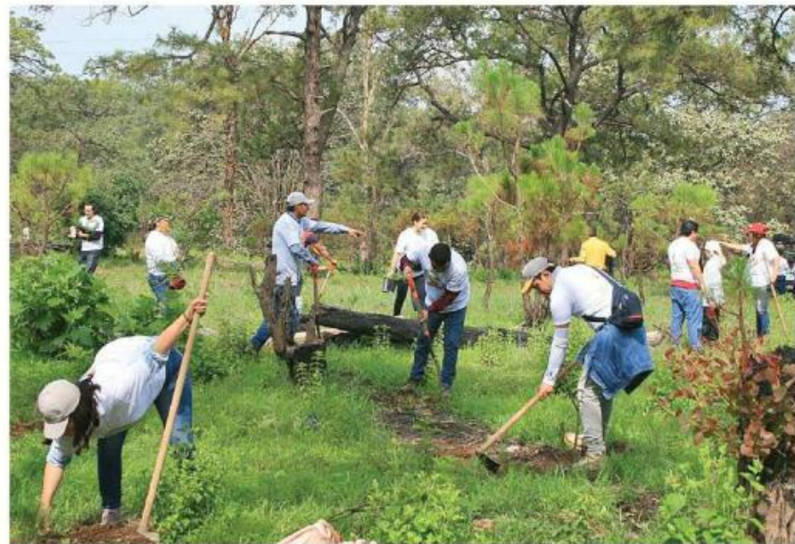
La meta de reforestación para el Bosque La Primavera es de 25 mil plantas nativas de pino y encino en 35 hectáreas.