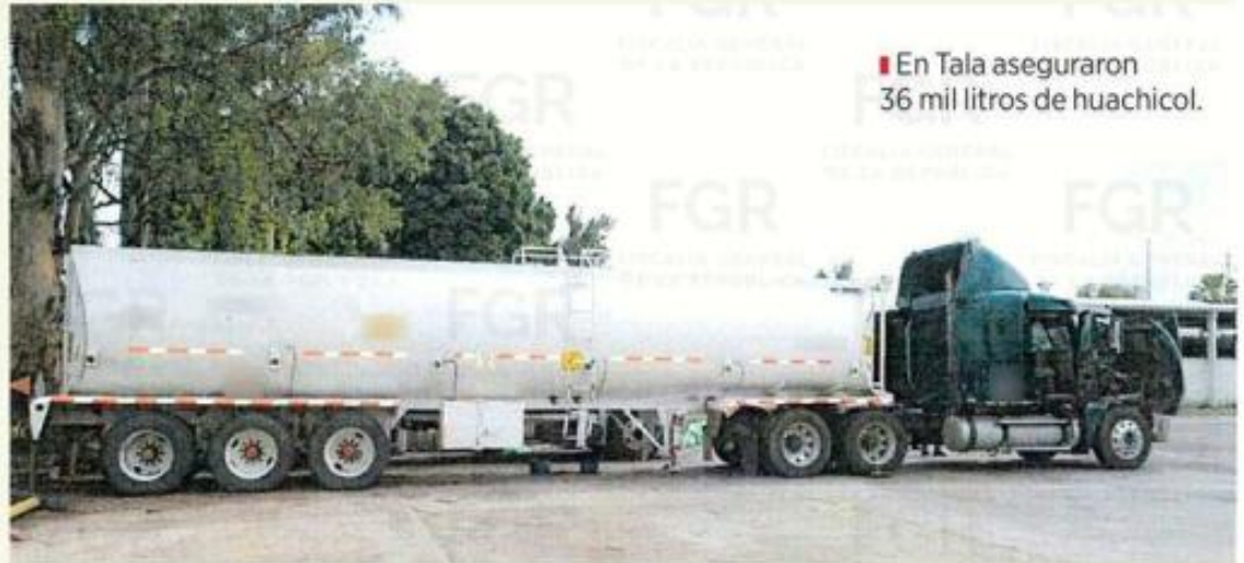
■ En Tala aseguraron 36 mil litros de huachicol.

Debido a este hecho, la FGR, a través de la Fiscalía Especializada de Control Regional (FECOR) en el Estado de Jalisco integró