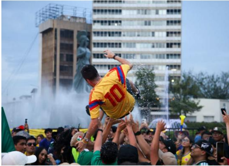
Unos 12 mil colombianos se reunieron ayer en la glorieta, según el gobierno estatal. FARIDSANTOS