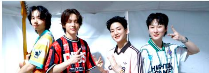
El momento más esperado fue la presentación de W24.

El evento reunió a miles de asistentes interesados en conocer distintas expresiones de la cultura surcoreana, desde gastronomía y turismo hasta música, danza y actividades recreativas,