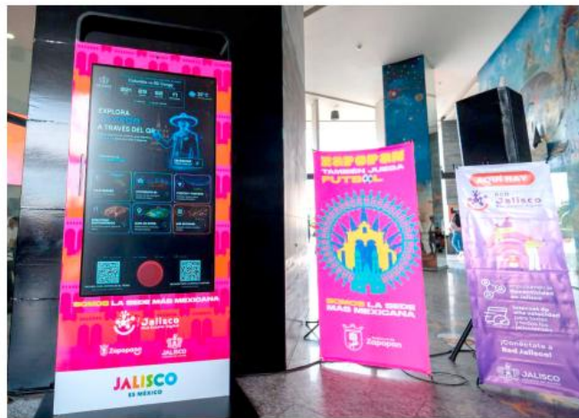
El software de los paneles permite la consulta simultánea en 19 idiomas.

El gobernador del estado, Pablo Lemus Navarro, encabezó el encendido oficial de esta infraestructura metropolitana en el Centro Integral de Servicios de Zapopan (CISZ), donde puntualizó que estos dispositivos interactivos no son una medida provisional por la justa deportiva, sino que se integrarán como equipamiento urbano permanente para la ciudadanía.