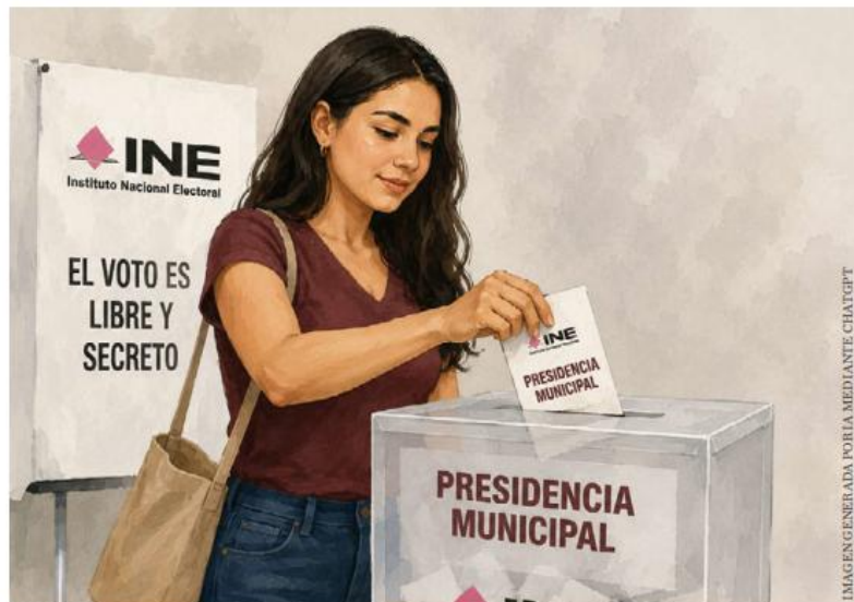
IMAGEN GENERADA POR IA MEDIANTE CHATGPT

Fueron 34 recursos de reconsideración. Los interpusieron ciudadanas —más de 20 mujeres activistas— y partidos políticos como Morena, PRI y Movimiento Ciudadano. Es decir, una coalición heterodoxa que logró lo que parecía imposible: que el máximo tribunal electoral del país le ponga freno a una política diseñada para garantizar la paridad. Lo que está en juego no es menor. La Sala Superior deberá decidir si confirma el proyecto o lo modifi-