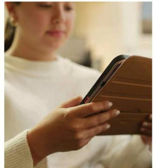
■ Alertan por incremento de conductas fraudulentas realizadas mediante el uso de plataformas digitales, sitios apócrifos, mensajes electrónicos y redes sociales.

La Secretaría de Seguridad expuso que seguirá fortaleciendo acciones de comunicación preventiva, orientación ciudadana y difusión de recomendaciones en materia de seguridad digital.