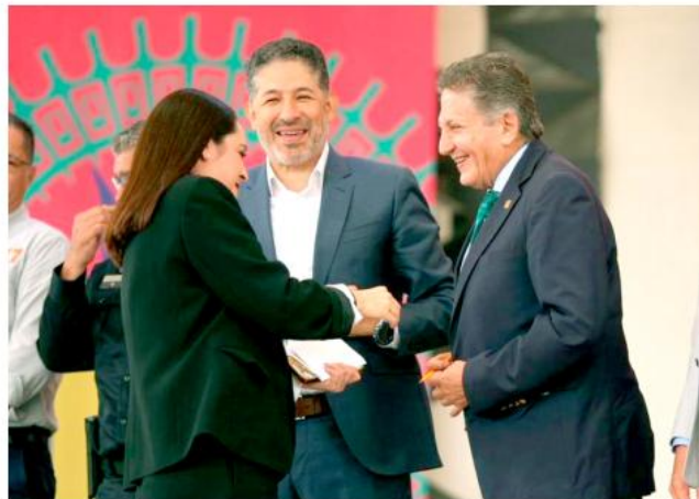
El evento fue encabezado por el alcalde de Zapopan y el titular de Educación.

Este año, beneficiarán a 65 escuelas con cámaras de videovigilancia y alarmas sonoras