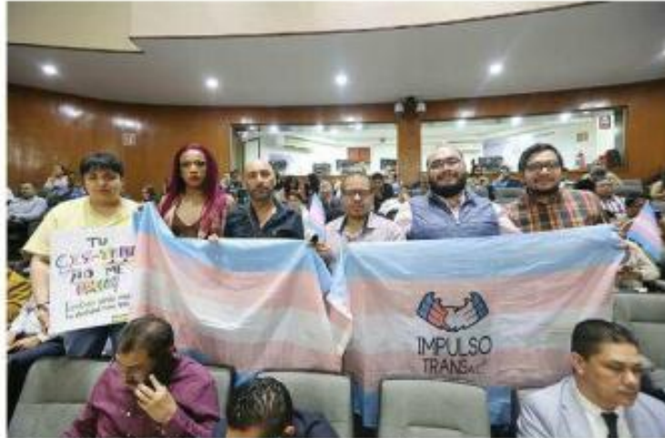
■ Requiere la SCJN por séptima vez al Congreso a legislar a favor de las infancias trans.

Debido a que la presidencia de la Mesa Directiva del