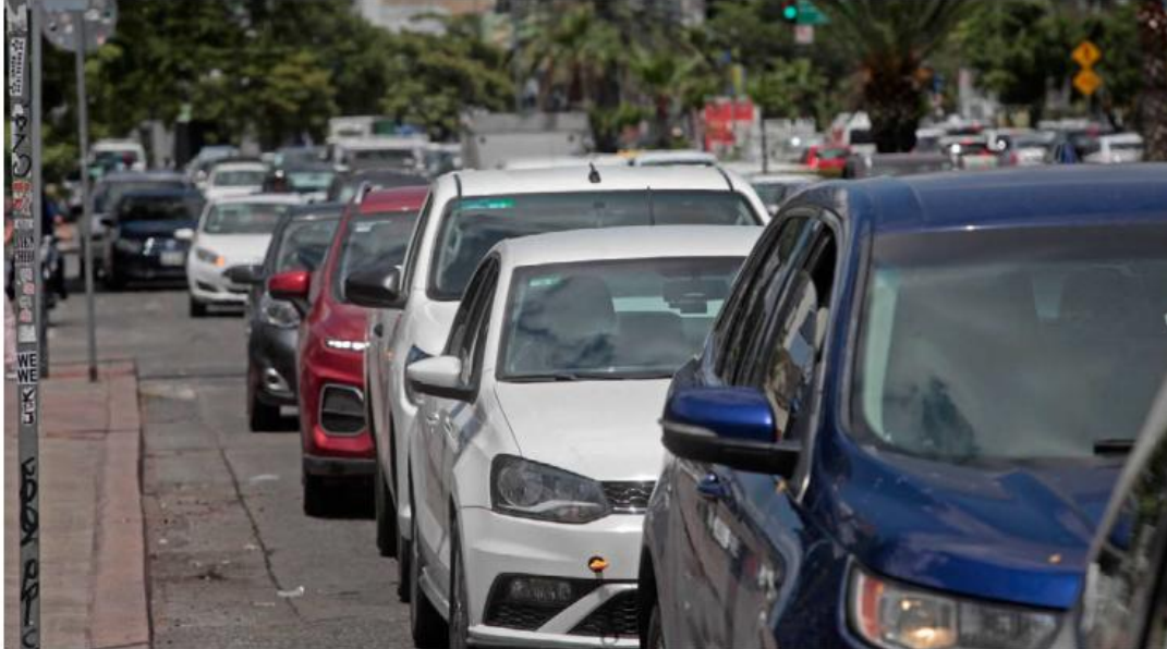
Los responsables se hacen pasar por conductores de plataformas digitales o taxis autorizados.