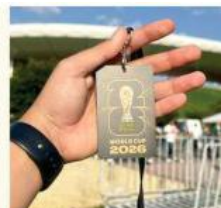
■ Usaron dos colombianos documentos falsos para acceder al Mundial.

“Se podría configurar algún otro tipo de delito cuando utilizas un documento falsificado es uso de documento, eventualmente si te acreditan que tú lo fabricaste, es la fabricación de documentación falsa, que son dos conceptos o dos tipos penales diferentes”, comentó.