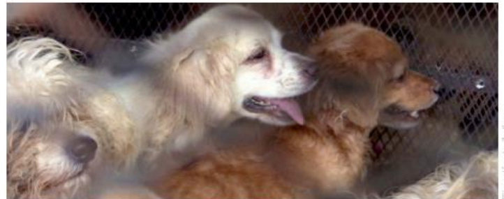
Fiscalía de Jalisco

Atención a la mujer: La Unidad de Investigación Especializada en Delitos Contra la Familia auxilió a la víctima. Fue trasladada a la Cruz Roja para recibir