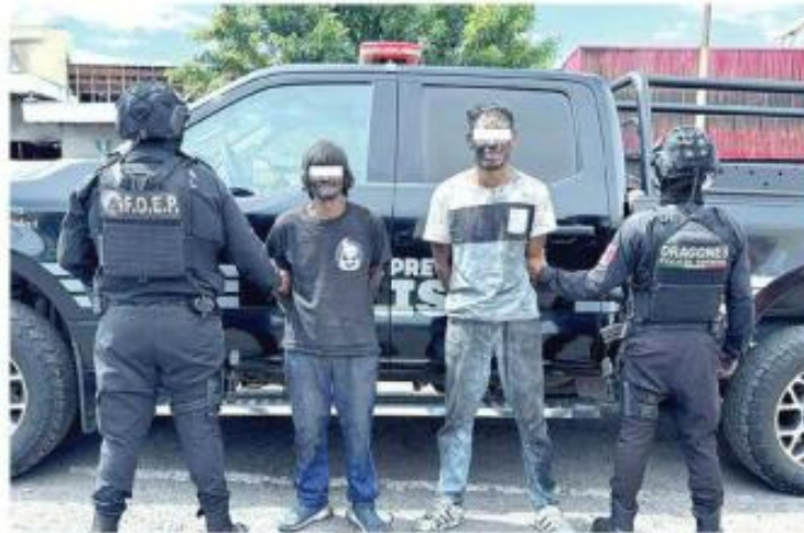
■ Los ladrones trataron de escapar de las autoridades.

El plan fue frustrado cuando el personal de seguridad privada detectó que había movimiento inusual en