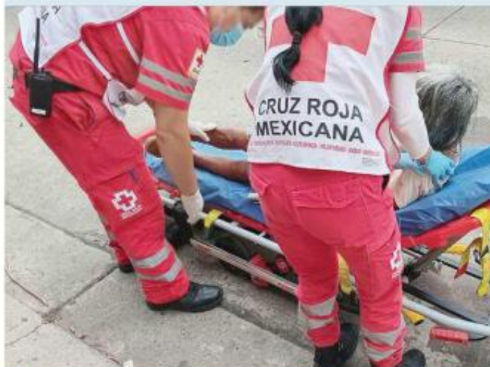
La mujer se encontraba en estado de aparente abandono.

En septiembre pasado, por otro lado, agentes ejecutaron un mandato judicial en un domicilio en Tlajomulco, tras una denuncia que señalaba a un hombre por golpear a sus mascotas. En el interior encontraron siete perros.