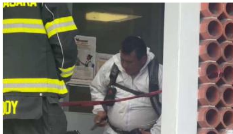
Personal se encargó de desinfectar el área. J. CARLOS MUNGUÍA

Al momento, las investigaciones corrieron por parte del Área del Puesto de Socorros de la Fiscalía de Jalisco, para determinar si la persona ingirió el veneno por decisión propia o fue algo accidental. ■