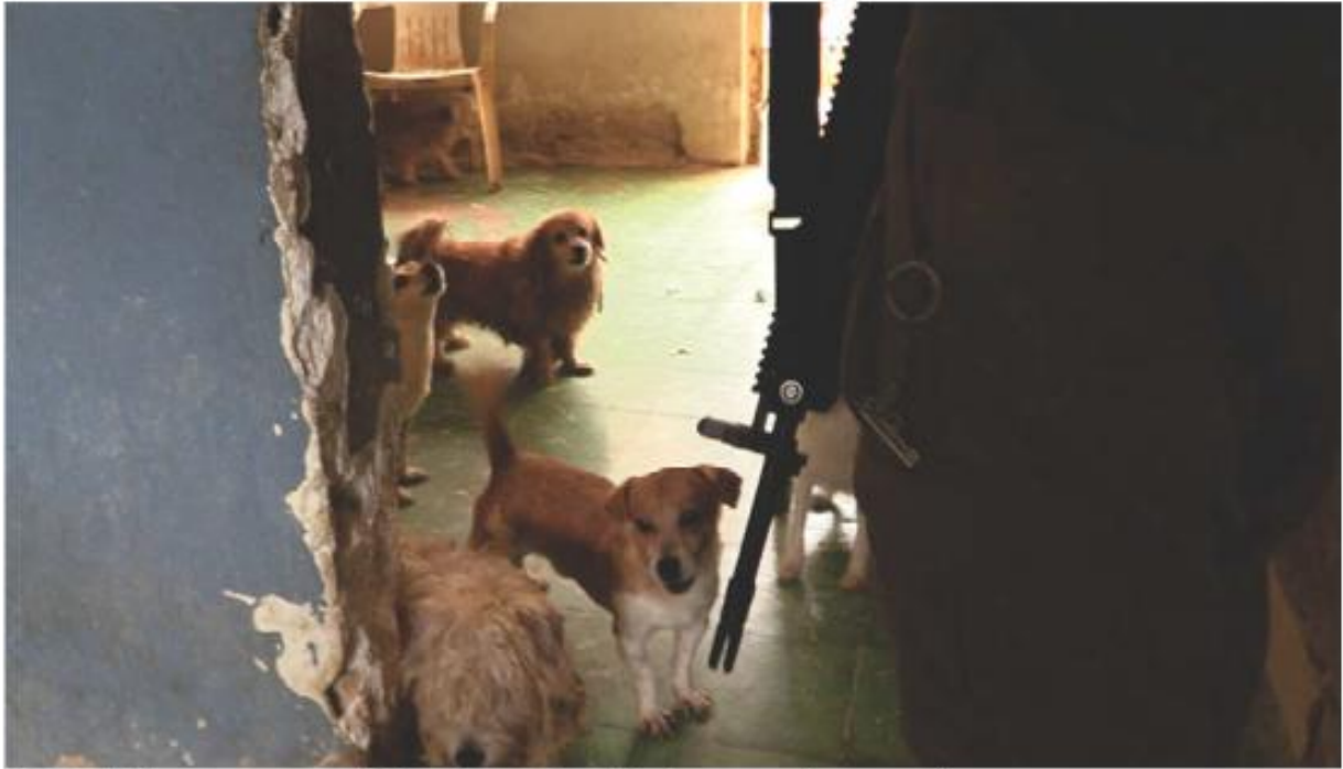
Varios de los canes presentaban signos de maltrato.