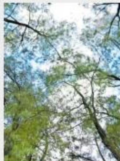
BOSQUE. La Campaña Estatal de Reforestación 2026 fue anunciada ayer en Los Colomos.