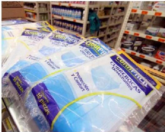
Hay quienes quieren llevarse hasta 100 paquetes.

Un dueño de otra farmacia, también mencionó que desde di-