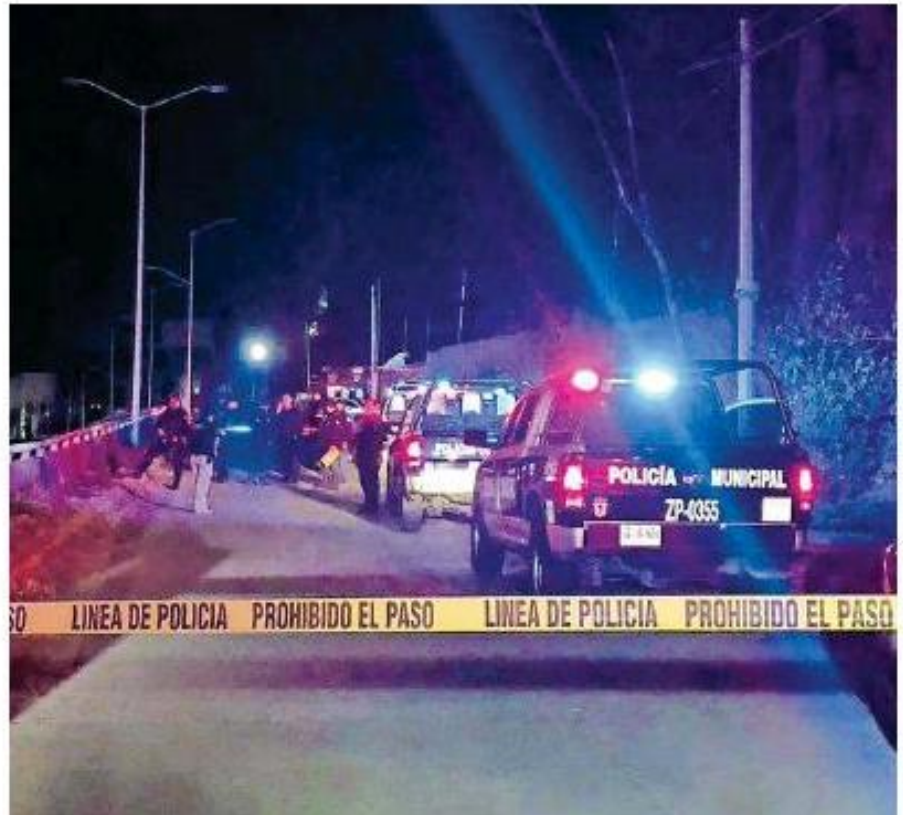
En la colonia Las Agujas un hombre fue atacado a balazos.

El segundo crimen se dio cerca de las 02:40 horas, en el bar 'La Perla del Pacífico' en la avenida Manuel J. Clouthier al cruce con Sebastián Bach, en la colonia