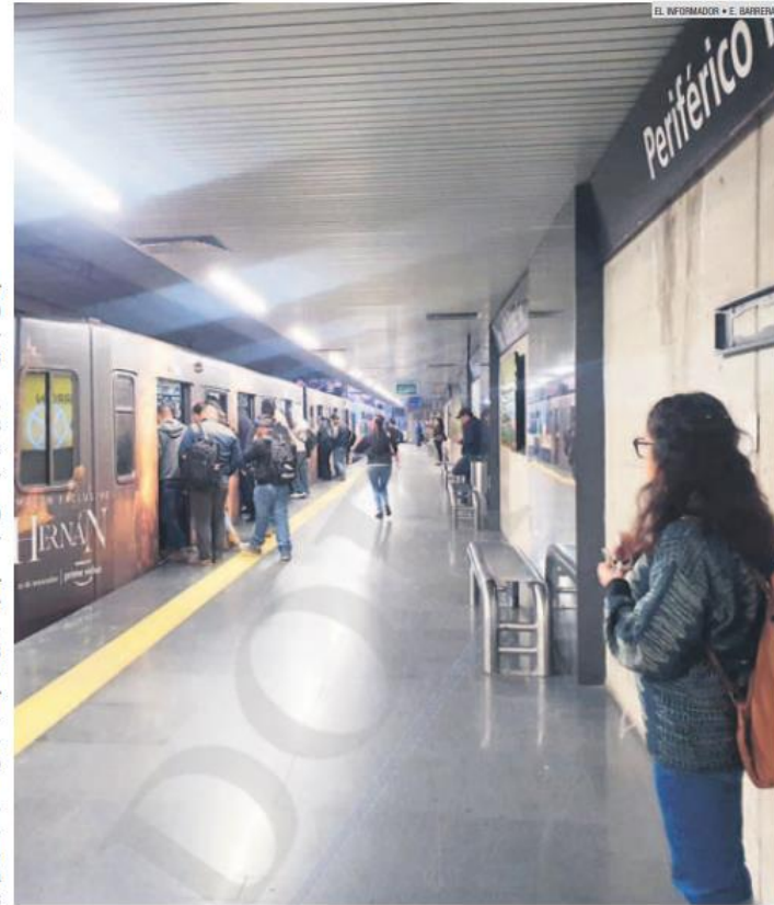
AMPLIACIÓN. El Siteur incluyó los trenes triples en mayo de 2019.

Al solicitar al Siteur los horarios de paso de los trenes con tres vagones, la dependencia sólo refirió que los trenes triples circulan todo el día: seis triples y seis dobles en horas pico y cuatro triples y cuatro dobles en horas valle.