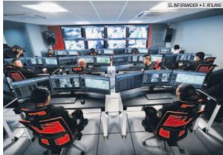
PENDIENTE. El C5 debería estar listo desde septiembre de 2018.

El Escudo Urbano ha requerido una inversión de 895 millones de pesos. Fue here-