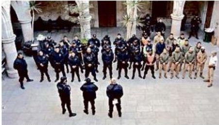
La Policía de San Juan de los Lagos fue intervenida por el Gobierno del Estado el pasado 24 de febrero.

Por otro lado, lamentó que la SSE habló del hallazgo de un sistema de video-