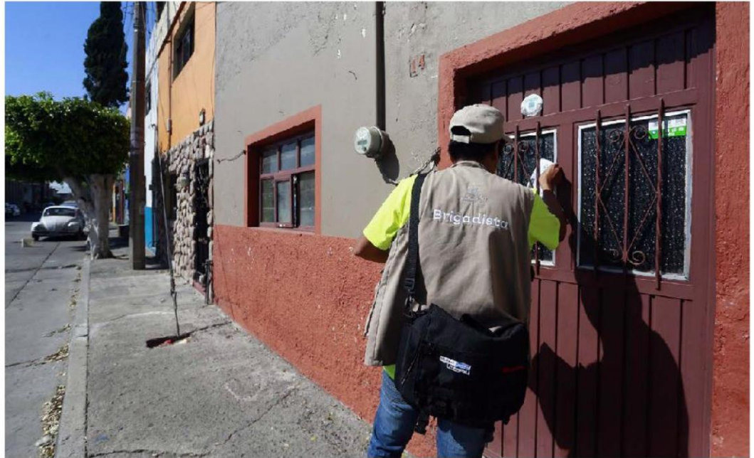
Actualmente, se cuenta con 866 vectores para la desinfección y limpieza de las áreas donde haya incidencia.

La entidad cuenta con 14 mil 500 obvitrapas, de las cuales el 70 por ciento se encuentran en los municipios del Área Metropolitana de Guadalajara (AMG) todas están en función y se leen una vez a la semana, informó el director de vigilancia e inteli-