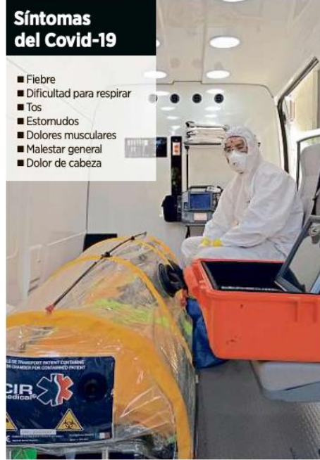
El Sistema de Atención Médica de Urgencias (SAMU) atenderá los casos sospechosos de Covid-19.