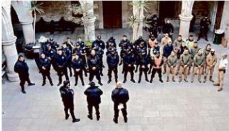
La Policía de San Juan de los Lagos fue intervenida por el Gobierno del Estado el pasado 24 de febrero.

vigilancia que no era oficial, e hizo ver como que era del Municipio.