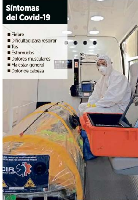
El Sistema de Atención Médica de Urgencias (SAMU) atenderá los casos sospechosos de Covid-19.