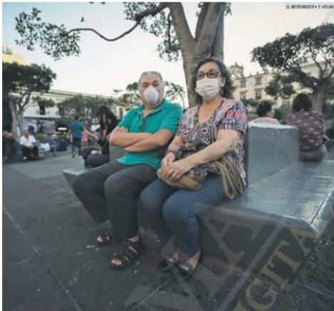
"MÁS VALE PREVENIR". La incidencia en casos de influenza y la alerta por los cuatro enfermos confirmados de coronavirus en México han provocado que los tapatíos comiencen a extremar precauciones y usen cubrebocas.

7 583303 834007 HoY 38 páginas | $ 10.00