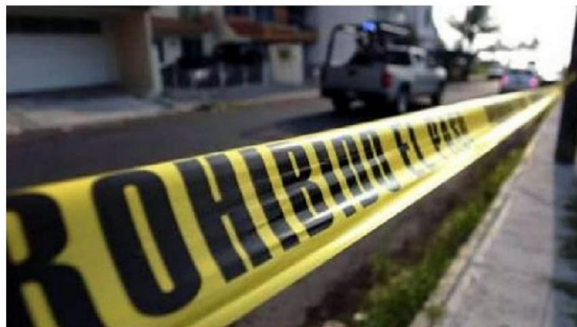
La chica se encontraba en Tamaulipas.

Una vez abierta la carpeta de investigación, personal de la Fis-