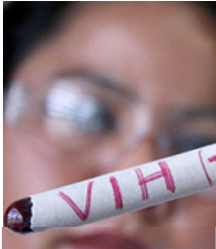
En México faltan por diagnosticar 32 mil 900.

Destacó que una persona infectada con VIH, gracias al tratamiento y los cuidados médicos, podría vivir hasta arriba de los setenta años, al igual que los demás mexi-