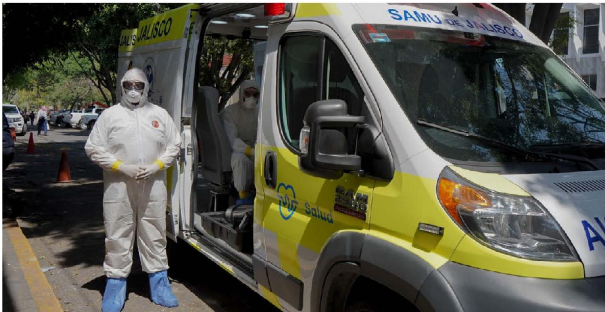
Equipo especializado, ante la advertencia de la llegada inminente del Covid19 a la entidad.