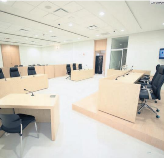
PROMETE AGILIDAD. El Nuevo Sistema de Justicia Penal requirió de 986 millones de pesos.