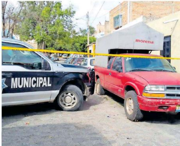
El ahora occiso presentaba una edad de 42 años.

manga corta en color oscuro, de compleción regular y tez morena clara, escapó tras consumado el crimen. Otra persona vio salir al causante corriendo del taller y escapó por la calle San Carlos.