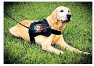
En canino estaba especializado en la búsqueda y localización de explosivos.