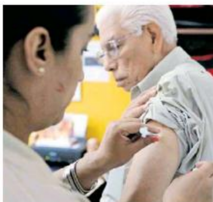
Llegarán a partir de la segunda quincena de octubre.

Los grupos de mayor prioridad para aplicar la vacuna contra influenza son embarazadas, menores de dos años, adul-