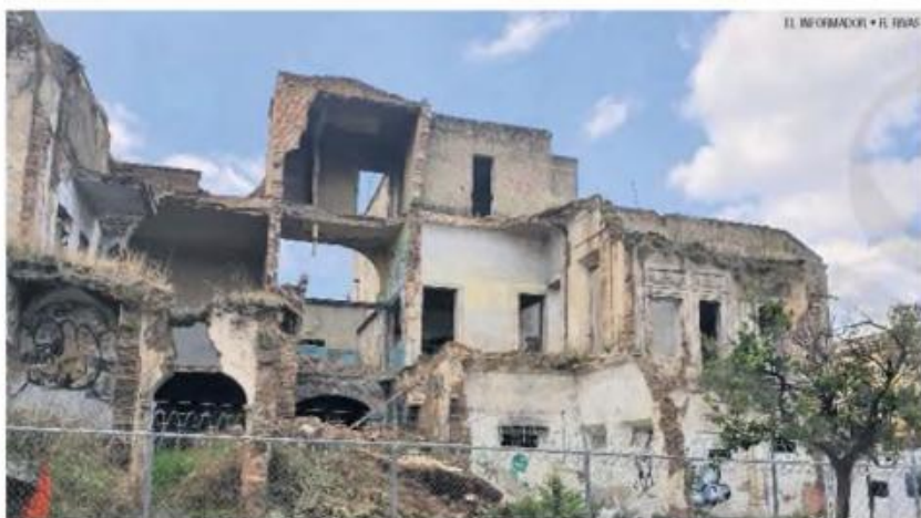
SEDE. El Congreso busca construir el inmueble en un predio que está en Pino Suárez y Reforma.

Quieren nuevo edificio; prefieren no entregar el de Juárez