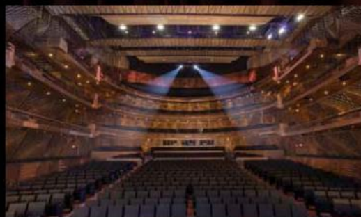
El pasado 1 de diciembre el Patronato de la Orquesta Filarmónica de Jalisco reconoció la trayectoria del tenor español.

ció que ya no se presentaría en Nueva York, señaló lo siguiente Plácido Domingo, según lo recogió el diario El País el 25 de septiembre pasado. "Estoy feliz de que, a la edad de 78 años, he podido cantar el maravilloso papel protagonista de Macbeth en el ensayo de vestuario, lo que considero mi última actuación en el escenario de la Met".