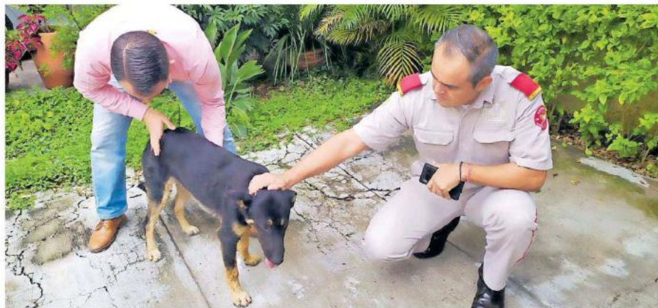
El perro resultó con quemaduras leves en su pelaje tras un incendio.