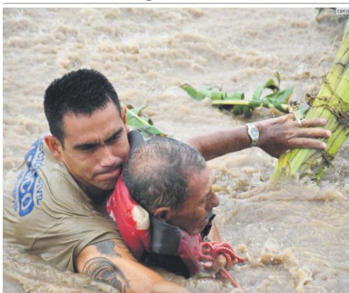
REACCIÓN. Los elementos de la Unidad Estatal de Protección Civil y Bomberos Jalisco (UEPCBJ) rescataron a seis personas que fueron arrastradas por el creciente del Río Marabasco, que se encuentra en la comunidad de El Rebase, en Chihuahán.