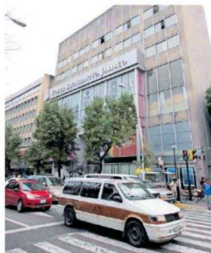
En suspenso el futuro de polémico edificio Juárez. AGAPITO ESPINOZA.

La construcción del nuevo edificio con una inversión cercana a los 60 millones de pesos recaerá en el Gobierno del Estado.