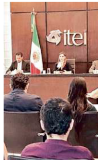
■ Para el próximo año, al ITEI se le están asignando 61.2 millones de pesos.

El ente que emitió el pronunciamiento está conformado por consejeros representantes de cúpulas empresariales, universidades y sociedad civil.