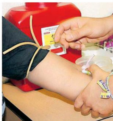
Son 39 colonias las afectadas por dengue.

Aunque no especificó en cuanto ha aumentado las incapacidades por la enfer-