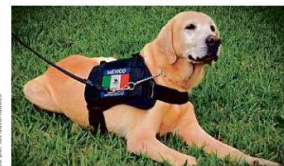
"Charger" será muy extraño en la Comisaría de Guadalajara, pues estuvo en la dependencia 12 años.

El evento se hace cada año aunque aún no se define donde se realizará en la próxima ocasión.