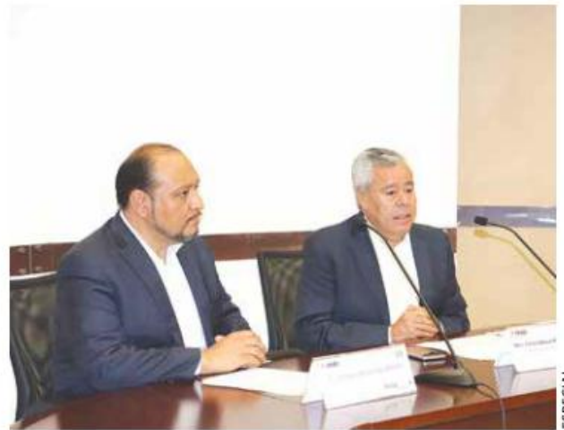
A CARGO. El acuerdo fue firmado por los titulares de las dos instituciones.