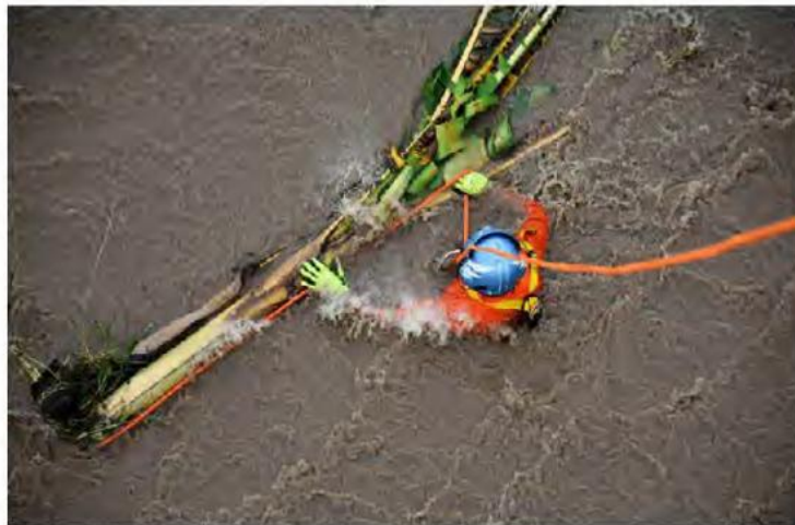
Se realizó el rescate de 29 personas en José María Morelos.

El helicóptero de la Secretaría de Seguridad Pública realizó el rescate de seis personas atrapadas en El Rebal; también se