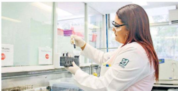
Hay dos decesos, y treinta casos por confirmar.

Actualmente Jalisco se mantiene en Aviso Epidemiológico por dengue emitido por el Comité Estatal de Vigilancia Epidemiológica (CEVE), sin embargo, diputados del Congreso de la Unión y del Congreso de Jalisco han solicitado la emisión de una Alerta ante aumento de personas enfermas, brotes, decesos y hospitales saturados desde julio.