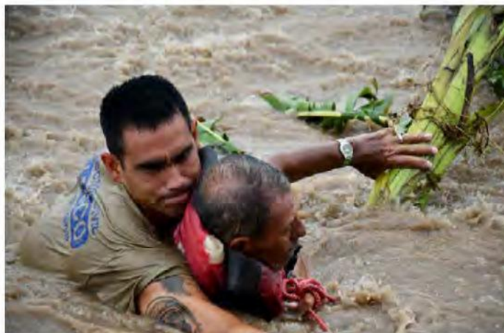
El helicóptero de la Secretaría de Seguridad Pública realizó el rescate de seis personas.