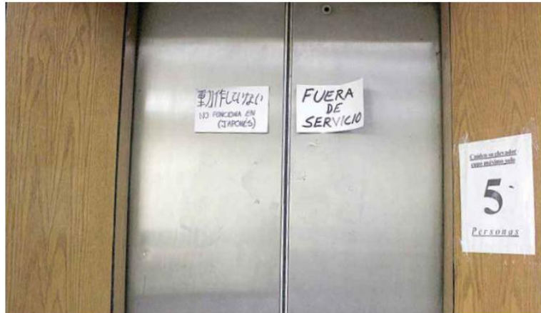
JUÁREZ 237. La compañía Hitra Elevadores y Escaleras se acercó al Congreso para plantear una solución a través del IJA para realizar todas las reparaciones y sustituciones de piezas.