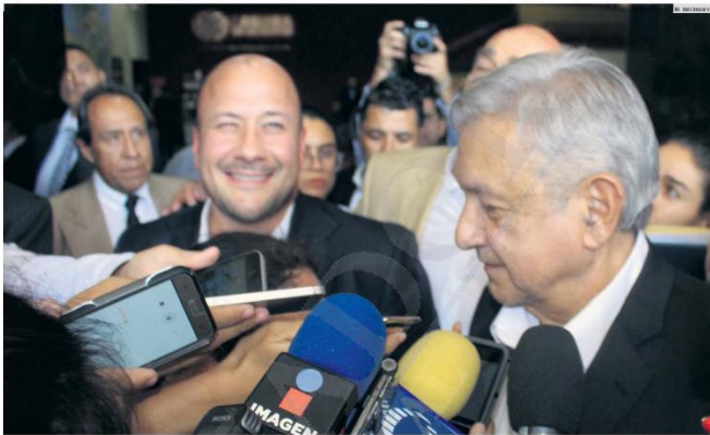
EXPECTATIVA. El Gobierno de Jalisco gestiona más recursos con el Gobierno federal y el Congreso para 2020. En la foto, la última visita de Andrés Manuel López Obrador a Jalisco para reunirse con Enrique Alfaro y empresarios.

Actualmente hay 23 mil trabajadores del Gobierno del Estado, así como los empleados de Salud y Educación, que sumando llegan a los 53 mil empleados. La nómina total del Gobierno equivale al 43% del presupuesto.