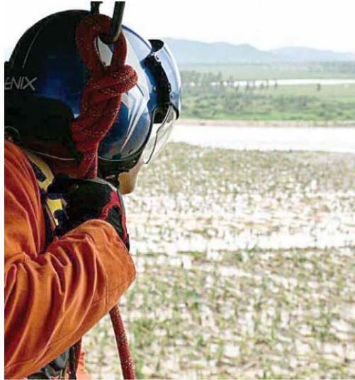
RIESGO. El fenómeno meteorológico provocó el desbordamiento de tres ríos.

Hasta las 14:30 horas de ayer, añadió el secretario, no se tenían reportes de salud de consideración entre los habitantes ni de personas desaparecidas.