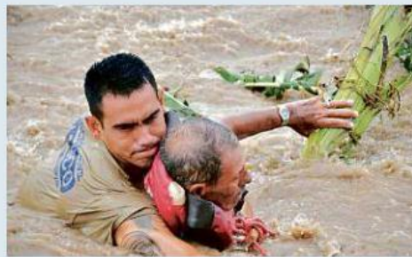
■ Cuatro personas y dos rescatistas fueron auxiliados por aire en Cihuatlán; en Tomatlán ascendieron a 29.