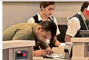
Personal de las aerolíneas documentó a pasajeros y equipaje con notas hechas a mano, ante la falta de energía.

'Pega' a indígenas reviro NACIONAL PÁG. 3