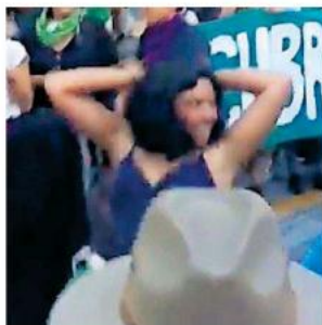
Esto sucedió en la marcha Pro-Vida del pasado sábado.

Como EL OCCIDENTAL lo dio a conocer el sábado por la tarde durante la marcha de los pañuelos verdes, mujeres marcharon por el Centro de la ciudad y durante su trayecto se encontraron con tres templos, uno fue grafitado, pero tanto la Catedral como el Sagrario -que están jun-