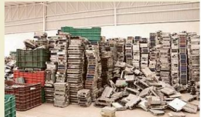
La mayoría de las computadoras de vehículos que la Fiscalía aseguró no han sido regresadas a sus dueños.

En total las autoridades aseguraron 13 mil 808 aparatos en el operativo que comenzó el 29 de mayo, en un local ubicado en la Calle Los Angeles 730, entre Anáhuac y Las Conchas,