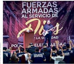
En el congreso de la Policía Celestial hubo bandas para acompañar las alabanzas.