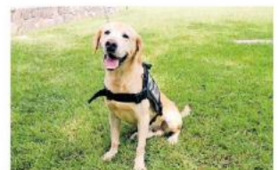
Siempre recordarán a Charger.

12 AÑOS TENÍA Charger; la Policía de Guadalajara recordó sus grandes momentos.