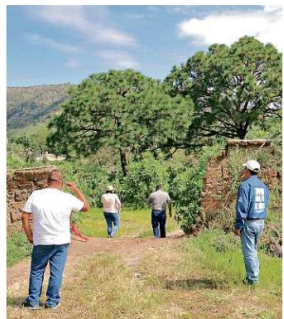
Las autoridades no han especificado cuántos restos humanos de la fosa de La Primavera faltan por procesar.

ra la Paz y el Desarrollo (Cepad), Familias Unidas por Nuestros Desaparecidos Jalisco (Funde), e incluso la UdeC, conminaron al Gobierno del Estado a hacer una autocrítica y a reconocer la crisis en el Estado.