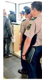
Ayer, hubo una audiencia más del caso Santa Lucía.

'Significaría el incumplimiento de ordenes militares dentro del ámbito castrense, que tengan como finalidad la defensa de la integridad territorial, la independencia de la República, la soberanía y la seguridad nacional', argumentó al negar, el pasado 25 de septiembre, otra suspen-