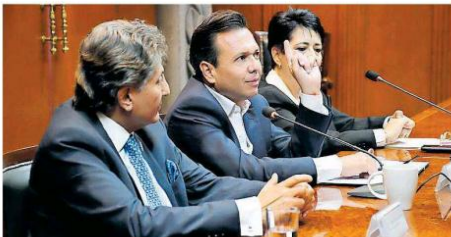
Pablo Lemus, alcalde de Zapopan.

El presidente Municipal, Pablo Lemus enfatizó la importancia de brindar certeza a los inversionistas que pudieran llegar a Zapopan mediante garantizar transparencia y rendición de cuentas y como resultado de ello, destacó que Zapopan se ha consolidado como el motor económico de Jalisco.