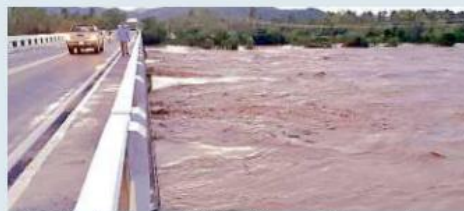
■ El Río Marabasco, que divide a Jalisco y Colima y está próximo a Cihuatlán, amaneció ayer al límite.