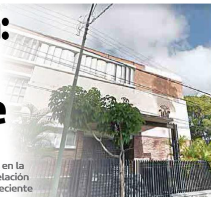
DÓNDE ESTÁ. El Colegio Cervantes Costa Rica se ubica en la colonia Ladrón de Guevara, en Guadalajara.

A mediados del mes pasado, ex alumnas y estudiantes dieron a conocer casos ocurridos en la institución marista; quienes coordinan la revelación de denuncias señalan que la situación no es reciente