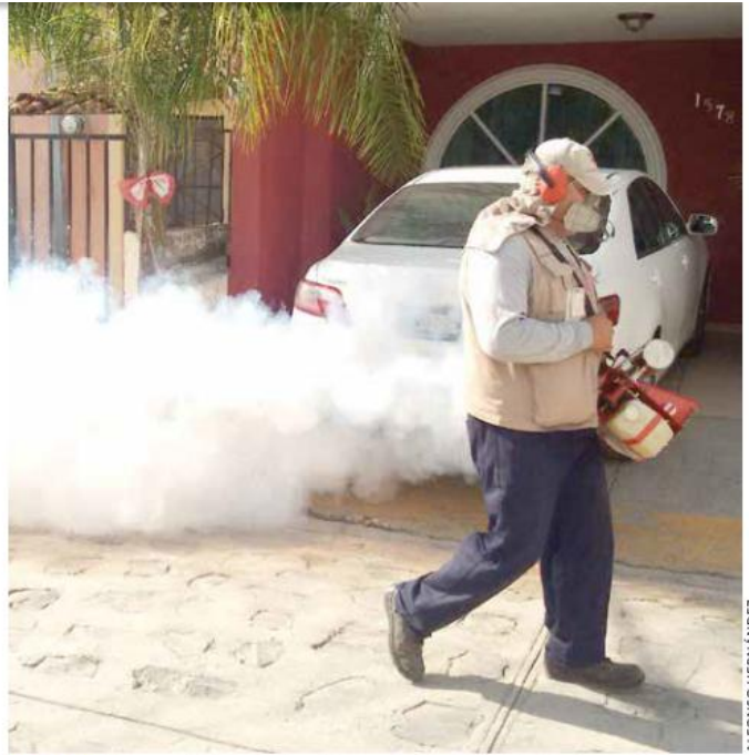
EN LA URBE. Los municipios con más enfermos de dengue son Guadalajara, Zapopan, Tlajomulco y Tlaquepaque.

La entidad suma 7 mil 622 enfermos en los que se validó la presencia de la infección y 20 muertes, según el último reporte de la Dirección de Epidemiología