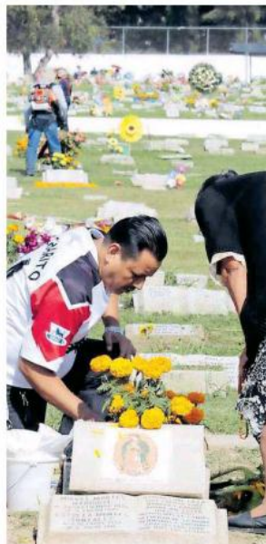
La gente ya se encuentra arreglando tumbas.

“Vamos a detectar personas en actitud inusual”