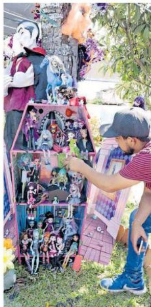
Casi un millón de personas se espera durante estos tres días.

“Las cámaras de videovigilancia las vamos a integrar, ya que tenemos 60 cámaras en las inmediaciones de los panteones, vamos a detectar personas en actitud inusual, ingresar con bebidas embriagantes u alguna