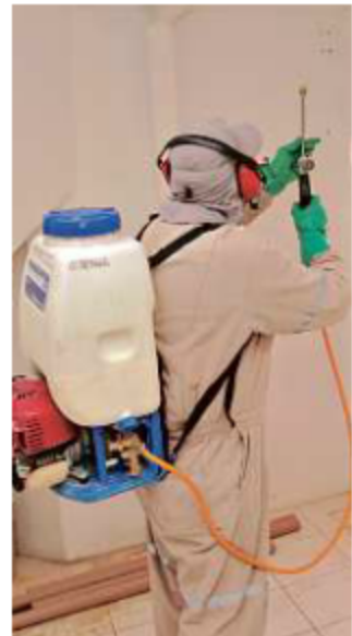
■ La SSJ esparció 6 mil sobres de producto caduco en 12 mil 402 casas.