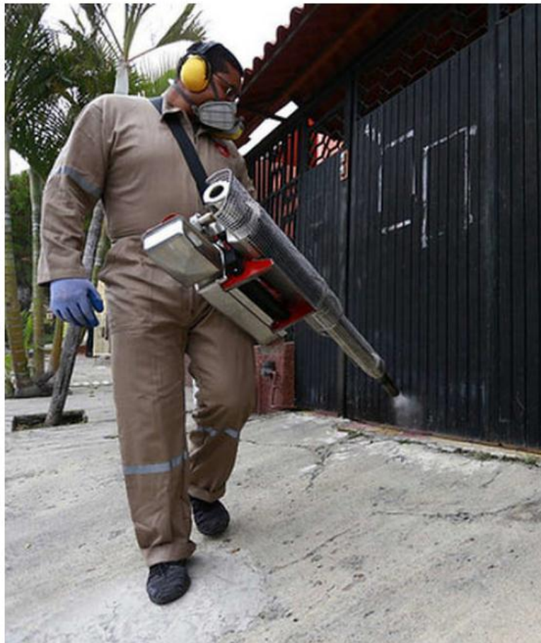
Continúa el operativo de fumigación y control. ESPECIAL

“Esto es una corresponsabilidad de todos, la corresponsabilidad nos debe de llevar a saber que las enfermedades como el dengue se previenen desde casa, debemos tener limpias todas nuestras viviendas y lo que hemos venido haciendo todas las instituciones de salud como es la vigilancia epidemiológica”, de acuerdo con el funcionario estatal.