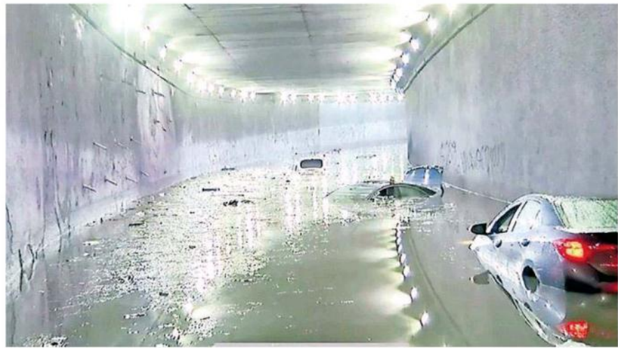
En el paso a desnivel de Colón al cruce Washington se inundó.