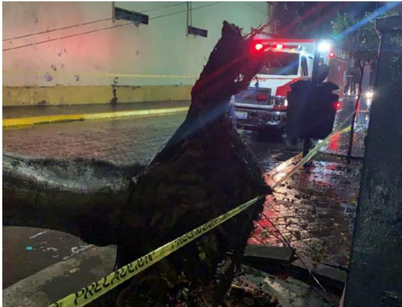
Hubo viento con rachas superiores a los 50 kilómetros.

De acuerdo con el reporte del Sistema Meteorológico Nacional (SMN), hubo rachas superiores a los 70 kilómetros por hora. La llu-