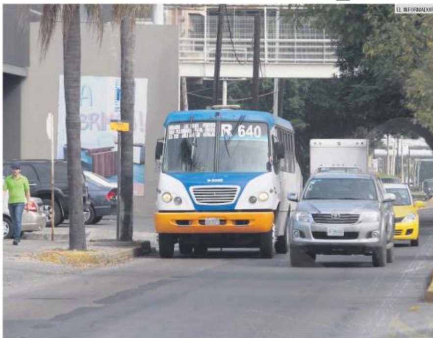
FIN DE LA GRACIA. La Ruta 640 no se sumó al modelo Mi Transporte, por lo que será retirada de las calles.

Otros 40 derroteros están en la etapa de fallo tras reunir los papeles para obtener su