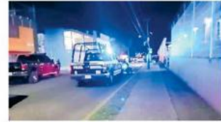
El ataque se dio en la avenida Niños Héroes.

Poco después llegaron los paramédicos de la Cruz Verde, quienes trasladaron al herido en estado grave puesto de socorros.