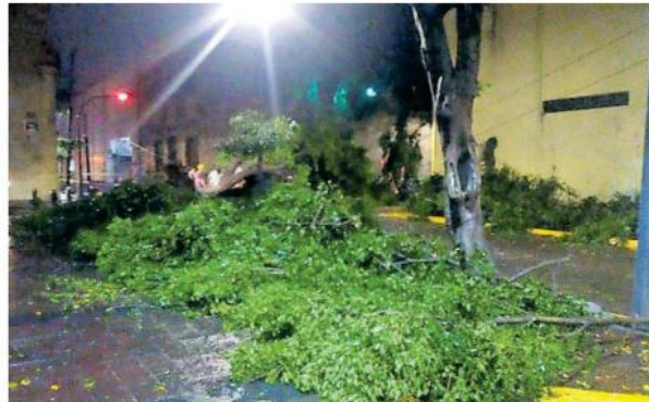
Protección Civil Zapopan reportó seis árboles caídos dos en Ciudad del Sol.