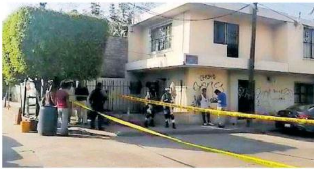
Testigos dijeron a las autoridades que tras ocurrido el hecho el afectado abordó su camioneta y se retiró.

En poco más de dos horas, un asaltante murió al recibir un impacto de bala y otro resultó herido.