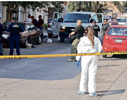
■ Ayer dos personas fueron asesinadas a tiros dentro de un domicilio en el cruce de Juan José Ríos y Avenida Patria, en la Colonia Patria Nueva, en el Municipio de Guadalajara.

Tlaquepaque y Zapopan registraron una baja del número de víctimas en el mes que terminó en comparación con septiembre. En Guadala-