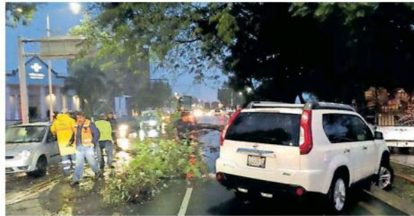
El fuerte viento tumbó árboles en varios puntos de la ciudad.

Bomberos de Guadalajara informó sobre 10 árboles, además de que fue cerrado el paso a desnivel de Washington y Colón