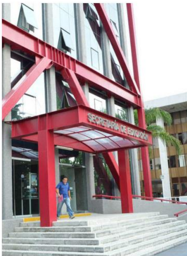
La SEJ recibirá más de 11 mil millones de pesos. ESPECIAL

En la Secretaría de Asistencia Social habrá un aumento del 24 por ciento, también subirá el recurso para Salud, Cultura y en la Secretaría de Igualdad Sustantiva entre Mujeres y Hombres, en esta última el aumento será del 36 por ciento.