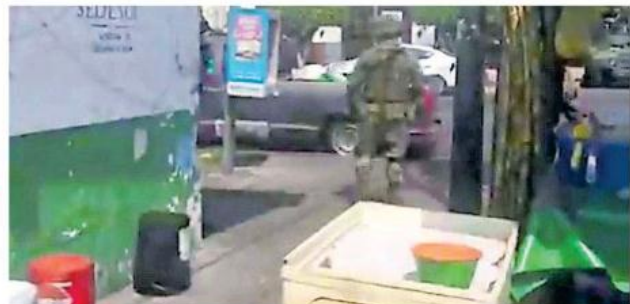
Los policías y paramédicos encontraron ya sin vida a una mujer y a un hombre.

También localizaron heridos a un hombre y a una mujer. El primero sentado en un sillón en color gris, y la mujer recostada so-