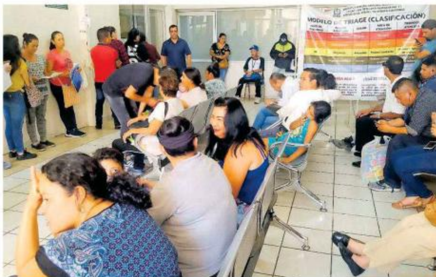
Ya suman más de siete mil casos confirmados de dengue.

El informe semanal número 43 del Sistema de Notificación de Casos de la Secretaría de Salud Federal, informa que el número de personas confirmadas por el virus transmitido por vector para la semana 43 son 660 nuevos casos para su-