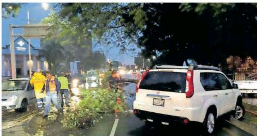
El fuerte viento tumbó árboles en varios puntos de la ciudad.

Bomberos de Guadalajara informó sobre 10 árboles, además de que fue cerrado el paso a desnivel de Washington y Colón