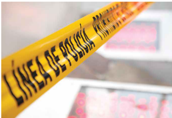
MÁS VIOLENCIA. Los homicidios han aumentado en las últimas dos décadas en el país.

El cadáver del sujeto logró ser recuperado tras dos horas y 47 minutos de trabajo, en punto de las 12:20 horas.