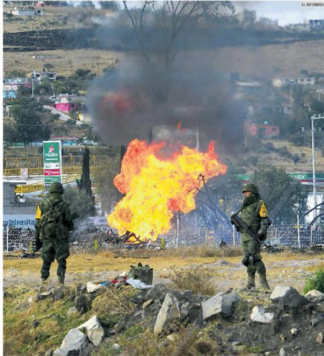
PLAN. Las tomas clandestinas disminuyeron en Jalisco en este año, ante el despliegue de más militares en el poliducto.

La Subdirección de Salvaguardia Estratégica detalla que el año pasado localizaron mil 549 tomas en Jalisco, pero los trabajadores no se dieron abasto para cerrar las perforaciones, por lo que todavía en 2019 atienden fugas de ese periodo. Además, de acuerdo con la Ley Federal para Prevenir y Sancionar los Delitos Cometidos en Materia de Hidrocarburos, si un arrendatario, propietario o poseedor de algún predio donde exista una derivación clandestina tiene conocimiento de esta situación y no la denuncia a las autoridades correspondientes, recibirá de seis a ocho años de prisión y se le aplicará una multa de seis mil a ocho mil veces el valor de la Unidad de Medida y Actualización.