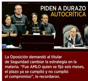
PIDEN A DURAZO AUTOCRÍTICA

La Oposición demandó al titular de Seguridad cambiar la estrategia en la materia. "Fue AMLO quien se fijó seis meses, el plazo ya se cumplió y no cumplió el compromiso", le recordaron.