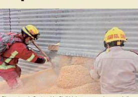
■ Elementos de Protección Civil hicieron un agujero en el silo para vaciar el maíz y poder sacar el cuerpo del trabajador.

El accidente sucedió cerca de las 9:00 horas de ayer en una empresa que se encuentra en la Calle Cafías, entre Ramal del Ferrocarril y Trigo, en la Colonia