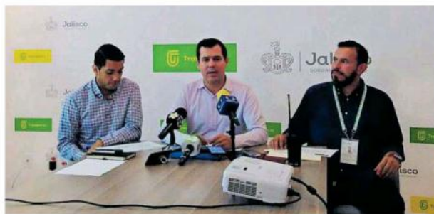
Anunciaron que ya van 50 rutas transformadas.

¿A partir de mañana (viernes) qué va a suceder? Operativos en la calle para recoger unidades. Si estas 15 no se acercan en estos días, a partir de mañana se van a recoger unidades y no las vamos a regresar hasta que ellos se conformen como empresa. Si no se acercan y no se conforman con los reglamentos y requisitos marcados, entonces se estará llevando un procedimiento de convocatoria y ofrecimiento, para que alguien más pida la ruta y la empiece a operar".