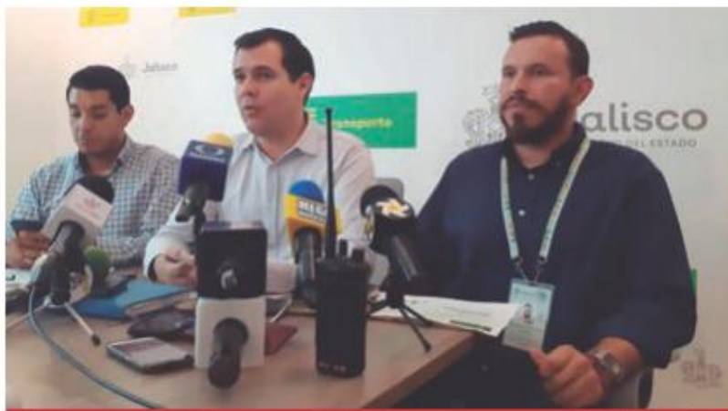
Todos los representantes de las rutas fueron notificados.

"Se acabó el proceso voluntario, lo hicimos con todos. No hay una sola ruta, no hay un solo representante de ruta que no haya tenido la invitación y el acercamiento y el apoyo de la autoridad para que 'migren' al nuevo modelo. Es justo que valga la ley", finalizó.