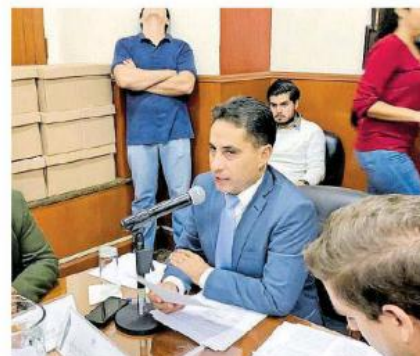
Esto para que paguen más, las propiedades con alto valor en el mercado.

Lo que significa que en el impuesto predial estos 4 municipios están proponiendo que aquellas propiedades que tengan un valor más alto paguen un impuesto predial más alto que los que tienen propiedades de menor valor.