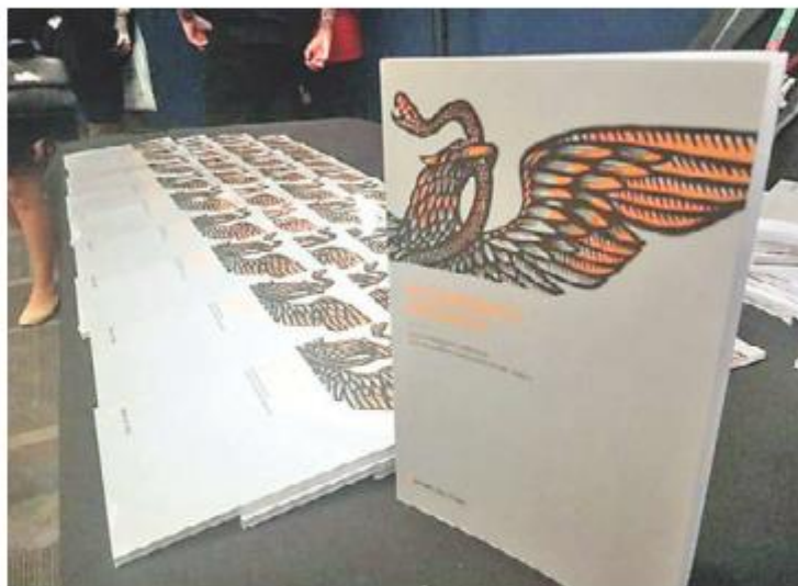
El texto fue creado en cinco meses.