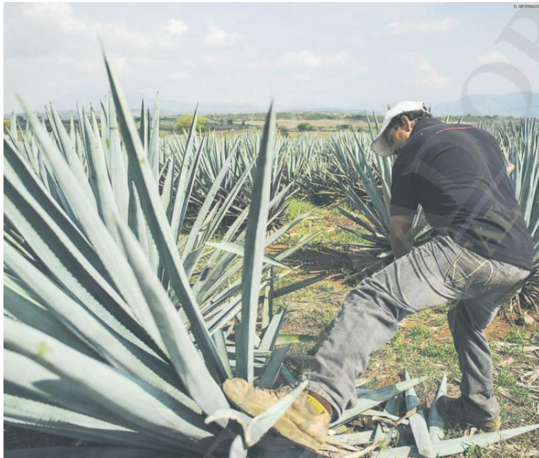
AUMENTO. El valor de la producción comercial, tanto en agricultura, ganadería, pesca y acuicultura, creció de 84 mil 794 millones de pesos en 2012 a 141 mil 627 millones en 2017.

● El sexenio de Aristóteles Sandoval cierra con cifras récord en el periodo 2012-2018