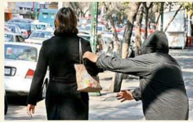
Las autoridades piden extremar precauciones para evitar ser víctima de robo.

Si usted es víctima de un robo, no ponga resistencia. Trate de memorizar la mayoría de características