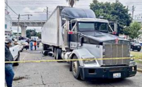
La agente vial murió, mientras que su esposo quedó herido.

La Fiscalía se encargó de analizar cómo sucedió el accidente, y aunque no informó el resultado de las investigaciones, aclaró que el caso puede ser resuelto con métodos alternos y no con cárcel.