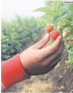
CRECIMIENTO. El negocio de las berries reporta una mayor exportación que el tequila.

Se realizan alianzas con la Universidad de Guadalajara (UdG), especialmente con el Centro Universitario de Ciencias Biológicas y Agropecuarias (CUCBA), así como la Universidad de Chapingo. Cada año se trae una parte importante de jóvenes que concluyen sus estudios para incorporarse a un programa de trabajo, que ha dado resultados.