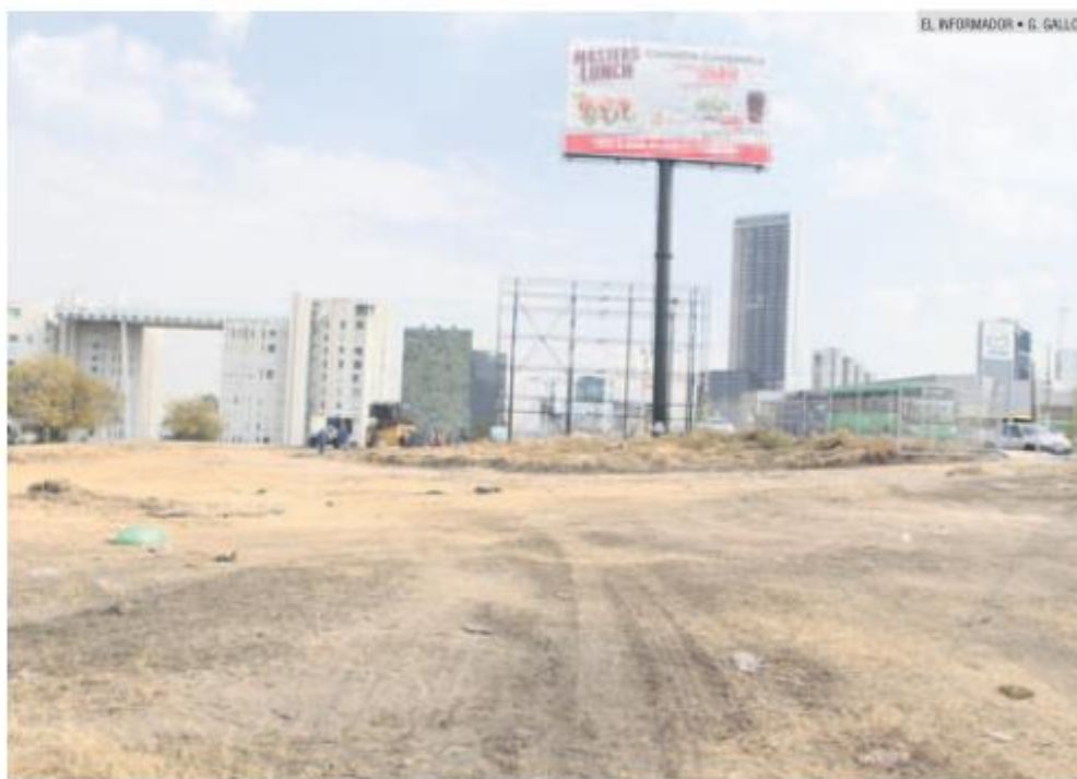
EL INFORMADOR • G. GALLO

"Confirmó la resolución del Juez de Distrito en la que se resuelve que las escrituras que presentaban los particulares provienen de un lugar distinto