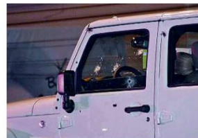
La mujer víctima a tiros conducía una Jeep Wrangler en la que iba un hombre que quedó herido.

Su esposo dijo que se cayó de la cama en la noche y que la volvió a acostar, pero cuando amaneció ayer ya estaba muerta.