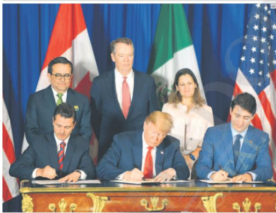
NUOVA ETAPA. Peña Nieto destacó que tras la firma del Tratado comercial México, Estados Unidos y Canadá, que se concretó en Argentina, las tres naciones están listas para iniciar una nueva etapa, pues se moderniza el Tratado de Libre Comercio de América del Norte.

10% En campañas de línea y especiales Tel. 3619 0321 LA GRABIA CÍRCULO 33 3576 8441