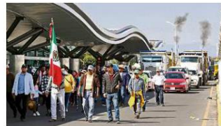
■ A ejidatarios de El Zapote se sumó un grupo de transportistas de carga, lo que saturó las vialidades del Aeropuerto.

Fuera de México, frente a Donald Trump, el Presidente Enrique Peña Nieto impuso la condecoración Águila Azteca al asesor y yerno del Mandatario estadounidense, Jared Kushner. NACIONAL PÁG. 2