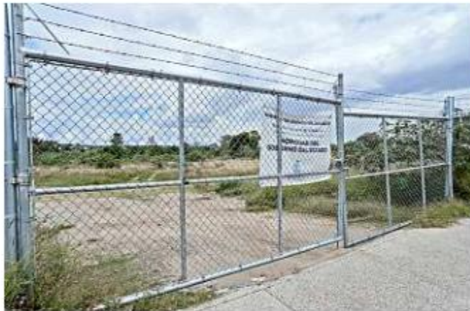
El predio en disputa se mantiene en posesión del Estado.

Según se resolvió conforme los peritajes y escrituras presentadas, la propiedad del quejoso –en lo que era el Rancho El Gorupo– no se puede identificar y consiste en una invasión de los terre-