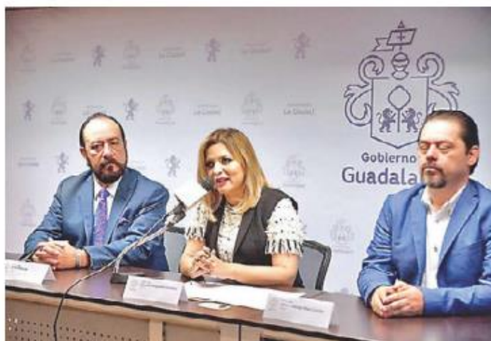
Pidió licencia como regidora. ESPECIAL