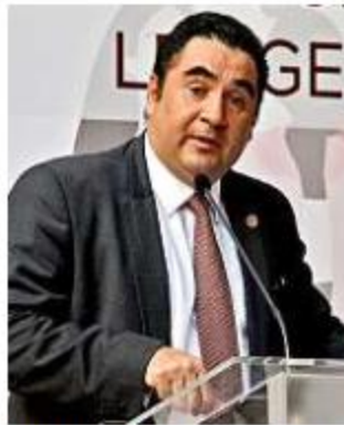
■ Ricardo Suro Esteves, titular del Poder Judicial.

El Presidente Ricardo Suro Esteves señaló que corresponde al Legislativo continuar con los trabajos de cara a la implementación de las nuevas disposiciones, como la aplicación de controles de confianza a jueces y Magistrados.