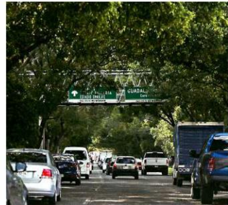
En otros puntos de la avenida, las indicaciones están cubiertas por maleza, lo que complica su lectura en movimiento.

Justo sobre el paso elevado de 8 de Julio hay un señalamiento azul que anuncia hacia dónde está el Tec-