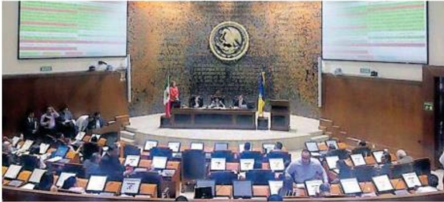
El Congreso evitó que los ediles fueran sancionados.