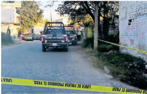
En otro hecho fue localizado el cuerpo de una persona.

Cuando los paramédicos llegaron, Pablo César, de 43 años, quien era elemento activo del grupo motorizado Gamas, ya no tenía signos vitales, presentaba al menos 13 impactos de proyectil de arma de fuego.