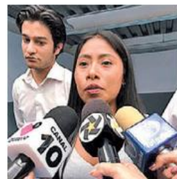
Anuncia beca. EMG

Yalitza no ve apoyo social suficiente a las mujeres