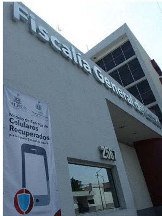
La dependencia ya fue notificada. ESPECIAL