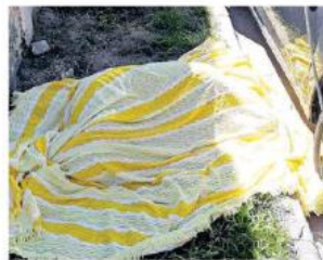
Sujetos armados asesinaron a un sujeto en el interior de un taller.

Poco después llegaron los paramédicos, quienes confirmaron el deceso del hombre y solicitaron la presencia del per-