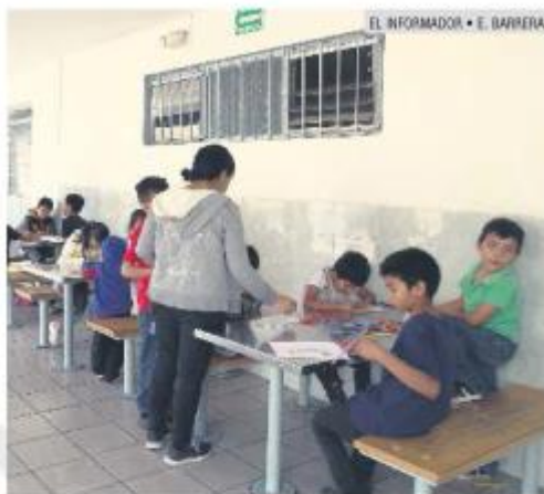
ASISTENCIA. Instalaciones de "El Oasis de la Niñez".