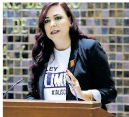
Con esto se sancionaría a quien comparta material digital sin permiso. ROSARIO BAREÑO

La Fiscalía y la Secretaría de Seguridad deberán crear direcciones o unidades especializadas para la investigación de los delitos contra las mujeres mediante el uso de las tecnologías de la información y la comunicación. Mientras que la SISEMH, la SEI, la Universidad de Gua-