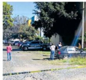
En el sitio las autoridades hallaron sin vida a un hombre de 45 años y una mujer.

Por los indicios encontrados en el sitio, agentes de la Fiscalía que llegaron al sitio para iniciar las investigaciones bajo el