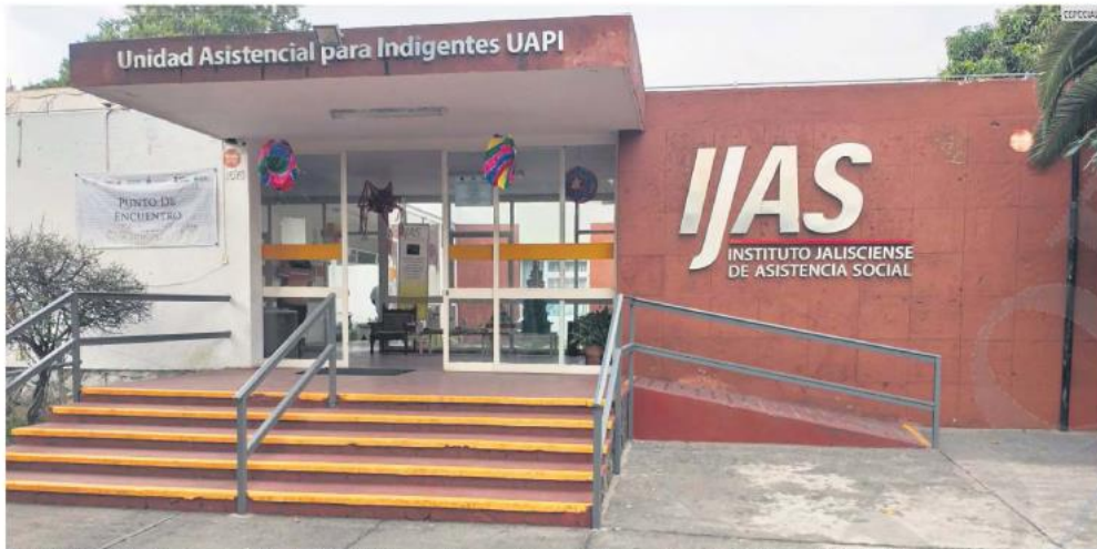
SE FUE. El Instituto Jalisciense de Asistencia Social (IJAS) fue uno de los organismos que desapareció cuando inició la administración de Enrique Alfaro.

El IJAS, el Instituto Jalisciense de las Mujeres y el Cesjal, entre los organismos desaparecidos