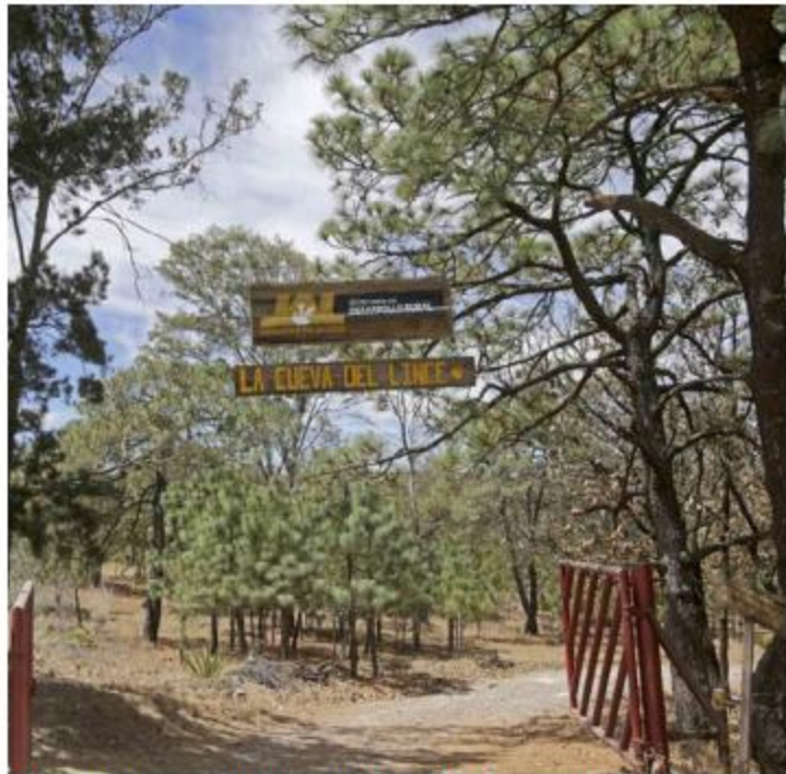
El alcalde resaltó la importancia del trabajo conjunto.

“Así como logramos vencer, de momento, la lucha en esta defensa del bosque, nos va a faltar mucho por hacer y la solidaridad de los ciudadanos, la solidaridad de estas organizaciones de la sociedad civil son fundamentales para que sigamos ganando esta lucha, por eso hoy hago un llamado para que los ciudadanos de esta zona de la ciudad también pongamos en la