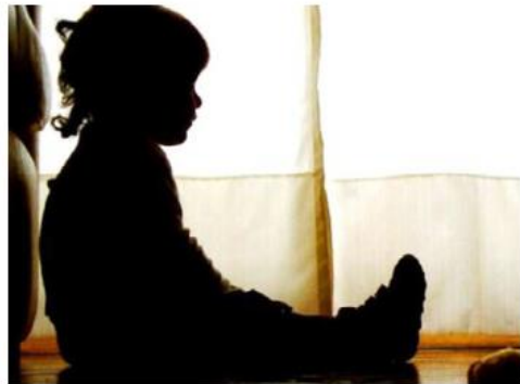
El primer caso se registró el 19 de noviembre.

El agente del Ministerio Público Federal de la Fiscalía General de la República (FGR) adscrito al municipio, abrió la carpeta después de que la Dirección de la Policía Vial recibiera un reporte en el que se señalaba que un automovilista había sufrido un accidente culminando con el derribo de los cables. Las autoridades aseguraron el automotor y lo pusieron a disposición del representante público federal, quien solicitará la resolución conforme a derecho corresponda. ■