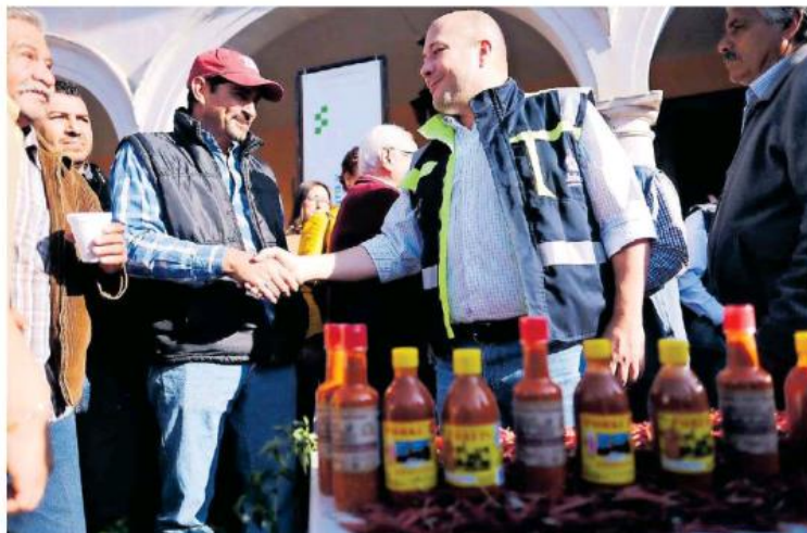
Este anuncio se dio en una gira de trabajo encabezada por el gobernador Enrique Alfaro Ramírez.

El titular de la Secretaría de Agricultura y Desarrollo Rural estatal (Sader-Jalisco), Al-