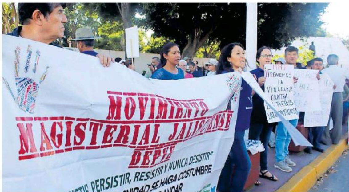
Manifestación en apoyo al Presidente.