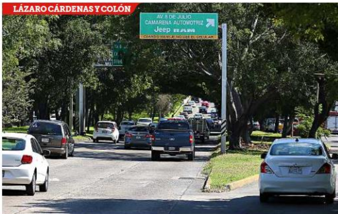
La salida que marca el letrero no corresponde a la intersección de la vialidad y tiene anuncio.

Sin embargo, la avenida, de la Central Nueva a Periférico, está plagada de publicidad -hoteles, renta de carros, universidades, restaurantes y otros- disfrazada de señalamientos informativos y en los casos más burdos tie-