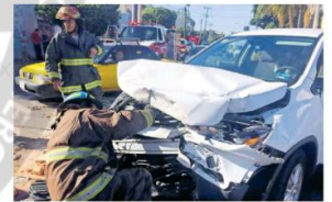
El impacto fue entre un camión de carga y un vehículo.

Debido al siniestro, hubo derrame de líquidos sólidos de los automotores en una área de seis por seis metros y de uno por uno de aceite.