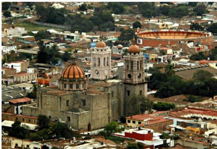
Oficiaba en el municipio de Autlán de Navarro.