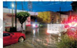
Ya con esto suman 16 personas fallecidas por este temporal. AURELIO MAGANA

La Policía vial reportó, al menos, ocho cierres viales en avenidas principales debido a inundaciones que oscilaron desde los 50 centímetros hasta 1.30 metros. Algunos de los cierres fueron Lázaro Cárdenas a la altura del Deán, con 50 centímetros; Lázaro Cárdenas y Mariano Otero (70 centímetros) en el carril lateral de oriente a poniente; en Plaza del Sol 1.30 metros de nivel; López Mateos y Moctezuma, un