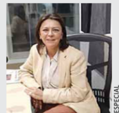
ACCIÓN. La magistrada adelanta que presentará un amparo contra la reforma.

LO ESCUCHASTE EN INFORMATIVO NTR SONIA SERRANO 820 AM 1010 AM LUNES A VIERNES