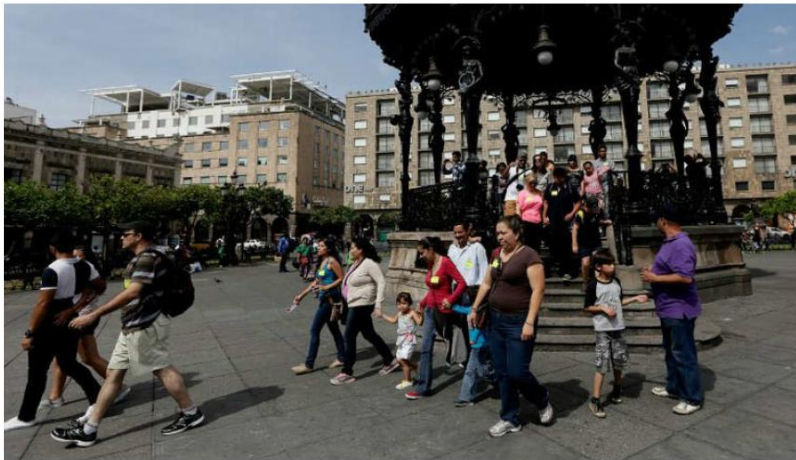
Hay varios factores de ruido en la zona. ESPECIAL

“Sabemos que el ruido tiene diferentes fuentes, tan es así que sabemos que las fuentes fijas como el ruido recreativo tiene que ver también con establecimientos como restaurantes y bares, entonces, la intención es también puntualizar algunos aspectos en el que comprometamos al empresario para que no nada más espere a que le llegue la multa y la sanción, sino que ellos tienen que avanzar en una especie de acondicionamientos de sus instalaciones para que ellos formen parte de esta acción colectiva. Estamos convencidos que no nada más es con la ley y con la sanción, sino también con acciones que tengan que ver con evitar estos ruidos se propaguen al exterior del establecimiento y con esto están per-