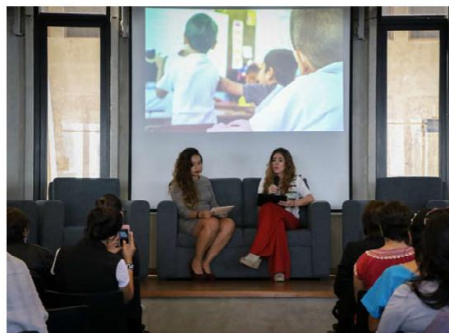
Realizan Foro “Conversa”.

De los nacimientos en 2018 fueron de madres de entre 10 y 19 años.