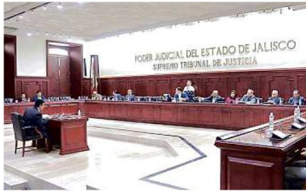
■ En la sesión de ayer, los Magistrados se desistieron de ir por la controversia constitucional contra la reforma al Judicial.

Los 18 Magistrados presentes avalaron la moción, argumentando que la defensa jurídica ya no era necesaria: no existe una invasión de poderes en la evaluación y