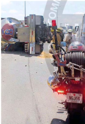
Los hechos sobre avenida Vallarta; no hubo pérdidas que lamentar.

"Tenemos un derrame de aceite del motor, el cual ya se cubrió, una área de