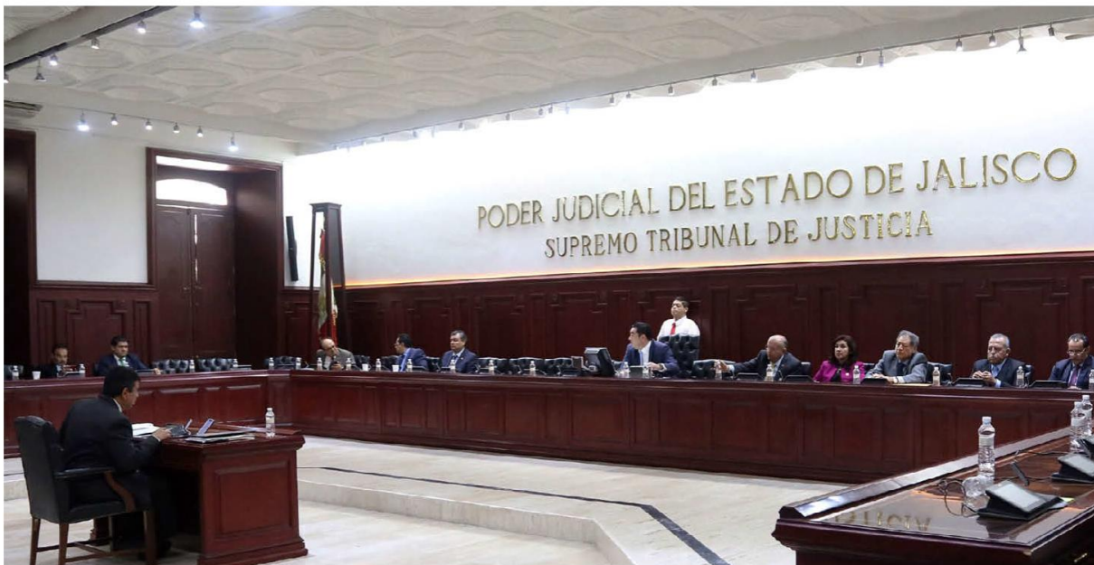
Hubo magistrados que no acudieron a la sesión en señal de protesta. ESPECIAL