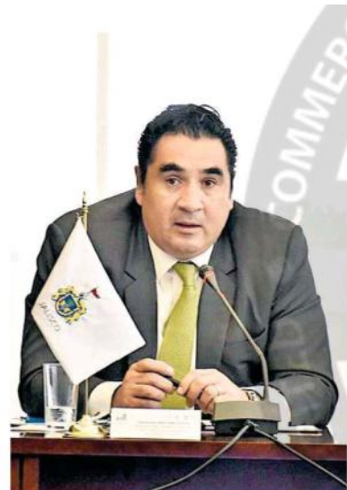
Magistrado Ricardo Suro Esteves.

Suro Esteves, apuntó que no se debe temer a los exámenes de con-