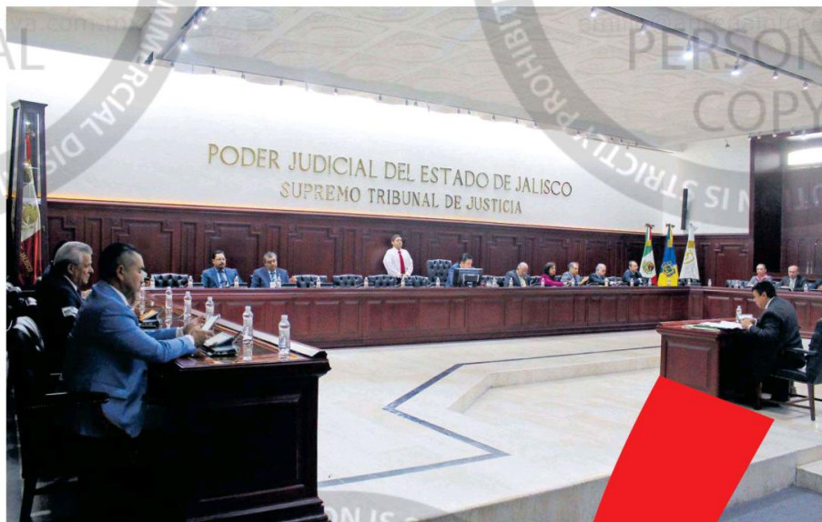
Faltaron nueve magistrados, aun así se llevó a cabo la sesión.