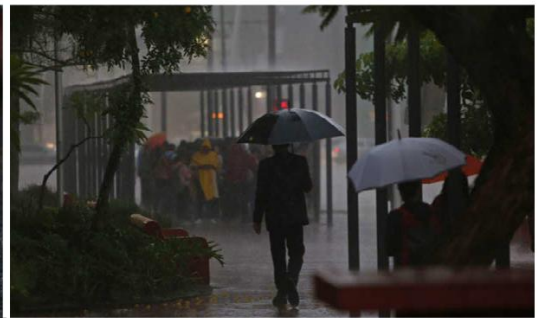
La circulación se complicó por los encharcamientos.

En los municipios de Zapopan y GDL se registraron serias inundaciones