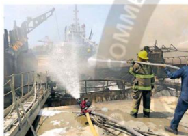
Al parecer todo comenzó cuando realizaban trabajos de soldadura.

El buque atunero se encontraba en el muelle de Marindustrias de Grupomar, al interior del puerto, cuando comenzó a ser consumido por el fuego. Al reportarse ese