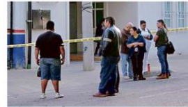
Muchas personas salieron a ver qué había ocurrido.

"Previo a la creación de la Policía Metropolitana se tuvo que haber cuestionado, analizado, estudiado el tema del presupuesto para sostener a la Policía Metropolitana. "No le midieron los Municipios, pero yo creo que deben hacer un esfuerzo (en inversión de recursos) para ponderar principalmente al equipamiento de la Policía, la capacitación", expuso el especialista.