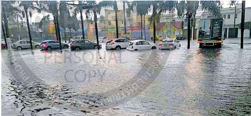
Varios vehículos quedaron varados por la tormenta de este jueves.