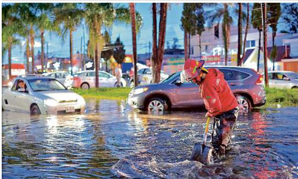
Familia de la Cruz

■ El nivel del agua llegó a las rodillas en quienes transitaban por Penitenciaría y Libertad.