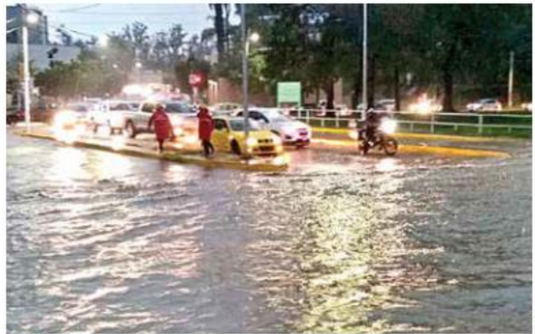
CAOS. La tormenta también generó desbordamientos en el canal de Patria.

Con la víctima de ayer, el temporal 2019 ha dejado 16 personas fallecidas.