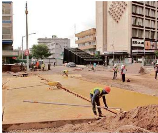
Con el dinero de la Federación terminarían pendientes de la Línea 3, pero no alcanzaría para rehabilitar entornos urbanos.

Detalló que, de momento, la SCT trabaja en la reparación de fallas de la Línea 3,