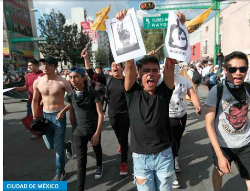
CIUDAD DE MÉXICO