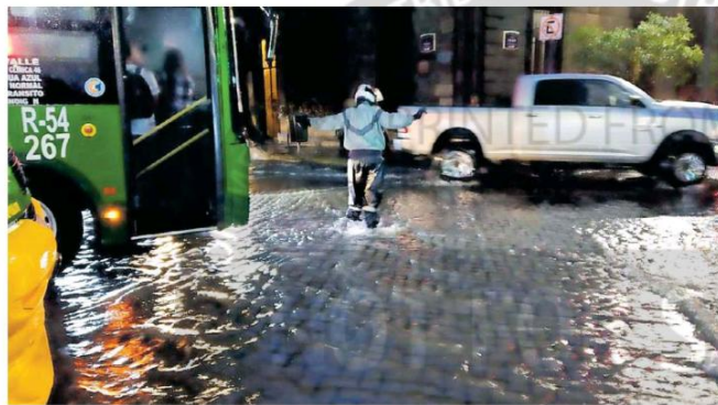
El Centro de la ciudad se volvió todo un caos tras la fuerte lluvia. AGAPITO ESPINOZA

Policías de Guadalajara apoyaron a usuarios que se quedaron varados en diferentes puntos de la ciudad.