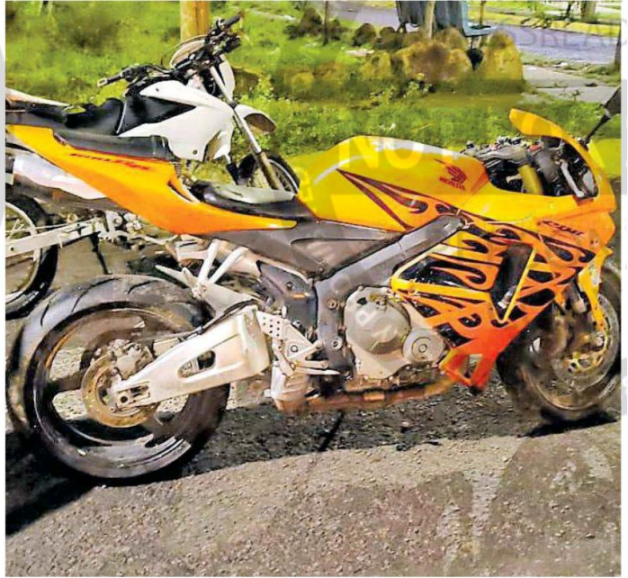
Las motos fueron aseguradas por la Policía de Guadalajara.

Cuando los elementos se presentaron, empleados dijeron que al parecer los hombres ya habrían escapado, por lo que municipales instauraron un dispositivo de búsqueda y en San Ignacio y Rafael Cabrera observaron a cuatro sujetos a bordo de tres motos, sin embargo dos fueron asegurados,