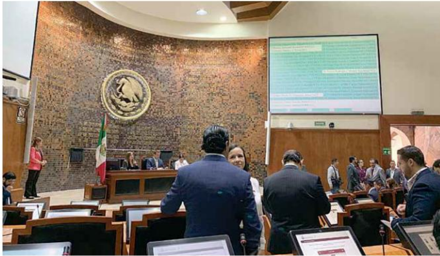
EN EL CONGRESO. En un solo día se cubrieron los últimos pasos para que Jalisco tenga la opción de integrar un Constituyente.