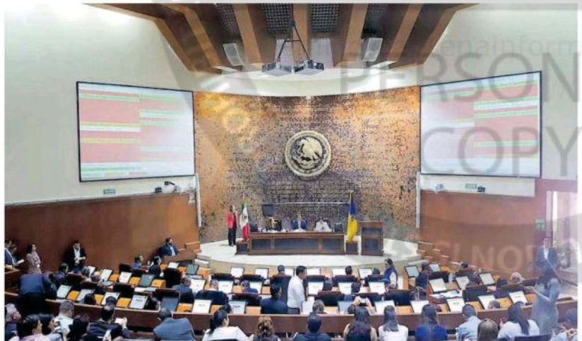
La aprobación cuenta con aval de 107 municipios.

Por lo que ahora Jalisco cuenta con esta herramienta del Constituyente, que puede ser convocada por