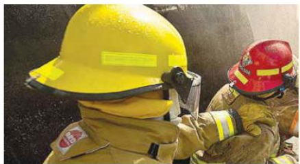
ATENCIÓN. La Unidad Municipal de Protección Civil y Bomberos de Zapopan acudió para atender el derrame de aceite.

Debido al impacto, también se sufrió un derrame del contenedor, el cual se extendió por aproximadamente por un metro.