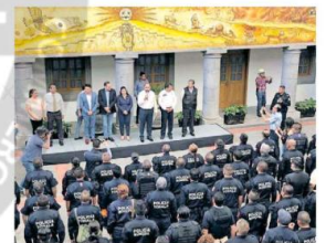
Los uniformados ahora ganarán 18 mil 482 pesos al mes.