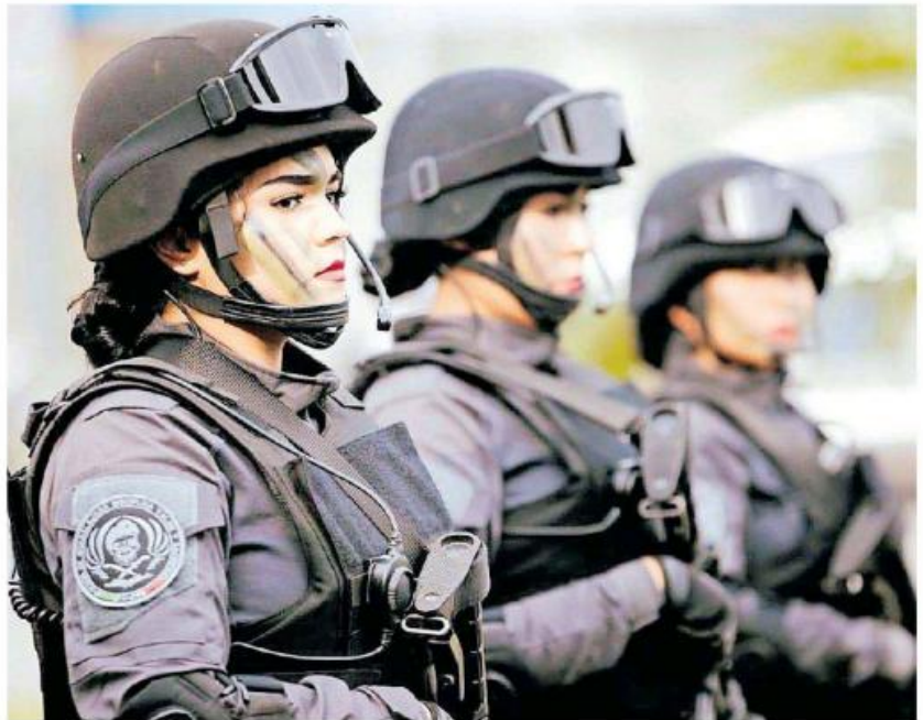
La Comisaría de Guadalajara elegirá a los mejores elementos.

La selección de este personal aún no se determina para cuando iniciar porque primero se tiene pendientes cómo terminar el reglamento, el cual debe estar listo en diciembre; además la terminación del órgano de mando y control de la Policía Metropolitana y después se daría paso a esta situación de búsqueda de elementos para el grupo especial, que sería los primeros tres meses del próximo año incluiría la capacitación, pero no se va a requerir a más elementos de los municipios ya que con los que aportaron saldría este grupo especial "que debe