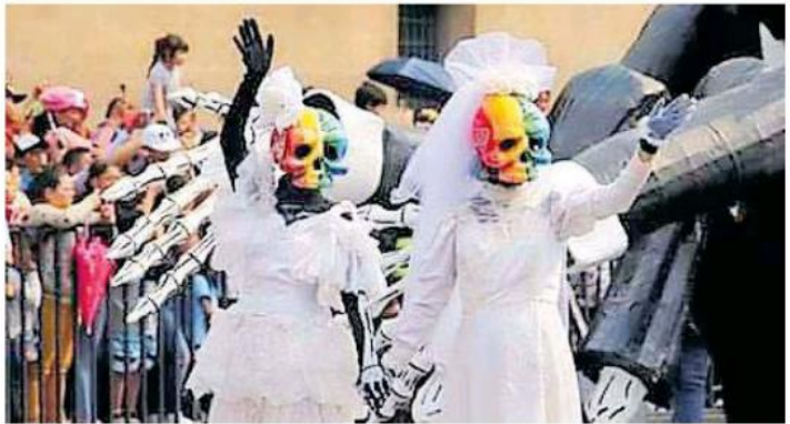
A pesar de tanta lucha, los derechos de la diversidad sexual no están garantizados.

No era una bebé, ni dos sino tres y nacieron prematuras en el Centro Nacional