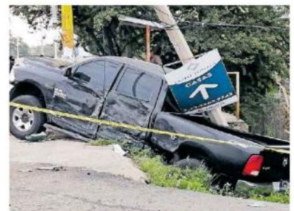
De manera extraoficial se sabe que la unidad de policía estatal se habría pasado el semáforo.

En tanto que el conductor del urbano fue detenido por elementos de la Policía Vial a dos cuadras del lugar del accidente,