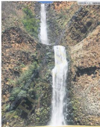
TAPALPA. Salto del Nogal.

De entre los nombres autóctonos de poblaciones relacionadas con el agua, se encuentra una amplia diversidad de localidades y municipios: Autlán, atl, olli —camino de agua, junto al acueducto—; Atenquique, atl —agua, anegada, llena de agua—; Ejutla, —donde brota el agua—; Ameca, —en el río—; Atoyac, atoyatl —río, en el río—; Ahualulco, atl, yahualli —rincón coronado de agua— lugar abundante en agua —en la curva del río—; Atengo, atl, tentli —en la orilla del agua—; Atemajac, atl, tetl —piedra que hace bifurcar al agua, donde la piedra bifurca al río—; Chapala, chapanqui —lugar empapado, lugar muy mojado—; Atequiza, atl, tequi —lugar donde se corta el agua—; Zoquipan, zoquitl —lodo, en el lodo—; Mixtlán, mixtli —nube, junto a las nubes—; Ajijic, atl, xiximi —lugar donde se despa-