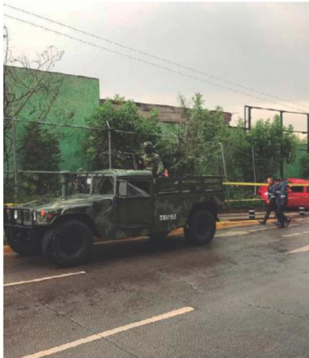
Elementos del Ejército acudieron al sitio. E. M. GUTIÉRREZ

Mientras, los asaltantes ingresaron al estacionamiento de una