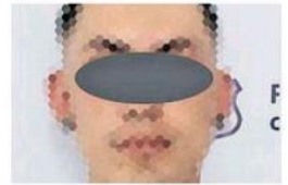
El crimen ocurrió el 2 de julio de este año.

Las estadísticas del Secretariado Ejecutivo del Sistema Nacional de Seguridad Pública indican que de enero a septiembre solo 37 asesinatos fueron tipificados como feminicidio.