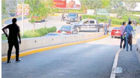
El centro comercial de Andares lució repleto de policías, sin embargo, los rufianes lograron escapar.

Metros adelante, los asaltantes retornaron sobre Acueducto hacia Patria. En el retorno, los que iban en el march chocaron contra una malla ciclónica y lo de-