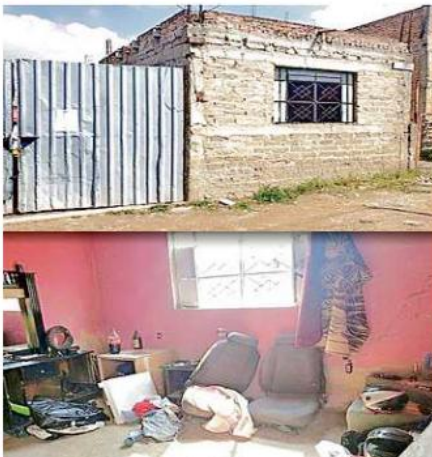
Los policías del Estado y de El Salto encontraron un deshuesadero de autos y aseguraron cuatro vehículos.

Por otro lado, se localizaron dos placas de circulación,