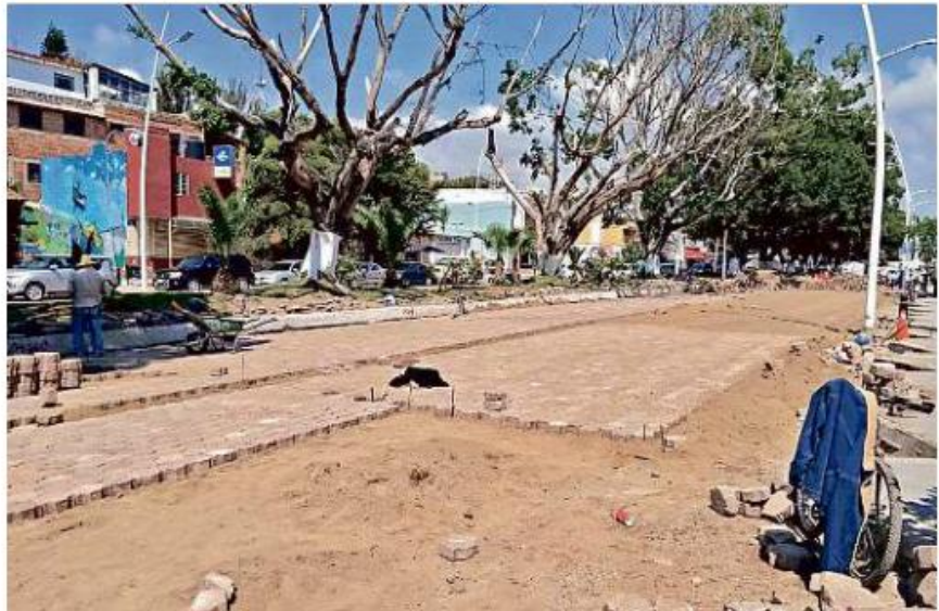
Se estima que la rehabilitación de la Avenida Francisco I. Madero costará 400 mil pesos.

“Estamos trabajando con las máquinas que tenemos, lo único que estamos pagando es el diésel, porque el personal es propio, el material que no nos han donado lo esta-