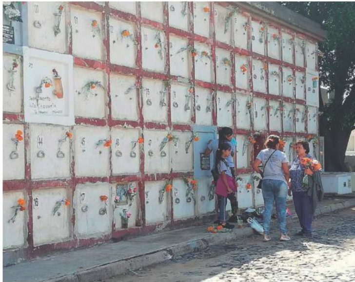
En familia, dejan ofrenda en su lugar de descanso. E.M. GUTIÉRREZ