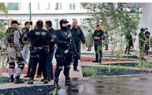
Tras el incidente hubo despliegue policiaco en la zona aledaña al cruce de las avenidas Acueducto y Patria.

Los sujetos despojaron a una mujer del auto compacto y chocaron contra una malla ciclónica a unos 500 metros de donde quedó el BMW, frente a la entrada de