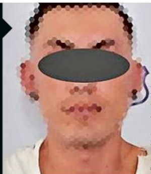
Rostró cubierto por la autoridad