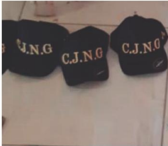
Había objetos con las siglas del CJNG. ESPECIAL