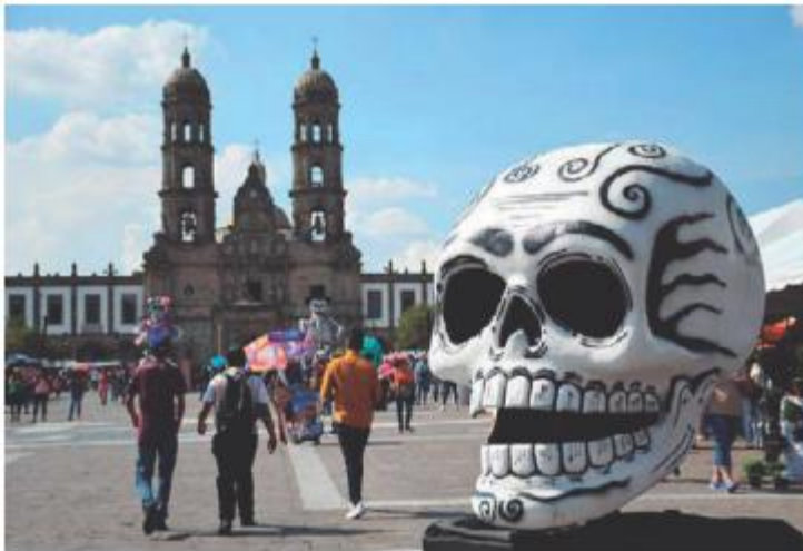
La Plaza las Américas fue sede del evento.

Por otro lado, la Dirección de Cultura organizó el festival Velas y Flores, que se celebra en los centros de la Red de Centros Culturales de Zapopan, del 28 de octubre al 7 de noviembre. ■