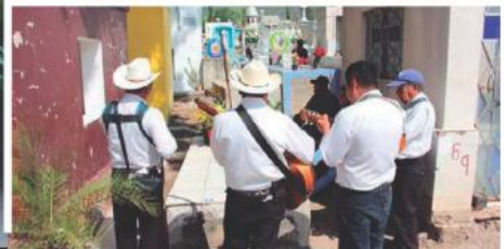
Familias acudieron a los panteones municipales de la Zona Metropolitana de Guadalajara.