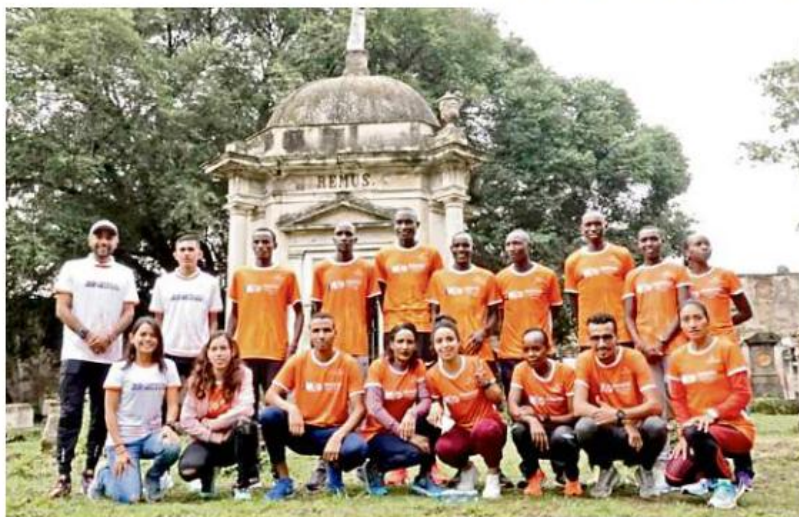
Los atletas élite fueron presentados ayer en el Panteón de Belén.

"Una persona que corre es una persona que está en contacto consigo misma, tiene un objetivo, que lo trabaja todos los días, que lo abona, lo piensa, lo desarrolla, lo fortalece y lo expone ante sus allegados, familias, comunidades y se convierten en reflejos, en representaciones, en ídolos y queremos más gente así en la sociedad, por eso es tan importante que veamos este proyecto como Ciudad, no sólo como un evento", afirmó Gallo.