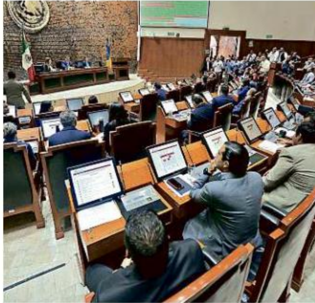
El Congreso del Estado recibió el Proyecto de Presupuesto.

Esto representa que el 16.5 por ciento del total de los recursos que tiene Jalisco se utiliza para pagos a servidores públicos; el presupuesto estatal ascendería a 122 mil millones de pesos para el siguiente ejercicio fiscal.