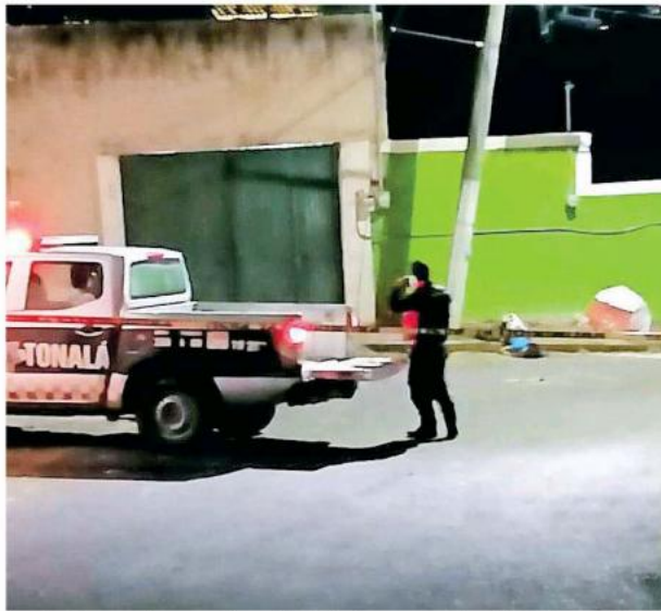
Los hechos en el cruce de las calles Trincheras y Santiago Tlatelolco en Tonalá.

Datos del Instituto Jalisciense de Ciencias Forenses señalan que en lo que va del año se han registrado 216 asesinatos de