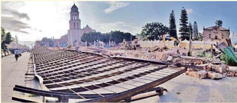
■ Así quedó el que fuera el Centro Cultural Páramo tras la demolición de hace unas semanas.

Además de la pérdida de los 4.6 millones de pesos, de fondos federales,