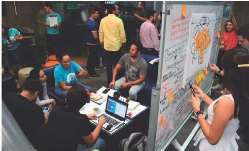
El programa Sinopsis culmina este domingo. ESPECIAL

Además, el programa tiene como propósito configurar un semillero que contribuya al desarrollo