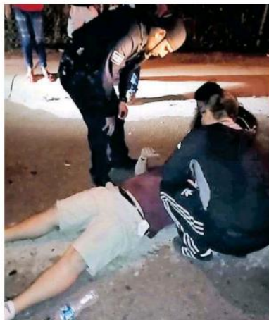
Tras el impacto cayeron un hombre y una mujer que iban en una moto.

Peritos de Ciencias Forenses llegaron al sitio para realizar la fijación de los indicios y determinar la causa del accidente.