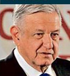
Andrés Manuel López Obrador, Presidente de México

La transformación que encabeza cuenta con el respaldo de una mayoría libre y consciente, justa y amante de la legalidad y de la paz, que no permitiría otro golpe de Estado. NACIONAL PÁG. 2