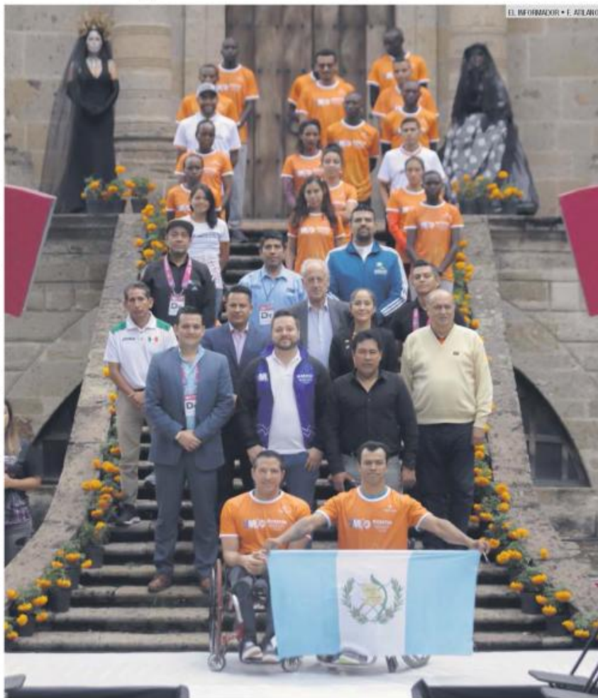
PANTEÓN DE BELÉN. Atletas destacados se reunieron previo a la carrera.

Esta edición del Maratón Guadalajara Megacable 2019 hidratado por Electrolit reunirá a corredores y corredoras de diferentes países como Marruecos, Kenia, Ecuador, Burundi y Etiopía.