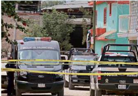
La violencia en Tlaquepaque no cesa; el 26 de septiembre hubo un doble homicidio en Lomas de Santa María.