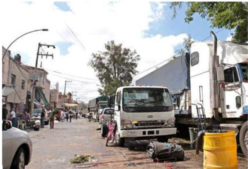
■ Según los vecinos, como los camiones se estacionan en la zona, forman “callejones”. Es ahí donde acosan a las mujeres.

Ñíguez mencionó que ellas ya no quieren ir a la tienda por temor a ser agredidas; la violencia contra ellas va desde silbidos y miradas lascivas hasta toca-