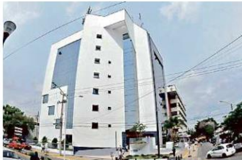
El Instituto de Pensiones del Estado de Jalisco (Ipejal) cuenta con más de 117 mil afiliados.