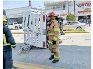
Llevaba un tanque de gas