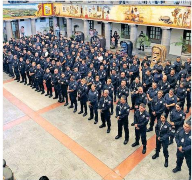
En el caso de Tonalá les piden firmar la hoja donde reciben alrededor de 440 pesos.

Después de que el pago se pospuso en varias quincenas, en medio de un estira y afloja de las administraciones municipales, finalmente el gobierno de Jalisco procedió a cumplir con el pago de esa percepción extraordinaria acorde a cada una de las corporaciones policiacas, donde sus elementos ganaban más o menos, para