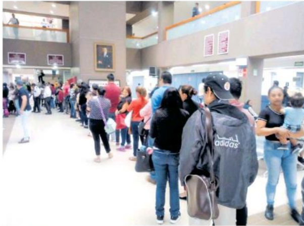
Pasan horas esperando la atención médica en las diferentes clínicas de la ciudad.

Mientras que, a pacientes con diagnóstico de dengue no grave deberán ser informados de los signos de alarma para que puedan identificarlos y solicitar atención médica de manera oportuna.