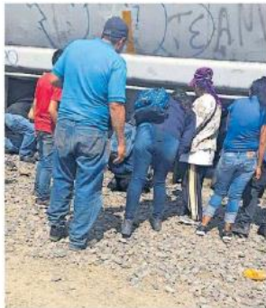
Los menores fueron llevados a la Cruz Verde para su valoración.

Fue en la carretera a El Verde al cruce de Carrillo Puerto, en la colonia San José El Verde, en el municipio de El Salto, cerca de la Plaza Multicenter, en donde la tarde de este viernes sucedió el atropellamiento al pretender cruzar las vías ferroviarias y