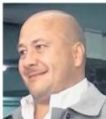
Enrique Alfaro, gobernador del Estado.

El alcalde tapatío añadió que "Manuelita" permitirá a sus visitantes conocer un poco más de la historia de la ciudad.