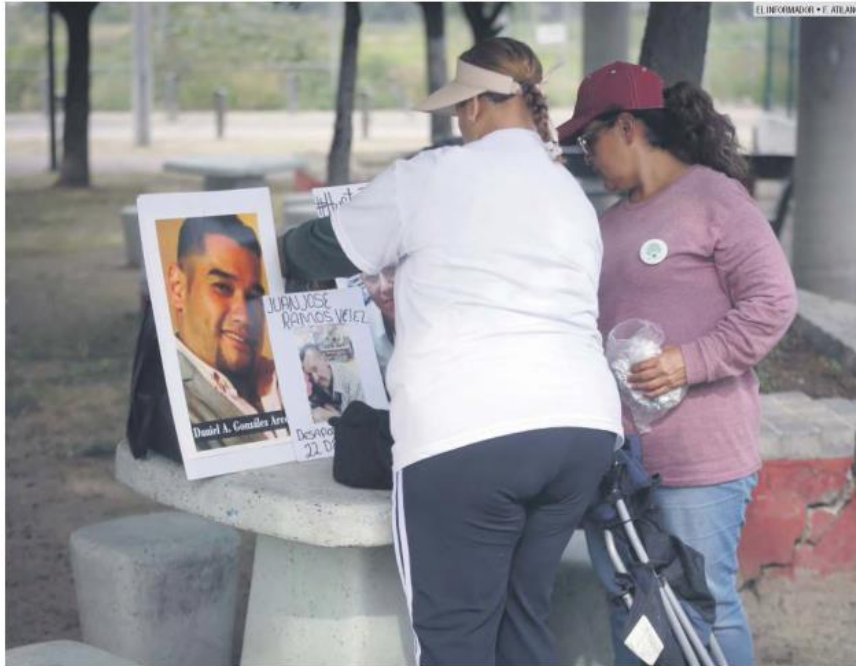
AVANCE. Los colectivos señalaron que las modificaciones a la ley son favorables para los familiares de desaparecidos.