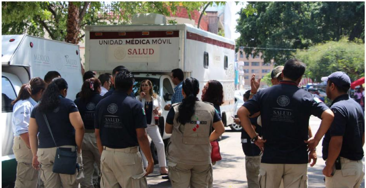
Ayer llegó a esta región personal del programa federal Caravanas de Salud.