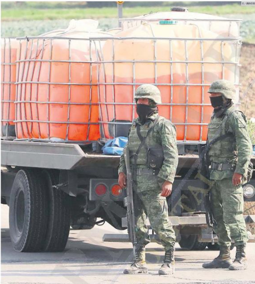
DECOMISOS. Ocho de cada 10 litros asegurados en el país entre diciembre de 2018 y julio de 2019 obedecen a decomisos realizados en cuatro entidades: Puebla, Tabasco, Nuevo León y Jalisco.

En el Primer Informe de Gobierno de Andrés Manuel López Obrador se indicó que, como parte de la estrategia contra el robo de hidrocarburos, se elaboraron paquetes de inteligencia que permitieron la identificación de líderes, colaboradores y facilitadores de este ilícito en Aguascalientes, Coahuila, México, Guanajuato, Nuevo León, Puebla, Querétaro, Tlaxcala y Zacatecas.