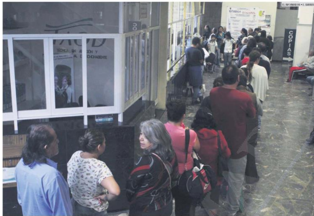
TORTURA. Por la contingencia, así hacen las filas para practicarse exámenes que confirmen el virus del dengue en las clínicas públicas.

Académico de la UdeG proyecta que, sin frío, se presentará hasta el mes de noviembre