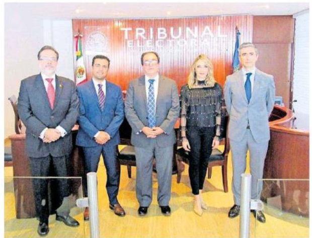
Con 32 años de servicio, empezó desde notificador.

El presidente del Tribunal Electoral hasta el día 7 de octubre -es cuando termina su lapso- dio a conocer que en este tiempo recibió 2 mil 656 medios de impugnación, de ellos 21 recursos apelación y 2 mil 490 para la protección de derechos políticos-electorales de ciudadanos, cinco asuntos generales, dos recursos de revisión, 24 procedimientos especiales para dirimir conflictos o diferencias laborales entre el tribunal electoral y sus trabajadores, y 56 procedimientos especiales sancionadores.