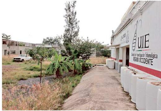
El Hospital Materno Infantil de San Martín de las Flores de Abajo, en Tlaquepaque, presenta un avance de 40 por ciento en su construcción.

Acude a cuidados y parto al Civil, por obras inconclusas en hospital cercano