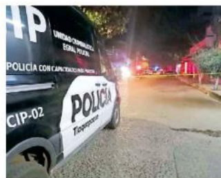
Los hechos en calles de la colonia Lindavista, en el municipio de Tlaquepaque.

Los socorristas atendieron al hombre y se dieron cuenta de que ya no contaba con signos