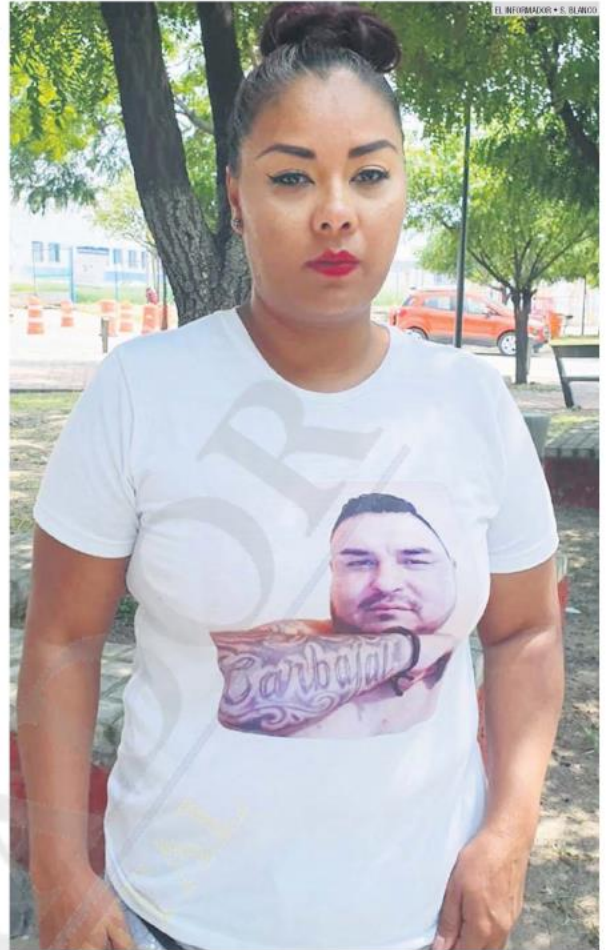
EL INFORMADOR • E. ELIZABETH

— Empiezas, primero, a buscar en hospitales; después vas a los penales. Por último, te queda aquí, en el Semefo, pero si aquí no está quiere decir que está vivo... o en alguna de las tantas fosas. Mientras no aparezca hay vida, pero hay muchísimas fosas en Guadalajara. De hecho, Guadalajara es una fosa.