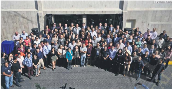
FAMILIA CENTENARIA. La presentación de "Manuelita" es una muestra del compromiso de esta casa editorial por compartir sus 102 años de historia con los ciudadanos.

EL INFORMADOR cumple 102 años, y para celebrar con nuestros lectores presentamos a "Manuelita", la primera rotativa de este diario