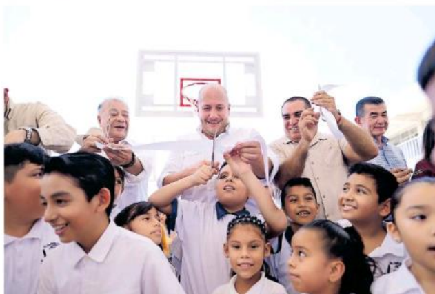
Enrique Alfo entregó infraestructura educativa.

Al concluir su gira por la Costa Norte de Jalisco, donde entregó apoyos e hizo evaluación de daños a ciudadanos afectados por las tormentas Lorena y Narda, señaló que en materia educativa se entrega el Centro de Desarrollo Infantil, el cual atenderá a 400 menores con ayuda de 100 auxiliares desde la primera infancia, con el objetivo de impulsar todas las áreas del