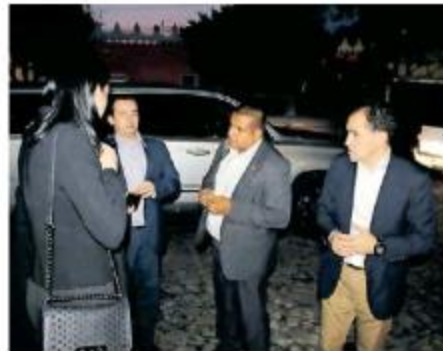
El secretario de Hacienda Arturo Herrera se encuentra en Jalisco.