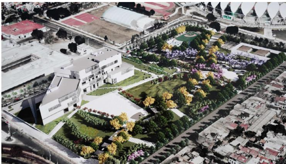
Lo primero que harán es la zona cultural.