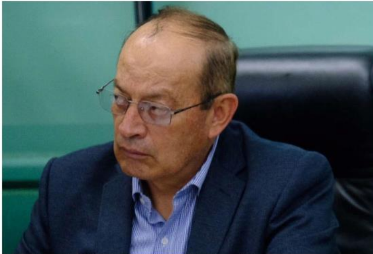
Se buscó la versión del funcionario pero la solicitud no fue aceptada.