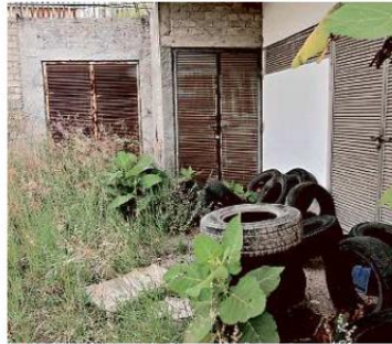
No se terminaron las áreas de hospitalización, urgencias, tococirugía y servicios generales, en donde se acumula basura.

Actualmente, la primera parte del nosocomio, tanto