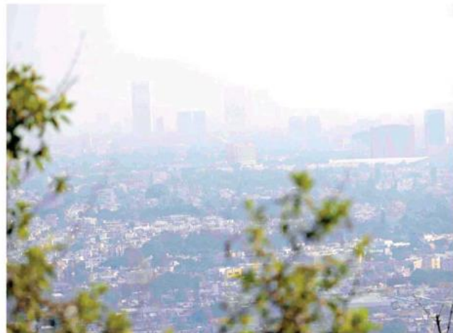
Los altos índices de contaminación afectan a la salud de las personas.

De 1901 a 2010, el nivel medio mundial del mar ascendió 19 cm, ya que los océa-