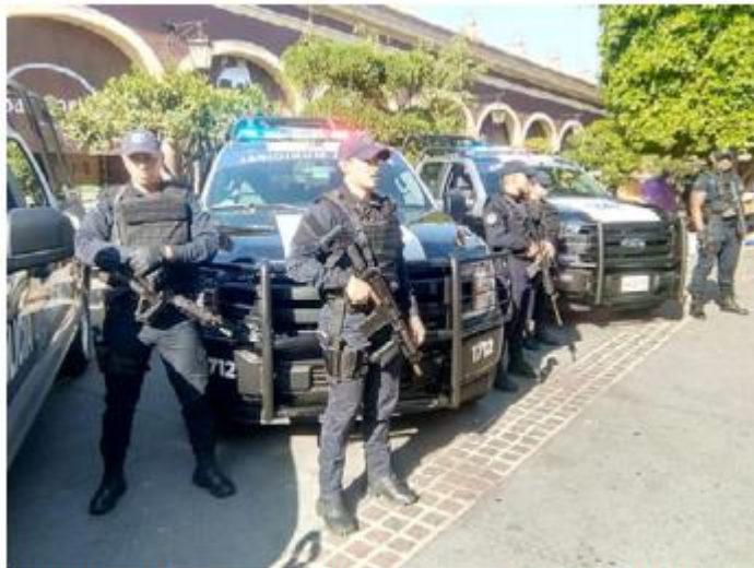
Funcionario dijo que el aumento será paulatino.

“Mientras logremos que esas detenciones sean exitosas, legales y vinculaciones a proceso y judicializaciones sean correctas y como el procedimiento lo demanda, pues logramos eso”, refirió. ■