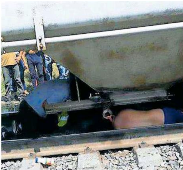
Tras el hecho, nadie podía creer lo que había ocurrido.