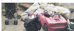
CACHARROS. No acumule objetos en su hogar, pueden ser incubadoras de moscos.

Recordó que, en los días siguientes, el mosquito se propagó. Su esposo, su cuñada, su sobrina y su mamá también cayeron. Eso "Pero por lo menos ya puedo andar de allá para acá y no estoy todo el día en la cama", celebra.