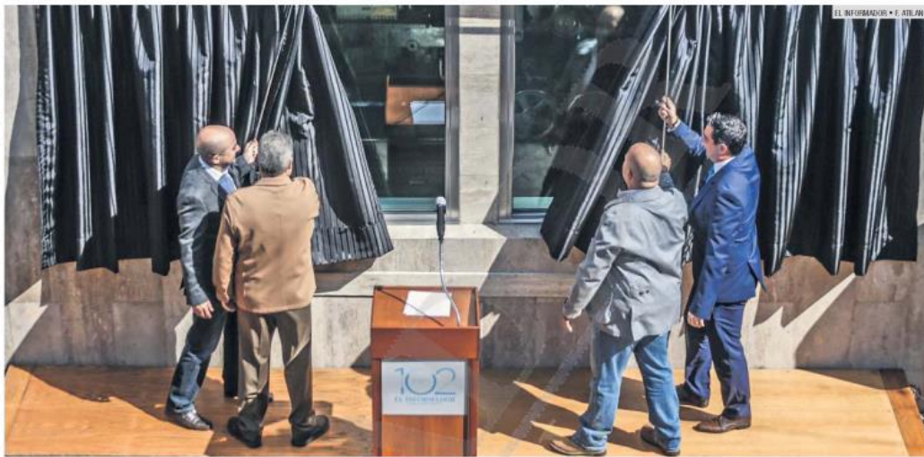
ATRACTIVO. Las personas que visiten el Centro tapatío podrán observar a "Manuelita", primera rotativa marca "Goss" de esta casa editorial.