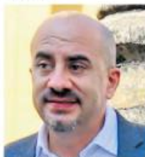
Ismael del Toro, alcalde de Guadalajara.