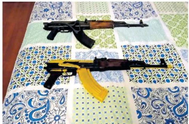
A los detenidos les aseguraron tres armas largas tipo AK-47.

Las investigaciones federales indican que entre los implicados se encuentran un sujeto vinculado a más de 10 empresas dedicadas al lavado de dinero para dicho grupo delictivo en los municipios de Zapopan, Tlaquepaque y Guadalajara, y que también se dedica a reclutar personas de origen extranjero.