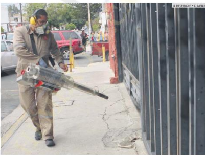
LIMPIA. Aunque ciudadanos afirman que son pocas, el Gobierno defiende sus acciones para combatir al mosquito.

Según el último corte que dio la Secretaría de Salud, el jueves pasado, el Estado Jalisco se hallaba en el segundo lugar a nivel nacional con más casos de dengue, pues habían cinco mil 047 personas enfermas.