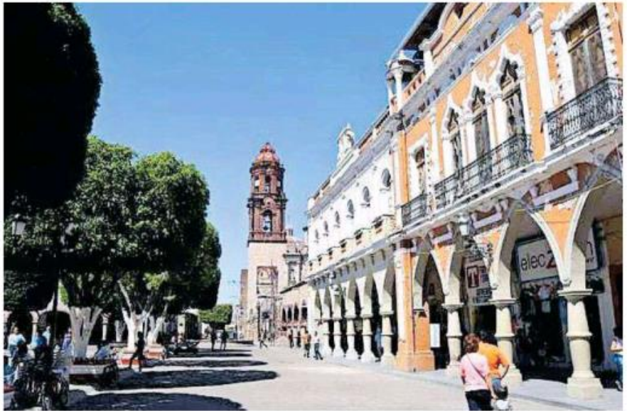
ASPECTO del municipio de La Barca.

El gobernador Enrique Alfaro Ramírez parece