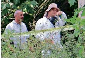
En total, las autoridades localizaron 138 bolsas con restos humanos en dos puntos de la Colonia La Primavera.

En la estadística de homicidios de septiembre se incluyen sólo 34 víctimas encontradas en la Primavera, pero aún faltan pruebas genéticas por realizar a otros restos humanos localizados en esta zona de Zapopan. La Coordinación General Estratégica de Seguridad confirmó ayer que, dentro de las 239 personas asesinadas que contabilizó el mes pasado, se encuentran los cuerpos completos de 13 víctimas y otros 10 incompletos hallados en un pozo que fue utilizado como fosa clandestina.