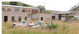
En el Hospital Materno Infantil San Martín de las Flores se terminó la primera etapa y la segunda está así desde hace 11 años.

La segunda, que ofrece a las madres la oportunidad de ser evaluadas durante el trabajo de parto y recibir consulta médica ante una emergencia, desde hace 11 años se puso en "pausa"; sólo