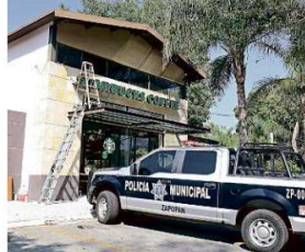
■ Aunque el ladrón hizo un disparo en el establecimiento, no hubo personas lesionadas. El criminal alcanzó a escapar.

Una mujer, de 25 años, fue asesinada por su ex pareja en la Colonia Parques de la Victoria de Tlaquepaque. Su cuerpo fue localizado en la Calle Guillermo Garibay, cerca de Ángel Zapopan Romero. Los vecinos declararon que antes estuvo discutiendo con su ex esposo. Se halló un revólver y una mochila en el lugar. Staff