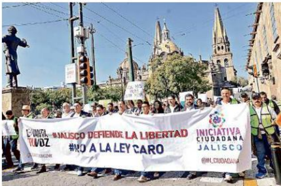
El Frente Nacional por la Familia marchó ayer contra la ley Caro.

"No es posible que una iniciativa como la Ley Caro quiera penalizar a la persona que ayude a otra, que tenga una confusión, que necesite