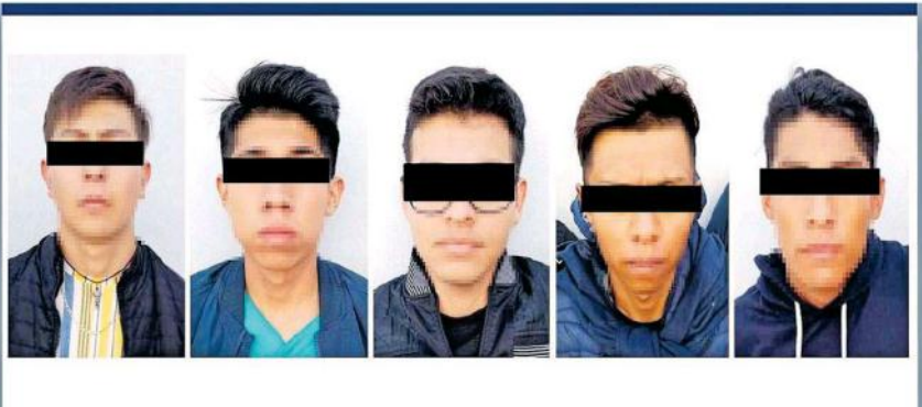
En total fueron cinco sujetos los detenidos.