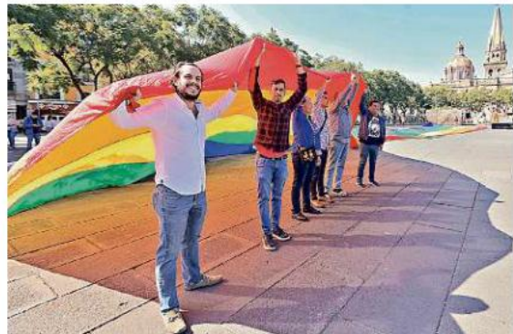
Frente al Congreso, activistas se mostraron a favor de la prohibición.