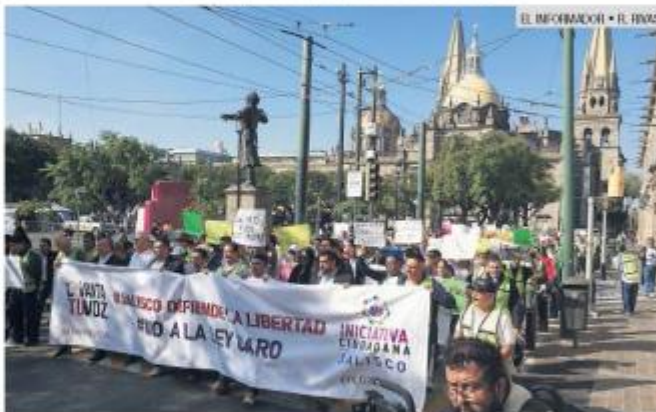
PROTESTAS. Un grupo se manifestó en contra de la propuesta.

El diputado calificó como un avance que el dictamen no se haya regresado a comisiones y admitió que depende del consenso político que el proyecto de modificación pueda retomarse. Subrayó que el de-