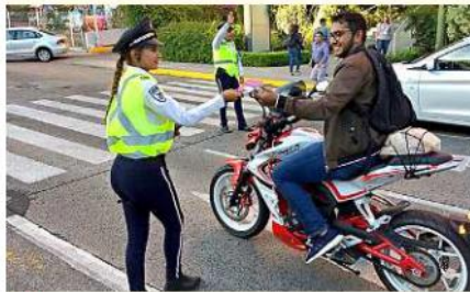
■ Un motociclista sin casco pasa frente a la agente vial y en lugar de infraccionarlo, le dio información de la FIL.