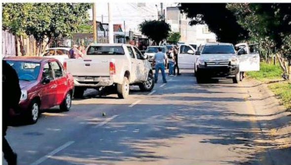
Los sujetos subieron a la azotea y trataron de escapar, pero fueron rodeados por los agentes. ROMÁN ORTEGA

Los sujetos subieron a la azotea y trataron de escapar, pero fueron rodeados por los agentes de Fiscalía, de la policía de