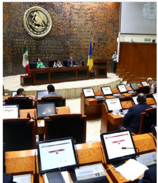
Los diputados recibirán 181 mil pesos. ESPECIAL

Los regidores de la ex Villa Maicera también gozarán de las mieles de la abundancia con 148 mil pesos. En Guadalajara, el presidente mu-