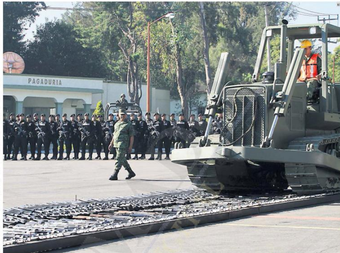
ACCIONES. La Sedena destruyó ayer más de 19 mil armas de diversos calibres en 26 Entidades.

Crescencio Sandoval insistió en que las revisiones se hacen de manera aleatoria, pues si las aplican a todos los vehículos se afectarían otras economías, como la de alimentos, ya que en las cajas de esos tráileres también se transportan productos perecederos.