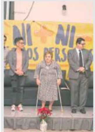
DE VIVA VOZ. El evento contó con testimonios de personas con discapacidades.

● Cada 3 de diciembre se conmemora el Día Internacional de las Personas con Discapacidad, instituido en 1992 por la Organización de las Naciones Unidas (ONU) a fin de promover los derechos y el bienestar de este sector en todos los ámbitos de la sociedad y el desarrollo