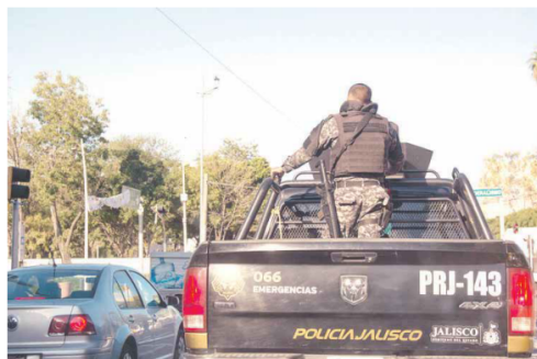
REFUERZO. Al sitio del tiroteo se desplazó personal de la Policía del Estado y de la comisaría de Zapopan para prestar apoyo a los agentes atacados.

Agentes de la Comisaría General de Seguridad Pública de Zapopan resguardaron un casquillo en el sitio. Juan Levario