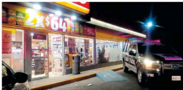
La captura se realizó por medio del patrullaje que realizan Policías de Tlaquepaque.

El ingresó a la tienda de autoservicio ubicada en el cruce de la avenida Santa