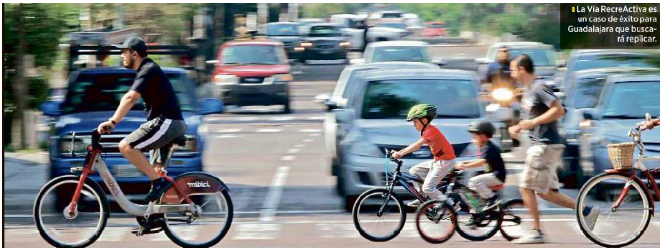
La Vía RecreActiva es un caso de éxito para Guadalajara que buscará replicar.