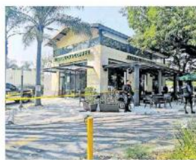
La mujer se encontraba en una cafetería cuando fue asaltada.

Cuando llegaron policías de Zapopan, la afectada manifestó a los policías que en su bolso había 300 mil pesos en efectivo,