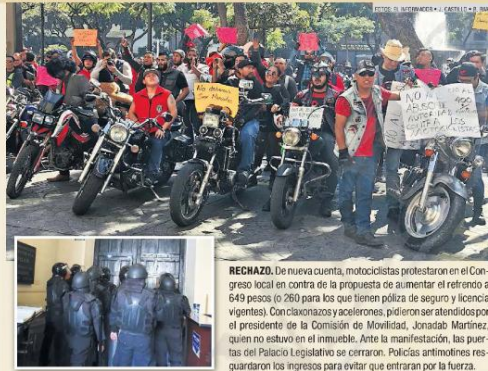
RECHAZO. De nueva cuenta, motociclistas protestaron en el Congreso local en contra de la propuesta de aumentar el refrendo a 649 pesos (o 260 para los que tienen póliza de seguro y licencia vigentes). Con claxonazos y acelerones, pidieron ser atendidos por el presidente de la Comisión de Movilidad, Jonadab Martínez, quien no estuvo en el inmueble. Ante la manifestación, las puertas del Palacio Legislativo se cerraron. Policías antimotines resguardaron los ingresos para evitar que entraran por la fuerza.