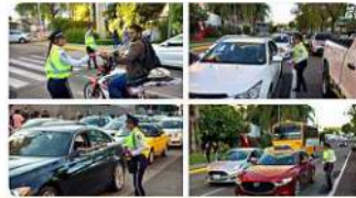
■ Vía Twitter, la Policía Vial dio cuenta de la entrega de folletos a automovilistas en la zona de Expo Guadalajara.