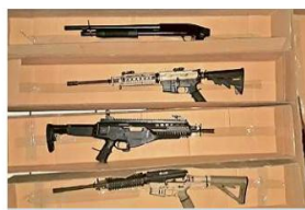
■ El vehículo encontrado en Zapopan tenía un arsenal en su interior, así como chalecos con las siglas del CJNG.

Un oficial de la Policía Vial fue arrollado por un taxi cuando circulaba sobre Mariano Otero y Eudales, en la Colonia Jardines de la Victoria, en Guadalajara. El uniformado tenía una probable fractura en su pierna derecha.