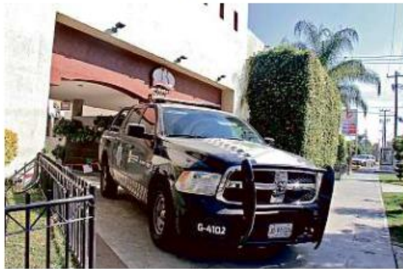
La Fiscalía del Estado mantiene asegurado el Motel Baiona, con apoyo de la Comisaría de Guadalajara.

Esta misma acción, pero sin el consentimiento se castiga con penas que van desde