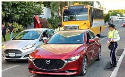
■ La Policía Vial no detuvo al conductor de este auto pese a que no portaba placa, al menos en la fascia delantera.