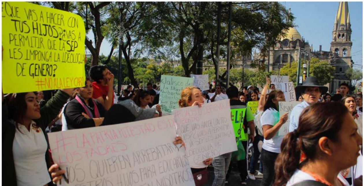
Decenas de personas se manifestaron contra la reforma en el Centro de Guadalajara.