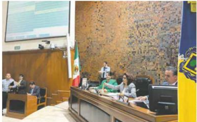
DAN AVAL. 27 diputados votaron a favor de las nuevas plazas.

En tribuna no hubo ninguna objeción para autorizar que se otorguen salarios mensuales brutos de 12 mil a 15 mil pesos para estas plazas.