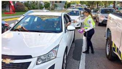
■ Un automovilista circula con un menor de edad en la parte delantera del auto y la Torita no se percata de la falta.