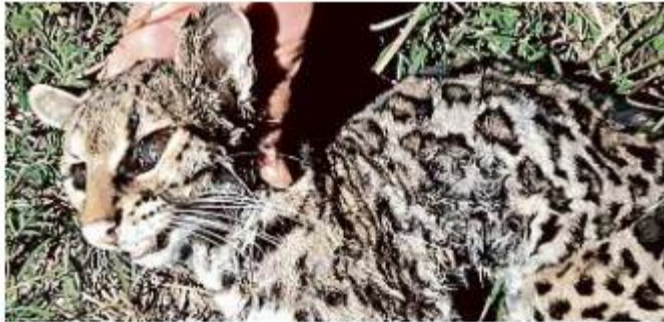
■ El tigrillo que fue encontrado muerto en El Nixticuil.