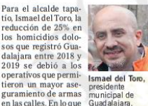
Ismael del Toro, presidente municipal de Guadalajara.

Un ejemplo de estos resultados se dio el martes. Ese día, policías que patrullaban por la Colonia Autocimera vieron un automóvil que circulaba a alta velocidad. Luego de alcanzarlo, lo revisaron y encontraron en su interior tres rifles AK-15, dos pistolas calibre 9 y 10 milímetros, respectivamente, y 208 balas. "A través de los operativos estratégicos, y en coordinación con otras instancias de seguridad (como la Fiscalía estatal y el Ejercito), es la Policía que tiene más decomisos de armas: un promedio de 10 a la semana. En algunos casos, decomisos de arsenales de armas largas y cortas. Es una constante", dijo. Recordó la escalada de asesinatos que hubo a partir de 2015, con 218. Sin embargo, destacó que entre 2018 y 2019 pasaron de 582 a 440. Del Toro explicó que la Comisaría cuenta con información sobre las zonas con mayor incidencia de este ilícito. En ellas se aplican estrategias de inteligencia, mayores patrullajes y operativos conjuntos. De acuerdo con el Centro de Estudios Sociales y de Opinión Pública de la Cámara de Diputados, en México circulan alrededor de 15 millones de armas: 85% de manera ilegal.