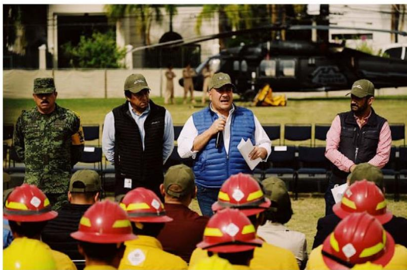
El gobernador y funcionarios entregaron equipo.

través del programa A Toda Máquina, además se implementó el programa Especial de Atención a Interfaz Urbano Forestal en el Bosque La Primavera.