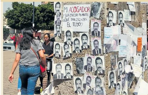
MARTAGÓ. Unas 100 alumnas y ex estudiantas de la Preparatoria 1 de Jalisco se manifestaron ayer contra el acoso ejercido en el plantel. Señalaron a dos profesores: uno de Matemáticas y otro de Educación Física. Colocaron carteles con imágenes de los presuntos acosadores y con mensajes para visibilizar el problema. El Sistema de Educación Media Superior inició un proceso contra el primer docente señalado. Agregó que dio acompañamiento a una afectada para que denuncie.