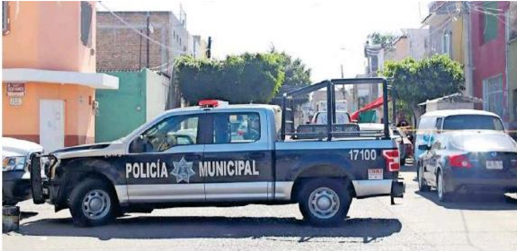
Realizaba el Censo 2020 en Tlaquepaque.