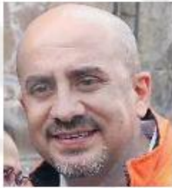
Ismael del Toro, presidente municipal de Guadalajara.

Para dimensionar el alcance, entre 2013 y 2017, periodo en el que gobernó el país Enrique Peña Nieto, la Secretaría de la Defensa Nacional (Sedena) decomisó apenas 745 armas en todo el Estado.