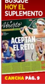
CANCHA PÁG. 9