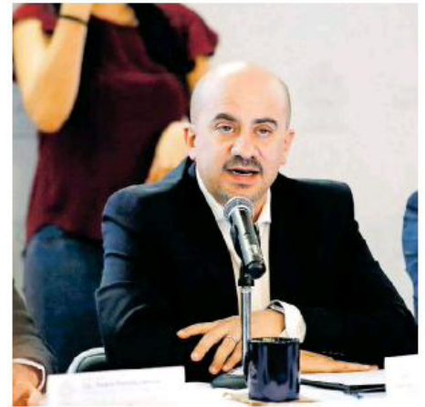
Afirma el alcalde que ya intervinieron en el caso de presunto acoso.

El miércoles pasado, en el patio de la secundaria anexa Ramón García Ruiz, un grupo de alumnas se manifestaron para denunciar casos de acoso en su contra por parte no solo de personal docente, sino prefectos y mismos compañeros.