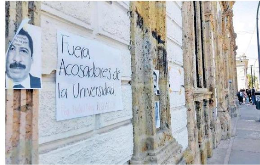
Colocaron carteles de presuntos acosadores en la escuela.

Al menos siete profesores son señalados de hostigamiento por alumnos de la Prepa 1