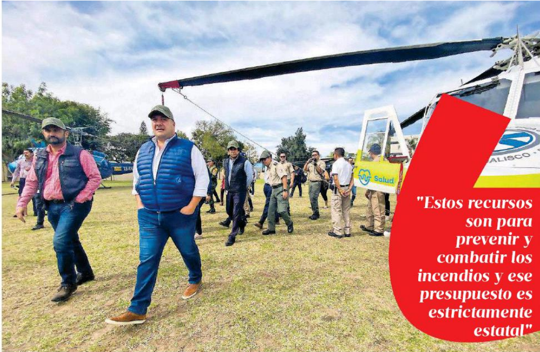
Enrique Alfaro verificó personalmente la disponibilidad de los helicópteros y el personal.