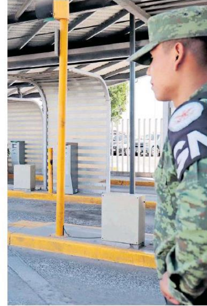
Presencia de la Guardia Nacional en el aeropuerto de Guadalajara. ANTONIO MIRAMONTES.

Autoridades estatales y federales anunciaron en febrero para Guadalajara una inversión superior a los 12 mil millones de pesos.