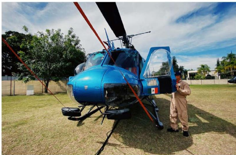
Presentaron los equipos con los que combatirán los incendios. ESPECIAL

Como parte de este programa, han sido habilitados 350 kilómetros de caminos forestales a