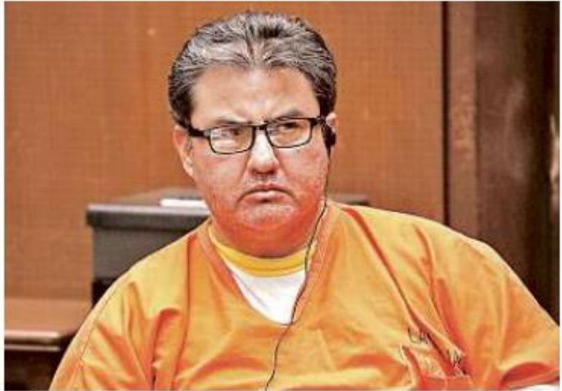
■ Naasón Joaquín se encuentra detenido en Estados Unidos.

“La Unidad de Inteligencia Financiera a veces hace afirmaciones que violan la presunción de inocencia. Lo calificaría, primero, como un