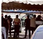
El comerciante fue asesinado junto a donde se realizaba un velorio.

En ese punto los atracadores le dispararon al hombre, de unos 33 años, quien recibió un balazo en la cabeza y murió a un par de metros del velorio que sucedía a un costado de la Parroquia Nuestra Señora del Rosario. Una vecina de la zona relató que escuchó unos ocho balazos.