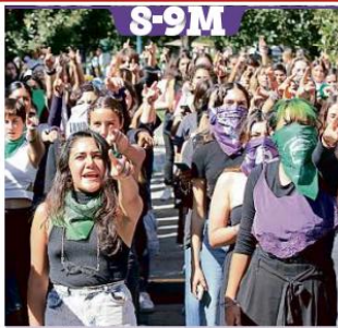
Las participantes corearon consignas a favor de “Un Violador en tu Camino”, aunque con letra distinta.

En el lugar fueron asegurados casquillos de, al parecer, calibre .40 y 9 milímetros. Tras perpetrar el crimen, los agresores huyeron en una Jeep Liberty en color arena.