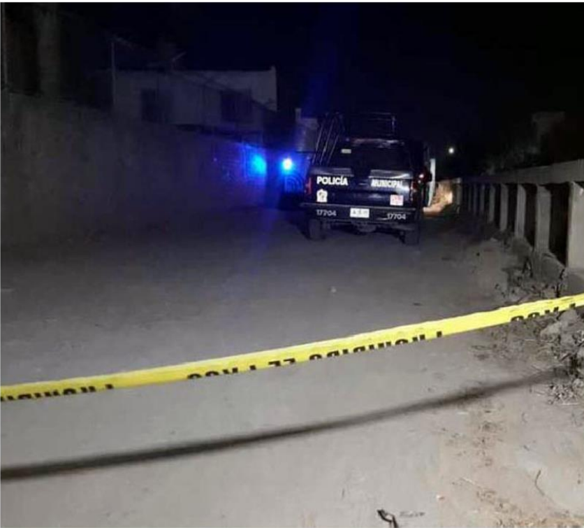
Dos crímenes ocurrieron en San Pedro Tlaquepaque. MARTÍN PATIÑO

Con información de: Martín Patiño y Juan Carlos Munguía