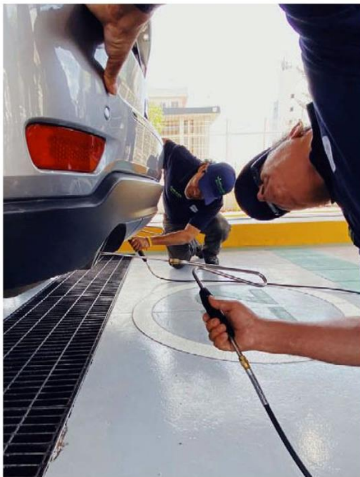
Jalisco tiene 6 estaciones de medición de contaminantes.

Ante el actuar por parte del gobierno de Jalisco, es que los integrantes y dueños de talleres impusieron demandas desde el año pasado, así como una apelación sobre el proceso de licitación, esto mismo ante la inconformidad por parte de los demás concursantes.