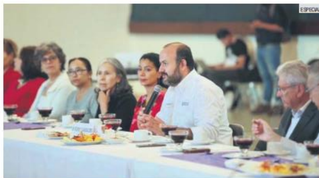
ANUNCIO. El rector de la UdeG, Ricardo Villanueva, dio a conocer la medida.

Además, se destacó que para los alumnos se preparó un curso de 19 semanas en la currícula de primer semestre de bachillerato, "acerca de temas con perspectiva de género, mismo que comenzará a aplicarse en el ciclo escolar 2020-B".