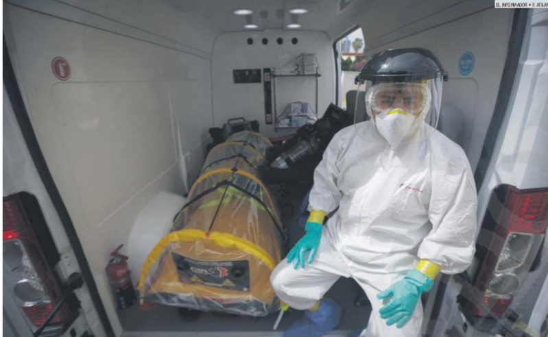
REFUERZAN SU EQUIPO. Ayer, el SAMU presentó la ambulancia en la que trasladarán a cualquier paciente que presente síntomas de coronavirus.

En ningún caso el SAMU ha necesitado hacer una visita al domicilio de quien se comunicó