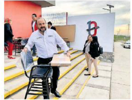
Entregaron las primeras butacas en la Prepa 10.

Ricardo Villanueva explicó que Prioridades pudo ser posible gracias al ahorro en los recursos destinados a protocolos y ceremonias, y bajo el esquema de peso por peso, en el que las escuelas y centros universitarios también aportan la misma