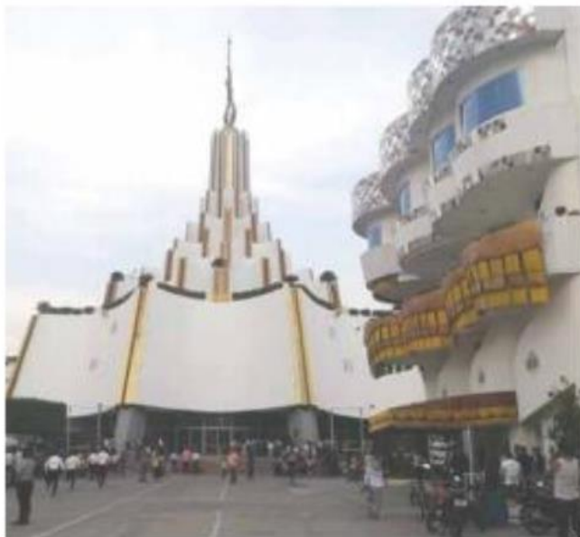
HACIENDA. La UIF bloqueó más de 359 millones de pesos a seis integrantes de la Luz del Mundo.

Abundó que el éxito de las detenciones realizadas en Estados Unidos y a su vez del proceso que sigue se logra gracias a la tecnología que tienen para rastrear información y obtener pruebas y testigos.