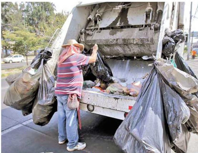
El municipio concesiona a la empresa Caabsa Eagle.