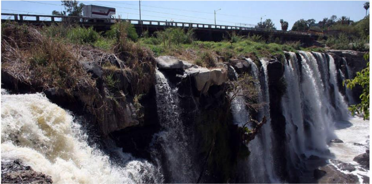
La próxima semana darán a conocer el estudio de contaminantes, así como el proyecto de saneamiento. ESPECIAL