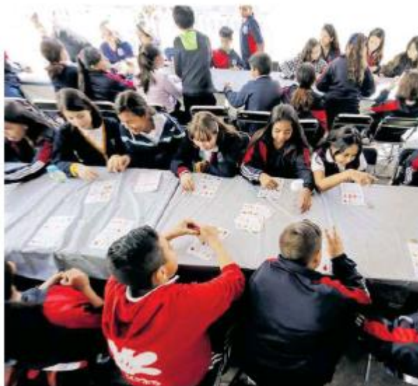
El proyecto inicia en el paseo Alcalde.

Durante este viernes en el Paseo Fray Antonio Alcalde se realizaron varios talleres didácticos e intercambio de juguetes bélicos por lúdicos.