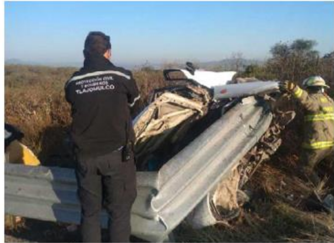
Sujeto perdió el control y se impactó contra una valla. MILENIO

En cuanto a la volcadura ocurrida sobre la carretera a Colotlán en el municipio de Zapopan, ascendió la cifra a cinco víctimas. De los 24 lesionados, nueve continúan hospitalizados. ■