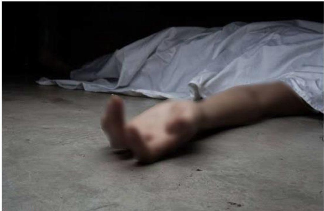
Sus familiares ya reconocieron el cuerpo.

Los hechos ocurrieron en el cruce de Javier Mina y 20 de Noviembre. Peritos del Insti-