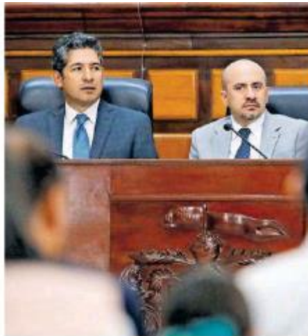
Sesión solemne en el Ayuntamiento tapatío.