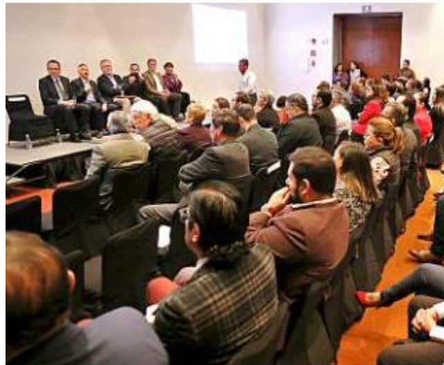
El Coecytjal mostró ayer los proyectos que fueron financiados por recursos estatales.

Entre los mejor evaluados se encuentra una investigación para tratar el cáncer a través de nanotecnología, tratamiento positivo de vinazas del tequila y automatización de plantas de producción de alimentos para su exportación a Estados Unidos.