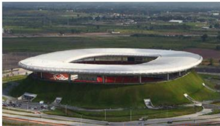
La primera será en las inmediaciones del estadio Akron.

Una de ellas es la primera Carrera Corre por el Bosque, que tendrá lugar a las 8:00 horas en las inmediaciones del estadio Akron, en Zapopan. La ruta comenzará en la avenida Del Bajío y seguirá por el Circuito JVC, en ambos sentidos, hasta retornar a la altura del estadio y regresar al punto de salida; ambas vialidades se cerrarán a la circulación vehicular. El domingo 8 de diciembre se llevará a cabo la