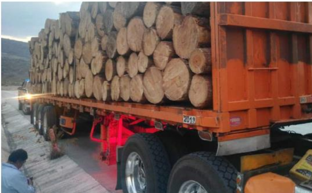
El conductor fue detenido.