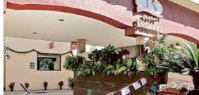
El Motel Baiona sigue clausurado por la Fiscalía, tras haberse al menos a 8 adultos con mujeres menores de edad.

Vinculan a proceso por abuso sexual infantil y corrupción de menores MURAL / STAFF A un año de prisión preventiva fueron enviados dos adultos quienes fueron detenidos en el Motel Baiona, de Guadalajara, por estar con tres adolescentes de entre 13 y 14 años. A Kevin Josué, de 19 años, se le vinculó a proceso por el delito de abuso sexual infantil, mientras que a Ernesto, de 29, por corrupción de menores. En la audiencia el juez determinó que el Ministerio Público que lleva el caso tiene 4 meses más para investigar y hallar pruebas en contra de los vinculados. Los hombres fueron detenidos el 30 de noviembre luego de que una de las niñas logró salir del motel e hizo la denuncia ante la Policía de Guadalajara. Kevin es vecino de la Colonia Lomas de Oblatos y Ernesto, de San Andrés; ambos dijeron trabajar en laminado y pintura. Con ellos se detuvo a un adolescente de 17 años, pero no se informó cómo va su proceso legal. Las víctimas dijeron que fueron llevadas con engaños al motel ubicado en la Avenida Circunvalación, entre Ventura Anaya y Francisco Sarabia. Un día después del arresto que hizo la Policía de Guadalajara, la Fiscalía montó un operativo en el motel y detuvo a otros cinco hombres que estaban con menores de edad. José Emanuel, Ronaldo Fabián, Yair, Juan Carlos y Ricardo Jesús están en espera de su audiencia. La Fiscalía no ha informado si los ocho hombres tienen relación entre sí y si hay más personas involucradas en este delito.