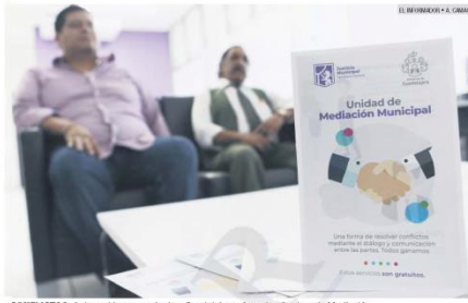
CONFLICTOS. Ante problemas vecinales, Guadalajara ofrece los Centros de Mediación.

En Tlaquepaque no se tiene el registro de sanciones, aunque documentan tres denuncias por acoso sexual.