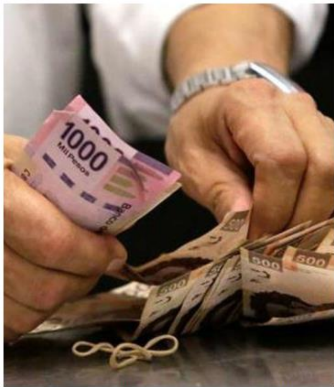
Cada diputado gana 109 mil pesos brutos al mes.

“No en verdad para el trabajo que hacen como cualquier otro trabajador normal cuanto reciben para sus jugosos aguinaldos, creo que no van de la mano pa-