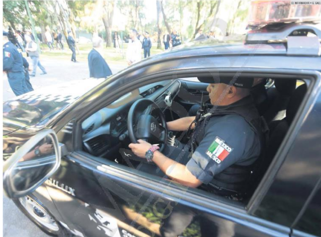
ESTRATEGIA. Los vecinos que han donado unidades a la Policía han detectado una baja notable en los delitos registrados en sus colonias.