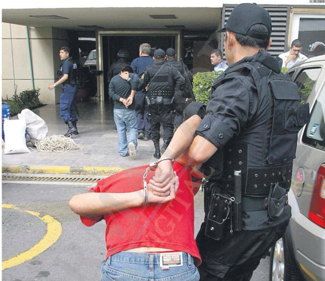
ESTADÍSTICA. En Guadalajara surtan 10 mil 829 detenidos por faltas administrativas en este año, la mayoría por escándalos en la vía pública.

● Para la Comisaría de Guadalajara, acénta, es muy importante que las personas reporten cualquier conducta que las haga sentir lastimadas o invadidas en su privacidad. "Hacemos un llamado a que nos den un voto de confianza, seguimos trabajando para tener un entorno más tranquilo".