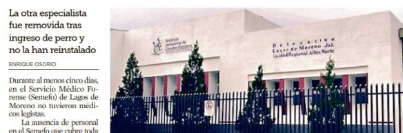
Las familias de personas desaparecidas no pueden obtener datos sobre los restos que se resguardan ahí, pues no hay quién les atienda, aseguraron colectivos.