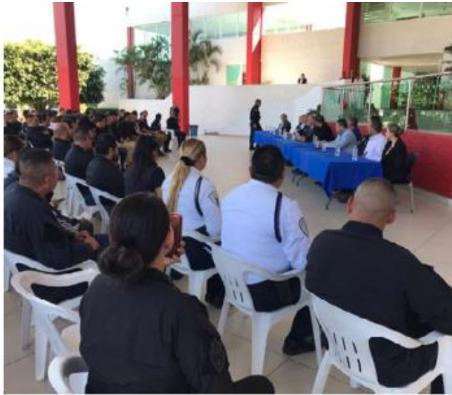
Tomaron un curso de investigación.