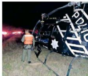
El lamentable hecho ocurrió en la carretera a Colotlán.

Fue cerca de la media noche que los bomberos zapopan realizaron la extracción de los cuerpos de los tres cuerpos que se encontraban atrapados en el autobús. Cabe decir que el cuarto cadáver