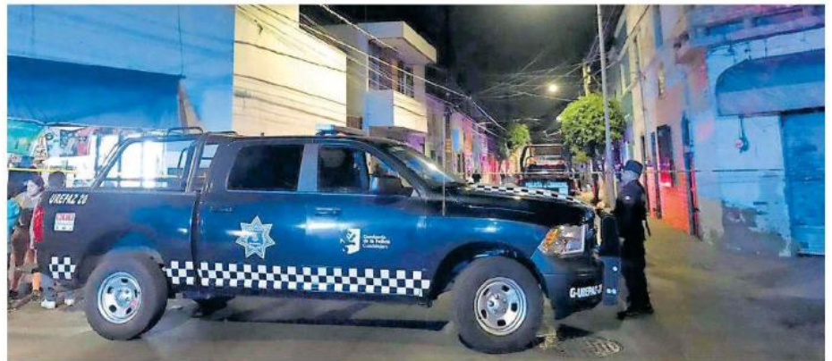
Policías de Guadalajara fueron agredidos a balazos por un par de sujetos; estos repelieron la agresión.

Uno de los ocupantes del vehículo resultó herido por lo que fue atendido por paramédicos de la Cruz Verde. Los tres quedaron a disposición del Ministerio Público para que los investigue determinen su situación legal.