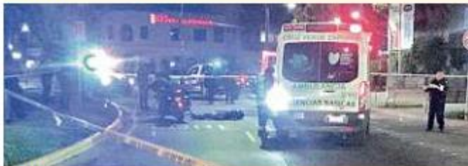
■ El asesinato ocurrió en la esquina de San Ignacio y Guadalupe, la madrugada del viernes.

Tanto autoridades zapopanas como tapatías montaron un operativo para dar con ellos, sin embargo, no pudieron hallar a nadie.