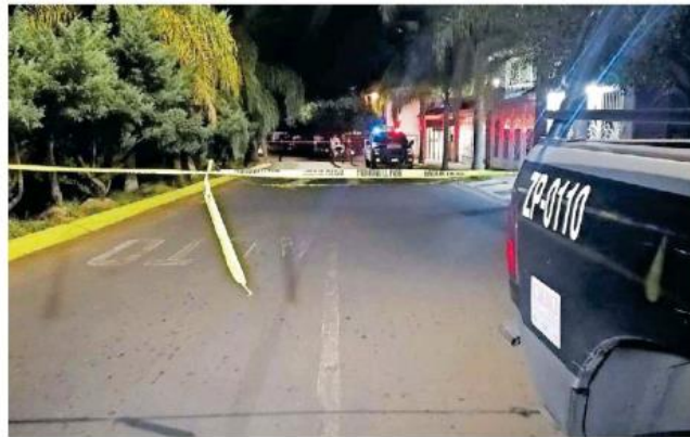
Un hombre de 40 años fue victimado a tiros en la calle Trafalgar, en la colonia Colinas del Rey.

Poco después llegaron los paramédicos de la Cruz Verde, quienes confirmaron el