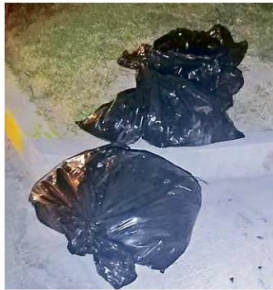
Entre la noche del sábado y madrugada del domingo dejaron bolsas con restos humanos en Ojuelos.

El pasado 11 de septiembre fue capturado Alexis "N", alias El Chóforo, presunto líder criminal de la zona, y quien