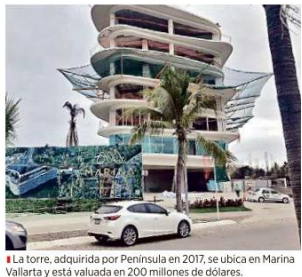
La torre, adquirida por Peninsula en 2017, se ubica en Marina Vallarta y está valuada en 200 millones de dólares.

Tras una denuncia por un intento de despojo, el