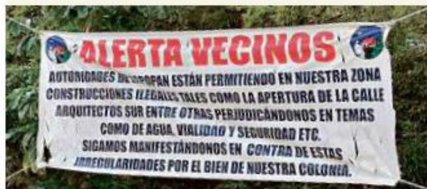
Los vecinos colgaron mantas en la colonia para advertir sobre las construcciones fuera de reglamento.

Cuestionado al respecto, el Alcalde de Zapopan, Pablo Lemus Navarro, dijo desconocer dicho recurso legal y la situación actual de las torres.