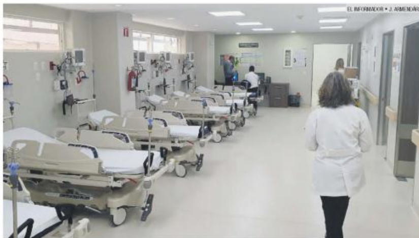
SANATORIO. Una de las nuevas áreas del nosocomio "Dr. Juan I. Menchaca".

■ Cambian la política para priorizar los casos de mayor riesgo de muerte materna o del neonato