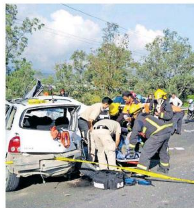
Aún se desconocen cuáles fueron las causas del accidente.

tes, situación que hizo creer a las autoridades que pudieron haber sido los responsables, pero serán los peritajes que realice el Instituto Jalisciense de Ciencias Forenses los que determinen la causa del accidente.