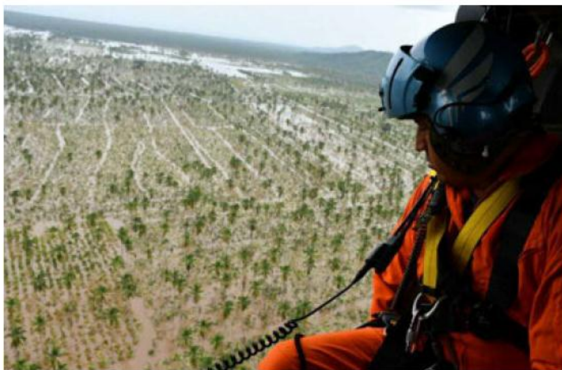
Mil 200 hectáreas de plátano resultaron dañadas.

Asimismo, indicó que el apoyo a los productores que resultaron afectados, se estará brindando a través de un seguro catastrófico