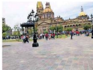
Esperan que la autoridad tome cartas en el asunto.

do MORENA en Jalisco, señaló que es inaudito que al denunciar la situación en la policía se les diga a los comerciantes que es normal, por ello, ofrecieron su apoyo al alcalde Ismael del Toro para dotar de toda la información que los mismos comerciantes les han brindado y así, pongan