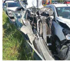
ENCONTRONAZO. El accidente se reportó hacia las 9:40 horas.

Los servicios de emergencia habían recibido reportes del siniestro hacia las 9:40 horas, indicando que había una volcadura con incendio en la zona de Concenro, pero los bomberos de Zapopan