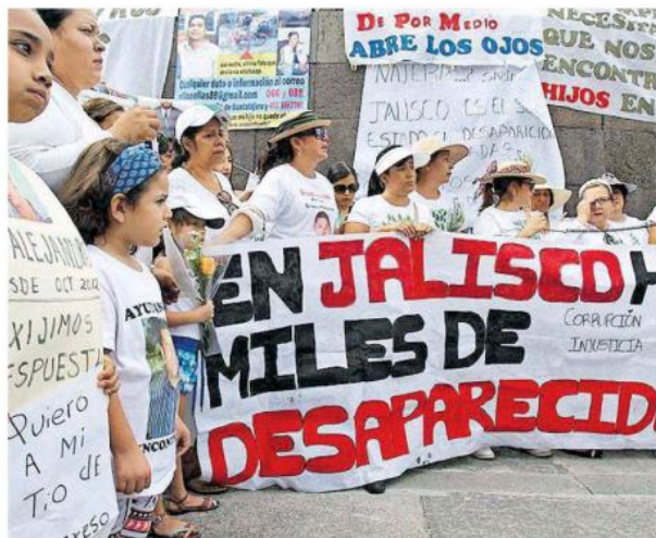
Familias tapatías siguen esperanzadas en poder encontrar a sus seres queridos.

De acuerdo a las cifras del SISOVIED, los municipios en donde hay más hombres desaparecidos son: Guadalajara, Zapopan y Tlaquepaque; mientras que Zapopan, Guadalajara, Tlaquepaque, El Salto y Tlajomulco, son las localidades con más mujeres desaparecidas.