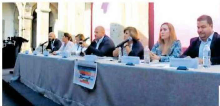
Ayer por la tarde presentó la segunda etapa de la estrategia integral.

A la fecha se han localizado a dos mil 153 personas y el "porcentaje en lo que tiene que ver con las tareas de búsqueda nos ha permitido estar por arriba del 52% que evidentemente es un número que no se festeja, sino que se pone sobre la mesa para decir