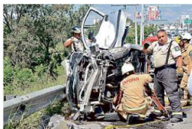
El percance ocasionó un severo congestionamiento vial. Los bomberos de Zapopan accidieron para sacar el cuerpo.

La pareja viajaba en un Matiz que quedó volcado y presionado entre un Ford Fiesta y la barra de contención, sobre la Carretera a Nogales, en sentido hacia Guadalajara,