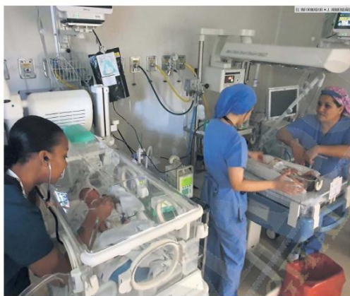
MEJORA. Con la puesta en marcha de la Unidad de Alta Especialidad Materno Infantil, el Hospital Civil "Dr. Juan I. Menchaca" ampliará su capacidad de atención a mujeres embarazadas y recién nacidos; también formará a más personal médico.