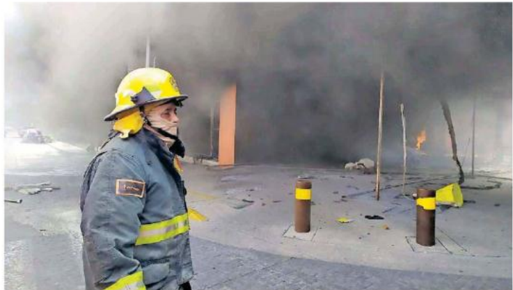
Los hechos en una fábrica de piñatas y dulces en la colonia San Andrés.

Después de varios minutos de labores finalmente lograron apagar el fuego. La Unidad de Protección Civil y Bomberos informó que atendieron a una mujer con crisis nerviosa y a un empleado que sufrió quemadura en un brazo al tratar de sofocar al fuego antes de que llegaran los bomberos.