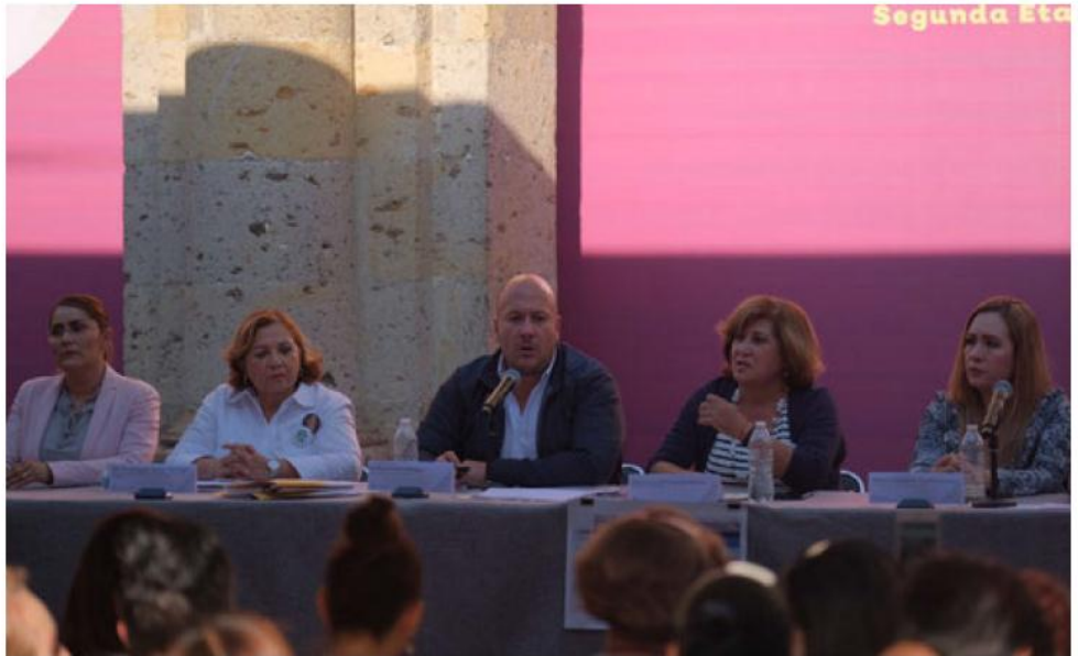
El gobernador Enrique Alfaro anunció la segunda etapa de la estrategia.

Además, han sido inhumadas 167 personas con archivos y traza-