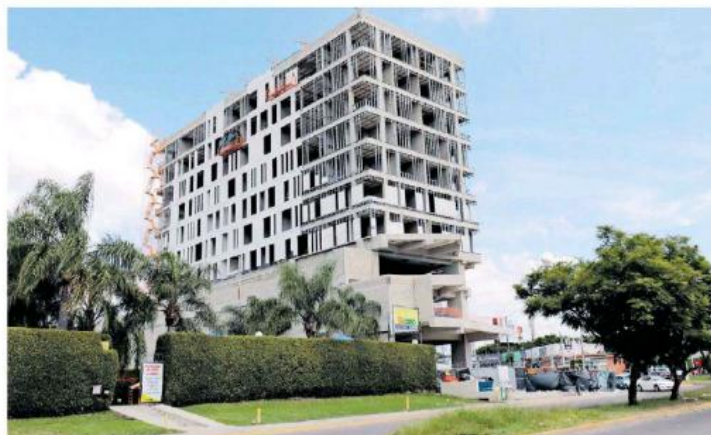
La obra en cuestión en avenida Tepeyac 5048. ANTONIO MIRAMONTES.

DE SEPTIEMBRE del 2018 la PRODEUR presentó la demanda de nulidad.