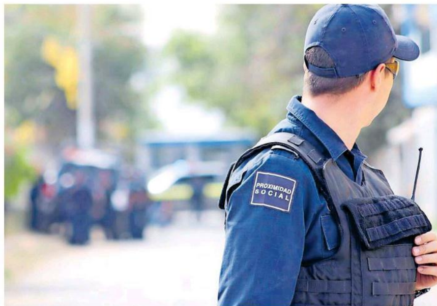
Pese a los operativos de vigilancia, la delincuencia sigue haciendo de las suyas.