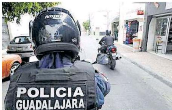
El Centro de Guadalajara encabeza la lista con 303 delitos denunciados.

En la colonia Americana los tres delitos con más denuncias son: robo a persona con 48, robo a negocio con 18 y robo a vehículos particulares con 17.