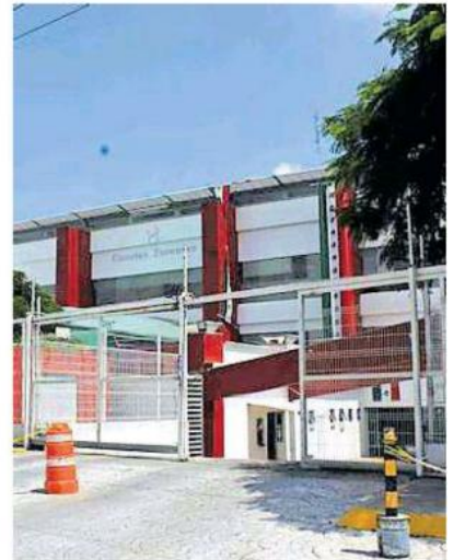
Frios son los números en el tema de personas desaparecidas.