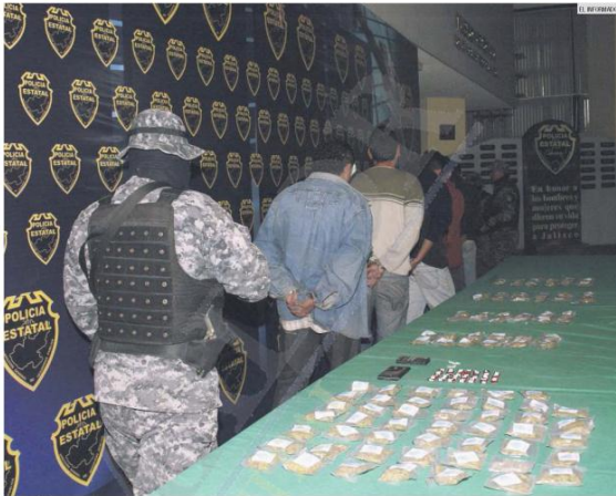
ESTADÍSTICA. La Ciudad de México, Estado de México, Guanajuato y Jalisco son los Estados con más denuncias por narcomenudeo.

Explica que las veces que ha ido la Policía "no encuentran nada", porque las personas se salen antes. "Han ido a catear, pero tienen gente que les avisa en cada esquina, sobre todo si pasa la Policía Federal o el Ejército".