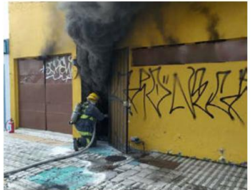
El establecimiento se ubica en San Andrés