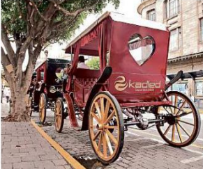
La mayoría de calandrias eléctricas, que deben tramitar placas como cualquier vehículo eléctrico, circula sin las láminas.