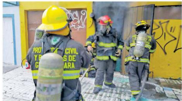
Fiel a su costumbre, los bomberos combatieron hasta el último minuto para sofocar las llamas.