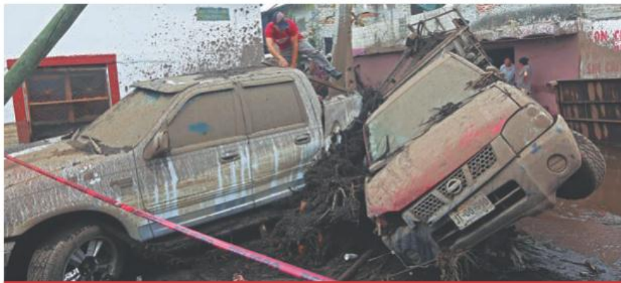
El desmante ocasionó el desbordamiento del río Salsipuedes en San Gabriel, en el que hubo 5 muertos, en junio pasado.

“Lo que veo, sinceramente, es una parálisis”, señaló Esquer sobre Profepa: “lo mencionaría yo en todas las dependencias federales, no hay movimiento en Profepa, ni en Sader federal, ni en todas las dependencias con el desmantelamiento que hizo el gobierno federal, no hay agilidad en la resolución de temas. En las dependencias federales yo exhortaría que se pusieran a chambear para complementar el trabajo que estamos haciendo”.