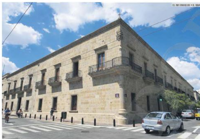
FLAMANTE. Así luce ahora el inmueble del cruce de Hidalgo y Belén.