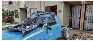
En Tlajomulco hay 68 mil 700 casas abandonadas, de las cuales alrededor de 20 mil están en proceso de invasión.