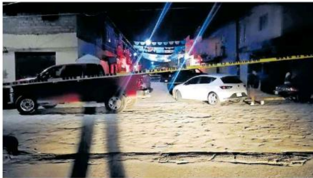
En la colonia Jalisco se armó una riña que dejó saldo de un muerto.

El segundo crimen ocurrió a las 23:40 en el condominio 16 del Fraccionamiento Rinconada del Aire, en las inmediaciones de la Base Aérea Militar.