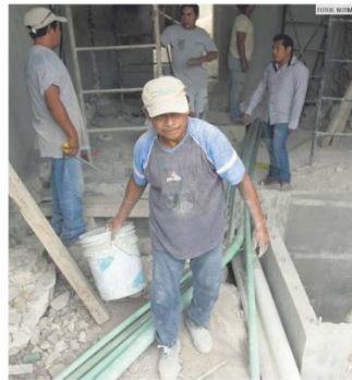
TODO ENTRA. Cualquier modificación en negocio o vivienda debe ser notificada.

En la Zona Metropolitana de Guadalajara se necesita tramitar licencia de construcción para todo aquello que altera la estructura de una vivienda o comercio. Por ejemplo: el reemplazo del piso o del enjarre requiere de licencia, pero cuando se instala una marquesina, se levanta una barda o se abre una puerta o ventana si se requiere de ella. Ante cualquier duda, puede acudir a la Dirección de Obras Públicas de su municipio.