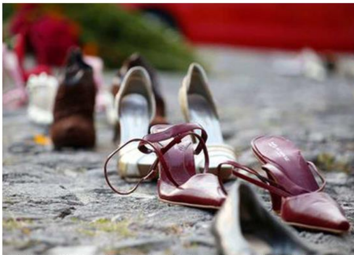
Guadalajara está entre los siete municipios del país, con más presuntos feminicidios.