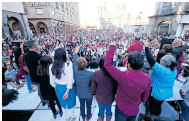
Gran asistencia en el Centro de la ciudad donde estuvieron presentes integrantes de Morena. FRANCISCO RODRÍGUEZ

Según él, a partir del 19 de febrero, fecha en la que podría recibir el reconoci-