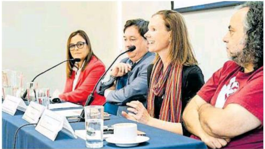
La investigadora tomó como referencia las colonias Buenos Aires, Francisco I. Madero y Francisco I. Madero Segunda Sección.