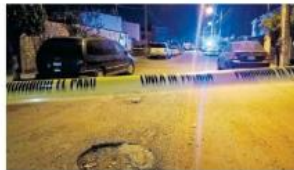
En Rinconada del Aire un hombre recibió un balazo en la cabeza.

En el sitio las autoridades hallaron un casquillo percutido de calibre .40 y un automotor con las puertas abiertas, que