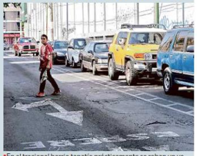
En el tradicional barrio tapatista prácticamente se roban un vehículo cada dos días y encabezaban la estadística en la ZMG.