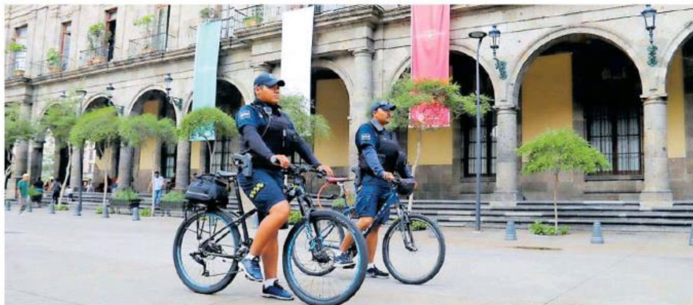
Los uniformados hacen recorridos todos los días a pie, en bicicleta, en motocicleta y en patrullas.