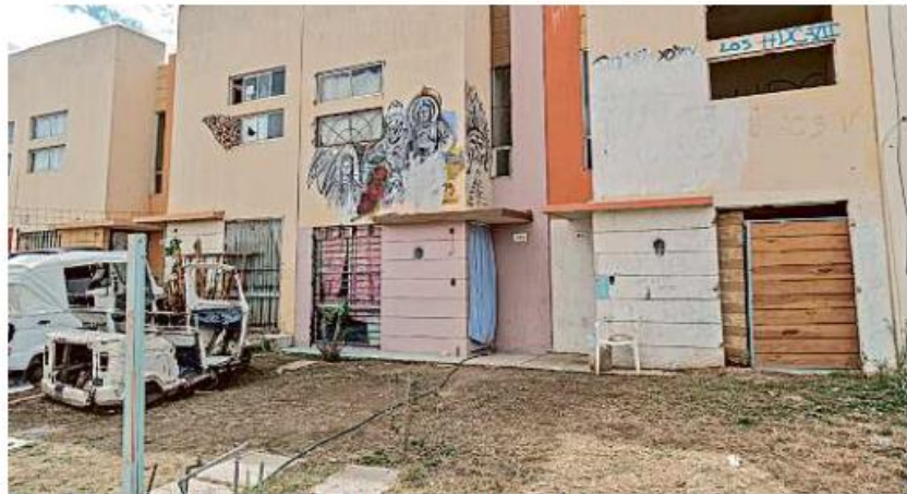
■ Casas en abandono fueron clausuradas con madera, ladrillo, o con rejas soldadas.

La mayoría de casas deshabitadas en la zona son atractivas para los paracaidistas porque tienen garantizado el derecho humano al agua y la electricidad no es difícil conseguirla.