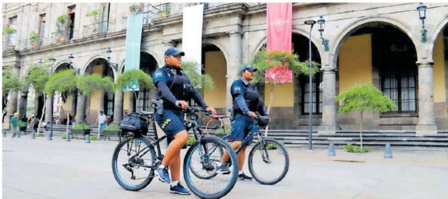
Los uniformados hacen recorridos todos los días a pie, en bicicleta, en motocicleta y en patrullas.