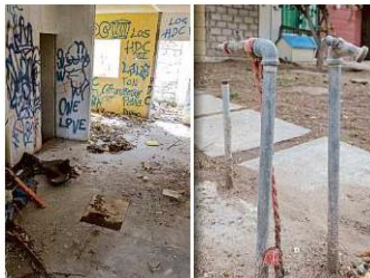
■ Vecinos de Lomas del Mirador buscan impedir que casas abandonadas sean guarida de delincuentes.

Como respuesta, los vecinos clausuran la toma de esos servicios y sellan las viviendas con el riesgo de ser sorprendidos por los legítimos propietarios.