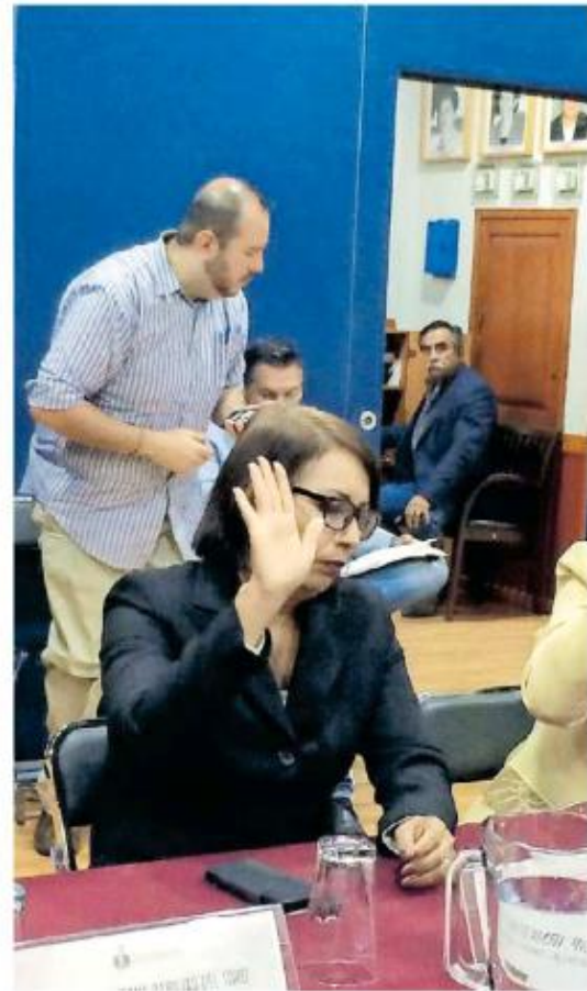
Fue eliminada la sanción para quien no se presente a audiencias para mediar conflictos.

Los ciudadanos que se ausentaran de la cita, debían informar por escrito su voluntad de no someterse a los métodos alternos, y posteriormente a esa acción el asunto era archivado.