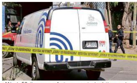
Más de 50 disparos se efectuaron contra las víctimas en la Colonia del Carmen, al sur de la Perla Tapatista.

publicó que Santa Tere fue la colonia con más vehículos robados en la zona metropolitana entre enero y noviembre del año pasado, con un total de 150 unidades. Además registró el mayor número de denuncias por robo de autopartes (74), según la Fiscalía del Estado. La cantidad de casos, sin embargo, podría ser mayor, pues cada denuncia puede contener más de una unidad robada. Santaterense.mx, que representa a un sector de la zona, también manifestó su inconformidad por utilizar términos como la "colonia con más robos" o "la más golpeada de 2019", a pesar de estar respaldados por cifras oficiales. Añadió que el módulo de seguridad reportado como abandonado está así por estrategia.