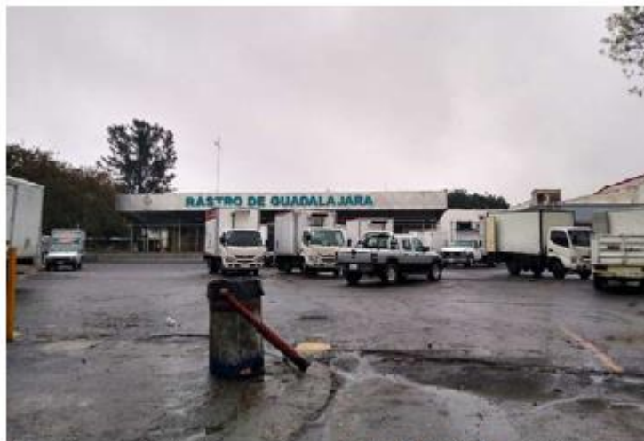
El rastro municipal no cuenta con planta tratadora. ESPECIAL

También indicó que desde hace 12 años el rastro de Guadalajara no cuenta con una planta de tratamiento, aunque recibe el servicio de la empresa Hasar's. Al año pagan aproximadamente tres millones de pesos por el destino final de los residuos. ■