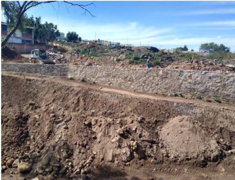
Especialista dice que el mehojo está en la forma como se está urbanizando la ciudad.