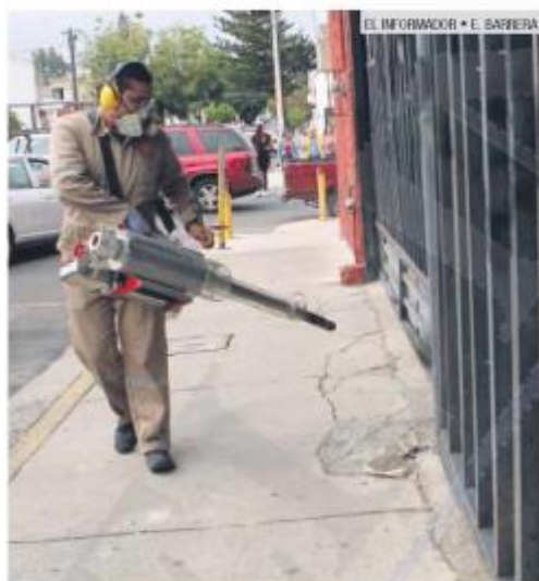
PREVENCIÓN. Operan 800 brigadistas estatales.

Los casos de dengue registrados en Jalisco en las primeras cinco semanas de 2020 crecieron 27% en comparación con el mismo periodo de 2019, y de acuerdo con los registros de la Secretaría de Salud federal, fue el inicio de año con mayor incidencia de la enfermedad de los últimos cinco años.