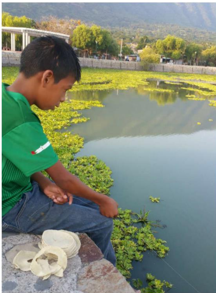
Jalisco ocupa el séptimo lugar, a escala nacional, por defunciones de enfermos renales. MRB

"Me parece que aquí tenemos que sentar a los actores relevantes de este asunto para consensuar una estrategia y necesariamente tienen que estar también la industria. Tenemos que llegar a acuerdos con ellos porque no podemos nosotros dejarlos a un lado y nada