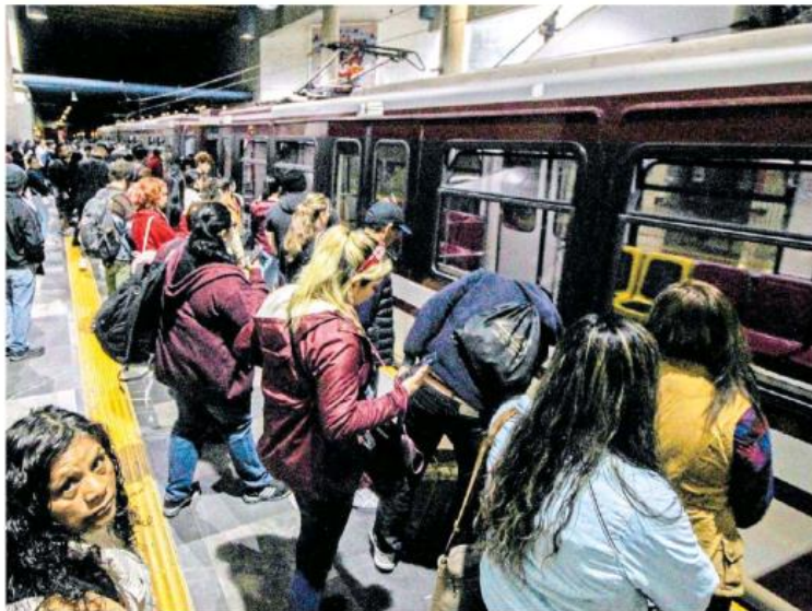
Hora pico en la estación Juárez, es un verdadero calvario.

Sin embargo, más allá de los pendientes de la L3, la realidad es que la Línea 1 y 2, que en conjunto realizan 275 mil viajes por día, representan un mínimo aporte para la movilidad en la ciudad, tomando en cuenta la cantidad de viajes en otros sistemas de transporte colectivo, siendo los camiones los principales, con más de 2 millones 304 mil viajes. Pág. 16 y 17