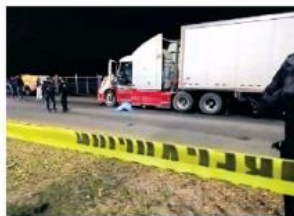
El ahora occiso se habría resistido a un asalto.

Los dos asaltantes escaparon sin consumir el atraco. A los pocos minutos llegaron choferes de otros tráileres, quienes fueron los que identificaron a su compañero.