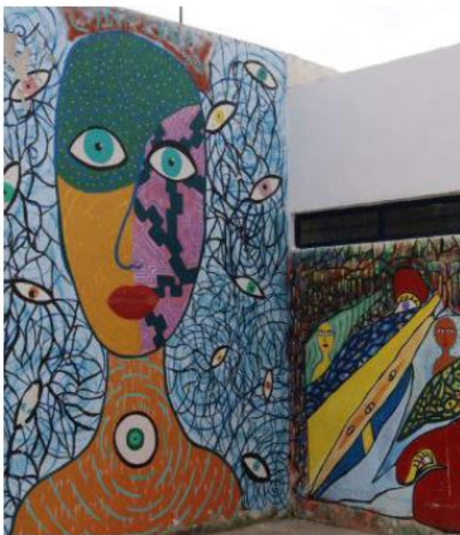
Artistas participaron en la rehabilitación de espacios.

Destaca que en las instalaciones del CIAC de Miravalle se cuenta con áreas habilitadas para la promoción de diversos talleres y servicios públicos gratuitos; las actividades son permanentes y en