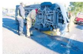
En el hecho un automotor quedó volteado.

Los oficiales, únicamente se encontraron dos vehículos siniestrados, se trataba de un vehículo del SIAPA el cual estaba volcado sobre el lado del conductor; así como una camioneta tipo familiar en color