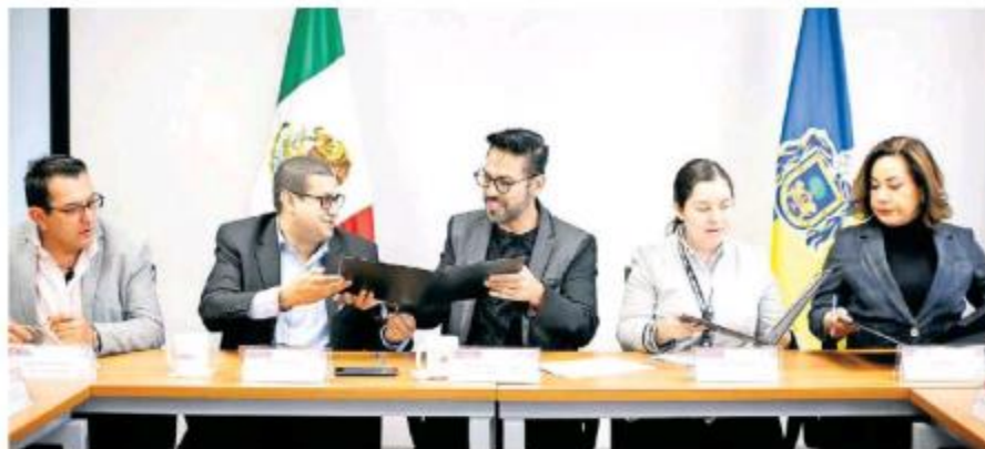
Firma del acuerdo entre Jalisco y la ONU.