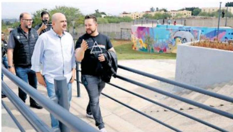
El alcalde recorrió la skatopista.