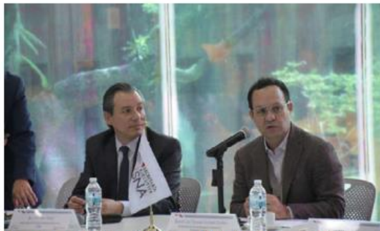
Ayer el senador (derecha) presentó dos iniciativas.

“Lo digo como autocrítica, hemos sido incapaces de completar el propio SNA en términos nominales. Hoy por hoy, no tenemos el tribunal administrativo o justicia administrativa, incluso hay una serie de propuestas que estarían planteando modificar, sino es que retroceder en la materia (...) Hay una diferencia conceptual en la manera en que tenemos que enfrentar el problema de corrupción. Nosotros tenemos la firme convicción de que la corrupción es un problema de carácter sistemático y como