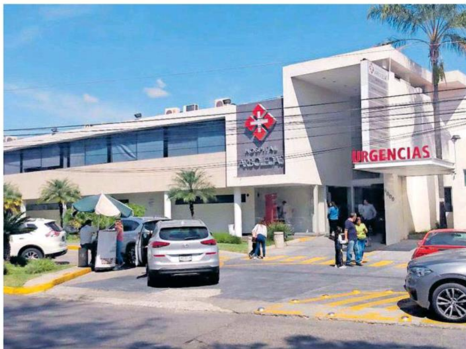
Rosa Isabel recibió un impacto de bala en la mejilla derecha y una esquirla se alojó en su ojo.