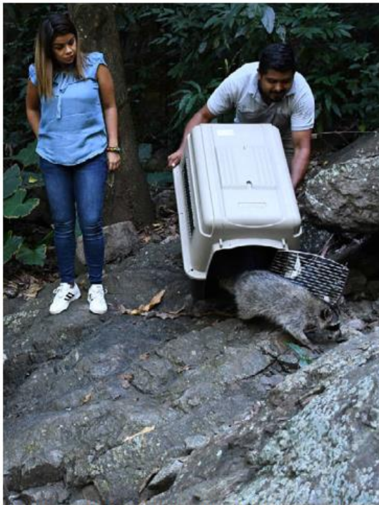
Fueron liberados en el Parque Ecológico Huilotán.

En caso de cualquier situación, la ciudadanía se podrá poner en contacto con la Dirección de Protección Animal, al teléfono 3633-4703, 3818-2200 extensión 3285,