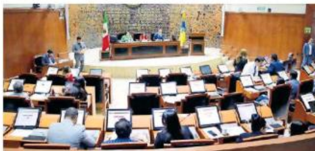
Se aprobó el formato de la Glosa del Primer Informe de Gobierno de Enrique Alfaro.

La mesa de Coordinación Estratégica de Desarrollo Social, será el viernes 15, tendrán como invitados al Poder Legislativo a los secretarios de Educación, Salud, Cultura, de Asistencia Social, de Igualdad Sustantiva entre Hombres y Mujeres, así como los titulares del CODE y la Procuraduría Social.