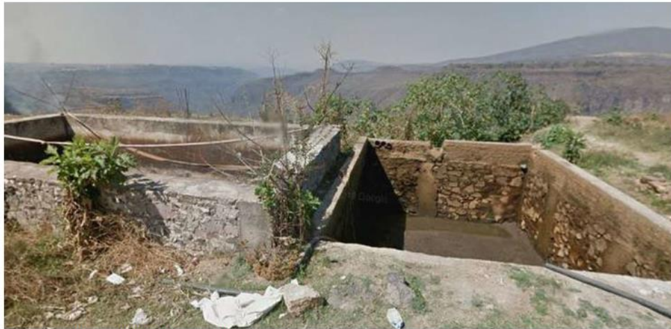
Fueron encontrados adentro de tres vehículos. ESPECIAL