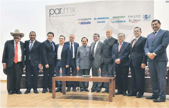
TORREÓN. En el Tercer Foro Regional sobre Federalismo Fiscal se abordaron los problemas que enfrentan los Gobiernos estatales y municipales. Autoridades, legisladores y académicos plantearon sus inquietudes.