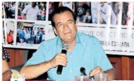
Destaca 106 iniciativas en favor de los jaliscienses.

Manifestó que su voto ha sido congruente