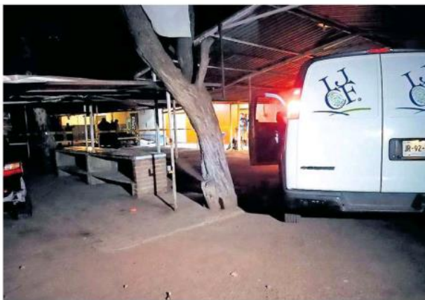
Un taxista de 37 años fue victimado a balazos en calles de la colonia Jauja, en el municipio de Tonalá.

Minutos después, policías municipales hallaron el vehículo de alquiler, Nissan