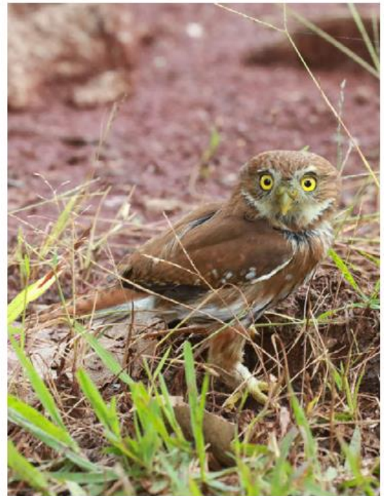
Se buscaron zonas acordes. ESPECIAL

“La recomendación es no dispararles, tenemos una gran bio-