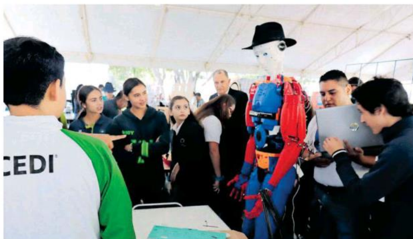
Este evento se contará con talleres y el pabellón denominado "Un viaje por la ciencia".