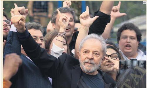
LIBRE. Tras 560 días preso, el ex presidente de Brasil, Luiz Inácio Lula da Silva, dejó la cárcel. Al grito: "Lula libre! Lula libre!", el ex mandatario quedó en libertad, gracias a un resolutorio del Tribunal Supremo de esa nación que declaró inconstitucional la prisión para una persona condenada, antes de agotar todos los recursos en la justicia. "Salgo de aquí con un gran sentimiento de agradecimiento. Quiero probar que este país puede ser mucho mejor cuando tenga un Gobierno que no mienta", fueron sus primeras palabras. Da Silva fue encarcelado en 2017 bajo cargos de presunta corrupción.