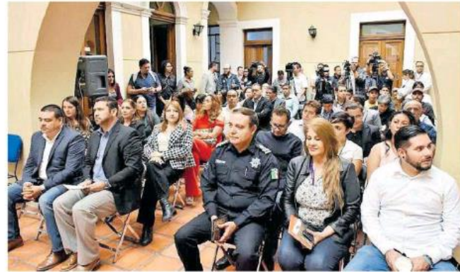
La Comisión Estatal de los Derechos Humanos instalaron el instrumento legal.

ral de esta Comisión, explicó que este mecanismo inicialmente conformará el área de Supervisión Penitenciaria y Prevención y Combate a la Tortura, desde donde se trabajará bajo las dimensiones de defensa, que es la integración de quejas relacionadas con centros de reclusión o detención en los que se encuentran personas privadas de su libertad y quejas relacionadas con la tortura.