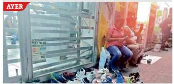
Por la tarde de ayer, comerciantes ya invadían la acera.