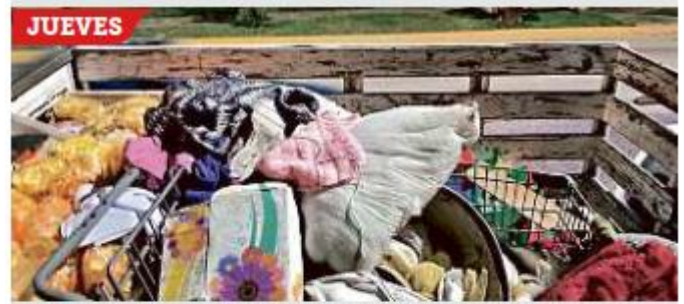
El jueves en la noche se levantó mercancía y a personas.

El Jefe de Gabinete afirmó que los operativos continuarán ya que se pretende mantener un orden en el comercio ante la llegada de la época navideña.