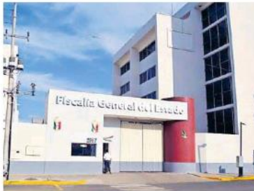
Los uniformados se dirigían rumbo a Puerta Vallarta para realizar una diligencia.

El tercero se desempeñaba como policía de la Comisaría de Zapopan. El cuarto