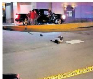
Los tres murieron debido a heridas por proyectil de arma de fuego.

La Fiscalía informó que uno de ellos era vecino de Ahome, Sinaloa.