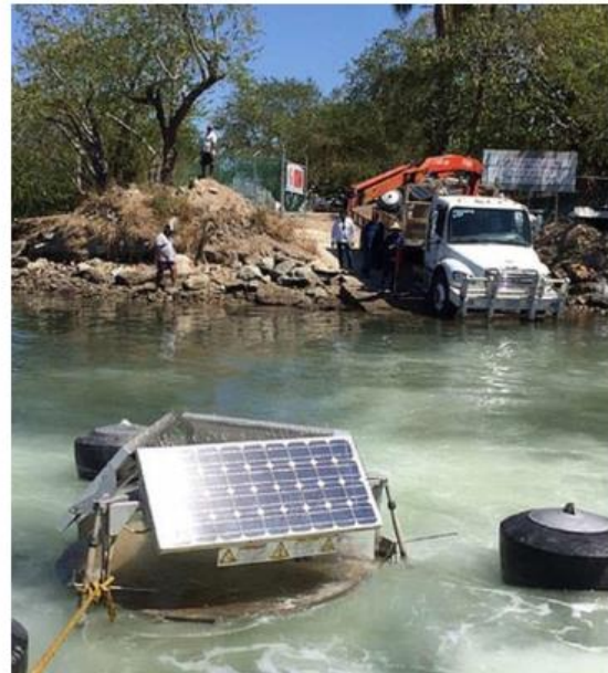
Piden participación de vallartenses.

La estrategia de integración comprende dos etapas: la primera son unas mesas de trabajo y la segunda será un ejercicio consultivo. ■