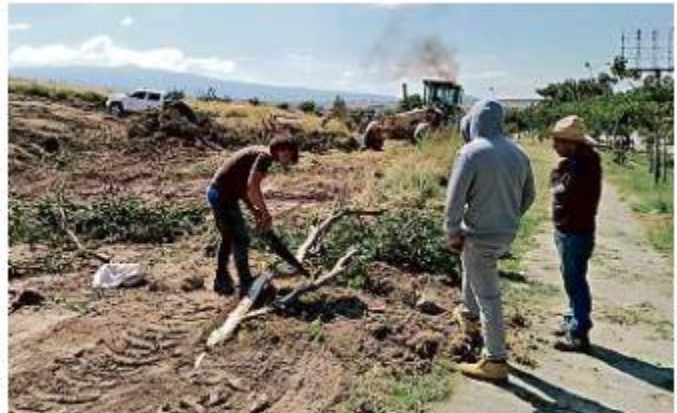
Trabajadores talaron ayer árboles de hasta 3 metros, denunciaron vecinos; más tarde, Tlajomulco clausuró.