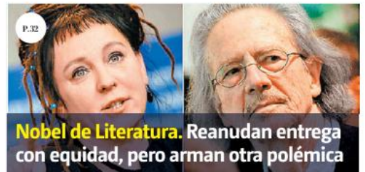
Nobel de Literatura. Reanudan entrega con equidad, pero arman otra polémica

El equipo jalisciense consiguió la cuarta victoria de la temporada, y la segunda consecutiva, al vencer 85-75 a los de Querétaro. Con este resultado, los liderados por Rafael Cruz han ganado confianza para su encuentro del próximo domingo. FERNANDO CARRANZA PAG. 45