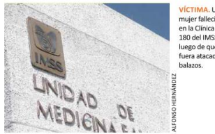
VÍCTIMA. Una mujer falleció en la Clínica 180 del IMSS luego de que fuera atacada a balazos.

A su arribo, la Policía encontró a un hombre de entre 25 a 30 años y a otro de entre 35 a 40 años con heridas por proyectil de arma de fuego. Al