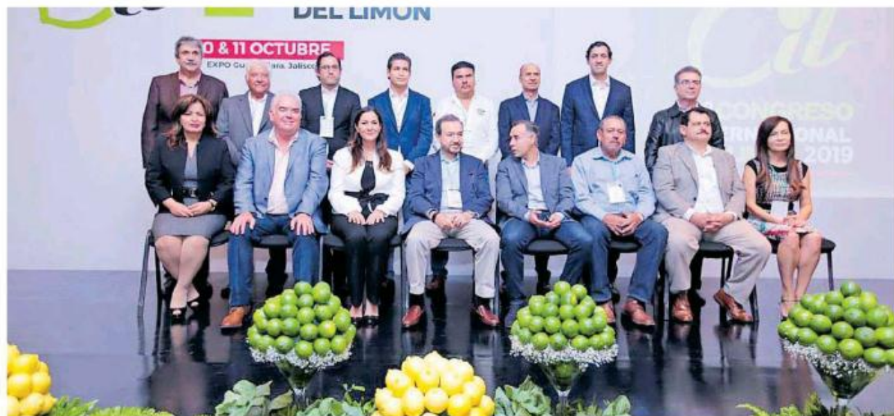
El estado cuenta cuenta con una superficie de 12,000 hectáreas plantadas de limón.

Esto colocará, sin duda, al limón Persa como el tercer cultivo en valor de la producción en el estado, sólo después de las berries y el aguacate.