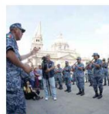
DE BUENAS. La Banda del Colegio del Aire brindó un concierto en el Centro de Guadalajara.

¿El objetivo? Ninguno en especial, simplemente regalar a los tapatíos los turistas un momento de recreación, un flashmob que rompió la monotonía del Centro de Guadalajara.