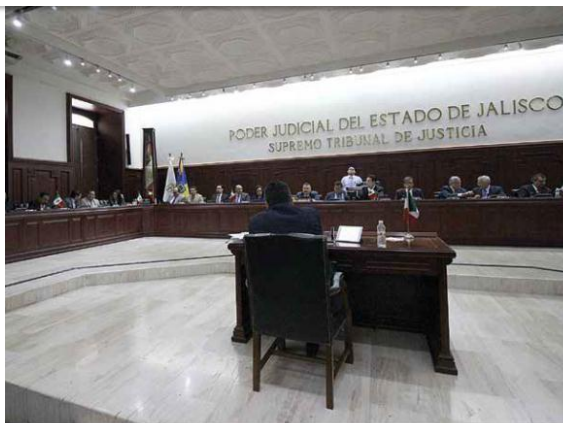
TRAS RETIROS. Actualmente sólo hay 27 de 34 magistrados posibles en el Supremo Tribunal de Justicia del Estado de Jalisco.

● Con estos cambios, añadió, se darán garantías a la sociedad de que ahora sí no habrá margen para un Poder Judicial corrupto