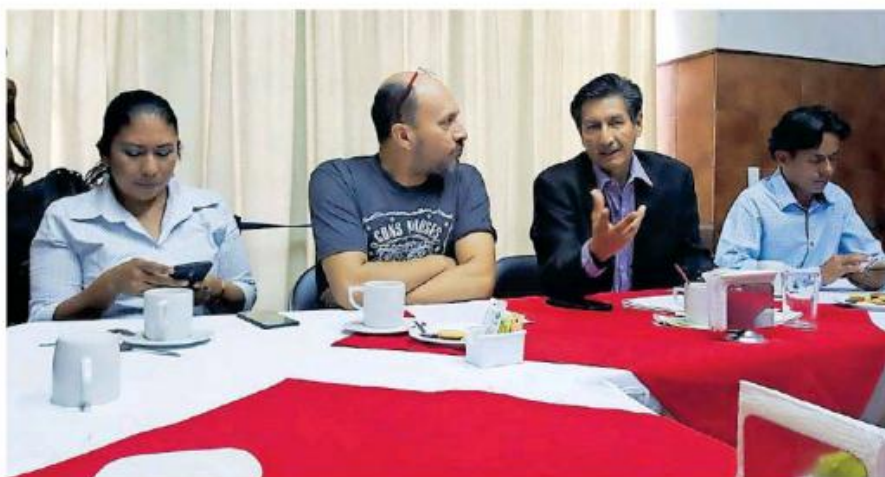
Simpatizantes de Morena ofrecieron una conferencia de prensa para informar su percepción.

"Morena parece ser un club exclusivo; está