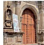
Tras el asalto, las puertas del templo en el Centro tapatio estuvieron cerradas.

Con éste en el Municipio surtaron 11 robos a templos desde que inició la Adminis-