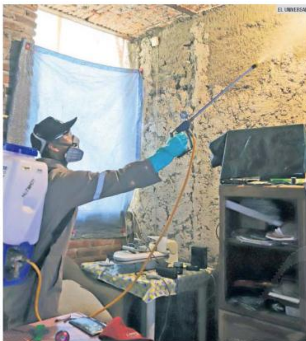
INCIDENCIA. El último corte registra cinco mil 704 casos de dengue en Jalisco.

Hasta la semana 40, la Secretaría de Salud federal documentó cinco mil 704 casos de dengue confirmados en Jalisco. El número de muertes por esta causa en el Estado se mantiene en 13. Sin embargo, se analizan 48 más.