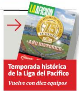
Temporada histórica de la Liga del Pacífico Vuelve con diez equipos

El mandatario llama a poner orden en el sector inmobiliario para no entregar permisos donde no hay servicios básicos. PAG. 18 A 20