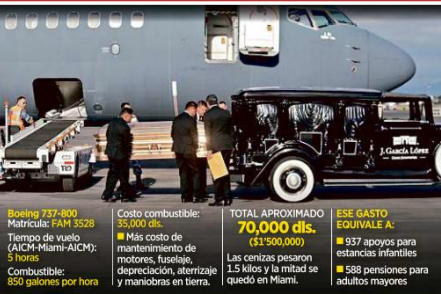
Boeing 737-800 Matricula: PAM 3528 Tiempo de vuelo (AICM-Miami-AICM): 5 horas Combustible: 550 galones por hora

Costo combustible: $5,000 dls. Más costo de mantenimiento de motores, fuselaje, depreciación, aterrizaje y maniobras en tierra. TOTAL APROXIMADO 70,000 dls. ($1,500,000) Las cenizas pesaron 1.5 kilos y la mitad se quedó en Miami. ESE GASTO EQUIVALE A: ■ 937 apoyos para estudiantes infantiles ■ 588 pensiones para adultos mayores