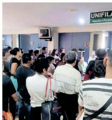
Signe en aumento la cifra de casos de dengue.

MIL 229 casos son probables pero no han sido confirmados.