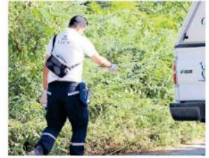
Hallaron el cuerpo en un potrero.