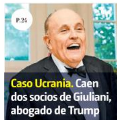
Caso Ucrania. Caen dos socios de Giuliani, abogado de Trump