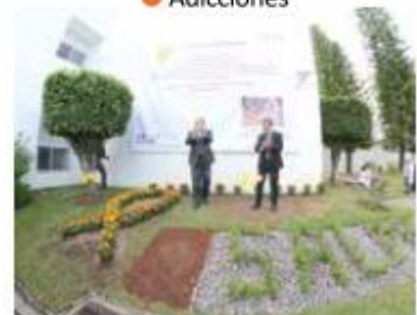
ENTRE FLORES. El Salme presentó el jardín Un árbol dondequiera.