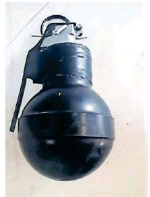
Este artefacto es de uso exclusivo del Ejército.

Por lo anterior, fue detenido y turnado al fiscal federal, quien lo puso a disposición del Juez antes referido, quien dictó la sentencia en mención, misma que fue