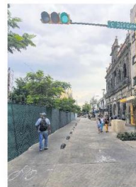
A MEDIAS. Muchos creen que la obra no terminará nunca entre las calles Reforma y San Felipe.

negocios, al menos, han cerrado debido a la escasez de clientes, derivado de los más de cuatro años de obras en el corredor del Paseo Alcalde.