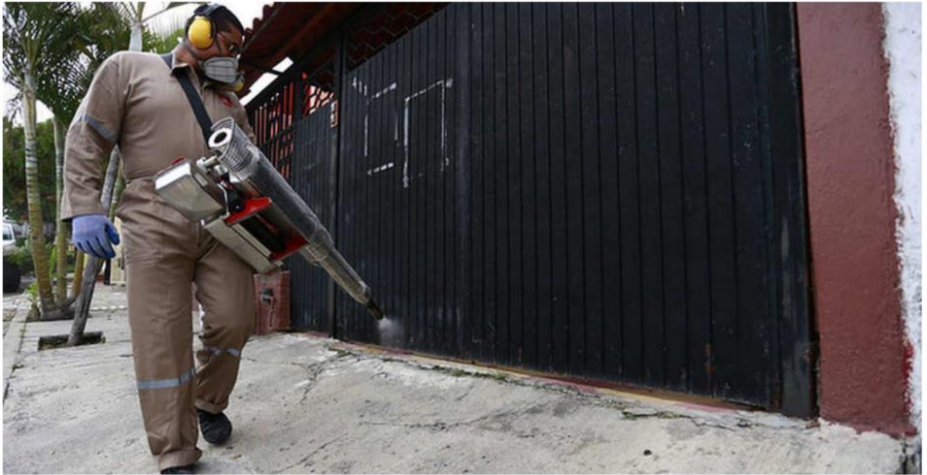
La fumigación es solo un recurso en el combate a la propagación de la enfermedad. ESPECIAL