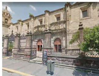
EN EUCHARISTÍA. El sitio del atraco se encuentra ubicado en el cruce de Morelos y Enrique González Martínez, en pleno Centro de Guadalajara.

Se desconoce la ruta de escape o el vehículo que utilizaron los asaltantes para alejarse del sitio. Cuando llegó la Policía de Guadalajara al templo de Jesús María las personas afectadas ya