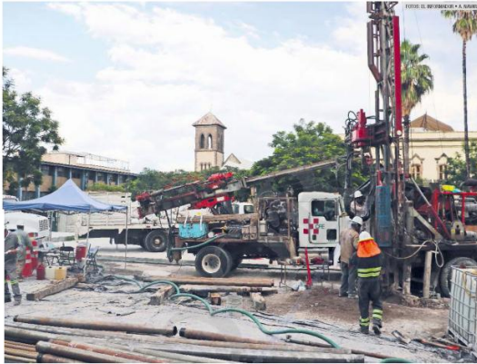
ETNERO PADECEER. Son pocos los comerciantes del Centro Histórico de Guadalajara los que han soportado más de cuatro años en obras.