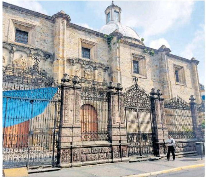
Los delincuentes se llevaron celulares y dinero.

llegaron al lugar para tomar conocimiento del hecho, así como para recabar las características de los causantes y dar con su paradero. Además las cámaras de los alre-