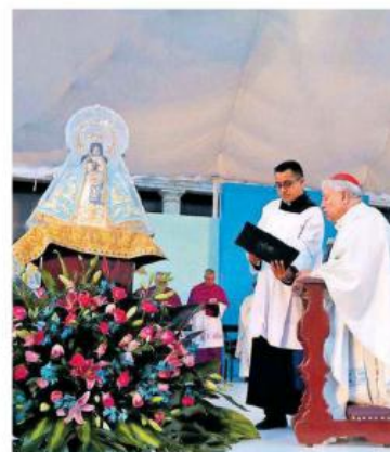
Con la misa de patrocinio inicia la Romería.

En enero del 2021 se celebrará el 100 aniversario de la coronación pontificia de Nuestra