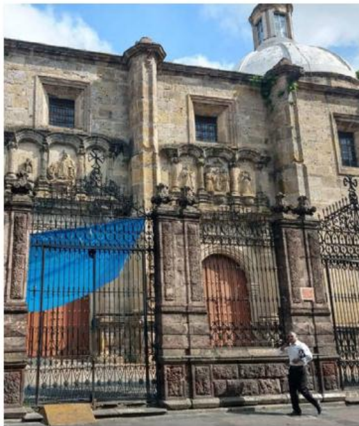
El hecho ocurrió en la mañana.