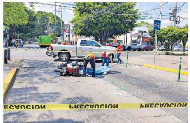
El lamentable hecho ocurrió en la colonia Americana.

El conductor fue detenido y remitido al Ministerio Público para que determine su situación legal. Así suman 23 personas que han perdido la vida en accidentes de transporte público en la ZMG en este año.