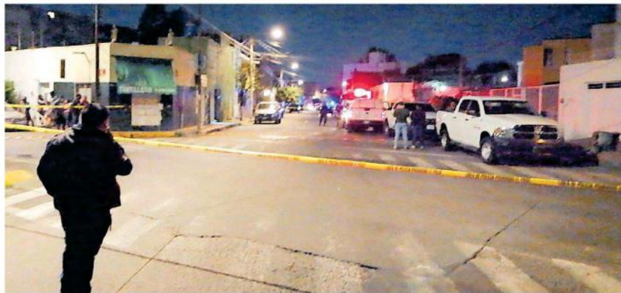
Tres personas fallecieron a balazos en plena vía pública.

Uno de los fallecidos era el dueño del negocio y el otro su cliente, indicaron policías municipales.