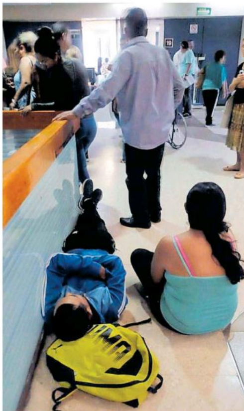
Los centros de salud lucen llenos de pacientes con sospecha de dengue.

Han identificado daño multiorgánico, principalmente hígado "Es mucho más el daño hepático en pacientes con encefalitis por dengue, ninguno con Guillain Barre todavía."