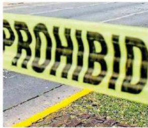
Ayer se registró el ataque.

Posteriormente se generó una persecución por la carretera San Gabriel-Sayula, la cual concluyó a unos 20 minutos del ingreso a este último municipio, después de que los civiles armados fueron perdidos de vista cerca del ran-