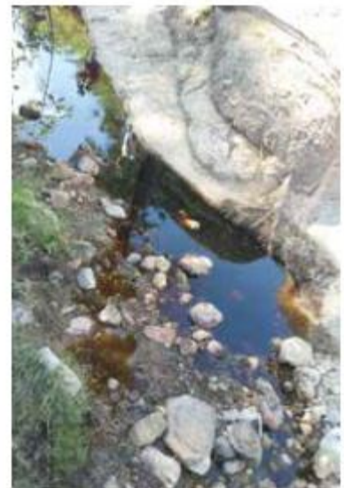
SUCIEDAD. Los lixiviados afectan al río La Soledad.

La misiva, que además va acompañada de una queja en la Comisión Nacional de los Derechos Humanos por incumplir la obligación gubernamental de dotar a los ciudadanos de un medio ambiente sano, pide atender la salud de las poblaciones afectadas y hacer visitas de inspección a los tiraderos Picachos y Hasars, pues de lo contrario cerrarán el acceso a ambos el 12 de octubre.