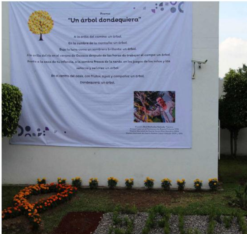
Inauguran jardín temático en el Instituto Jalisciense de Salud Mental.

El Instituto cuenta con 18 Módulos de Salud Mental y ocho Centros Integrales de Salud Mental.