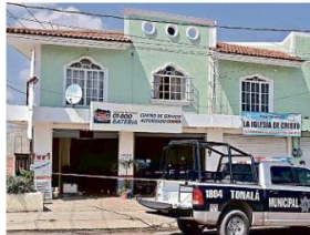
■ Este año, con corte al mes de septiembre, en el Municipio de Tonalá se denunciaron mil 406 robos a negocios.

Entre octubre de 2018 y septiembre de 2019 en la Cuna Alfarera se denunciaron 2 mil 83 robos de vehículos, mientras que en el mismo lapso entre 2017 y 2018 aumentaron mil 597, un aumento