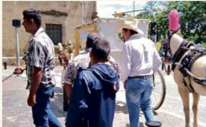
El hecho ocurrió el 2 de octubre en el Centro tapatío.

Indicó que aunque ella pidió ayuda a las policías viales, éstas se negaron.