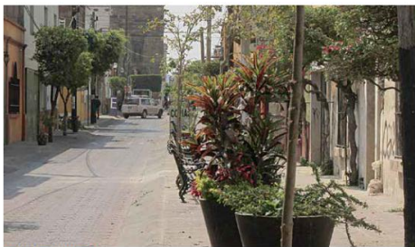
EN UNA PELUQUERÍA. Un hombre de entre 25 y 30 años y otro de entre 35 a 40 fueron asesinados con una arma de fuego en la Zona Centro de Tlaquepaque.