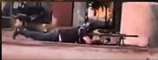
Un miembro del Cártel de Sinaloa el pasado 17 de octubre en Culiacán, Sinaloa.