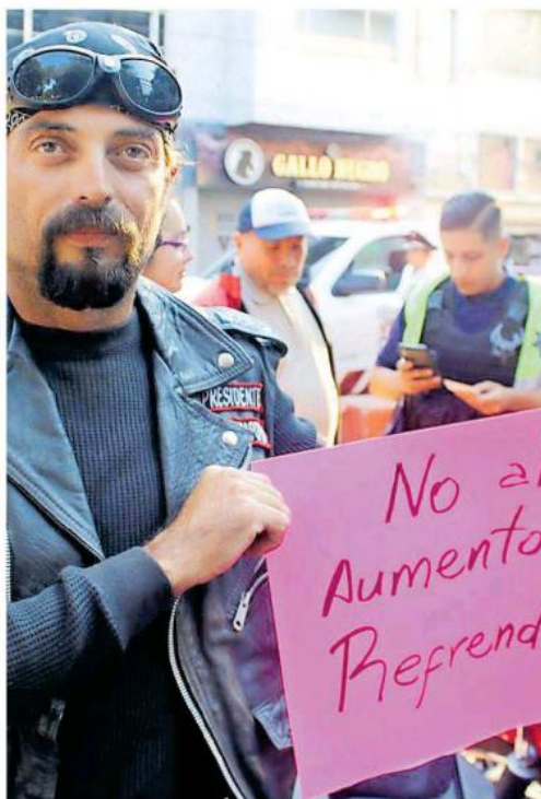
Organizaciones de motociclistas se han manifestado afuera del Congreso.

El gremio refirió que no se manifestarán pero que quedarán al pendiente a expensas de que legisladores cumplan o no su palabra.