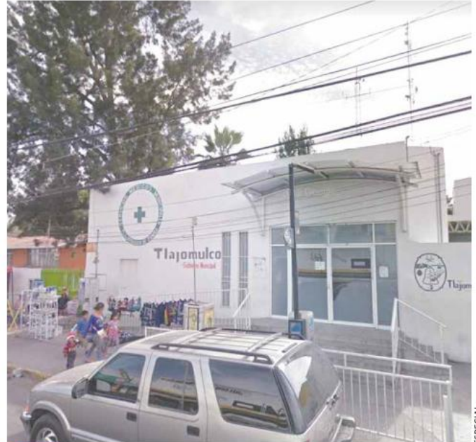
TRAGEDIA. Paramédicos de la Cruz Verde confirmaron la muerte de la menor.

Los agentes municipales resguardaron el lugar en torno al cuerpo para facilitar las labores del personal del Instituto Jalisciense de Ciencias Forenses (IJCF) y de la