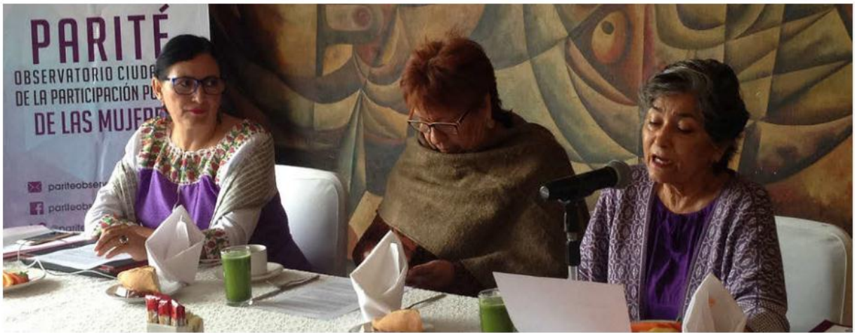
El Observatorio Ciudadano de Participación Política de las Mujeres de Jalisco destacó los pendientes.