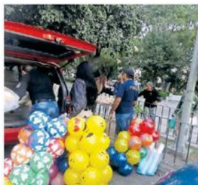
Los niños recibieron de la mano de los elementos, variedad de pelotas.

La dependencia detalló que tanto los juguetes, el chocolate y las piezas de pan se adquirieron con recursos aportados por los propios policías municipales de Tlaquepaque.