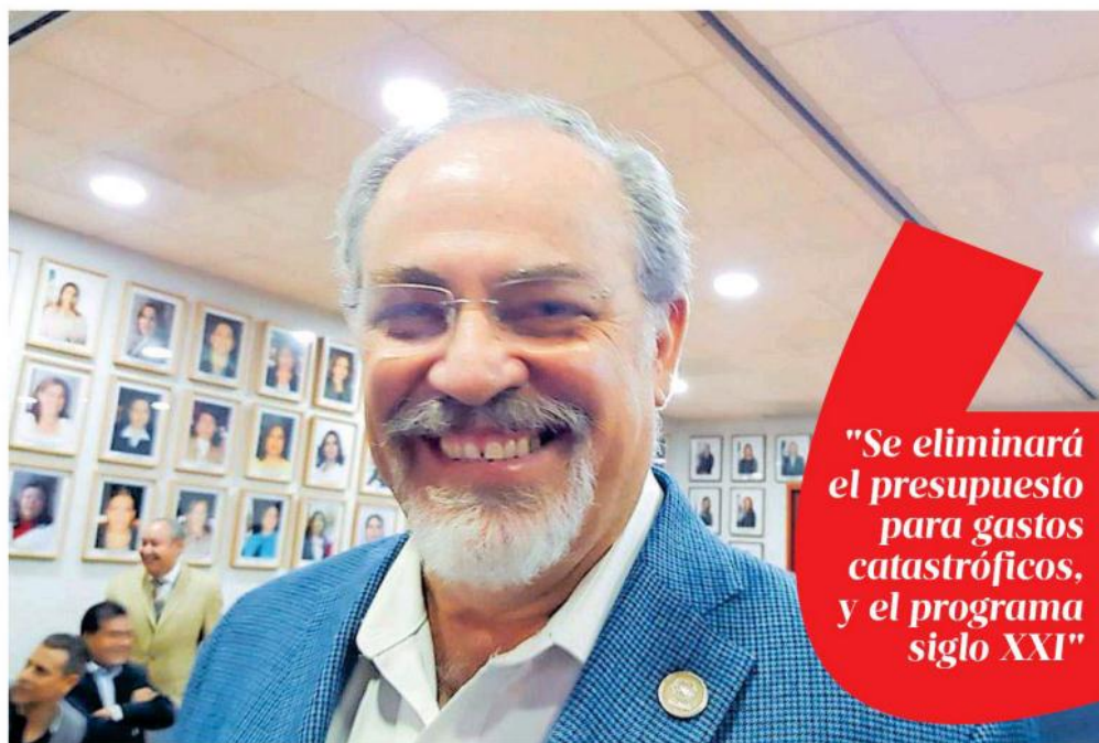
En entrevista para EL OCCIDENTAL, el funcionario explicó algunos aspectos del programa que sustituirá al Seguro Popular.

"Se eliminará el presupuesto para gastos catastróficos, y el programa siglo XXI"