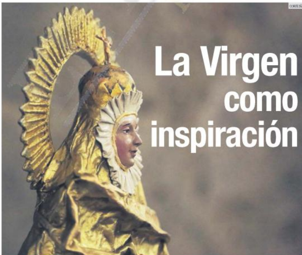
"INMACULADAS". La exposición muestra Vírgenes creadas con diferentes técnica artesanales.

La Secretaría de Desarrollo Económico (Sedeco), a través de la Dirección de Fomento Artesanal, presentó la exposición "Inmaculadas: devoción, culto y tradición", con la que se busca promover y preservar el valor de las artesanías como herencia viva de una tradición creativa.