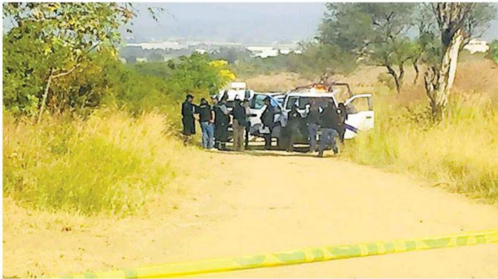
Del o los causantes no se tiene información.