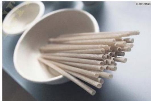
USO. Aumenta el consumo de popotes elaborados con materiales amigables en diversos restaurantes de la ciudad.

La Semadet afirma que la NAE fue consensuada con empresarios del plástico en Jalisco, se realizaron nueve mesas de trabajo en las que participaron los productores y se calcula que hay empresas que ya cumplen con 20% de reciclado que se pedirá en el primer año.