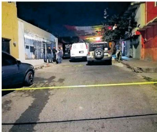
El hallazgo se dio en el cruce de las calles San Miguel y La Piedrera, en la mencionada colonia.