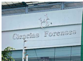
Varias morgues del Estado se encuentran rebasadas.

"A la fecha, Comisión de Búsqueda no cuenta con su reglamento interno pese a que el mismo decreto (de