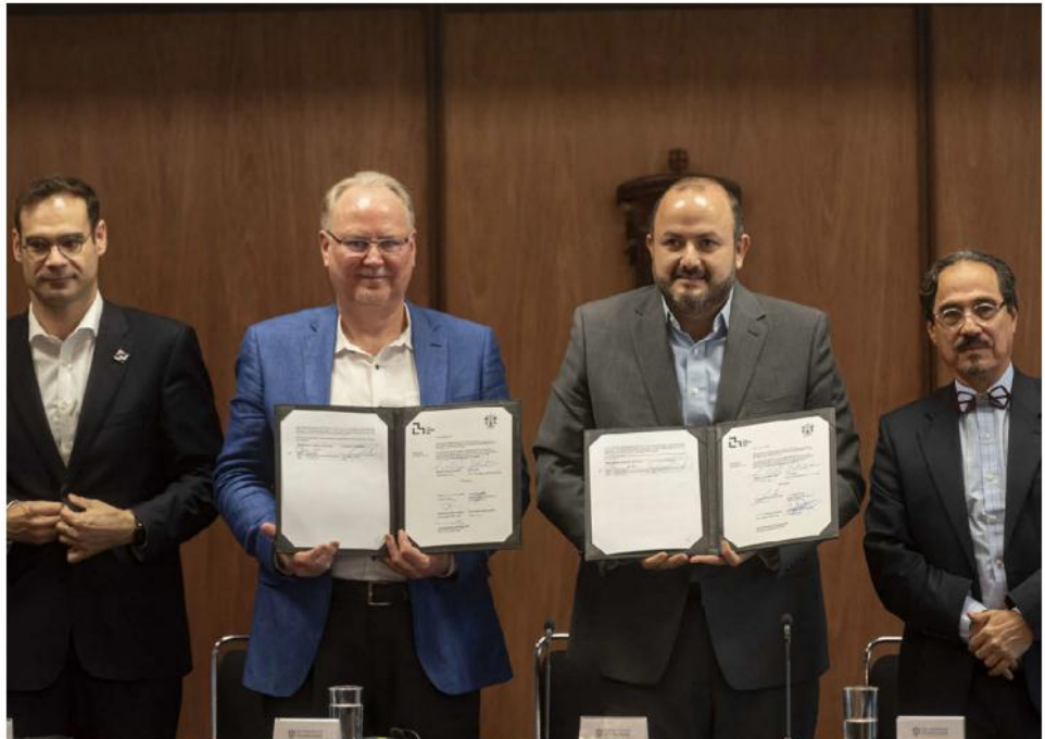
Los representantes del MIT y la UdeG coincidieron en la necesidad de generar una urbanización responsable.