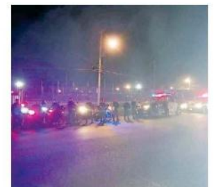
El despliegue policial se lleva a cabo con un estado de fuerza de 24 elementos.