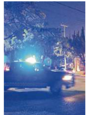
Clientes de restaurantes y bares en Providencia acusan ser cazados por policías.

Se reportó que al menos entre el 17 y el 22 de noviem-