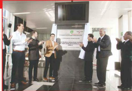
SIN ACABAR. Pese al retraso en las obras de la L3, a fines de noviembre del año pasado Peña Nieto vino a Jalisco para inaugurar la etapa de pruebas del megaproyecto.