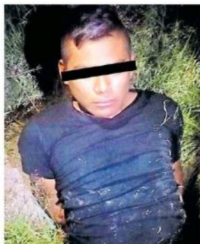
La víctima reconoció que el sujeto la tenía retenida por la fuerza.

Hasta donde se sabe, la mujer no fue identificada, sin embargo se investiga si se trata de una joven reportada como desaparecida.