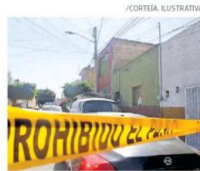
Los socorristas, vieron a una mujer la cual presentaba huellas de asfixia.

Al llegar los socorristas, vieron a una mujer la cual presentaba huellas de asfixia, que a decir del propietario del establecimiento era su empleada.