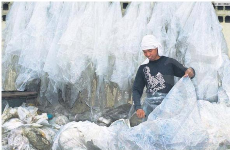
CICLO. Empresarios del sector plástico tendrán que captar el material y reciclarlo para la elaboración de productos, de acuerdo con la nueva norma estatal.

"A nosotros nos toca emitir la norma que ya está, ser el lugar de control que emite el reglamento de certificación y que además proveerá a los municipios un padrón de productores certificados", añadió el director.