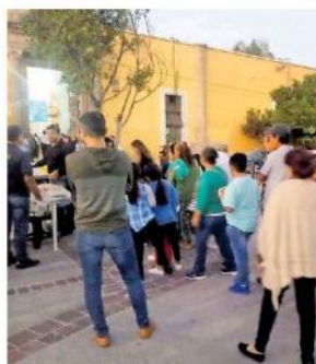
Esto se llevó a cabo en el Antiguo Hospital Civil.