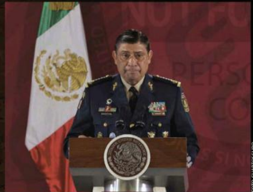
El secretario de la Defensa Nacional, Luis Crescencio Sandoval, informó que el disparo de un fusil Barret le destruyó la pierna a un soldado en Culiacán.