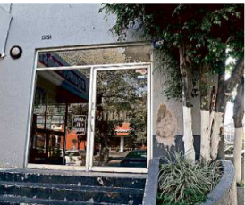
Un bar ubicado en Avenida Vallarta fue sede de una posada de trabajadores de un restaurante de sushi.

Los presuntos responsables, identificados como Julio "N", Juan "N", Iván "N", Pedro "N", Armando "N" y Gerardo "N" fueron remitidos ante el Ministerio Público.