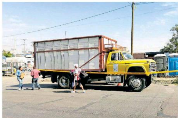
Los detenidos habrían cortado siete árboles.

En la acción los policías aseguraron motosierras y el camión donde cargaban los árboles talados.