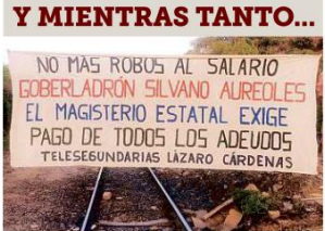
Justo cuando se firmaban los acuerdos del T-MEC, que impulsa el libre flujo de mercancía, la CNTE bloqueó vías del tren en Michoacán, paralizándolo durante 10 horas el puerto de Lázaro Cárdenas.

Martínez Rojas señaló que los cambios son trascendentes para las empresas porque deberán poner atención al debido cumplimiento de la reforma laboral, bajo el riesgo de que les impidan exportar a EU. La nueva vigilancia laboral, así como reglas más duras en insumos para el sector automotor y vigilancia