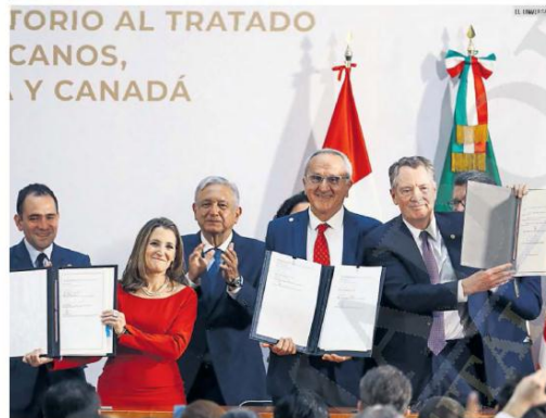
CAMBIOS FIRMADOS. De izquierda a derecha: Arturo Herrera, secretario de Hacienda; Chrystia Freeland, viceprimera ministra de Canadá; Andrés Manuel López Obrador, Presidente de México; Jesús Seade, subsecretario para América del Norte de la Secretaría de Relaciones Exteriores; y Robert Lighthizer, representante comercial de Estados Unidos.