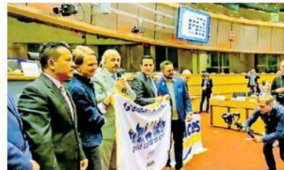
Se llevó a cabo la ceremonia de entrega de reconocimientos en el Parlamento Europeo.

En esta ceremonia también se entregaron otros reconocimientos a ciudades europeas destacadas por su aporte en