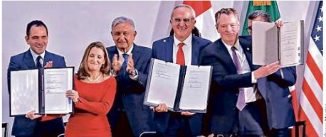
LOS FIRMANTES. La firma del nuevo T-MEC se realizó en Palacio Nacional, con la Viceprimer Ministra de Canadá, Chrystia Freeland (z. a der.); Jesús Seade, Subsecretario de Relaciones Exteriores, y el representante comercial de Estados Unidos, Robert Lighthizer.

Un análisis del despacho de abogados De la Vega &