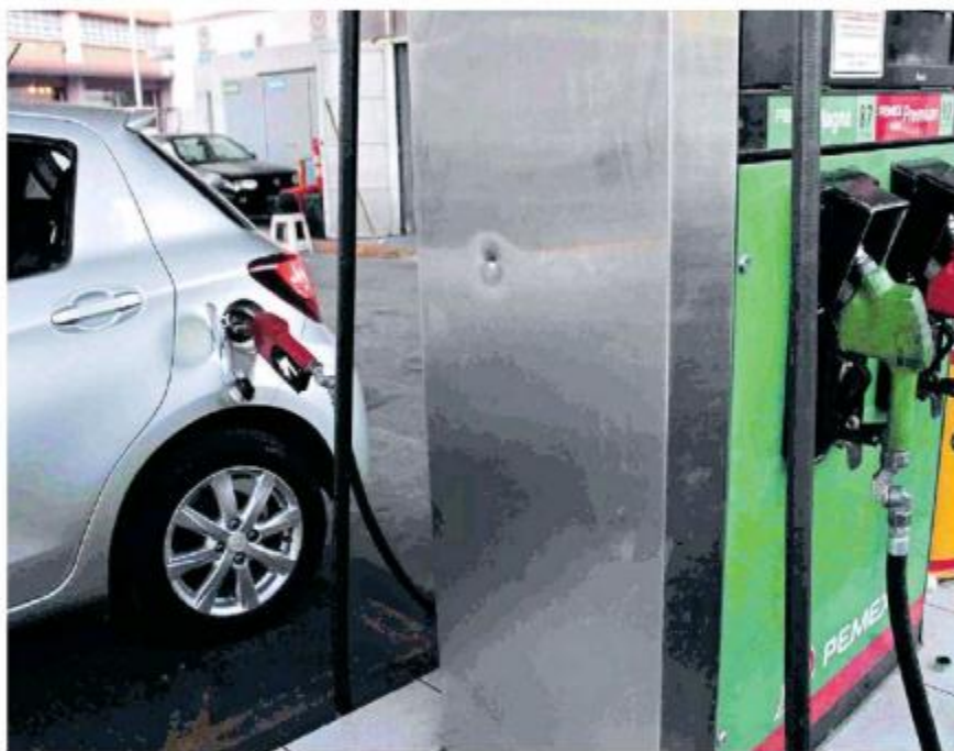
Pese a la reducción del costo, sigue siendo cara.

La gasolina premium tuvo un decremento de 21 centavos en términos reales al pasar de 21.92 pesos por litro en octubre a 21.71 pesos por litro en noviembre de 2019, una variación negati-