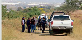
Una joven sin vida fue hallada en una brecha afuera del Fraccionamiento Paseo de los Agaves, en Tlajomulco.

La adolescente era de compleción delgada y media aproximadamente 1.55 metros de estatura, tenía el cabello negro, largo y lacio,