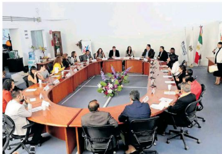
Ayer firmaron el acuerdo en las instalaciones del IEPC.

Dos, implementar programas en formación de cultura de discapacidad que permitan el desarrollo de habilidades, herramientas e implementación de protocolos necesarios para lograr una adecuada