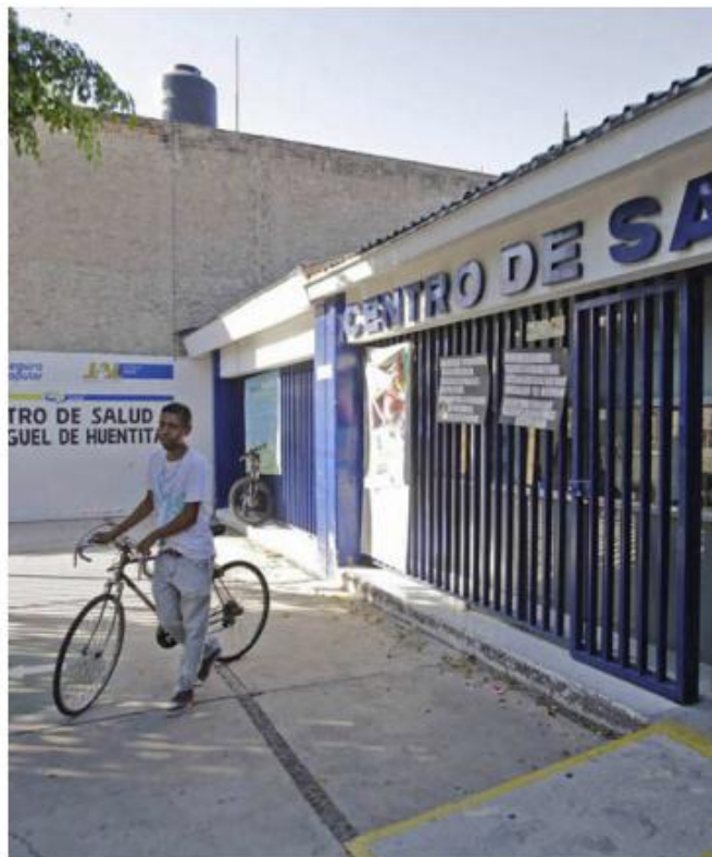
Trabajarán de forma similar al IMSS e ISSTSE. F. CARRANZA

“Lo que no sabemos es cómo va a llegar, si van a llegar directos a los OPD de Salud o si llegará a la Secretaría de Administración, eso no lo sabemos”, dijo el funcionario estatal, quien añadió que en aproximadamente tres meses la federación dará a conocer las reglas con las que operará, y la cobertura que se le dará al Instituto de Salud para