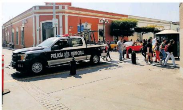
Habrà presencia en los 54 bancos y 75 cajeros que hay en el municipio.

“Estamos llevando bitácoras de visitas a los bancos, estamos dando presencia pie a tierra sobre todo para evitar a los paque-