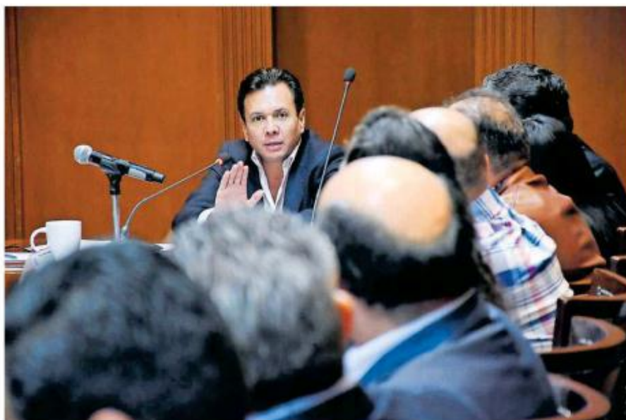
Pablo Lemus adelantó que solicitará un crédito.