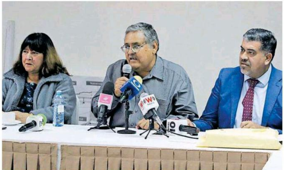
Afirman representantes del Ejido que emprenderán acciones legales por presunta corrupción.