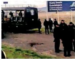
La madrugada de ayer se dio el desalojo.