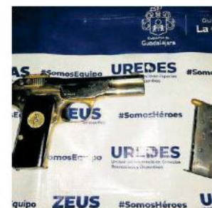
El ahora detenido se encontraba realizando disparos al aire.

El conductor del Nissan hizo caso omiso y trató de escapar por lo que los uniformados emprendieron la persecución que terminó en la calle Sebastián Allende, entre Gigantes y 12 de Octubre.