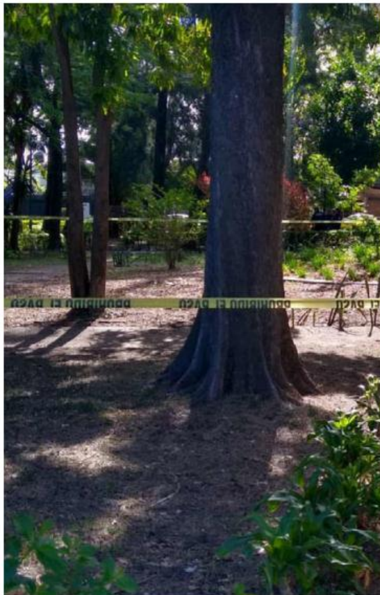
Un cadáver se localizó en un parque.

Elementos de la Policía estatal acudieron al sitio y pidieron el apoyo de Servicios Médicos Municipales, quienes confirmaron la muerte del sujeto de 45 años de edad, quien presentaba heridas de arma blanca y huellas de violencia.