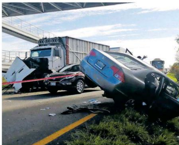
Ambos vehículos tenían daños en la parte frontal.

Colisión entre un torton y un coche dejó como saldo una persona herida en estado de gravedad