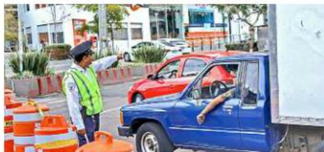
Los automovilistas se quejaron por la falta de mantas informativas antes de llegar al punto, para tomar otras rutas.