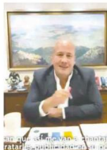
ESTA SEMANA. El gobernador asegura que el diario mintió en notas relacionadas a seguridad.

Alfaro Ramírez concluyó con un mensaje para los medios de comunicación de Jalisco: “Decirte a los periódicos, a sus dueños, que no pierdan el tiempo. Pueden decir todas las mentiras que quieran, en este estado hay libertad de expresión, pero no van a doblar al gobierno. Si en eso deciden convertir sus medios, es decisión de ustedes. Este gobierno no acepta chantajes”.