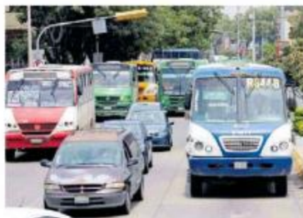
Tome sus precauciones.

Para la ruta 153 que también circula por la calle Industria, inicia el desvío en la calle Abascal y Souza-Esteban Alatorre-Dr. Baeza Alzaga-Garibaldi-Santa Mónica y regresa en la calle Reforma.