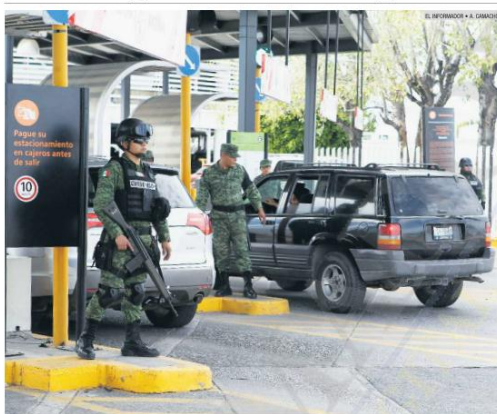
CONTROL. Integrantes de la Guardia Nacional se hacen cargo de la vigilancia del estacionamiento del Aeropuerto Internacional de Guadalajara tras retirar a ejidatarios de El Zapote que tenían tomada el área desde hace tres meses.