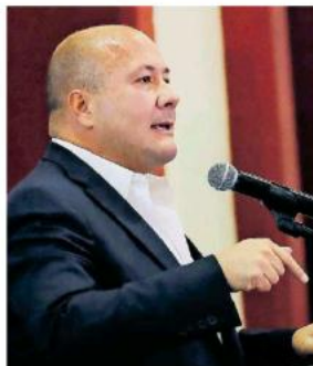
Asegura que Jalisco no va a ceder.

Otra de las cosas que piden y que le preocupa es lo relacionado a la aportación federal se mantiene en la misma cantidad de alrededor de tres mil 500 millones de