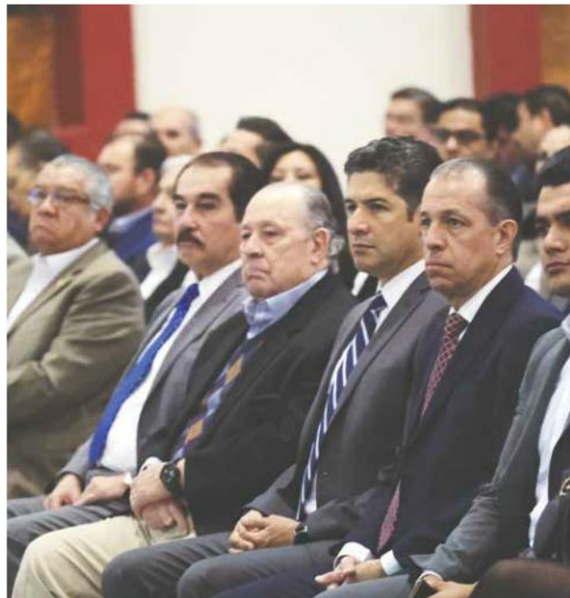
COMIENZO. Los foros arrancaron en las instalaciones de la Cámara Nacional de Comercio (Canaco) Guadalajara.