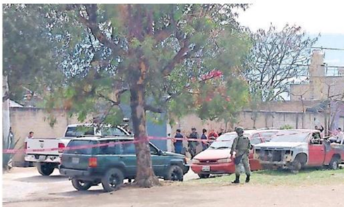
Los elementos de la Fiscalía se encontraban realizando una investigación cuando fueron atacados.

Al apoyo de los agentes se presentaron uniformados de la Secretaría de Seguridad Pública del estado, de la Secretaría de la Defensa Nacional (Sedena), así como de la policía de Zapopan, quienes apoyaron en las labores de búsqueda de los agresores, algunos de los cuales huyeron a bordo de una camioneta tipo Cherokee, en color verde, por lo que se inició su búsqueda.