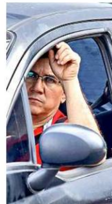
Los automovilistas tuvieron que armarse de paciencia al circular a vuelta de rueda.

General 89 del IMSS, ubicada en Washington. Ya sabe el camino, pero ayer, literalmente se perdió.