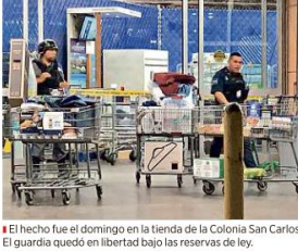
El hecho fue el domingo en la tienda de la Colonia San Carlos. El guardia quedó en libertad bajo las reservas de ley.

El vigilante baleado a un venezolano que se negó a mostrar el ticket de compra ENRIQUE OSORIO Quedó en libertad el guardia de seguridad privada que había sido detenido por su presunta responsabilidad en la muerte de un cliente de una tienda, a quien le pidió el ticket. La Fiscalía del Estado confirmó la tarde de ayer que el trabajador de una empresa de seguridad subcontratado para vigilar la tienda de Sam's Club en la que ocurrió el ataque, se encuentra en libertad bajo reservas de ley. De acuerdo con los lineamientos del sistema penal, lo anterior significa que el guardia permanece bajo