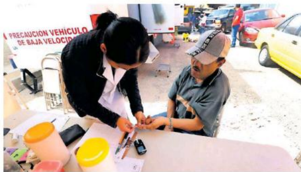
Fue la primera de tres jornadas de atención a comunidades indígenas.

Detalló que "Aquí se les da servicios de medicina general, medición de la glucosa, presión arterial y asesoría en nu-