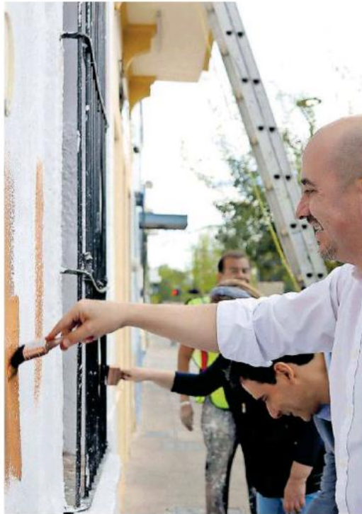
El alcalde Ismael del Toro dio el inicio formal a los trabajos de remozamiento.

"Siempre vamos a estar escuchando. La apuesta es invertirle en la iluminación de las banquetas. Vamos a invertir casi 300 millones de pesos para un pro-