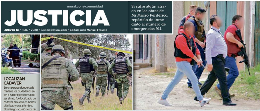
Los militares acudieron para brindar el apoyo necesario.