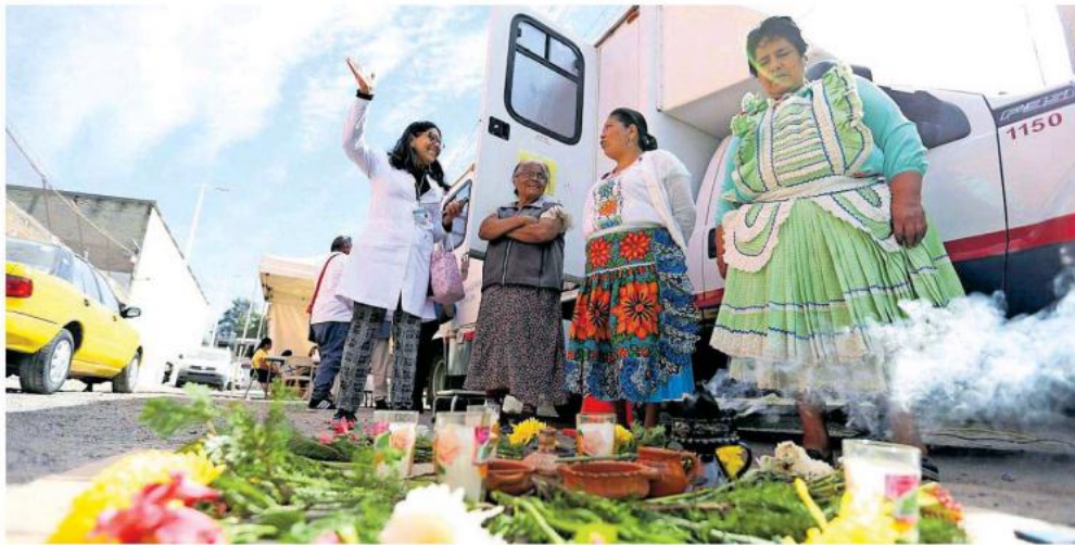
Ofrecen atención médica básica, así como orientación para los casos más necesarios.