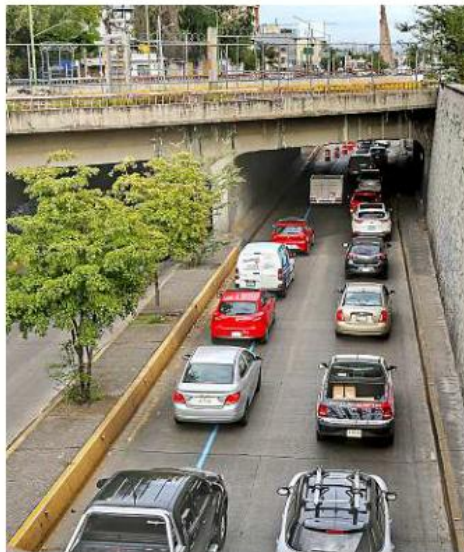
Debido al cierre en la Glorieta Niños Héroes, las filas de vehículos se extendieron a lo largo de 2 kilómetros.

Pero la decisión del Ayuntamiento tapatío tomó por sorpresa a los comerciantes y habitantes de la zona, al igual que a los automovilistas, pues no hubo socialización ni colocación de mantas informativas sobre el cierre y rutas alternas a tomar.