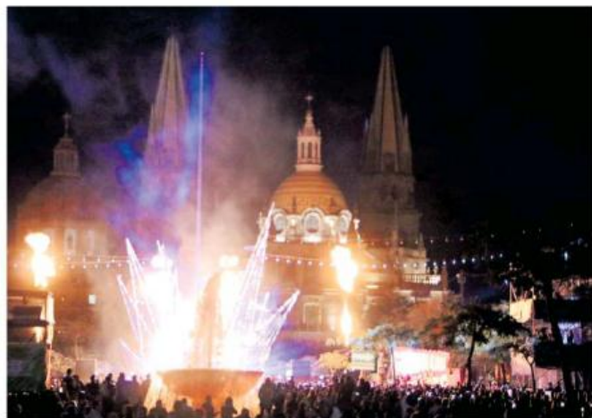
Españdo espectáculo se ofreció la noche de ayer en el corazón de Guadalajara.

Se espera además que toda la zona esté custodiada por 450 elementos de la Poli-