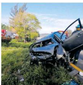
En el sitio sólo se encontró a una persona que tenía lesiones.

Al parecer el choque ocurrió la mañana de este miércoles, cuando el compacto pretendió incorporarse a la circulación.