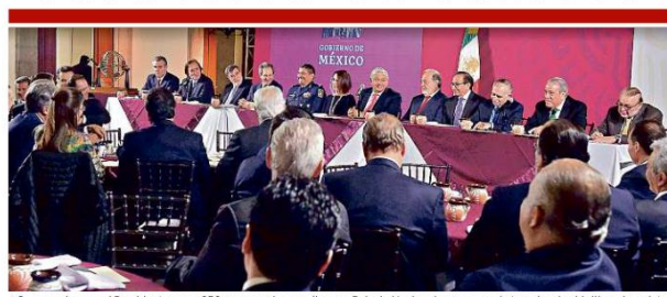
Convocados por el Presidente, unos 250 empresarios acudieron a Palacio Nacional a una cena de tamales de chipilin y chocolate.

Por 'cada voluntario'.. con nombre y firma