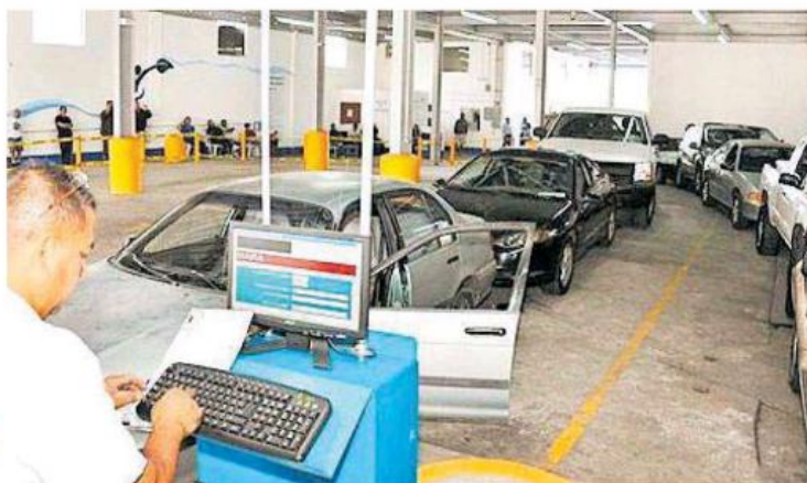
Líneas de verificación según el sistema de la Ciudad de México.

"No avanza el programa porque el gobierno quiere tener el control del dinero, porque el costo de la prueba será de 500 pesos y de ese dinero el 20% pasa directamente al proveedor del equipo, otro 20% se lo adjudica el gobierno en automático y el 60% restante sería