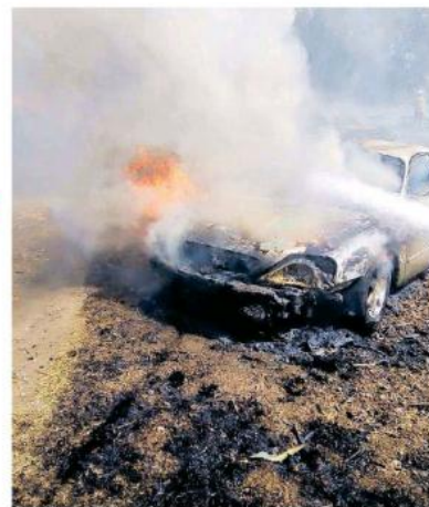
Los hechos en el corralón municipal de Lagos de Moreno.

La dependencia estatal también informó que en total aproximadamente 100 automotores fueron consumidos por las llamas. Fue a las 15:30 horas cuando se logró extinguir el fuego.