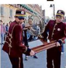
Niños gritones de la Lotería Nacional llevaron una tómbola en la que los empresarios depositaron sus "cartas compromiso".