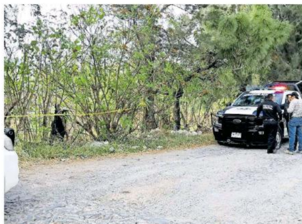
Los hechos en las inmediaciones de la colonia Jardines de Santa Anita.

quedaron obstruidos, incluso el particular quedó parcial mente volcado entre la carretera y la cinta asfáltica. Por ello se generó intenso caos vial en el sentido de salida de Guadalajara.