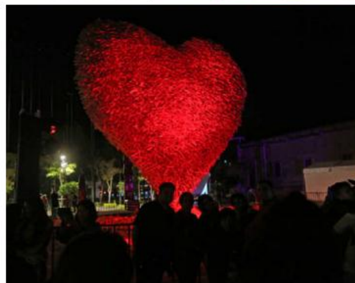
Miles de tapatíos disfrutaron de las piezas en el primer cuadro de la ciudad. FERNANDO CARRANZA