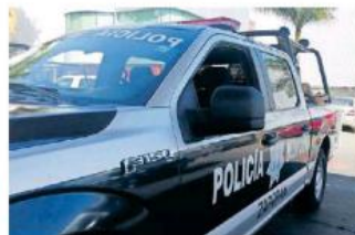
La víctima aparentemente intentaba atravesar la calle.

Sobre ese hecho ocurrido a las 09:30 horas, de este miércoles, la Comisaría de Seguridad Pública de ese municipio fue informada por lo que se enviaron a oficiales al lugar, en el cual se encontraron al hombre en dicha condición, por lo cual también se le dio aviso a paramédicos de los Servicios Médicos, los cuales ya