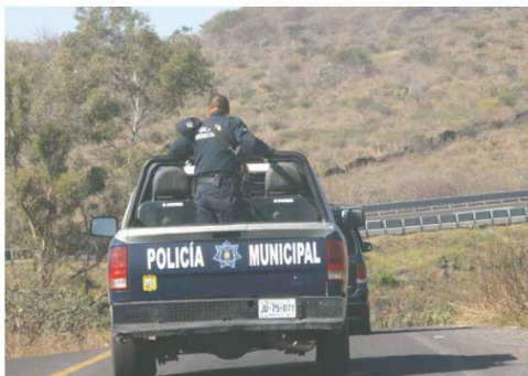
EN TONALÁ. Durante la mañana de ayer se halló un cadáver con golpes y heridas en la colonia El Pachaguillo.

La Fiscalía del Estado sostiene que el acusado amenazó a la víctima porque lo molesto, luego lo cernió y en el cruce de las calles Benito Juárez y Patria lo mató a cuchilladas. Juan Levario