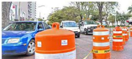
Al cerrar el paso por la Glorieta Niños Héroes, los derroteros de camiones cambiaron sin que hubiera información.