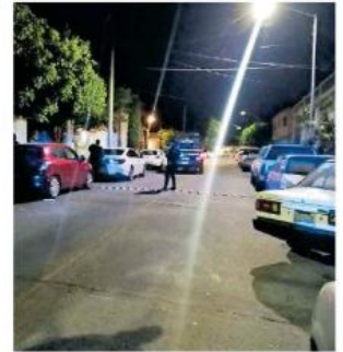
Los hechos ocurrieron en la Colonia Lomas del Paradero.

El sexagenario presentaba una lesión en el cráneo, al parecer ocasionada por objeto contundente. Él fue identificado con el nombre de Miguel, según informó la corporación. Se calcula que