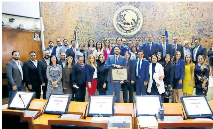
El Congreso de Jalisco otorgó un reconocimiento a Jorge Vergara, quien falleciera el año pasado.