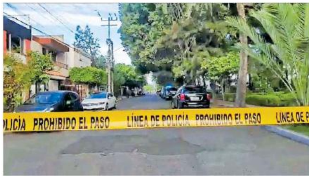
En Jardines de la Cruz una persona que se encontraba haciendo ejercicio se encontró un cuerpo sin vida.

Momentos posteriores, a las 08:50 horas fue localizado un cadáver más, al que se le apreciaban lesiones causadas con