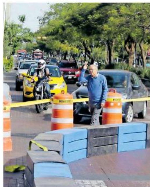
Causó molestia a conductores los cierres en este punto de la ciudad.

"Yo tuve una reunión personal con los comerciantes del corredor Chapultepec