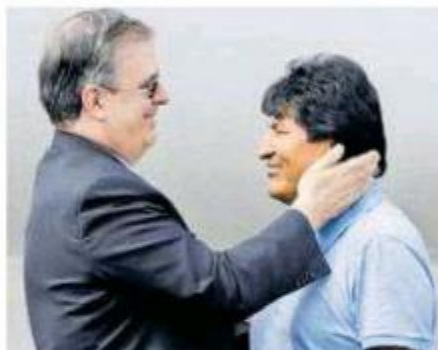
El expresidente Evo Morales llegó ayer a México.

Tras lo cual indicó que en este caso es mejor no meterse en el debate de si Evo Morales hizo bien o no las cosas durante su mandato y en la última reelección ya que "eso es un asunto de los bolivianos, yo creo que Evo representó un liderazgo muy