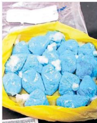
Traía 17 bolsas de metanfetamina.

Luego de ello, el imputado se encuentra interno en el Reclusorio Preventivo de la Zona Metropolitana de Guadalajara, ubicado en el complejo de Puente Grande.