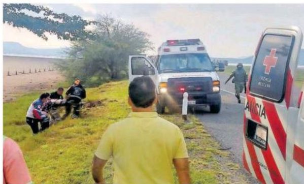
El otro fatal percance fue en la autopista Guadalajara-Tepic, en el municipio de Amatitán.

Paramédicos encontraron a una menor de 7 años, prensada, en estado grave, por lo que fue trasladada de inmediato y se pidió apoyo de un helicóptero para llevarla de urgencia.