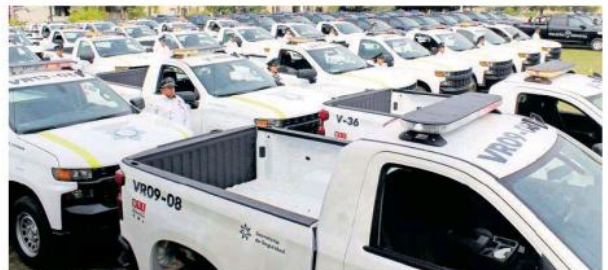
Las nuevas patrullas serán puestas a trabajar de inmediato.

50 CAMIONETAS CHEVROLET Silverado 2019, cabina regular tipo A, para la Policía Vial.