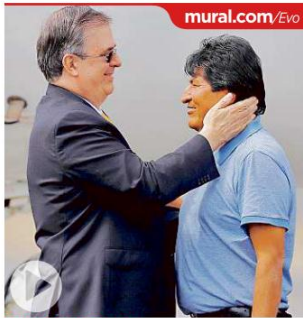
YA ESTÁS EN TU CASA. El Canciller Marcelo Ebrard recibió a Evo Morales a su llegada a la CDMX.

López Obrador reveló ayer en su conferencia matutina que fue el quien instruyó ofrecer asilo a Morales. "Me siento muy orgulloso