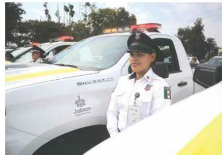
NUEVAS. El Ejecutivo entregó 85 camionetas RAM 2500 a los agentes estatales y 50 Chevrolet Silverado a los elementos viales.

Cada vehículo tiene equipamiento que consiste en códigos luminosos o torretas de marca Brinker a base de luces LED con hasta 10 mil horas de funcionamiento, así como códigos sonoros y un equipo de radiocomunicación marca Motorola XPr1500.