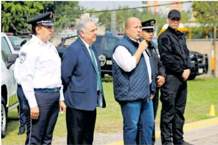
El gobernador Enrique Alfaro entregó los vehículos.