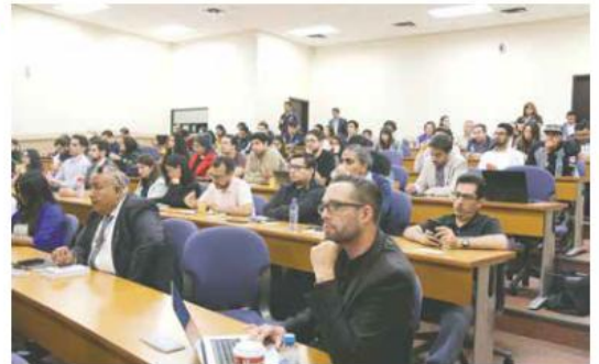
OPORTUNIDAD. Miembros de la industria de los videojuegos reciben capacitación en el Tec de Monterrey campus Guadalajara.

La ceremonia de inauguración contó con la participación de la directora general adjunta de los Servicios de Apoyo del Instituto Mexi-