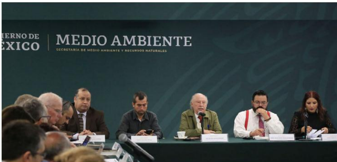
La Semarnat participa en las mesas de trabajo sobre la construcción de la presa.

Evento. El titular de la Semarnat aseguró que la administración busca democratizar el agua en todo el país