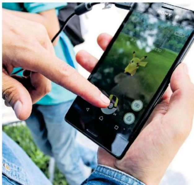
Juegos como el Pokémon-go causaron sensación.

El funcionario destacó además que la semana pasada en una gira de trabajo a Montreal, en Canadá, se acordó la colaboración, porque consideran que en Jalisco hay talento que puede aprovecharse.