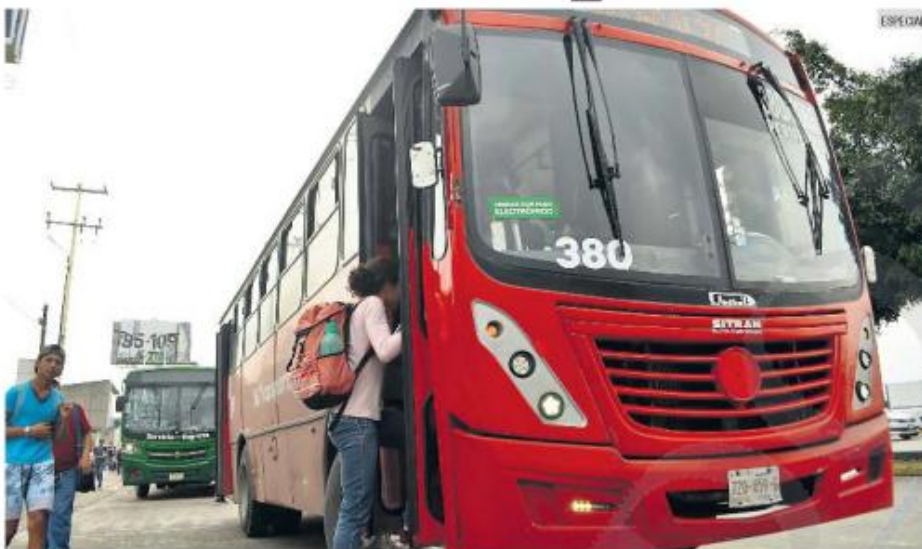
MODELO. Una de las rutas que se sumó al programa del Gobierno del Estado fue la 380.

La Secretaría de Transporte (Setran) indicó que migrar al nuevo modelo es parte de un pro-