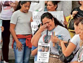
Mientras los agentes no tienen los recursos necesarios, los familiares alargan su pena por sus desaparecidos.

Una de las familias afectadas narró que denunció la desaparición de un hombre de la tercera edad, quien apareció días después en Pátzcuaro, Michoacán. Fueron ellos por su cuenta los que ubicaron por redes sociales al hombre y