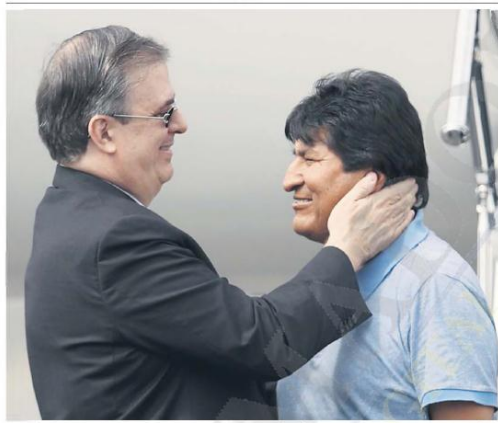
BIENVENIDA. El titular de Relaciones Exteriores, Marcelo Ebrard, recibió a Evo Morales. El ex mandatario boliviano afirmó que el sábado pasado, a uno de los miembros de su equipo de seguridad se le pidió entregarlo a cambio de 50 mil dólares.