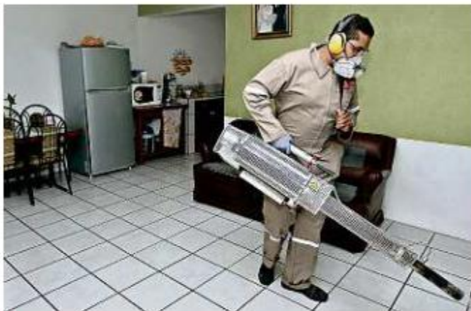
■ Cuadrillas de la Secretaría de Salud Jalisco han realizado fumigación contra el mosquito transmisor del dengue.