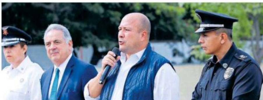
Aseguró el Gobernador que es para ordenar la movilidad en la ciudad.

“Nosotros hemos escuchado todas las posturas, no hay ningún compromiso ni tenemos que solicitarle permiso a nadie para tomar medidas en beneficio de la ciudad, el tema ya está en el Congreso y será el que determine la redacción final de las reformas a la legislación y lo que puedo adelantar es que creo que hay consensos para establecer los horarios de restricción y establecer un monto de pago para las