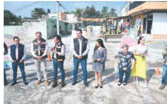
PESE A SOLICITUD. El alcalde de Zapopan dice que no cederá a presiones políticas.

Ante este escenario, expuso que “no cederán a presiones políticas porque para nosotros es más