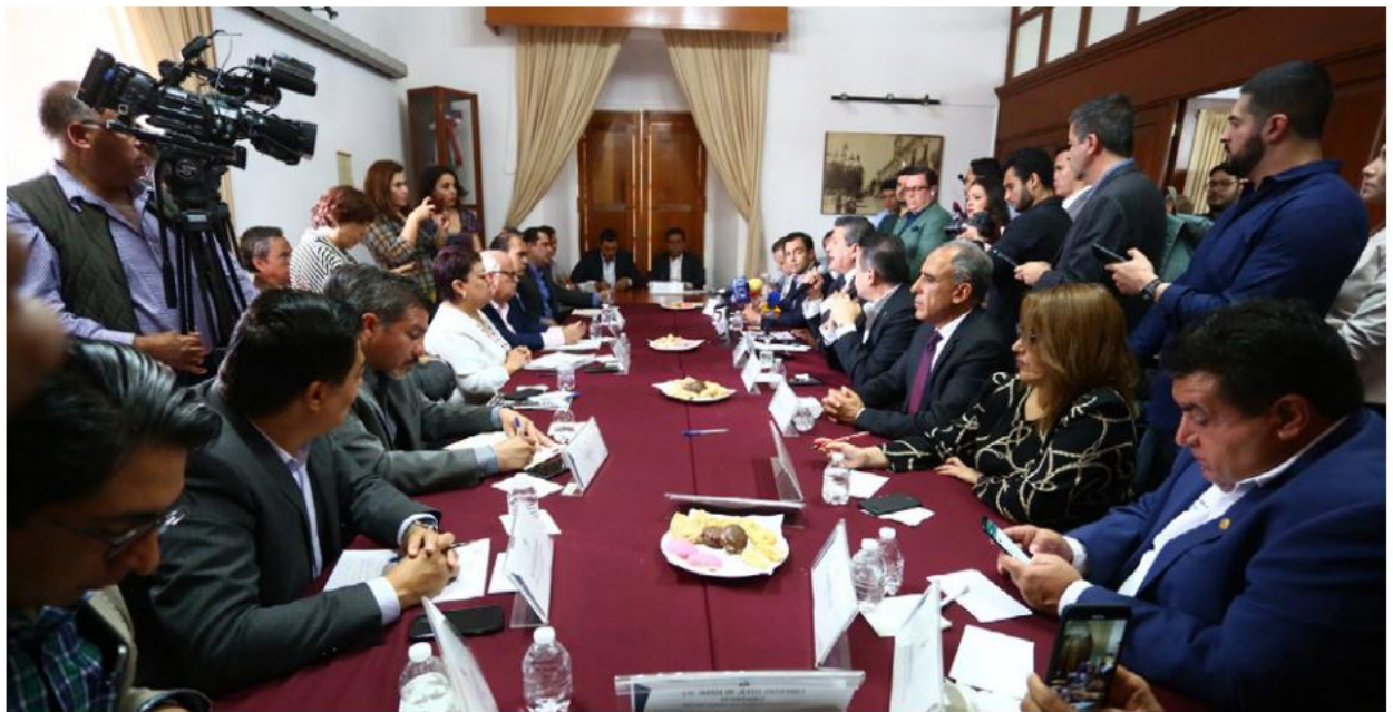
Ayer se llevó a cabo una reunión de trabajo sobre el plan de regulación. ESPECIAL