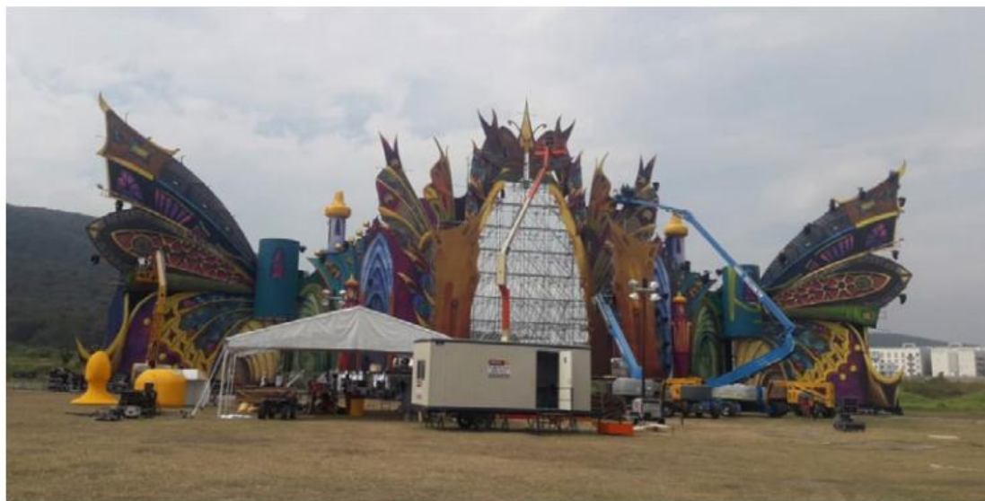
El avance del montaje de los escenarios es de un 60 por ciento.