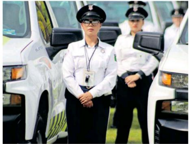
Agentes viales tomaron posesión de los vehículos.