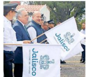
Autoridades de ambas dependencias y estatales dieron el banderazo de salida.

De acuerdo a lo informado por el gobierno de Jalisco, el plan de arrendamiento es por cuatro años y en el que se establece que cada camioneta RAM tendrá un costo de 21 mil 360.62 pesos mensuales, cuyo valor total por vehículo arrendado es de un millón 25 mil 309 pesos con 76 centavos, de tal manera que la inversión total por las 85 unidades