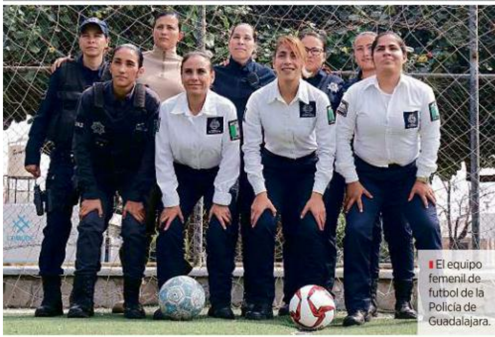
■ El equipo femenino de fútbol de la Policía de Guadalajara.