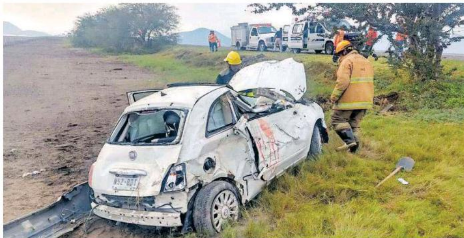
Uno de los accidentes ocurrió en la carretera a Colima, en el municipio de Zacoalco de Torres.