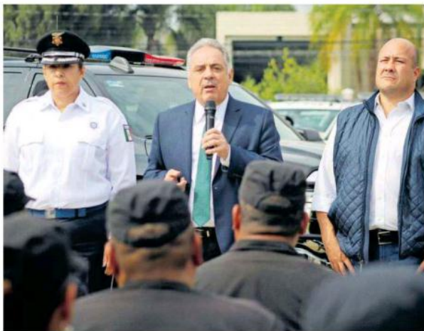
El coordinador del Gabinete de Seguridad afirmó que siguen investigaciones entorno a la fosa de El Zapote.

Añadió que personal de Fiscalía y Ciencias Forenses también sigue buscando indicios en la bodega de la colonia Toluquilla, en