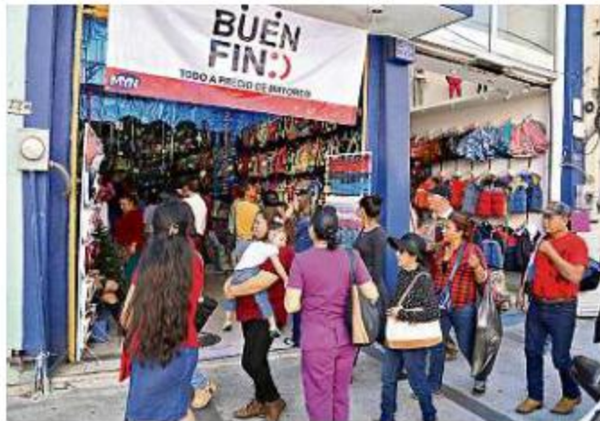
■ La vigilancia se centrará en plazas comerciales.

“El objetivo es muy claro, es evitar afectaciones a los ciudadanos que acuden a realizar sus compras del 15 al 18 de noviembre que se celebra el Buen Fin, una oportunidad para los negocios para expandir sus ventas, y de mucha a