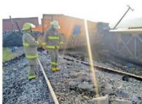
El aparatoso accidente se verificó en Poncitlán.

Bomberos de la UEPCBJ indicaron que tampoco hubo derrame de materiales peligrosos, así como tampoco de los productos de limpieza que eran transportados. Asimismo, ante esa situación, se implementó una vía emergente. Durante la tarde del mismo día se iniciaron las labores de retiro de los contenedores.