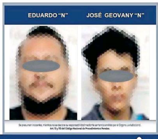
Mucho tiempo para reflexionar tendrán los ahora detenidos.

Los oficiales acudieron al sitio y se dieron cuenta de que afuera de la vivienda se encontraban dos adolescentes, quienes