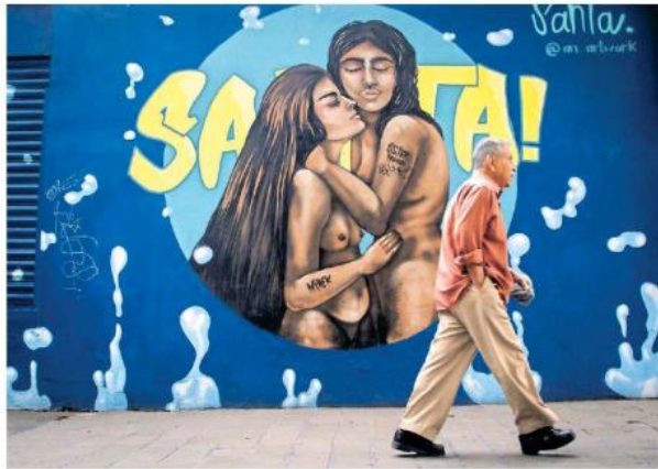
La homofobia y sus tipos puede desembocar en un crimen de odio.