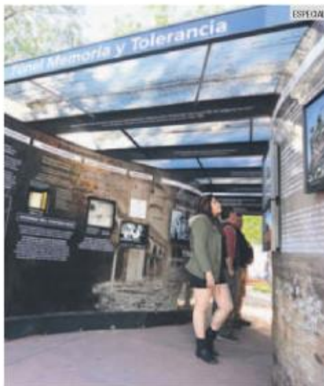
EXHIBICIÓN. El Túnel Memoria y Tolerancia estará abierto al público durante un mes.

La instalación ha recorrido diferentes estados de la República desde su creación en 2016, y fue auspiciada por el Gobierno de la República Federal de Alemania, a través de su Embajada en México. Llega al Parque Revolución, después de pasar el año en diferentes instituciones educativas del Área Metropolitana de Guadalajara.