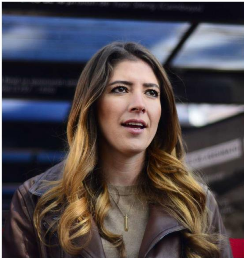
La funcionaria aseguró que las decisiones del Poder Judicial son una mala señal.

"El mensaje que queremos dar en el estado de Jalisco, por lo menos por parte del gobierno del estado, es cero tolerancia a los femi-