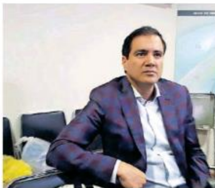
Juan Partida , secretario de la Hacienda Pública, prevé un 2020 complicado.

Le apostarán a recaudar más y el objetivo es un 16 por ciento más que 2018 que significarán 3 mil millones de pesos más para el fortalecimiento de la infraestructura, de nómina de policías estatales y del Área Metropolitana de Guadalajara y compensar el poco crecimiento en salud y educación. La plantilla del Gobierno del Estado crece en 690 plazas de las cuales 665 son para Fiscalía (ministerios públicos) y para resto