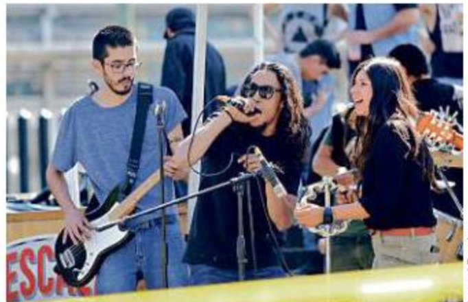
■ La música es parte de la fiesta que se vive cada sábado.