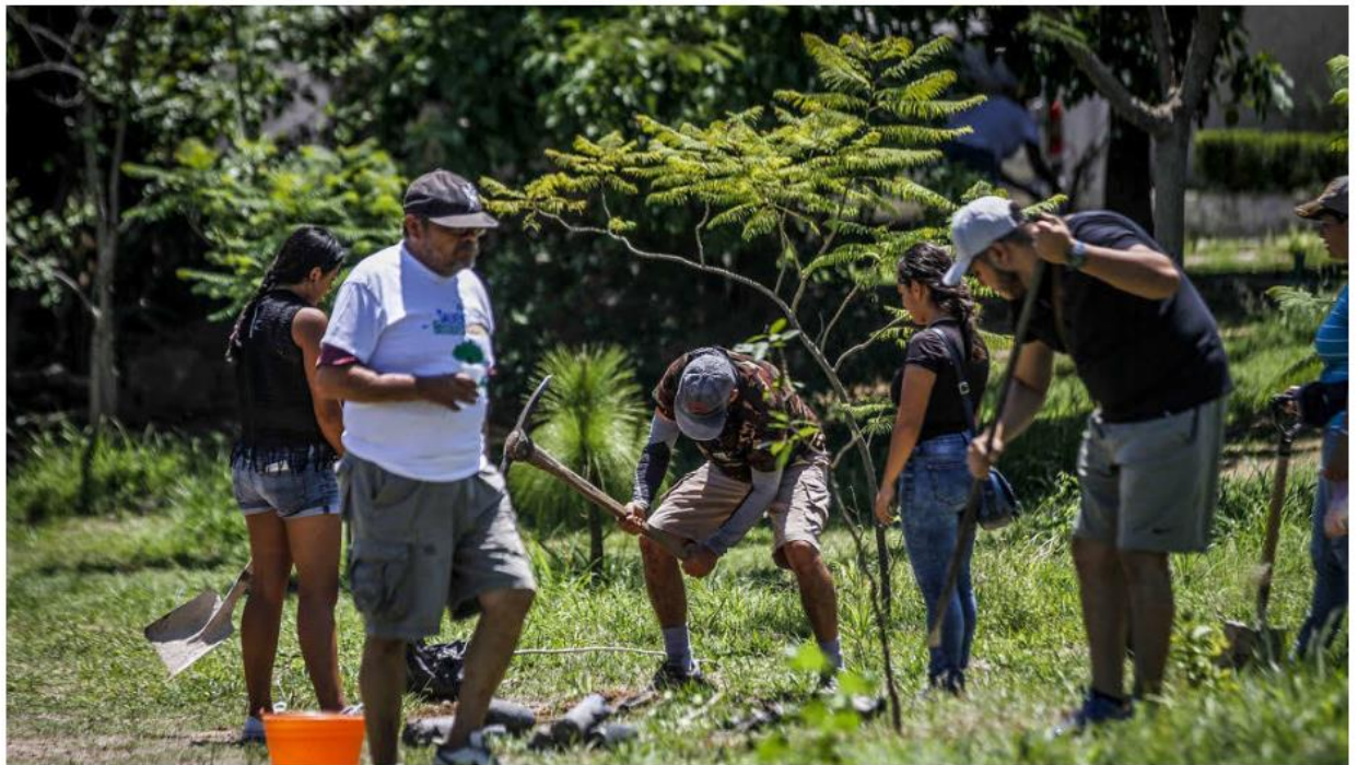
Uno de los principales propósitos es la participación ciudadana.

Programa. Participaron más de 8 mil personas, entre vecinas, vecinos y el funcionariado tapatío, quienes cada semana se dieron a la tarea de aportar su grano de arena en la mejora de su entorno