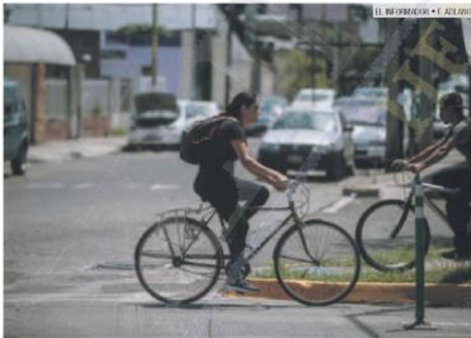
MEJORAS. Las obras pretenden elevar la calidad de la movilidad en bicicleta.

El 11 de febrero de 2018, el Gobierno de Tlajomulco de Zúñiga inauguró la ciclovía Cajitilán sobre el Circuito Metropolitano Sur, obra de 13.5 kilómetros de longitud cuyo fin fue conectar la carretera a Chapala con las poblaciones de Cajitilán y Cuexcomatitlán.