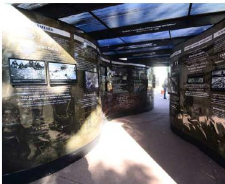
Impedirá que atrocidades marquen a la sociedad.

Haciendo este recordatorio es la forma en la que queremos hacerlo”. El túnel estará expuesto en el Parque Revolución (también conocido como Parque Rojo), del 14 de diciembre hasta 15 de enero de 2020. Esta obra ha recorrido diferentes estados de la República Mexicana desde su creación, en 2016. Ahora llega a este espacio público, después de pasar el año en diferentes universidades. —