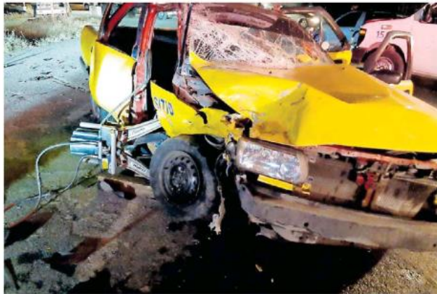
La tragedia tuvo lugar en la carretera Guadalajara-Ameca a la altura del poblado Buenavista.

Cuando los rescatistas llegaron al lugar, encontraron solamente al conductor del taxi, así como al copiloto. Este último se encontraba prensado, por lo que elemen-