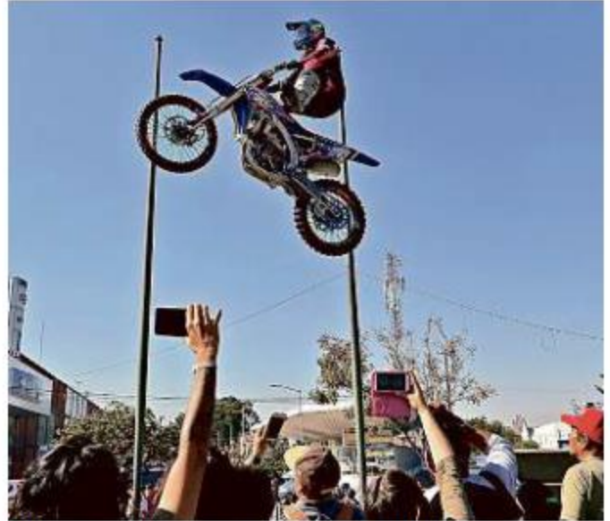
■ Un espectáculo acrobático de motos sorprendió ayer.

"Este lugar (Plaza Juárez) es su sede, su casa. Si lo mueven perdería su identidad", afirma la locataria, y pide apoyo al Gobierno de Guadalajara para mejorar las condiciones de seguridad y mantener su sede.