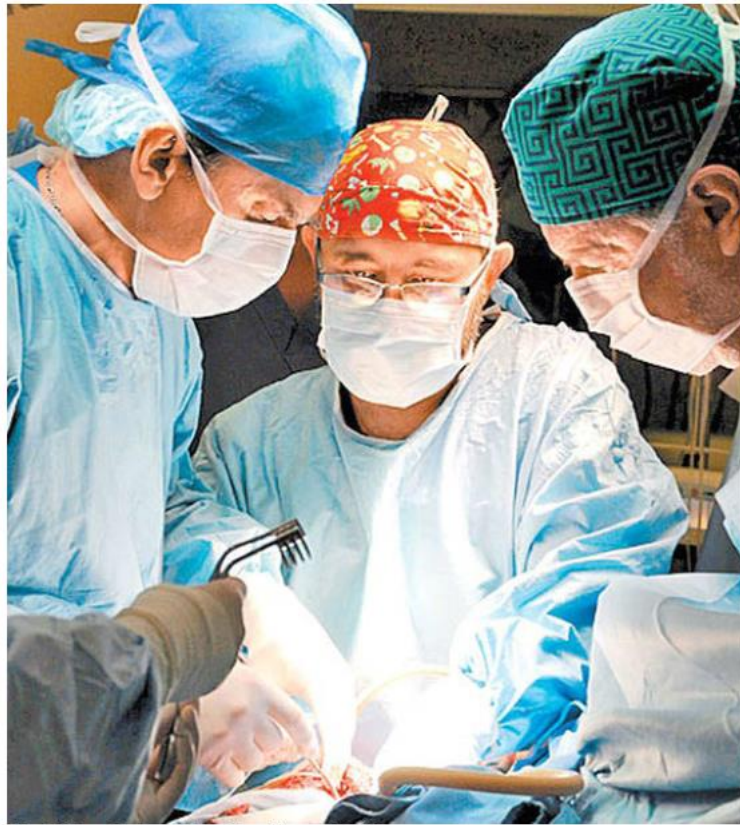
Solo el 20 por ciento se obtiene de cadáveres. MILENIO

Situación. A la fecha existe una lista de cuatro mil personas que hacen antesala por un riñón; mil 80 aguardan por una córnea