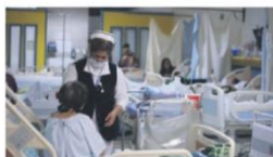
ALTA ESPECIALIDAD. La mayoría de los pacientes sin seguro que obtiene atención en los Civiles recibe tratamiento especializado.