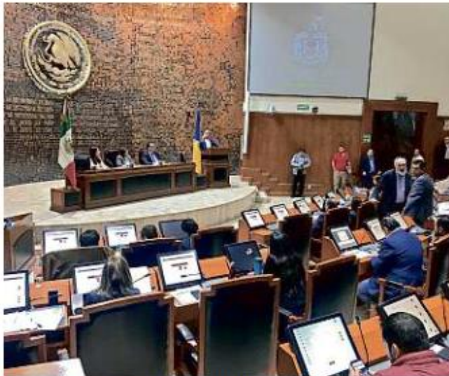
El Congreso del Estado aprobó un presupuesto estatal para el 2020 por 123 mil 13.2 millones de pesos.

Asimismo, a la Fiscalía Estatal le dieron "pilón" de 11 millones, para establecer su Presupuesto 2020 en 2 mil 747.1 millones; el Tribunal de Arbitraje y Escalafón acaparó 1.3, para ascender a 61 millones; y, para participaciones, de destinaron 76.3 para llegar