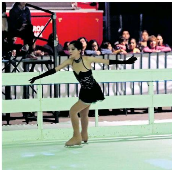
Con la presentación de patinadores profesionales, inició la pista.