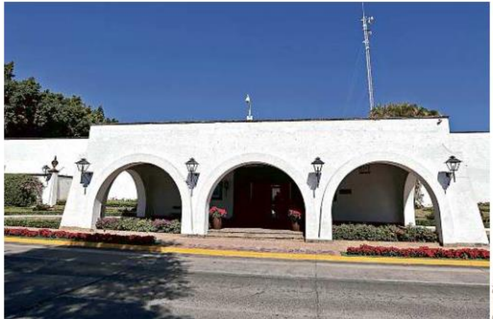
■ Casa Jalisco se encuentra ubicada en Avenida Manuel Acuña Número 2624.

El inmueble tiene una superficie de 8 mil 400 metros