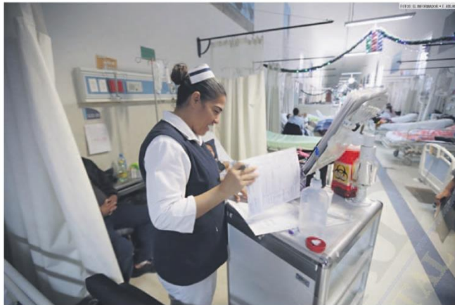
SERVICIO. Los Hospitales Civiles son el núcleo de mayor impacto al servicio de la población más vulnerable de Jalisco y el Occidente del país.

Un récord de ocho pacientes curados por hora registró esa institución durante 2018