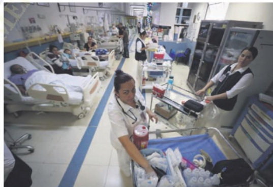
TODOS ENTRAN. La institución abre sus puertas a todos los pacientes, sin importar si tienen o no seguro social.