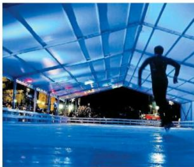
El espacio será el deleite de pequeños y grande.

Docenas de familias se dieron cita este tarde para presenciar el tradicional encendido del árbol navideño y una serie de