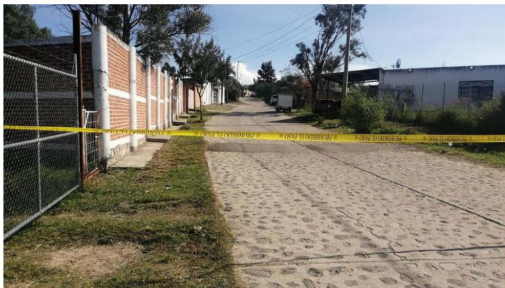
Autoridades descartaron la presencia de más indicios en El Mirador.