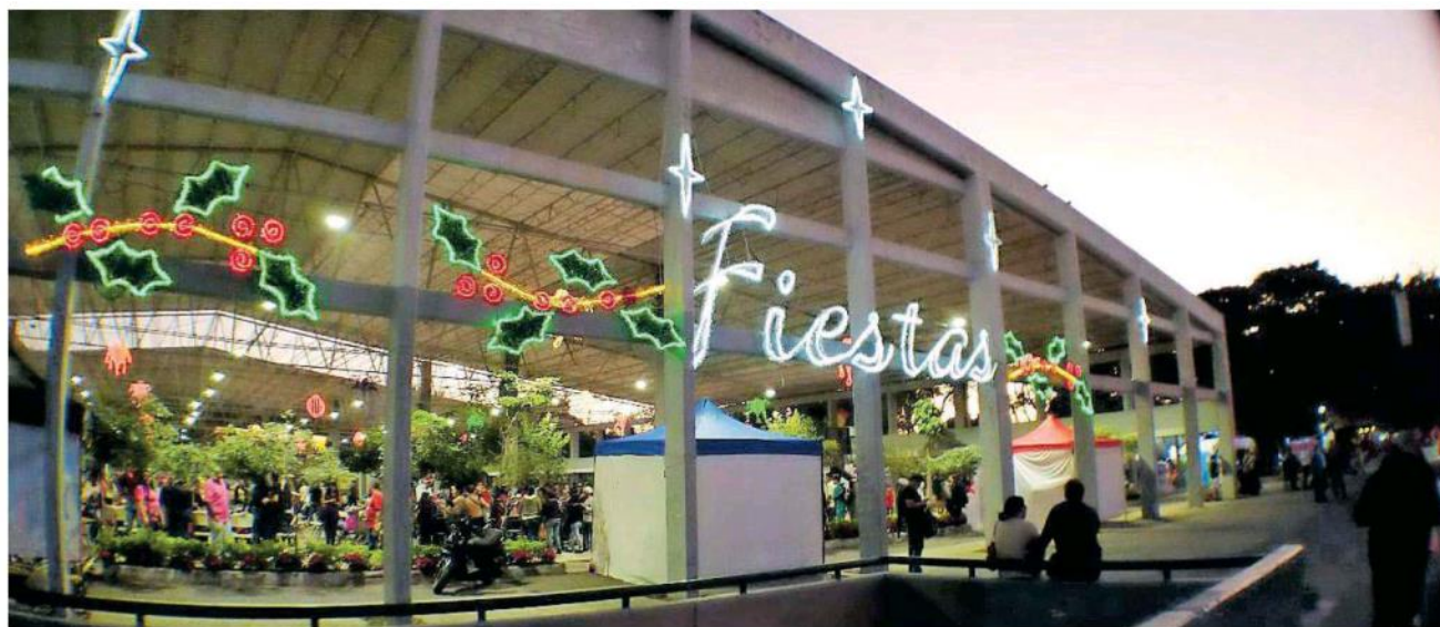
Luces, árbol y aldea navideña en el Parque San Jacinto.