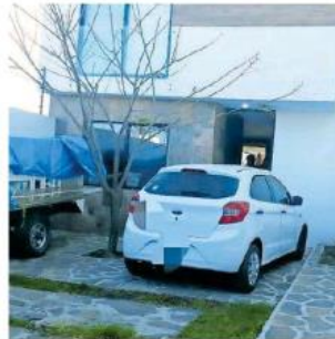
En el lugar también aseguraron droga que presuntamente empaquetaban.

Por los indicios encontrados y de acuerdo con algunas fotografías difundidas por la FGR, en el sitio presuntamente se empaquetaban drogas para posterior venta al menudeo.