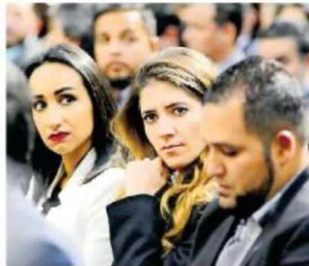
Fela Pelayo , titular de la Secretaría de Igualdad Sustantiva.

Sin embargo, no dejó de lamentar lo ocurrido, pues pese a las pruebas y lo ocurrido, el que se liberen a feminicidas no da un buen mensaje en torno a lo que las víc-