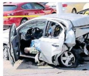
El futbolista es señalado de haber privador de la vida a una pareja de recién casados.