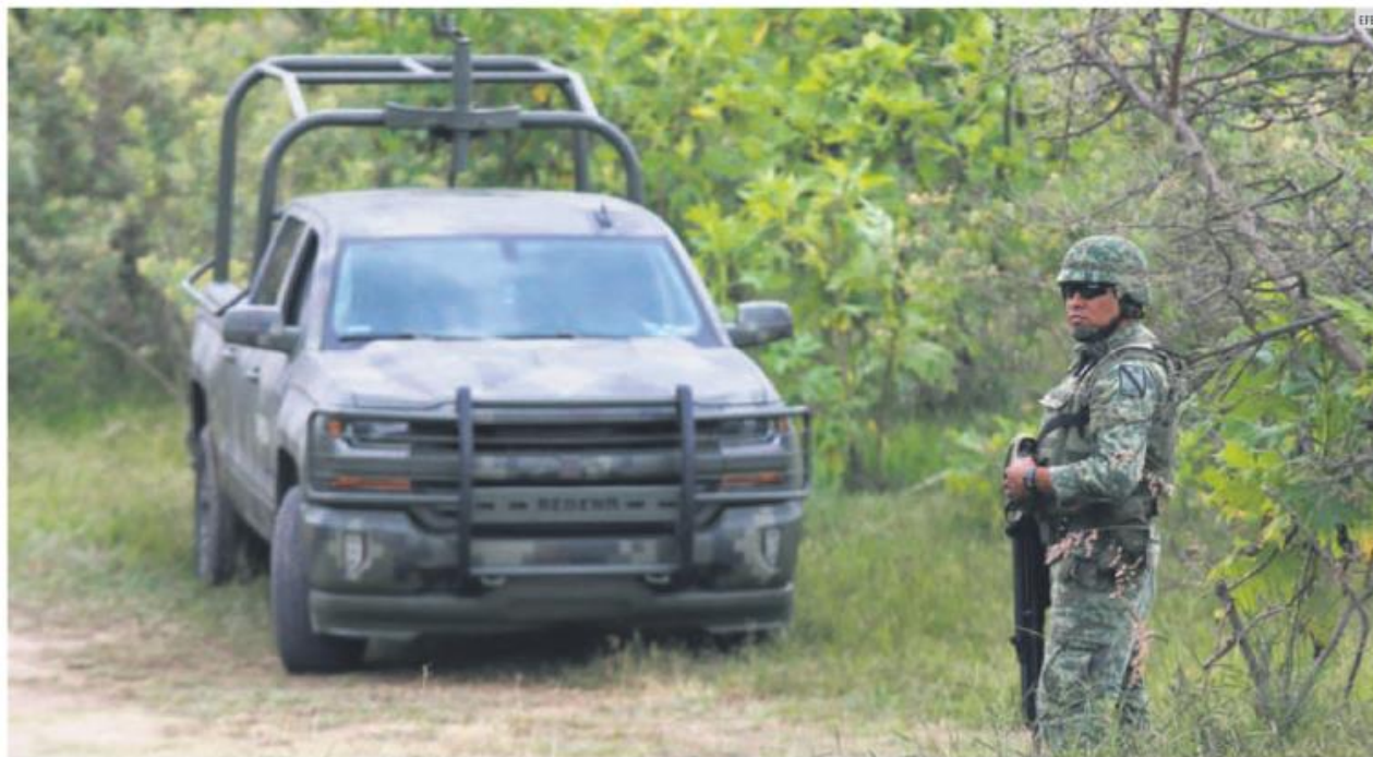
HALLAZGOS. A la fosa de El Mirador se añaden otras en El Zapote (también en Tlajomulco), Lagos de Moreno y Ojuelos de Jalisco.