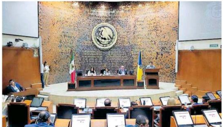
El Congreso del Estado de Jalisco emite la declaratoria para el inicio de vigencia de la Ley Nacional de Extinción de Dominio. @LEGISLATIVOJAL

Los procesos en materia de extinción de dominio iniciados con la Ley de Extinción de Dominio del Estado de Jalisco, las sentencias dictadas con base a los orde-