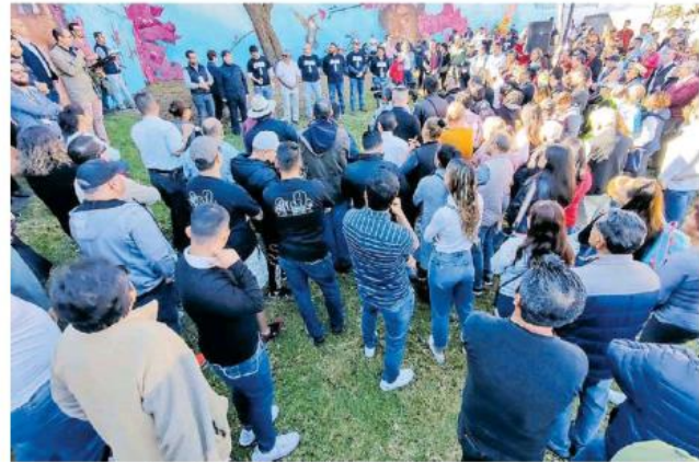
El parque Rafael Cárdenas fue embellecido.

A días de aprobar el Presupuesto de Egresos 2020 de Guadalajara, el presidente municipal explicó que se enfocarán en la recuperación de espacios públicos con diferentes obras de infraestructura, ligadas a las peticiones de mismos vecinos, por lo que el programa para el siguiente año se replicará.