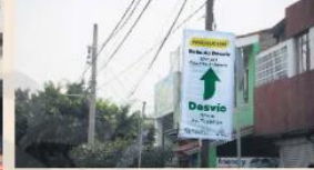
AVISOS. Desde hace días se instalaron señales en los puntos próximos a las zonas intervenidas.