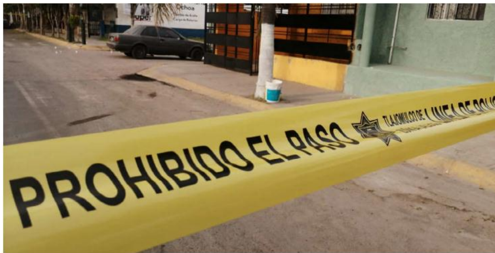
El crimen ocurrió en el fraccionamiento Valle Dorado, en Tlajomulco de Zúñiga. JUAN CARLOS MUNGUÍA

Feminicidios. Suman 13 mujeres fallecidas en hechos violentos en lo que va del año; diputada urge a fortalecer la coordinación entre instancias para erradicar la violencia de género