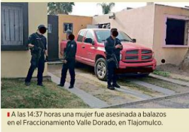
A las 14:37 horas una mujer fue asesinada a balazos en el Fraccionamiento Valle Dorado, en Tlalajomulco.