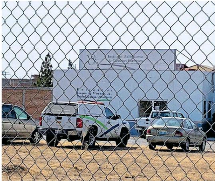
Los restos fueron trasladados a las instalaciones del Servicio Médico Forense con sede en esa demarcación.

Asimismo el pasado 24 de noviembre de 2019, se localizó otro terreno en el que fueron inhumadas de forma ilícita otras 16 personas, este se encontraba en la comunidad denominada El Chipinque, en dicha demarcación de la región Altos Norte. El hallazgo se realizó en base a las investigaciones de personas desaparecidas.