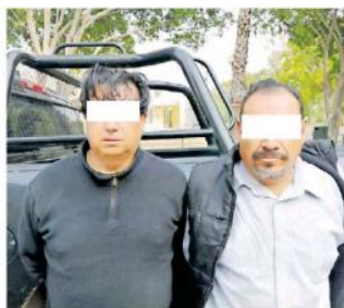
Ésta es la es la primera detención en este operativo. POLICÍA DE GUADALAJARA

Ante esto, elementos se aproximaron y abordaron el camión, a lo que los usuarios señalaron