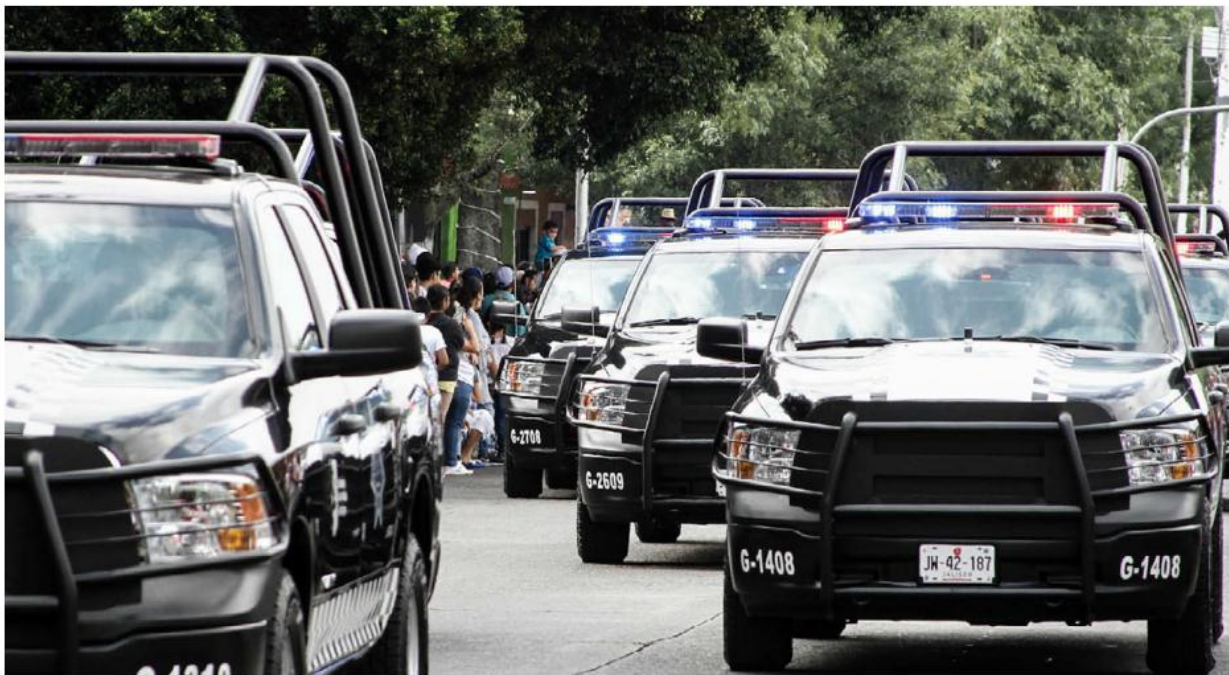
El número de incidencias fue menor al reportado en 2018. FRANCO GONZÁLEZ