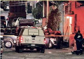
A las 21:30 horas del martes fue ultimado a tiros un joven tras una discusión en la Colonia Lázaro Cárdenas.

Cuatro muertes por violencia se registraron durante la reciente jornada en la Ciudad. Tres víctimas son hombres y la otra es una mujer; ésta última murió en la Cruz Verde. Ningún responsable fue capturado.