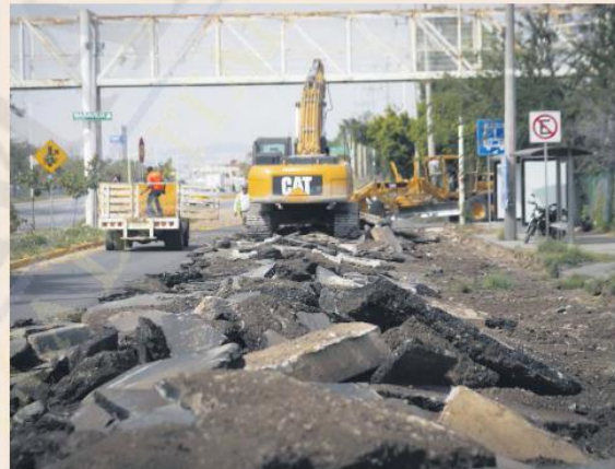
NUOVA VISTA. Además de renovar el concreto, las autoridades harán lo propio con el alumbrado público.