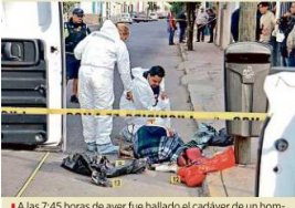
A las 7:45 horas de ayer fue hallado el cadáver de un hombre envuelto en cobijas en la Col. Artesanos, en Guadalajara.