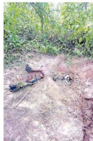
La Fiscalía del Estado detalló que el predio se ubica a cinco kilómetros del Rancho El Crespo.

"En Lagos de Moreno es imprescindible incrementar el estado de fuerza"