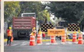
CERRADOS. Los trabajos durarán nueve meses, según el cronograma de la SIOIP.