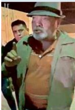
El Alcalde estuvo envuelto en una riña la madrugada de Navidad.

Refirió que no volverá a tener un comportamiento similar, siempre y cuando no esté en peligro alguno de los suyos.