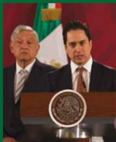
El Gobierno federal busca recuperar 2,500 millones de pesos en subastas.

De acuerdo con las estimaciones de Banobras, con el valor mínimo de avalúo de las unidades en venta "estamos esperando recuperar más de dos mil 500 millones de pesos en cada una de estas aeronaves en este proceso".