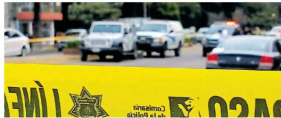
Los hechos en calles del Centro Tapatío.

Debido a que una cuadrada de distancia se encuentra instalada una cámara del C5, es que esta será revisada por personal del área de homicidios dolosos de la Fiscalía Estatal revisará si se logran ver qué fue lo que ocurrió en el sitio. Hasta ahora del o los causantes nada se sabe ya que no hubo testigos.