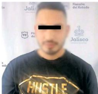
Estos fueron detectados en diferentes filtros de alcoholimetría.