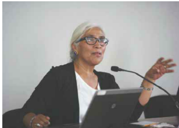
JUNTOS. La directora del Idea pide a los ciudadanos involucrarse en la generación de proyectos enfocados al medio ambiente.