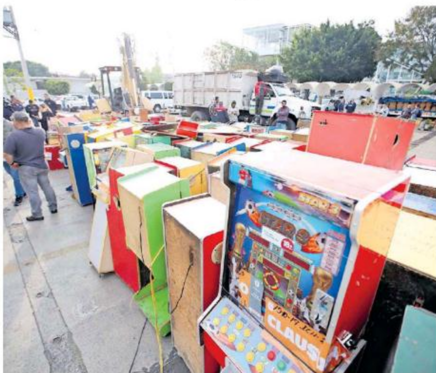
Más de 100 maquinitas fueron destruidas en Zapopan. AGAPITO ESPINOZA.

"No tenemos ninguna denuncia formal ni informal, de ser el caso estamos en toda la disposición de apoyar a esos comerciantes desde la policía municipal como de la Fiscalía".