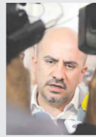
DICE EL EDIL. Los mensajes que descalifican los horarios tienen intereses políticos.

Por otro lado, el alcalde admitió que mantiene una actitud positiva ante la reunión que sostuvo el gobernador Enrique Alfaro Ramírez con autoridades del gobierno federal en la Conferencia Nacional de Gobernadores (Conago), aunque hasta ayer desconocía detalles al respecto.