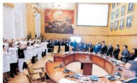
La nueva delegada tiene como profesión enfermería.

Antes de 2014 ocupó la dirección de la Unidad Médica de Atenciones Especiales (UMAE) del Centro Médico Nacional de Occidente. A partir de abril de ese mismo año pasó a ocupar la titularidad de la delegación y cuando se supone que terminaba sus funcio-