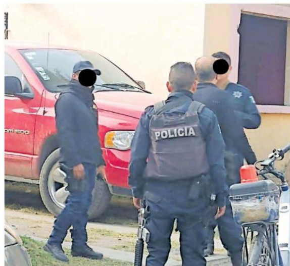
Sujetos armados sin mediar palabra dispararon contra la ahora occisa.