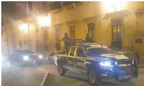
DELITOS. Lagos de Moreno vive un clima de violencia desde el año pasado.

En el segundo se localizaron 47.4 kilos de la droga en una empresa de paquetería de Tlaquepaque. Lo asegurado fue puesto a disposición de la Fiscalía General de la República. Juan Levario