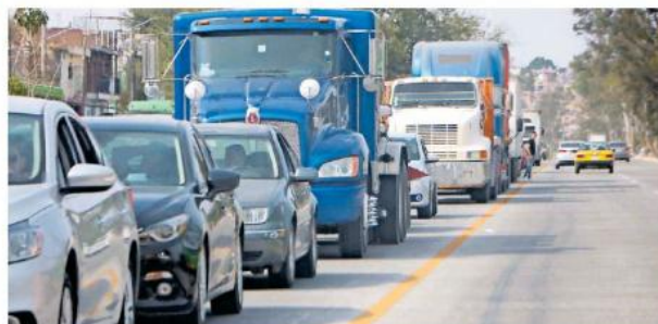
Sigue pendiente la solución al transporte de carga pesada. AGAPITO ESPINOZA.

Respecto a la restricción de horario para el transporte de carga de 6 a 9 horas dentro de los municipios metropolitanos, agregó que “quitarle tres horas al día es falta de productividad y hay productos que no se