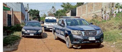
El hombre hacía labores de mecánica en su casa y fue prensado por el vehículo que le cayó.