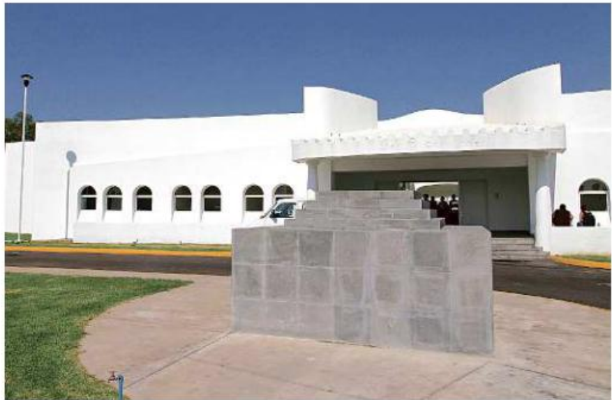
La Casa Hogar Cien Corazones se ubica en la Colonia Jardín Real, en Zapopan.

"Presenté una queja por que no se llevaron a cabo las