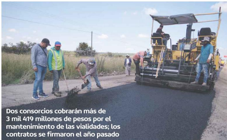
Los consorcios cobrarán más de 3 mil 419 millones de pesos por el mantenimiento de las vialidades; los contratos se firmaron el año pasado

● Mil 793 millones 289 mil 918.13 pesos es el monto del contrato firmado con L & E Operadora de Vialidades en Los Altos ● Mil 625 millones 999 mil 222.81 pesos es el monto del segundo contrato, firmado con Elar Constructora y Reparadora de Caminos y Vialidades ● 3 mil 419 millones 289 mil 150 pesos es la cantidad para rehabilitación y conservación de tramos carreteros