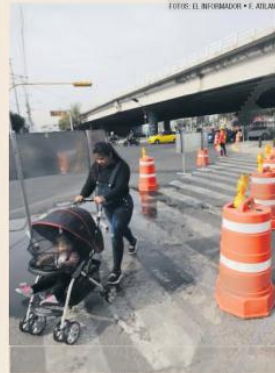
PASO SEGURO. El plan es que siempre haya bandereros a fin de reducir riesgos a los peatones.

Los trascabos se echaron a andar y destrozaron el pavimento viejo del Periférico. Pero, contrario a lo que usualmente ocurría, la socialización de obras y el operativo vial lograron que, al menos en el primer día, no hubiera atorones de consideración en las horas pico. La Secretaría de Infraestructura y Obra Pública (SIOIP) reconoció que aunque la intervención entre Santa Margarita y Avenida Tesistán fue la que más causó carga vehicular, tampoco fue tan complicada. En un recorrido, este medio constató que, a pesar de presentar cierta carga de vehículos, el tráfico era fluido.