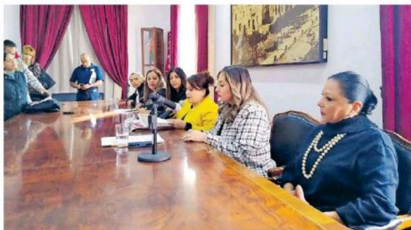
Dicen las quejas que presentaron el lunes pasado un acuerdo legislativo para pedir un informe de acciones.