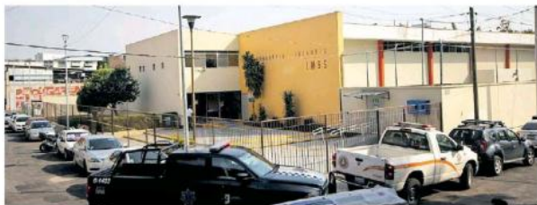
Los infantes resultaron intoxicados en la guardería número 1 del IMSS.

Ya por la noche del martes 36 menores fueron dados de alta bajo indicaciones de observación y con medicamento. Mientras que los otros cuatro restantes se encontraban estables, en proceso de reevaluación, mismos que hasta el cierre de la edición seguían hospitalizados en condición estable, sin embargo era probable que fueran dados de alta durante la noche de este miércoles