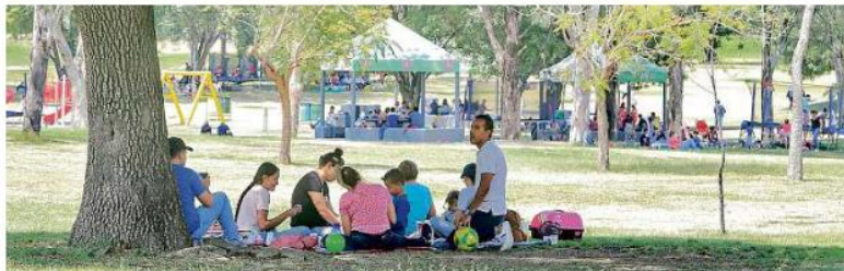
El Parque Metropolitano fue menos visitado que de costumbre.

Donde se registró mayor número de visitantes fue en el corazón de San Pedro Tlaquepaque, con restaurantes