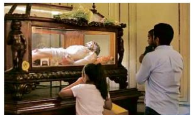
La Arquidiócesis de Guadalajara recomendó no tocar las imágenes religiosas como una medida sanitaria en los templos.

La Arquidiócesis exhortó a los fieles a tomar en cuenta las recomendaciones que, de manera personal y permanente, se deben llevar a cabo. Entre ellas no tocarse la cara, y toser o estornudar 'de etiqueta', así como no escupir al viento.