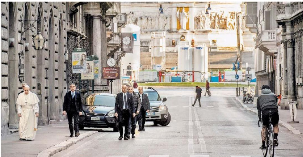
El papa Francisco camina por las calles aledañas a la sede vaticana, en Roma, Italia, país con grave crisis por la pandemia.