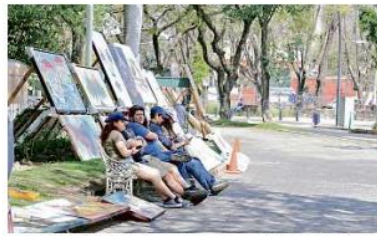
En la Glorieta Chapalita se instalaron vendedores de pinturas, aunque con pocos visitantes.