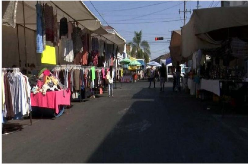
Los pasillos lucieron casi vacíos este domingo. ESPECIAL

ciantes, es inusual que a las 11:00 de la mañana, como ayer, haya poca gente, por lo que consideran que es el miedo a contraer la enfermedad lo que provocó la baja afluencia.