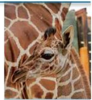
El Zoológico cerrará a partir de mañana.

ayer, Jalisco continuaba con dos casos confirmados de covid-19 y se descartaron 16 casos sospechosos.