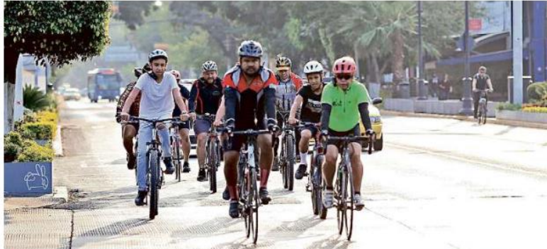
La Vía RecreActiva fue cancelada debido a las medidas preventivas por el covid-19, pero aún así algunos ciclistas salieron.

El centro de Guadalajara también registró una afluencia.