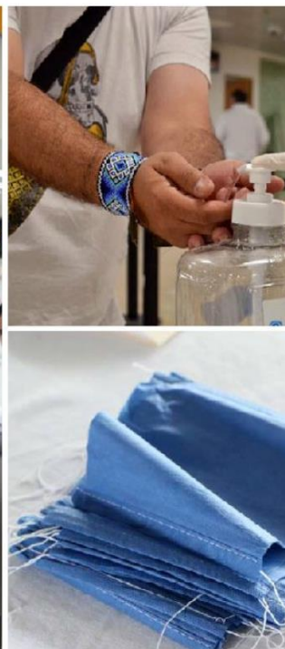
Personas que circulan por terminales aéreas, portuarias y centrales camióneras son sometidas a revisión.