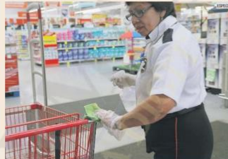
DESINFECCIÓN. En algunos supermercados de la metrópoli limpian de manera continua los carros y canastillas para evitar la propagación del virus.

SECRETARÍA DE TURISMO SANITIZAR LAS ÁREAS Y MANTENER INSUMOS DE LIMPIEZA, ENTRE OTROS