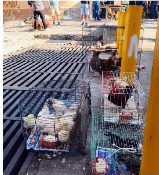
Levantaron 10 actas de verificación.

El Reglamento Sanitario de Control y Protección a los Animales para el municipio de Guadalajara establece que en la venta de aves, peces, tortugas, ratones o cualquier otra especie pequeña, será obligatorio mantener dimensiones adecuadas en las jaulas o recipientes utilizados para su exhibición. Estos deberán ser suficientemente amplios y mantenerse en condiciones de limpieza aceptables, además de una temperatura y luz adecuadas para sus ocupantes. ■