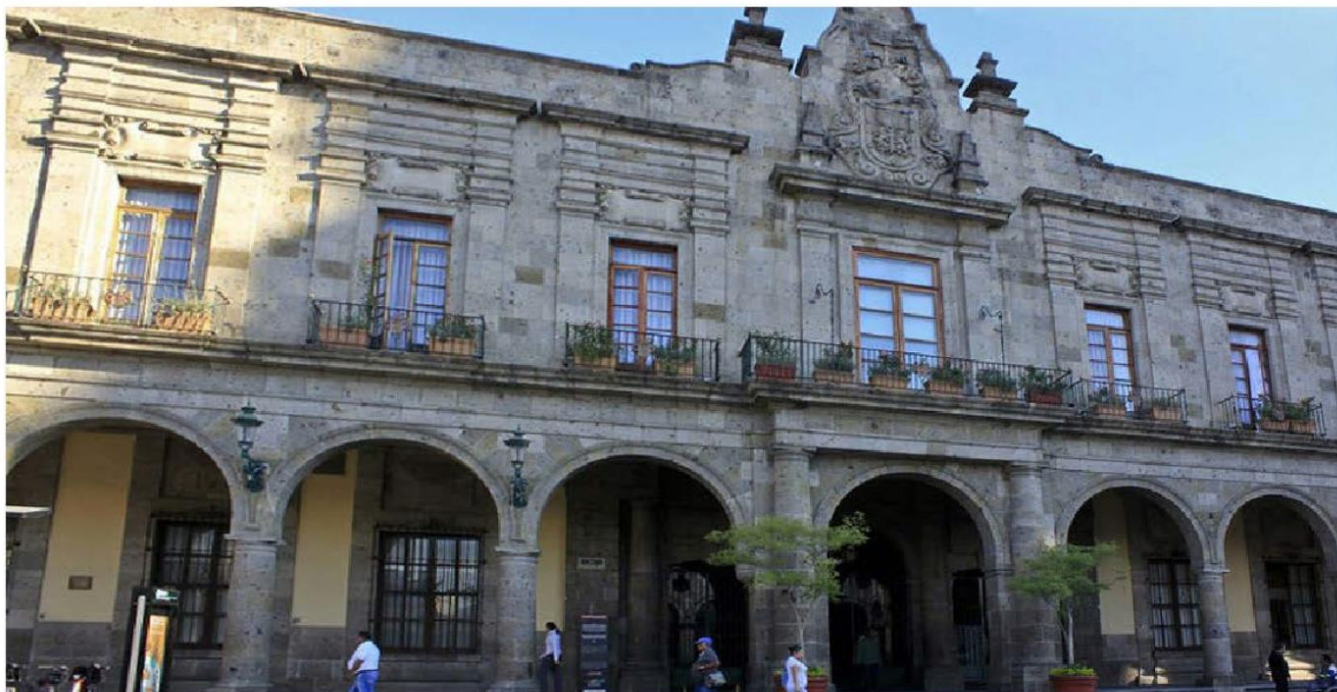
El Ayuntamiento de Guadalajara continuará brindando los servicios públicos de forma regular.