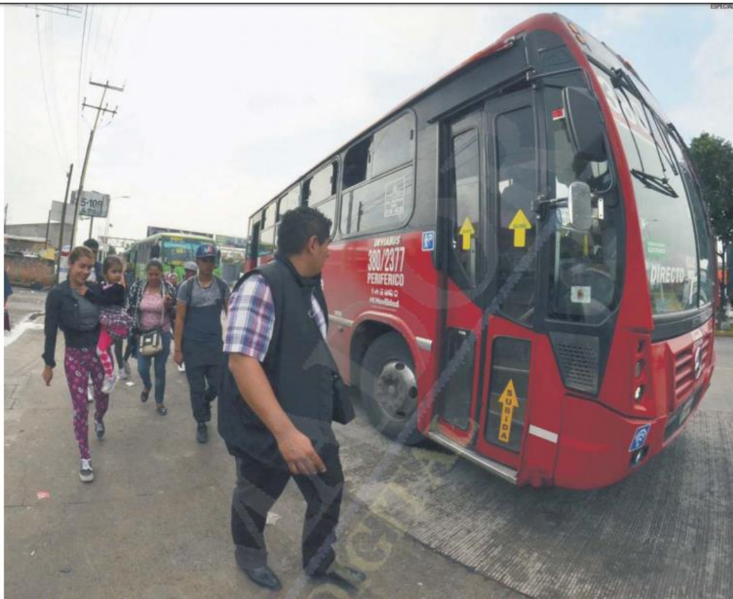
ANOMALÍAS. Los principales señalamientos de la ruta-empresa en la ciudad son las paradas y bajadas irregulares en los autobuses.

Para este plan, durante el año pasado se contempló una bolsa de 310 millones de pesos. El apoyo no debe superar los 80 mil pesos por equipo instalado y es entregado por única ocasión.