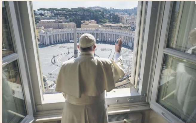
SIN AUDIENCIA. El Papa Francisco mira por la ventana en la plaza vacía de San Pedro durante la oración del Ángelus en el Vaticano. Es transmitida por televisión.