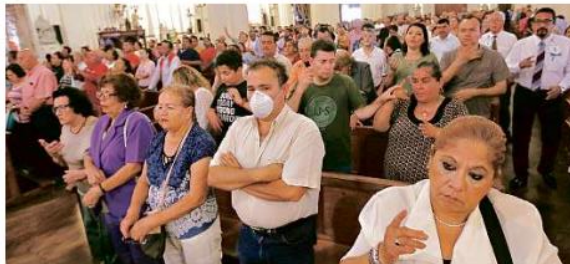
¿POR UN MILAGRO? La Catedral, en la misa presidida por el Cardenal, lució abarrotada.

Las primeras peticiones emitidas dentro de las cele-