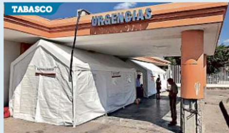
En Villahermosa, el Hospital de Alta Especialidad Dr. Juan Graham Casasús instaló una carpita para pacientes graves.

Aunque en Sinaloa se confirmó uno de los primeros casos de contagio en México, doctores y enfermeras del Hospital General de Culiacán, designado para atender a pacientes con el virus, desconocen los protocolos de atención y advierten que no cuentan con cubrebocas o guantes de látex.