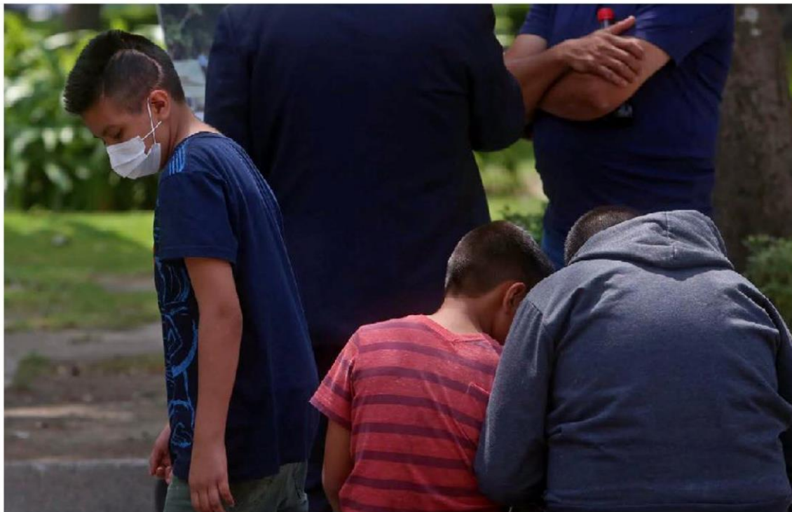
Estudiantes deberán permanecer en casa para evitar contagios. FERNANDO CARRANZA

La decisión de suspender las clases a partir de mañana la tomó