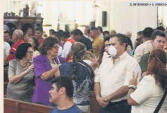
CATEDRAL. En la misa en Guadalajara, los fieles dieron la paz sin tomarse de la mano aunque se sentaron sin guardar distancia. Actividades de Semana Santa, en pie.