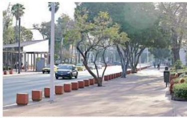
Así lucía ayer la Avenida Juárez a la altura del Parque Rojo a las 10:00 horas.