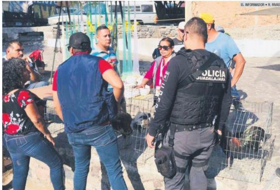
VIGILANCIA. En la supervisión participaron policías de la Comisaría de Seguridad de Guadalajara.

No es la primera vez que, en este año, el Ayuntamiento de Guadalajara realiza operativos en el tianguis de El Baratillo para inhibir el