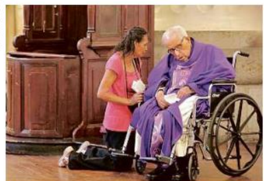
Entre las recomendaciones para no contagiarse se pide evitar la proximidad, aunque en las confesiones no se cumple.