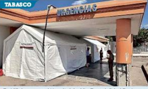
En Villahermosa, el Hospital de Alta Especialidad Dr. Juan Graham Casassú instaló una carpa para pacientes graves.

Aunque en Sinaloa se confirmó uno de los primeros casos de contagio en México, doctores y enfermeras del Hospital General de Culiacán, designado para atender a pacientes con el virus, desconocen los protocolos de atención y advierten que no cuentan con cubrebocas o guantes de látex.