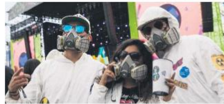
VIVE LATINO. En el evento musical realizado este fin de semana en la Ciudad de México detectaron al menos 27 personas con fiebre.

Uno de los requisitos importantes para que estas instituciones privadas pudieran realizar la prueba, explicó, fue no encarcerar a los pacientes que tienen un valor entre los dos mil y dos mil 300 pesos, que quiere evitar".