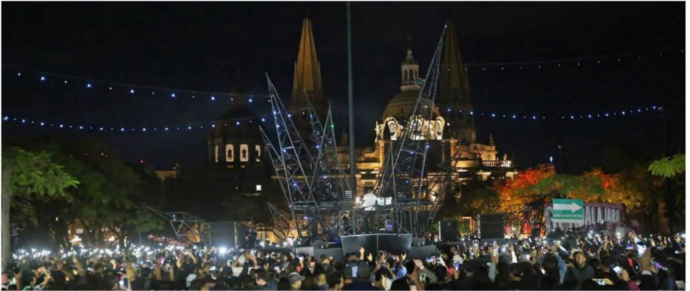
El festival de luces de este año superó la concurrencia prevista.