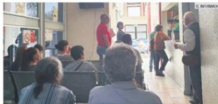
CORTO PLAZO. En 2019 se autorizaron más de 118 mil créditos a pensionados.

« Más que por una sospecha, hemos detectado que no los reportan con el sueldo completo. Se mandaron los oficios a todas las entidades patronales y nos faculta la ley para hacer esta revisión que ya arrancamos »