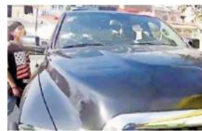
Los policías fueron despojados de sus armas.

Policías del estado en coordinación con municipales de Zapopan, Tlaquepaque y Tlajomulco, desplegaron un operativo