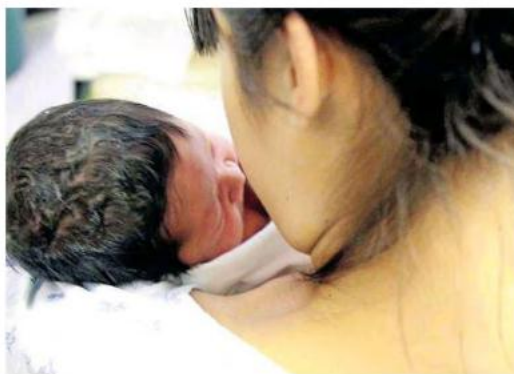
Por cada violación denunciada, hay nueve que no llegan a la judicialización.

En el 24 por ciento, la pareja tenía entre 15 y 17 años y el 10 por ciento era