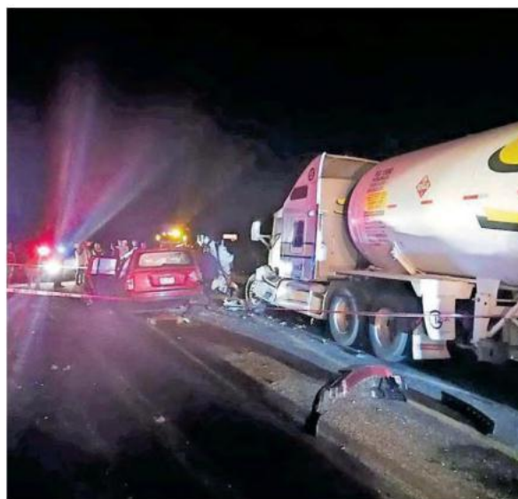
En el lugar chocaron una pipa cargada de gas y dos vehículos particulares.

Datos del Instituto Jalisciense de Ciencias Forenses señalan que en lo que va del año se han realizado 60 autopsias por choques en todo el estado. El municipio de Guadalajara encabeza la lista con 15 casos, mientras que Zapotlanejo registra cuatro fallecimientos por esta causa.