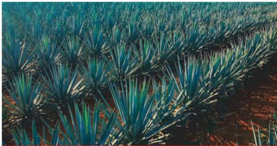
El agave forma parte del agro de Jalisco.

La propuesta fue segmentar en tres programas esta diversidad; al ser considerado Jalisco el "gigante agroalimentario" se destinó uno de ellos para el impulso de las MiPyME, llamado Agro Jalisco