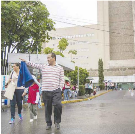
UDAS. La entrada del Insabi ha provocado incertidumbre en los Hospitales Civiles.

Desde la entrada del Insabi, no hay certidumbre sobre los recursos que se otorgan a los Hospitales