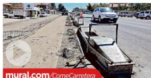
La rehabilitación de la vía terminará en abril. Hay tramos que "mordió" 80 centímetros de los carriles de la carretera.

Sólo que el camino de movilidad no motorizada aparentemente "mordió" de