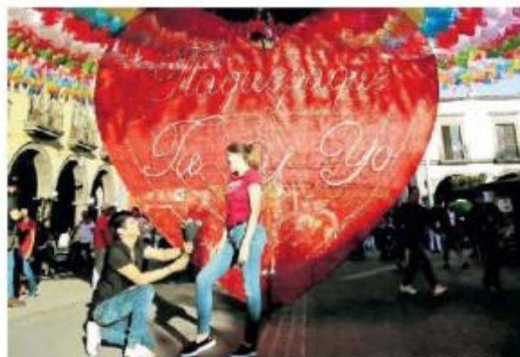
Registro importante de visitantes en febrero.