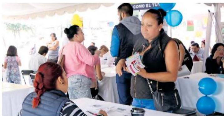
Los jóvenes se ocupan en empleos temporales.

ES EL aporte de la actividad que contribuye con un mayor número de plazas laborales.