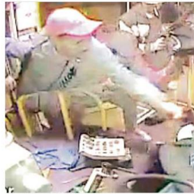
Los robos con violencia ocurren pese a la instalación de cámaras de video en unidades de transporte público.

"Es deseable que los ciudadanos se concienticen en que, pero también es deseable que la autoridad adopte políticas