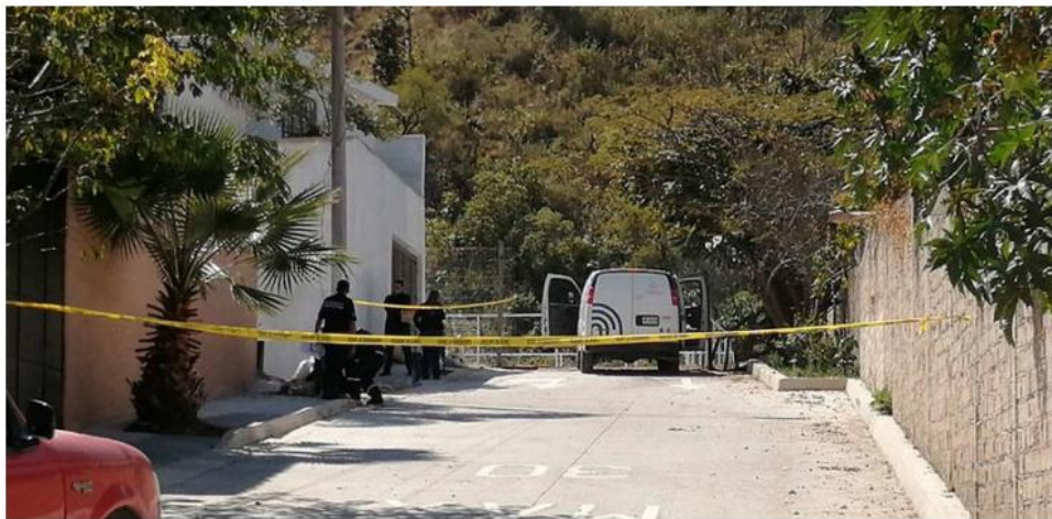
Las víctimas fueron dejadas en la colonia Volcán El Colli. JUAN CARLOS MUNGUÍA

Seguridad. Un hombre y una mujer presentaban heridas de gravedad y el occiso fue amarrado a un poste de madera en el municipio de Zapopan; matan a balazos a joven en San Pedro Tlaquepaque