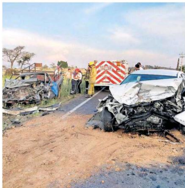
Los socorristas tuvieron que utilizar equipo hidráulico para sacar al fallecido.

El accidente se registró entre una camioneta pick up y un auto Sentra