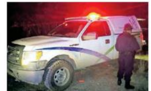
El responsable se dio a la fuga.

Minutos más tarde llegaron los camilleros del Servicio Médico Forense y personal de la Fiscalía del Estado para hacerse cargo del levantamiento del cuerpo y de llevar a cabo las investigaciones para localizar al conductor causante.