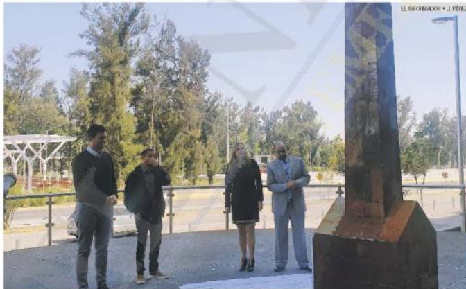
OBRA. La pieza fue colocada en la explanada de la Biblioteca Pública del Estado de Jalisco "Juan José Arreola".

CULTURA LA PIEZA TIENE FORMA DE UNA CHIMENEA