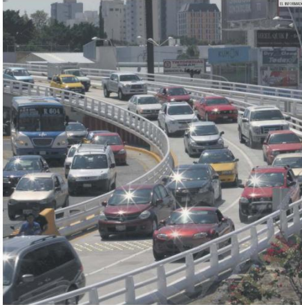
PARQUE VEHICULAR. Los dueños de automotores pueden aprovechar descuentos en febrero y marzo.

"Sobre todo porque en enero y febrero varios meses en los que se tienen que hacer varios pagos oficiales como son el del agua potable y el predial".