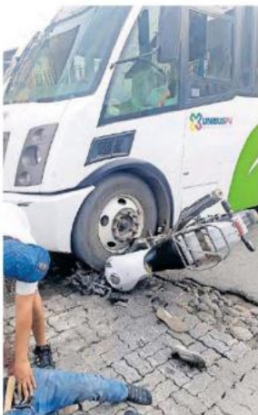
Un joven impactó su moto contra un camión.

Tras el accidente, testigos corrieron para ayudar al joven y sacarlo ya que había quedado debajo del camión. Poco después llegaron los paramédicos de la uni-