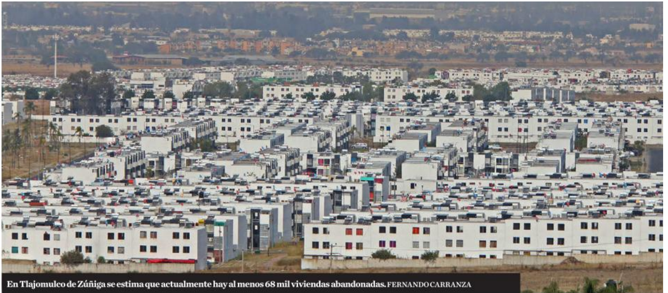
En Tlajomulco de Zúñiga se estima que actualmente hay al menos 68 mil viviendas abandonadas. FERNANDO CARRANZA