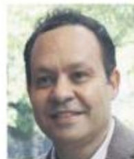
Clemente Castañeda, senador por Jalisco.

“No veo ningún riesgo de que alguno de los alcaldes actuales de Movimiento Ciudadano decida transitar a otros partidos políticos o a otros proyectos. Veo fuerte a Movimiento Ciudadano, veo a nuestros alcaldes concentrados en su trabajo y todos sabemos que, quienes tienen posibilidad de reelec-