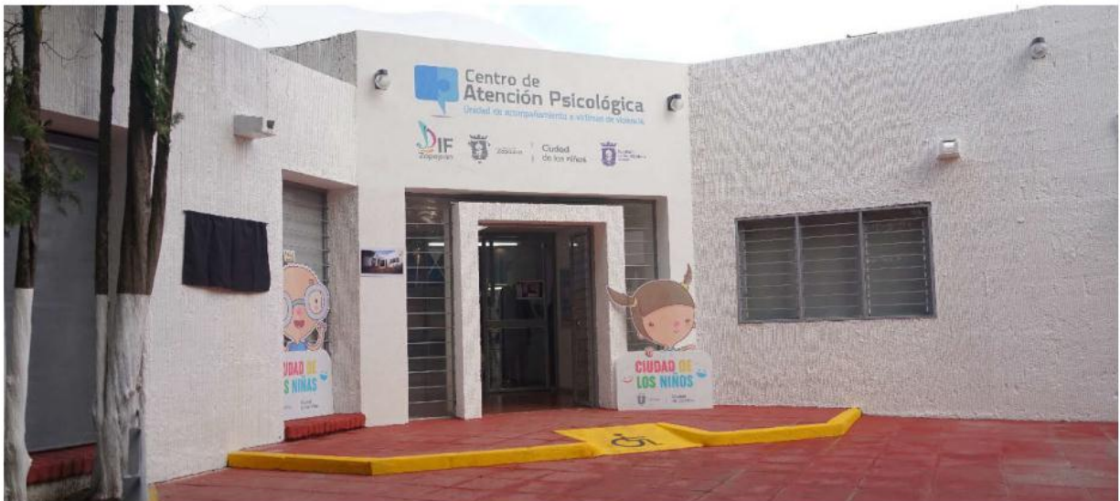
Los recursos de los empleados del sistema municipal habrían sido depositados en cuentas de la lideresa sindical. ESPECIAL