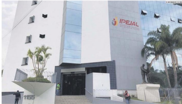
RESERVA TÉCNICA DEL INSTITUTO. Creció mil 751 millones de pesos durante el año pasado, el mayor aumento desde la reforma al sistema del 2009.

Son 30 entidades públicas incumplidas; el municipio de Puerto Vallarta, el que más adeuda El director del Ipejal señala que los retrasos vienen desde anteriores administraciones