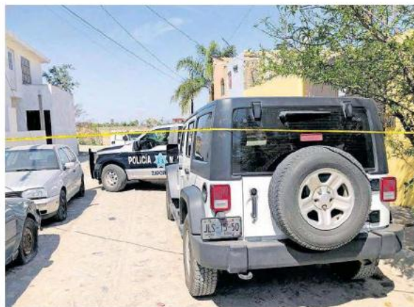
El hallazgo se dio en el cruce de la Avenida Las Torres y Avenida Del Bosque.

El hombre dijo a los empleados de la estación de servicio que a unos metros de distancia, sobre la calle Ejido del Colli estaba un hombre de 35 años, sentado, recargado a un poste de madera y cubierto con una cobija, el cual también presenta-