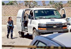
Tres personas fueron privadas de su libertad, torturadas y dejadas en la Colonia Volcán del Colli.

Oficiales atendieron el llamado de emergencia y las víctimas les informaron que habían sido privadas de su libertad días antes y que a unas calles estaba otro hombre herido.