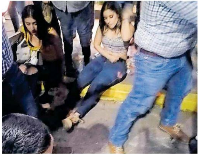
Tras el hecho, el desfile fue suspendido y el caballo asegurado.

Al ver al animal, los demás asistentes se echaron a correr en diferentes direcciones, provocando que las personas se cayeran y que fueran pisadas por otros asistentes.