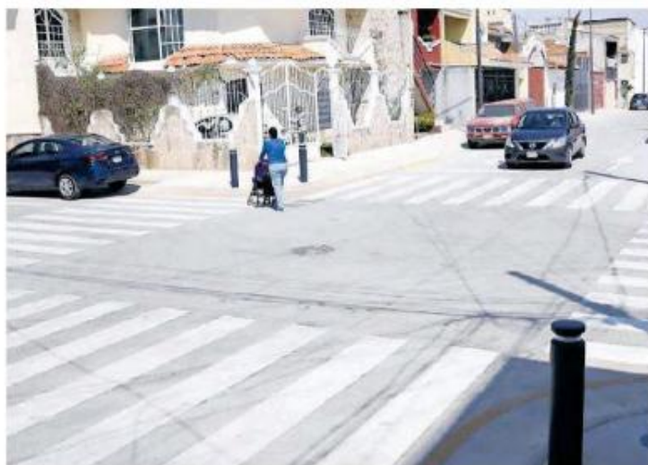
Así luce la colonia a partir de ayer.

Al respecto, añadió, estos trabajos fueron posibles gracias al esfuerzo y coordinación entre las autoridades y sobre todo la ciudadanía, quien