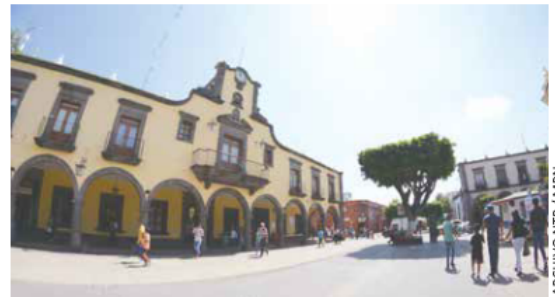
LÍMITE. El acuerdo del IEPC da ultimátum de 10 días hábiles a Tlaquepaque.

El tribunal reencauzó el medio de impugnación al Consejo Gene-