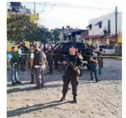
Fue en Tlajomulco. J. MARTÍNEZ

— Sujetos dispararon contra oficiales estatales en Tlajomulco, lo que inició una persecución; tres elementos fueron heridos. PAG. 15