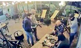
El atraco en el negocio duró cerca de un minuto y medio.

El atraco en el negocio de crepas fue perpetrado por cuatro hombres, quienes se llevaron dos camionetas, celulares, una bolsa y otras pertenencias, además, golpearon a algunos de los comensales. Los hechos fueron captados en video, el cual se difundió en redes sociales.