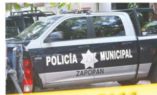
ZAPOPAN. Agentes zapopan hallaron un cadáver en Volcán del Colli.

Los sobrevivientes fueron privadas de su libertad días atrás. Por otro lado, la Fiscalía dio a