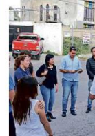
Vecinos de El Fortín aseguran que por las noches no hay patrullaje.

“No tenemos focalización como tal El Fortín porque no tenemos las denuncias, de hecho no tenemos las solicitudes de vigilancia por parte de los vecinos, por ese motivo es el cual acedimos el día de hoy (ayer), pero en la coordinación que se tiene con personal de la Fiscalía no tenemos catalogado al Fortín como una colonia con problemas”, aseguró el mando.