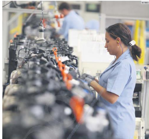
EMPLEO. La industria automotriz en Jalisco genera más de 30 mil plazas directas.

En menos de cuatro años, las ventas anuales de vehículos eléctricos e híbridos en Jalisco casi se han triplicado, con mil 756 unidades vendidas en la Entidad entre enero y octubre de 2019, a diferencia de los 624 coches de este tipo que se vendieron en todo 2016, señala el Instituto de Información Estadística y Geográfica de Jalisco (IIEG). A pesar de este crecimiento, el mercado eléctrico sigue siendo una fracción del mercado automotriz que apenas representa el 2% de todas las ventas que se hacen en la Entidad. Sin embargo, Ríos estima que es posible que los vehículos eléctricos dominen el mercado en menos de 30 años.