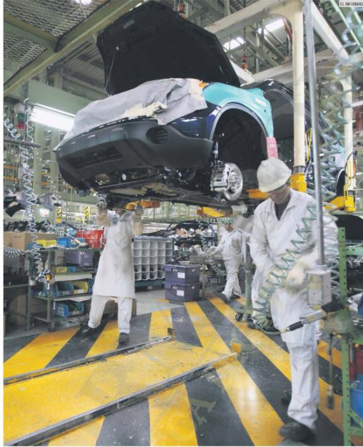
REDUCCIÓN. En los primeros nueve meses de 2019, la inversión extranjera para la industria automotriz apenas fue de 51.5 millones de dólares.

La planta de Honda es la única de este tipo en Jalisco, y antes de los ajustes por parte de la compañía, producía 160 unidades del modelo "HR-V" de forma diaria.