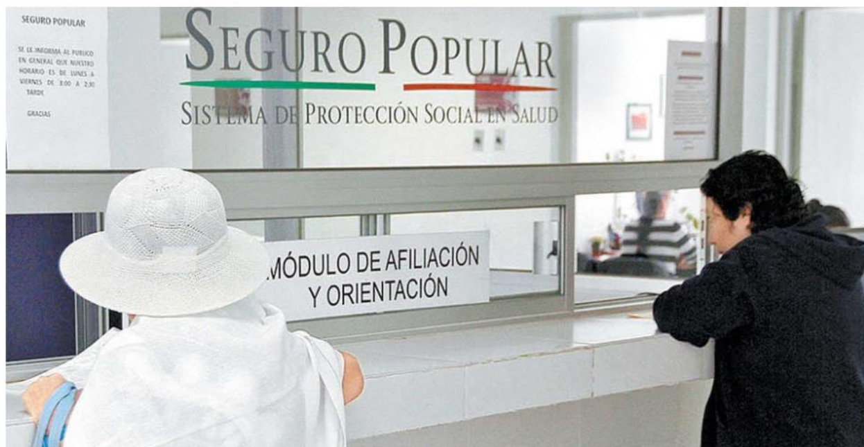
Ayer se instaló una mesa de trabajo.