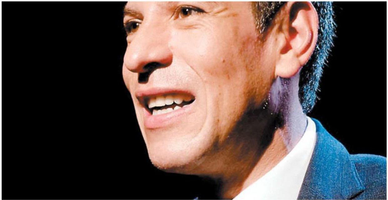
El imputado también se fue a pasar el fin de año a Manzanillo. ESPECIAL