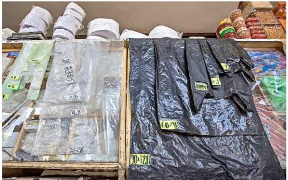
La norma, de aprobarse en el Pleno del Ayuntamiento, estaría vigente desde febrero.

"La micro y pequeña empresa como mercados, tianguis y tiendas de las colonias,