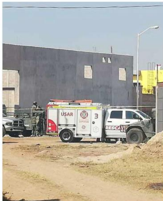
El jueves fueron encontradas 2 fosas más.

“Dentro de las sugerencias que se nos hicieron en materia de seguridad pública y personal, como responsables en la materia, estaba incluida esa que nos pareció bien en ese momento. Como la ley marca, que hay que hacer una solicitud a Sedena, la hicimos con todas las formas se-