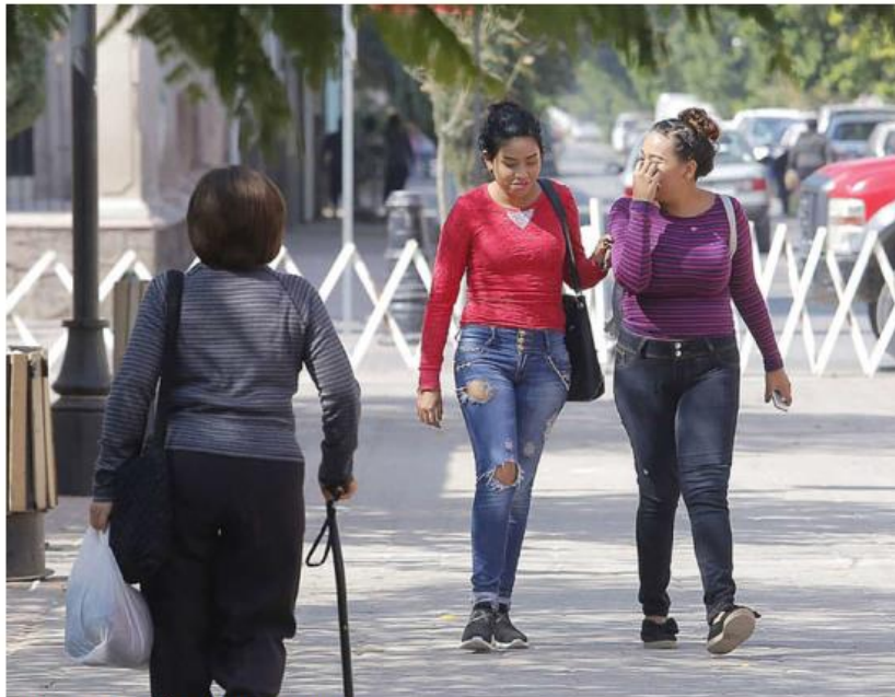
El estudio detectó 33 casos. ESPECIAL

“Otro tipo de violencia que se manifestó con mujeres fue en materia de seguridad, como las amenazas, comentarios en sus páginas públicas de Facebook y cuentas de