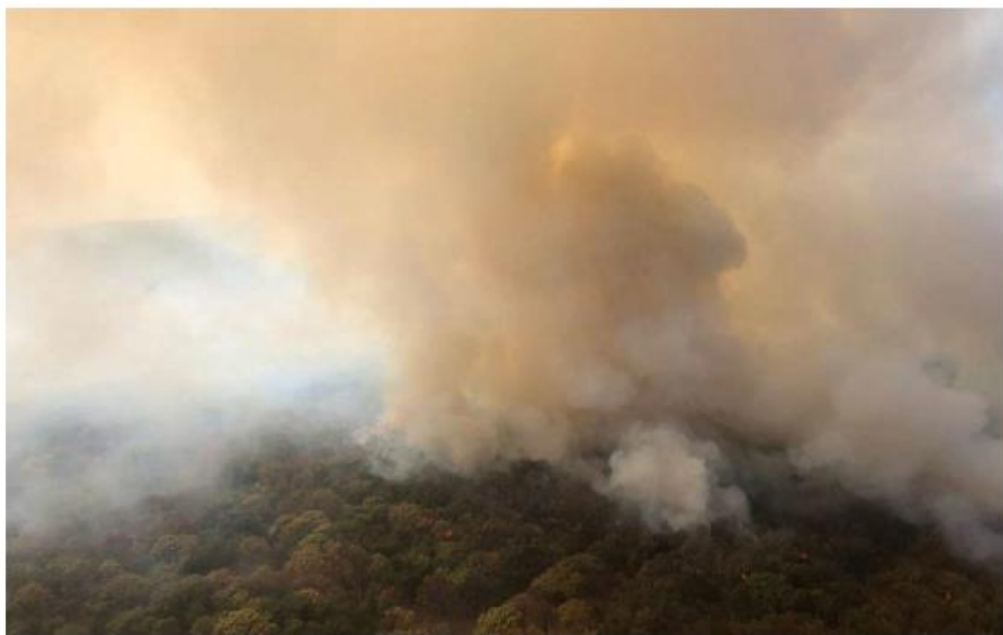
En 2019, cinco municipios concentraron el 50 por ciento de las afectaciones. ESPECIAL

El gobernador de Jalisco, Enrique Alfaro Ramírez, señaló que con estas estrategias “vamos a tomar una serie de medidas adicionales a las que cada año se tomaban, vamos a tener un trabajo preventivo, no solamente reactivo y esperamos que pueda darnos resultados. Sabemos que en México en los últimos años las