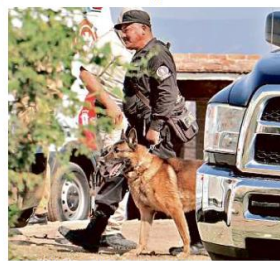
Policías del Estado llegaron al terreno con perros entrenados en la búsqueda de cuerpos, para apoyar a peritos.

“De los mismos que van construyendo sus casitas y eso, para que los camiones con ese material entren, pues hacen los vecinos las calles parjetas para que vayan entrando”, explicó la habitante consultada.