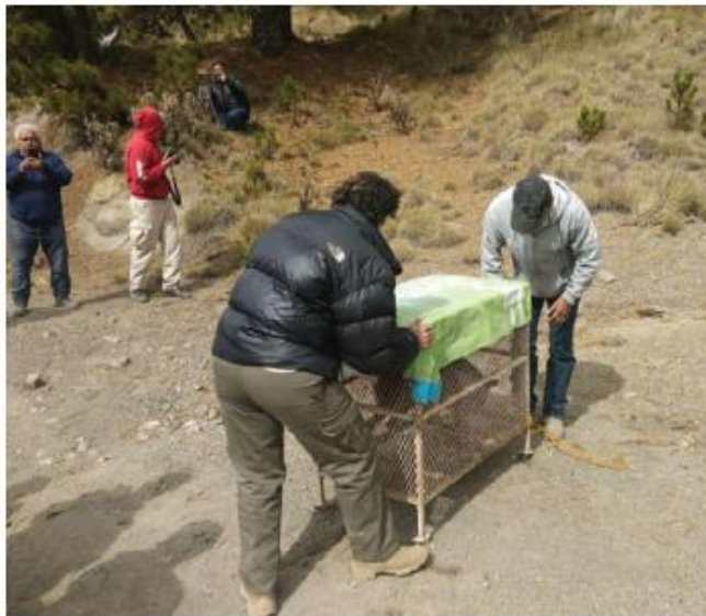
Realizaron una revisión completa de los animales.