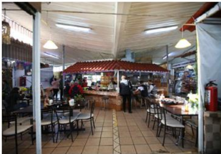
Se invirtió casi un millón de pesos en remodelación.

También se realizó la remodelación mercado con una inversión de 931 mil pesos con beneficio directo para 18 locatarios, así como a sus comensales. ■