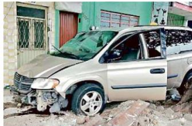
El responsable iba en un Dodge Grand Caravan.

Los hechos ocurrieron cerca de las 11:25 horas sobre el cruce de las calles Juan de Dios Robledo y San Pedro, en la colonia citada. Cuando llegó personal de Protección Civil y Bomberos de Guadaluajarra, encontraron una carroza de una funeraria que al parecer circulaba sobre San Pedro cuando fue chocada por una Dodge Grand Caravan que lo hacía por Juan de Dios Robledo.