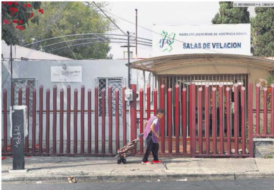
SERVICIO. En el DIF señalan que aunque las salas se encuentran cerradas, el servicio aún se brinda a los jaliscienses.

Desde que el IJAS dejó de operar, en la actual administración, sus atribuciones pasaron a la Secretaría de Administración, la Secretaría del Sistema de Asistencia Social, y el Sistema para el Desarrollo Integral de la Familia