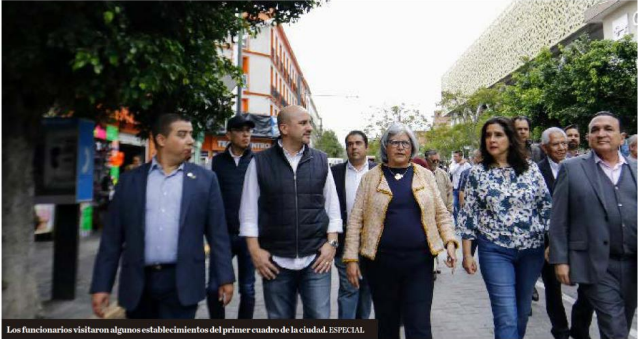
Los funcionarios visitaron algunos establecimientos del primer cuadro de la ciudad. ESPECIAL