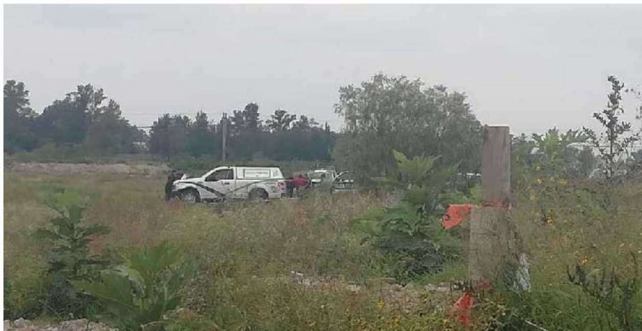
Un cuerpo fue localizado en un terreno en San Martín de las Flores. ALEJANDRA JUÁREZ