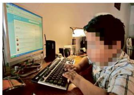
Al usar internet, los menores están expuestos a diversos retos virales que pueden poner en riesgo su integridad.

De acuerdo con el académico Víctor Orozco Estrada, integrante del departamento de psicología básica del Centro Universitario de Ciencias de la Salud (CUCS), de la UdeG, este tipo de material viral llega a encontrar en los adolescentes su mayor público porque apenas aprenden a