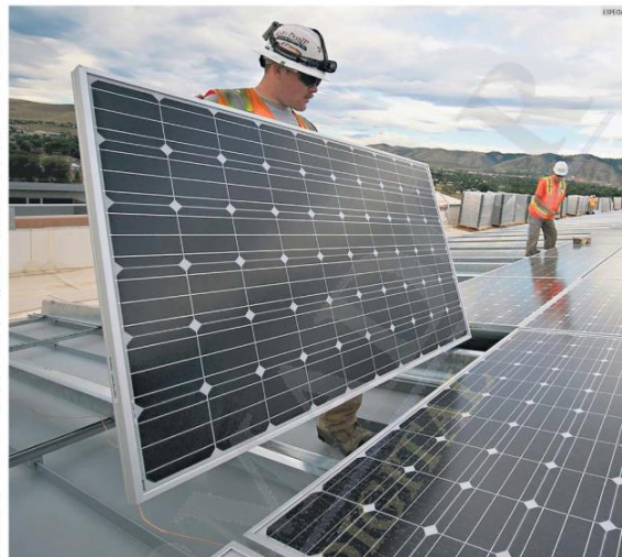
AHORROS. Con la instalación de paneles solares, los usuarios logran economías de hasta 98% en el pago de energía eléctrica.