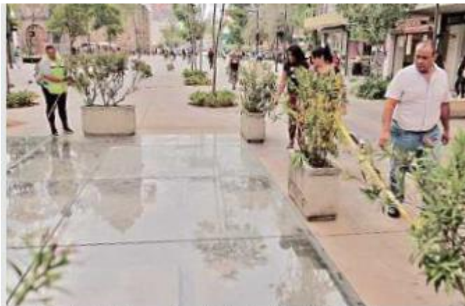
■ La Fundación Paseo Fray Antonio Alcalde tendrá a su cargo la conservación de patrimonio cultural del sitio.

La Fundación está integrada por el Ayuntamiento tapatío, la Cámara Nacional de Comercio, Servicios y Turismo de Guadalajara, la Arquidiócesis de Guadalajara y la asociación los Amigos del Paseo Fray Antonio Alcalde.