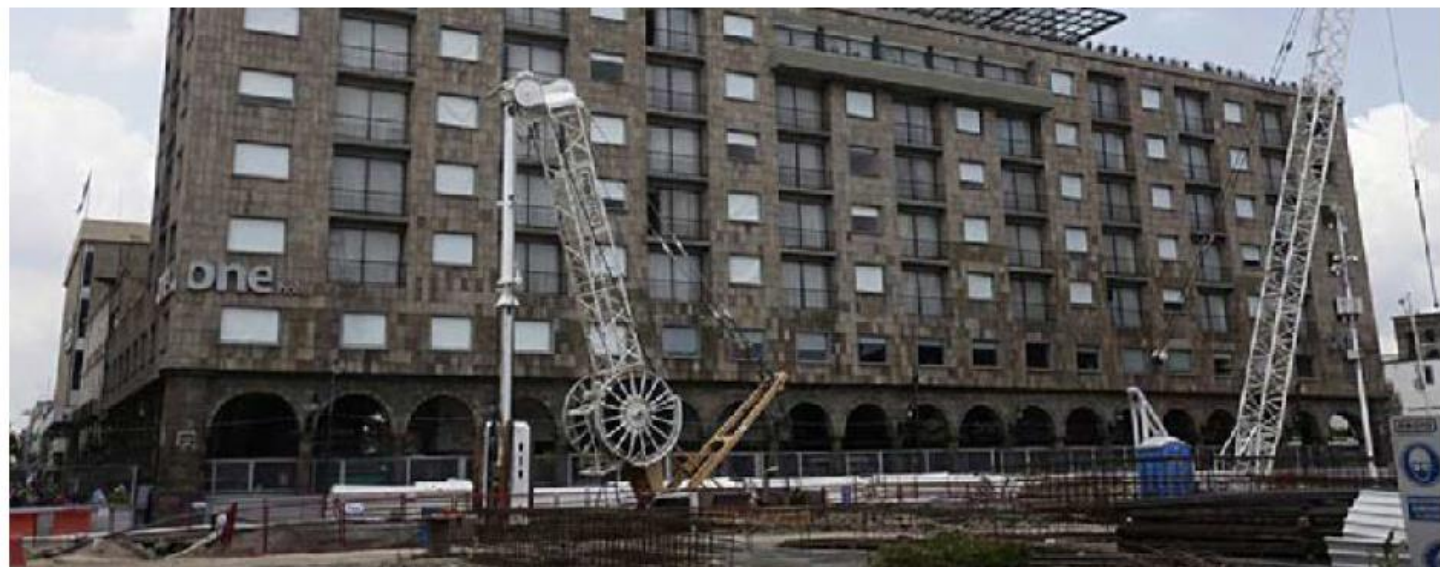
Desde 2015, el inmueble ha sufrido afectaciones por la construcción de la Línea 3 del Tren Ligero. ESPECIAL