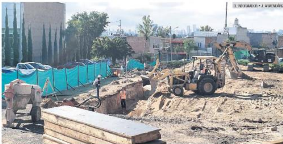
PREDIO. Los vecinos afirman que no fueron consultados para realizar la obra.

"Nunca se nos tomó en cuenta cuando empezaron estas obras. Hasta después supi-