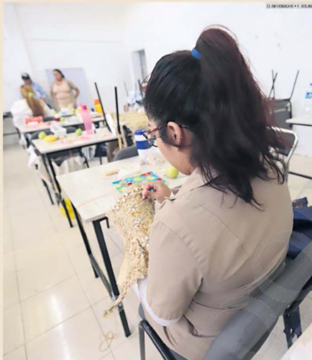
TIEMPO. Mibsam lleva cuatro años y cinco meses en Puente Grande. Coser en un taller dentro del reclusorio le ha ayudado a que las horas pasen más rápido. Con el dinero que obtiene compra productos de higiene personal.

-Había sido violentada, golpeada, ultrajada. Estaban teniendo una discusión y la co-