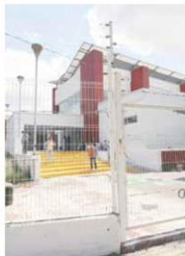
IJCF. La mayor parte de los recursos usados corresponde al programa de ciencias forenses.

MILLONES DE PESOS es la suma de los recursos de la Federación y Jalisco al Fondo de Aportaciones para la Seguridad Pública