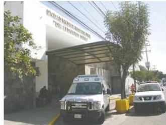
POR LA MAÑANA. Después de haber sido atacado con arma blanca, un joven fue atendido en la Cruz Verde Leonardo Oliva, pero falleció.

Posteriormente, notificaron a la Fiscalía del Estado para iniciar investigaciones por parte del