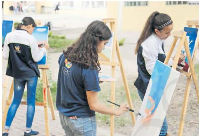
SELECCIÓN. En el INPSIEE se evalúa a quienes podrán ingresar al CEPAC.

En el Instituto se cobra una cuota de recuperación de 50 pesos por servicio y por se-