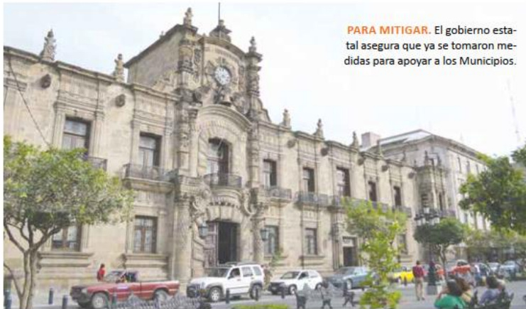
PARA MITIGAR. El gobierno estatal asegura que ya se tomaron medidas para apoyar a los Municipios.