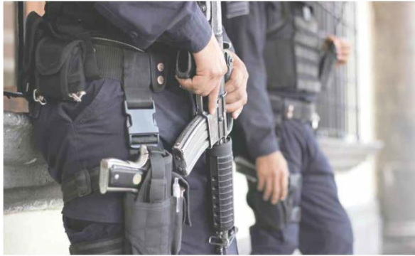
EN UN PARAJE DESPOBLADO. Agentes de Tlaquepaque localizaron el cuerpo de un hombre en la comunidad San Martín de las Flores de Abajo.

Los paramédicos ya no pudieron salvarla y corroboraron el deceso para enterrar a su familiar público. Juan Levario