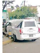
Cuando quiso escapar, el chofer se impactó contra una carroza.

El primer vehículo terminó impactado contra un boliche que se encuentra justo en la esquina de las calles, mientras que la camioneta se impactó contra un poste de cableado telefónico, lo desprendió y terminó su marcha sobre una acera tras chocar contra una finca. Elementos de la dependencia informaron que ve-