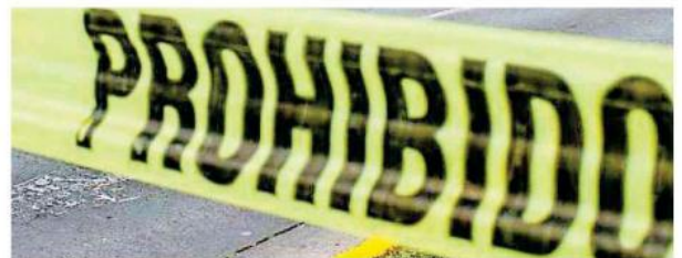
Se trataba de un hombre que estaba sobre una brecha.

Una vez que apagaron el incendio, los bomberos entraron a la casa y encontraron al hombre calcinado, tirado en la sala,