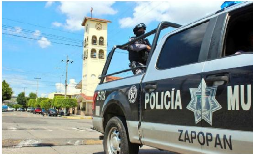
Refuerzan la vigilancia en el municipio.