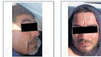
Los detenidos son Jorge "N", de 43 años, y José "N", de 26 años.

Los oficiales intervinieron y arrestaron a quienes dijeron llamarse Jorge "N", de 43 años de edad, y José "N", de 26 años. En la acción los