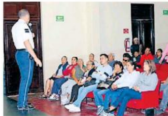
El objetivo fue conocer las inquietudes de los comerciantes. COMISARÍA TLAJOMULCO