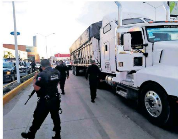
Policías de Tlajomulco detuvieron a tres sujetos.

Los detenidos, a quienes les aseguraron una pistola, quedaron a disposición del Ministerio Público para que determine su situación legal.