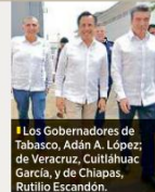
Los Gobernadores de Tabasco, Adán A. López; de Veracruz, Cuñahuac García, y de Chiapas, Rutilio Escandón.

social, las entidades de Morena obtendrían 59 por ciento. En contraste, de ese monto, los 22 Estados gobernados por el PRI y el PAN recibirían 30.8 por ciento.