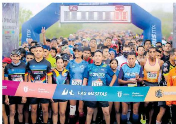
Ni la neblina ni el fuerte frío impidió que la gente se diera cita.