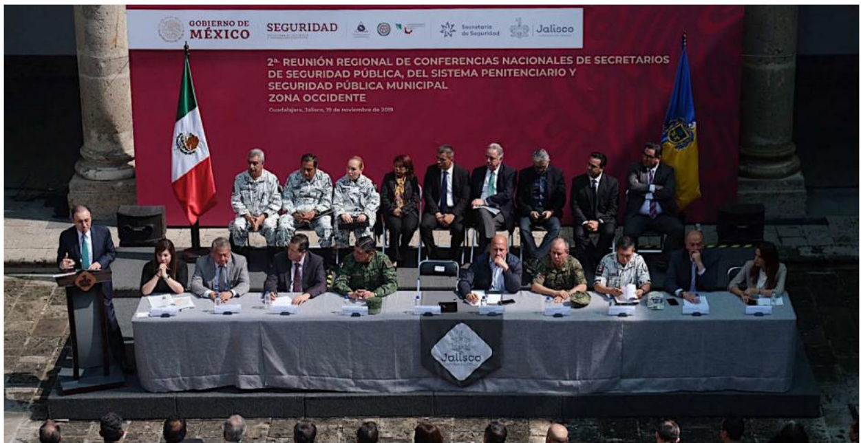
En el patio central del Palacio de Gobierno, los funcionarios explicaron las estrategias en la materia.