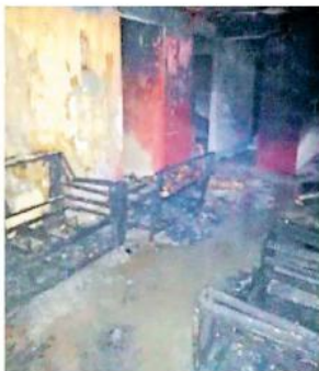
Los hechos en el cruce de Sierra Chagori y Sierra Condoriri en Lomas del Mirador.

Una vez que apagaron el incendio, los bomberos entraron a la casa y encontraron al hombre calcinado, tirado en la sala,