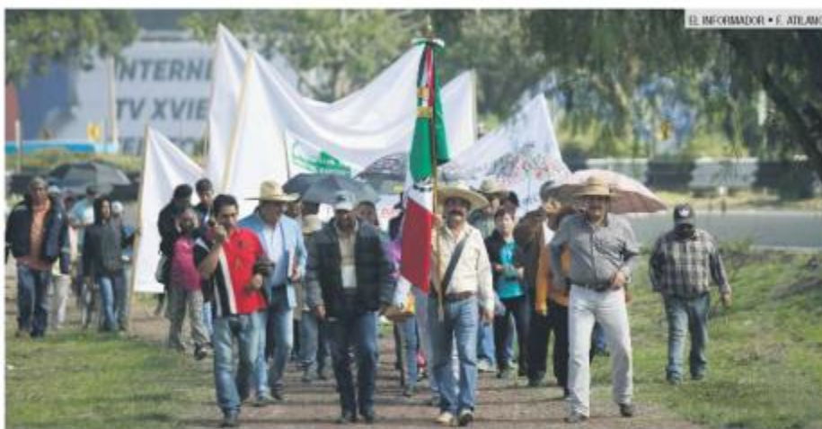
LUCHA. Los comuneros, durante su manifestación rumbo a la terminal aérea.

Desde el domingo, los ejidatarios tienen “tomado” el estacionamiento del Aeropuerto y permiten el paso libre a esa zona a los conductores. Amagaron que seguirán con esa medida por el tiempo que sea necesario, es decir, en plantón indefinido.