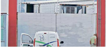
La CEDHJ emitirá una recomendación por los llamados "trailerres de la muerte".

Personal que labora en las instalaciones del complejo penitenciario de Puente Grande acusó que la actual dirección de Reinserción realizó cambios que los maltratan y ponen en riesgo su vida. A ellos les informaron que sus jornadas pasarán de trabajar 6 horas a 8 horas diarias sin aumento de sueldo y les suspenderán el transporte de personal, lo que los obligará a encontrarse con ex internos que firman beneficios o familiares de reos, dijeron.