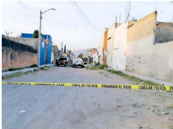
Policías tonaltecas se desplazaron a la confluencia de Periférico y Cihualpilli.

Al acudir confirmaron que a bordo de una camioneta, pick-up tipo Cheyenne, de color rojo, con placas de circulación del estado de Michoacán, sin reporte de robo,