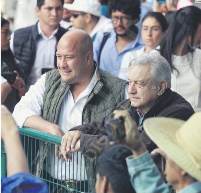
REZAGO. Tras la última visita de López Obrador a Jalisco, Enrique Alfaro confirmó que se prevé un recorte de tres mil 500 millones de pesos en 2020. Sin embargo, esto también hay afectaciones.