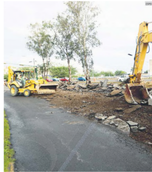
AVANCE. El Gobierno de Jalisco recibirá recursos federales para el Peribús. Las obras ya comenzaron con el cambio de pisos.

● Las 15 alcaldías son: Ahualulco, Bolaños, Gómez Farías, Hostotipaquillo, Ixtaccihuatlan del Rio, Jaliscoatlán, San Gabriel, San Martín de Bolaños, Santa María de los Ángeles, Santa María del Oro, Tecolotlan, Tula, Tototitlic, Unión de San Antonio y Villa Guerrero.