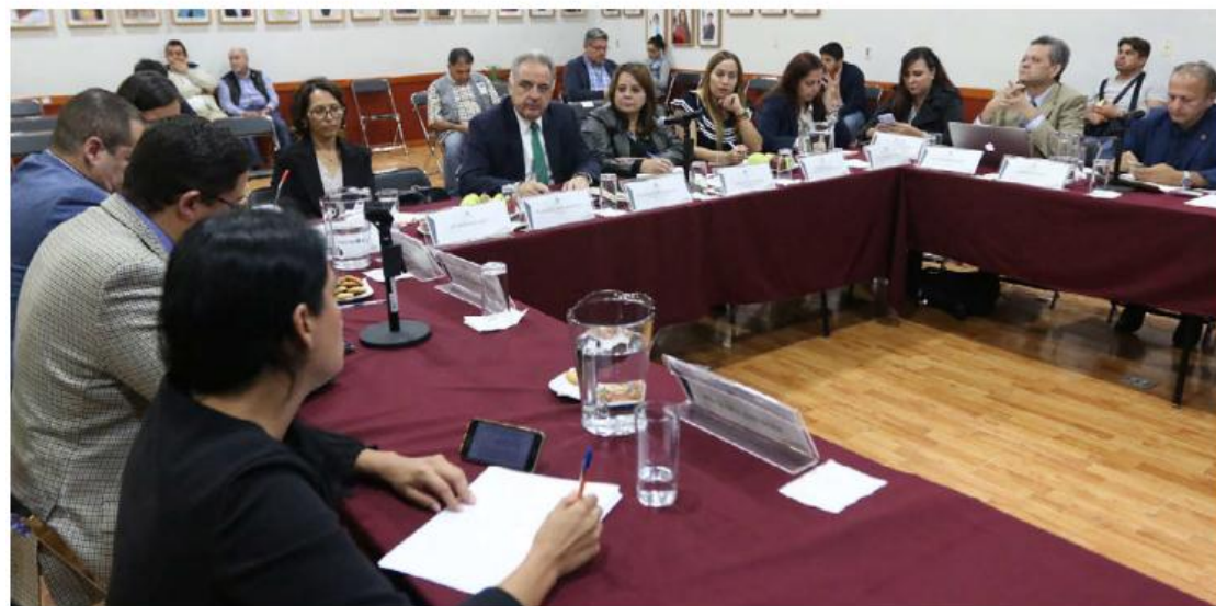
Especialistas e integrantes de la sociedad civil debaten.

Ejercicio. Abordan los resultados y plantean propuestas para avanzar en temas pendientes para el estado