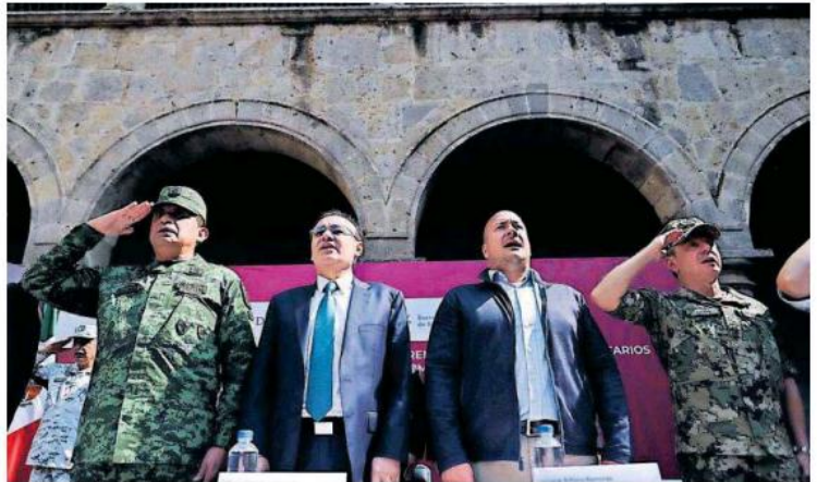
Alfonso Durazo Montaño, secretario de Seguridad Pública federal; y Enrique Alfaro Ramírez, gobernador de Jalisco, en la reunión de Conferencias Nacionales.

Destacó que desde la conformación de la Guardia nacional se comprometieron para Jalisco el envío de tres mil 600 elementos, de los cuales a la fecha han llega-