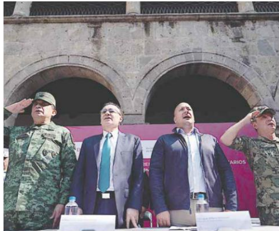
REUNIÓN. Las autoridades federales estuvieron ayer de visita en Guadalajara.

“Los planes y planteamientos que hemos puesto sobre la mesa se necesitan reforzar desde el ám-