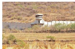
La prisión nunca se utilizó como tal por estar a las faldas de un cerro. Ahora estudian convertirla en un hospital.

Tras explicar todo el proceso de licitación, el Ejecutivo reiteró que WEP es la única que demostró cumplimiento de los requisitos técnicos y administrativos, por lo que resultó ganadora, aunque dos empresas participantes se inconformaron por considerar amañado el proceso, como se publicó ayer.