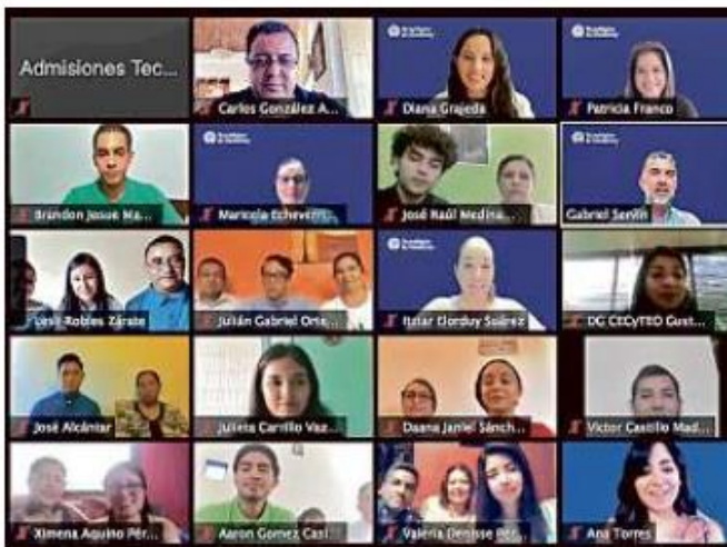
■ La Beca Líderes del Mañana 2020 fue entregada a 18 jóvenes para realizar sus estudios universitarios.