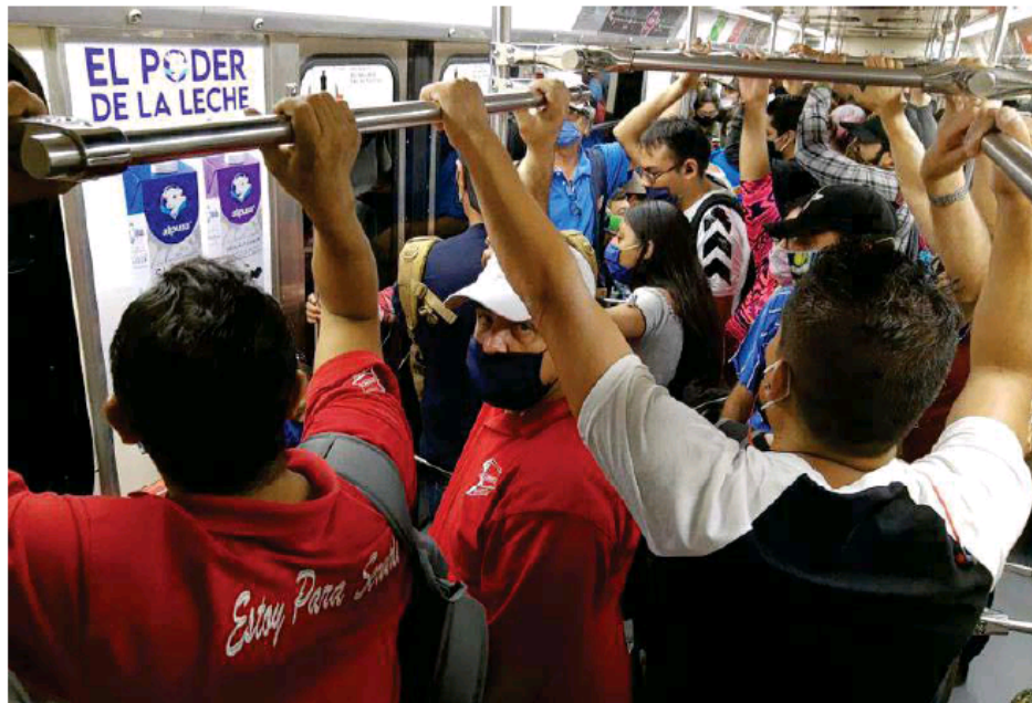
Imposible mantener la sana distancia en el Tren Ligero a horas pico.

En base a la Secretaría de Salud Jalisco por municipio de residencia, las 1,177 defunciones reportadas por Jalisco corresponden: Guadalajara (484), Zapopan (124), Tomatlán (3), El Grullo (4), Tonalá (62), Acatic (1), Puerto Vallarta (93), Tequila (2), Tecolotlán (1), Tlajomulco (46), Ocotlán (16), Colotlán (2), La Barca (11), Zapotlán del Rey (2), San Julián (2), Tlaquepaque (112), El Salto (29), Tepatitlán (3), Poncitlán (3), Ixtlahuacán de los Membrillos (3), Cihuatlán (5), Ayutla (2), Huejutlar (1), Villa Corona (5), Ameca (5), Ahualulco (5), Zapotlán el Grande (10), Cocula (6), Pihuamo (1), Jocotepec (6), Teuchitlán (3), Tala (13), Autlán (6), Tototlán (1), Chapala (3), San