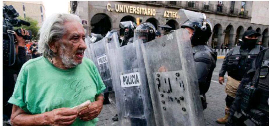
Siguen las investigaciones para esclarecer los hechos. ANTONIO MIRAMONTES.

El 13 de julio pasado se enviaron a la CNDH las promociones recibidas por parte de las autoridades, que son los oficios de contestación a la CEDHJ.