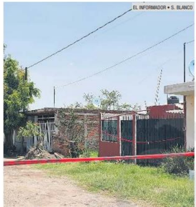
ZONA. Actualmente está sellada por la Fiscalía estatal.