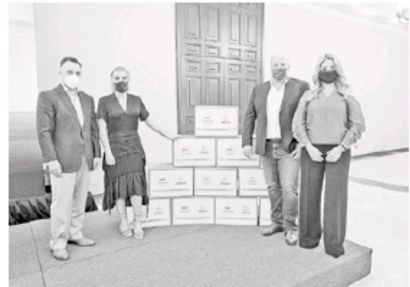
Donación de despensas de una empresa.

En los próximos días el centro de producción de despensas instalado en la Expo Guadalajara será desmontado para darle paso a las actividades propias de ese recinto ferial.