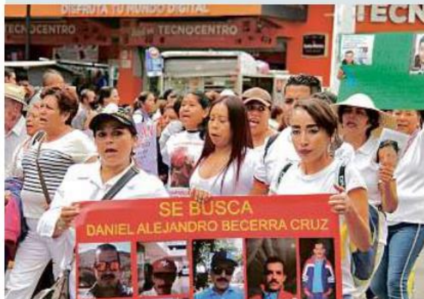
■ Familiares de desaparecidos no ven avances en las iniciativas en torno a leyes del tema.

MURAL publicó que colectivos de familias de desaparecidos pidieron a las instituciones, principalmente a la Fiscalía, mayor sensibilidad y empatía, para evitar normalizar situaciones graves como el hallazgo de fosas clandestinas.