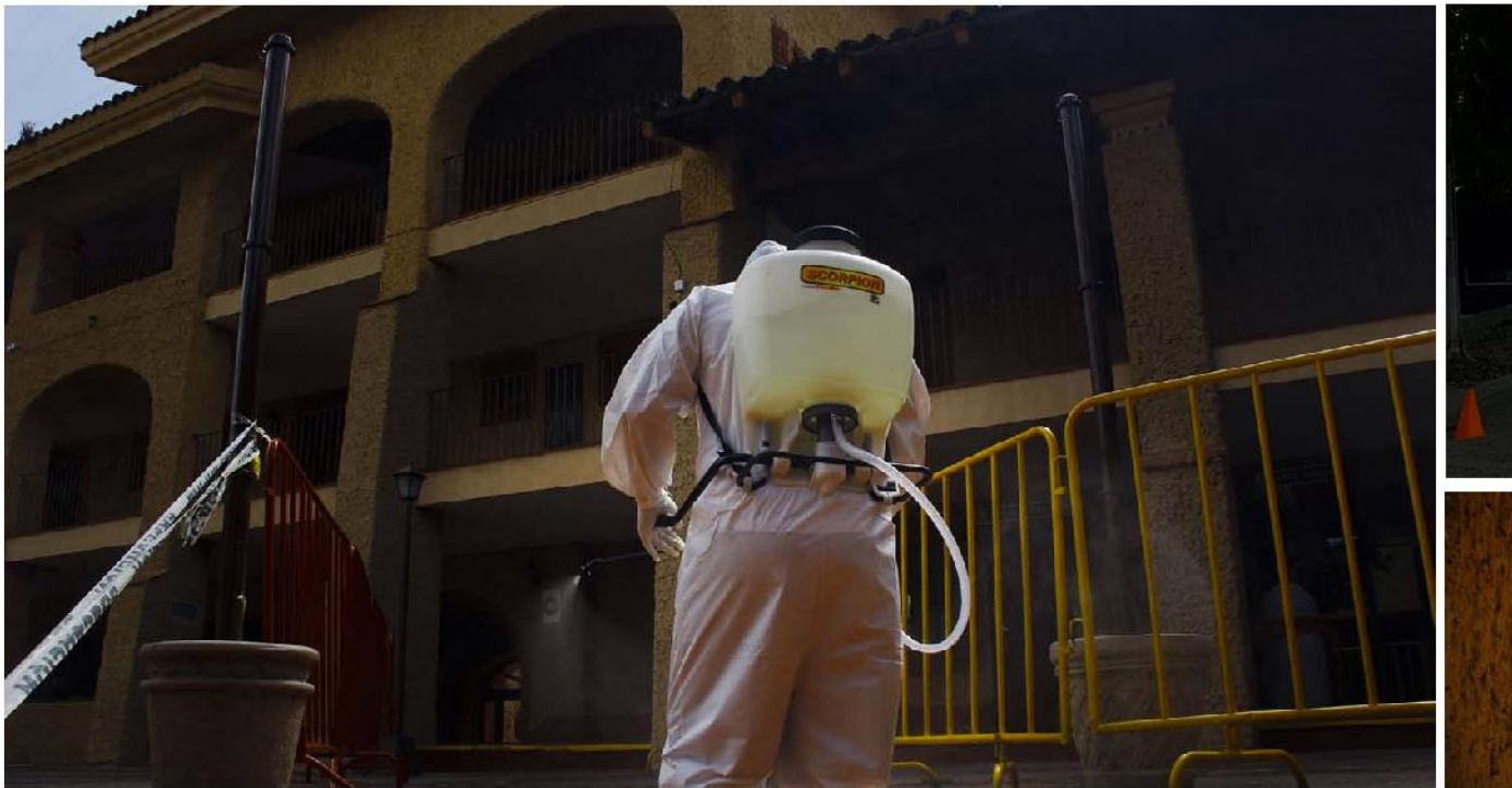
Con 18 internos se evitó un contagio de unas mil 640 personas.