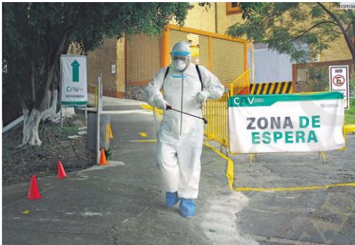
SOLIDARIDAD. El Centro de Asilamiento Voluntario de la Universidad de Guadalajara cuenta con más de 100 trabajadores y especialistas que brindan atención gratuita a los pacientes con COVID-19. El objetivo es romper cadenas de transmisión.