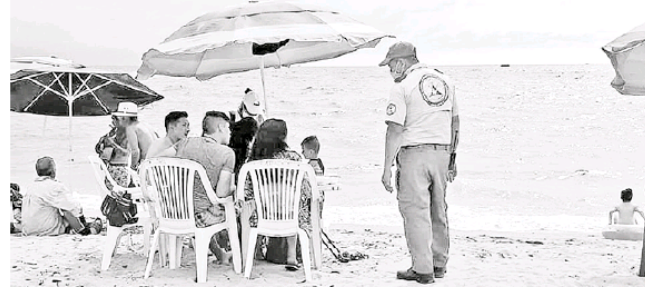
El fin de semana pasado, bañistas llegaron a las playas vallartenses.

En el caso de defunciones también se tuvo un incremento pero no fue considerada alarmante ya que antes de la apertura de playas el promedio era de 1.4 muertes por día y subió a 1.9 los decesos y en el indicador de personas hospitalizadas se