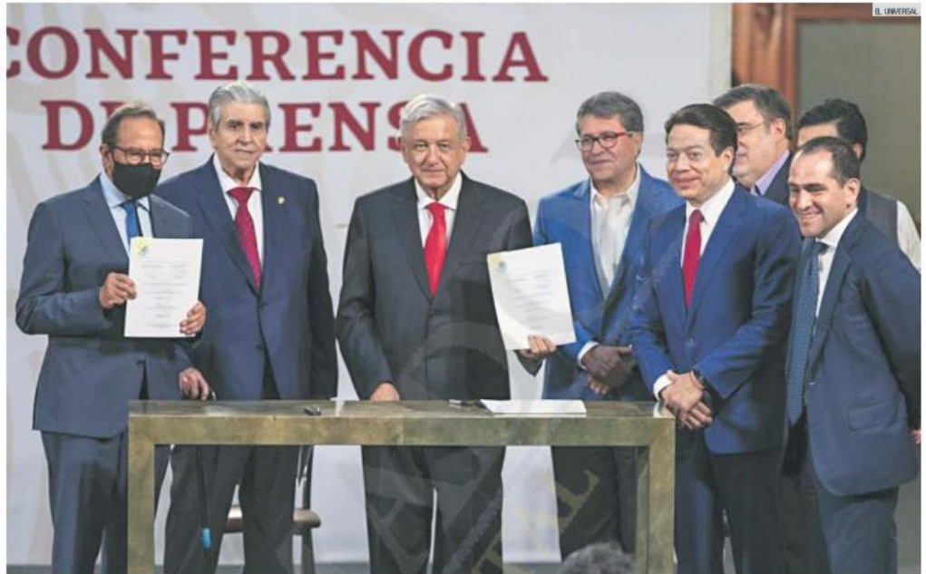
UNIÓN. Andrés Manuel López Obrador celebra el acuerdo entre legisladores, empresarios y sindicatos, quienes participaron en la propuesta para reformar el sistema de pensiones. El documento será enviado al Congreso.

También los trabajadores independientes pueden beneficiarse porque si están entre los 34 y 36 años de edad, tienen aún 30 años más para alcanzar las semanas de cotización.