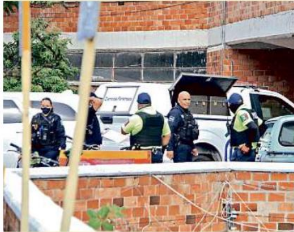
■ En el estacionamiento del Mercado Libertad ejecutaron a un locatario, alrededor de las 16:30 horas de ayer.

El día de ayer hubo cuatro ejecuciones. Una de ellas ocurrió en el estacionamiento del Mercado de San Juan de Dios, pues mataron a un locatario; otra fue en la Colonia 1 de Mayo, en Guadalajara; una más en Villa Fontana Aqua, Tlajomulco, y otra en La Jauja, en Tonalá.