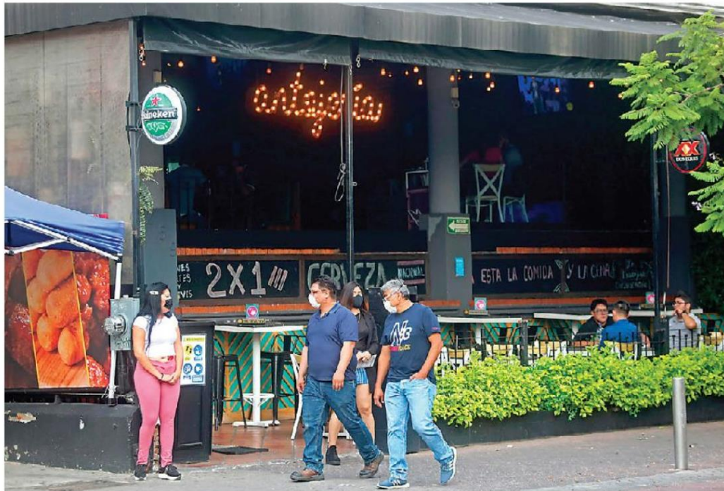
Decenas de bares lucen abiertos y con clientes, sin embargo los dueños de estos giros protestan porque no pueden abrir. FERNANDO CARRANZA