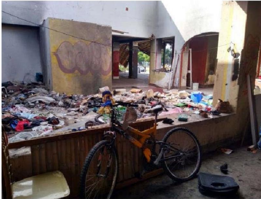
Las poblaciones callejeras construyen su identidad como resultado de la exclusión social.