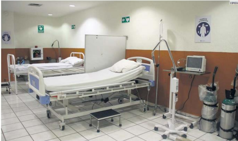
SERVICIO. Los pacientes instalados reciben consejos para conocer cómo se utilizan los insumos médicos de su habitación.