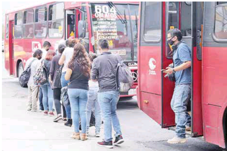
Los empresarios camioneros recibirán apoyos por parte del Gobierno Estatal.

En la Secretaría de Transporte entendemos que el transporte público sea un servicio de escrutinio permanente, sin