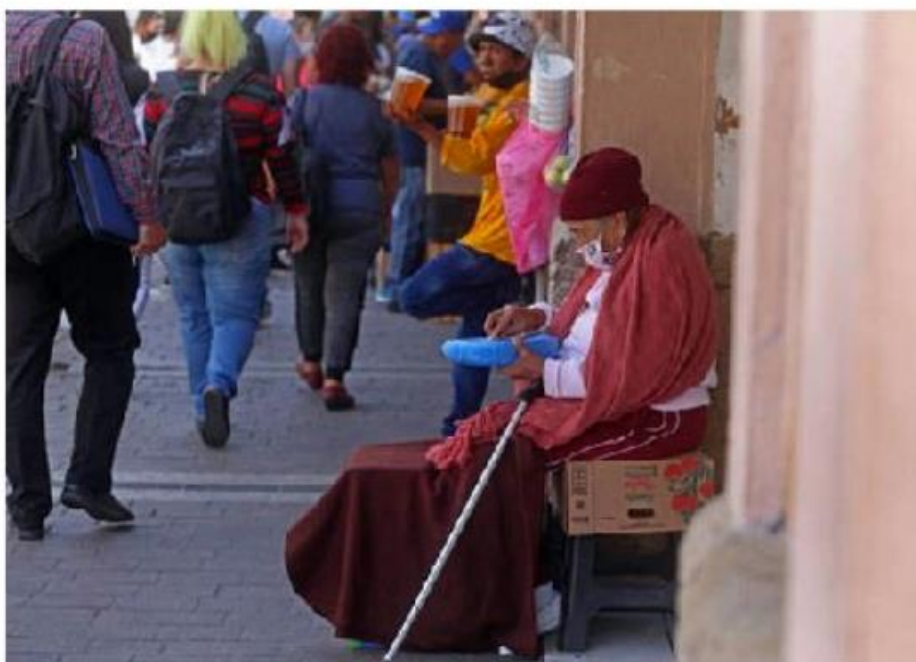
Quienes trabajan en la calle, de los más afectados. ESPECIAL

En cuanto a defunciones, se han registrado mil 277 casos en la entidad, de los cuales mil 277 corresponden a residentes de 70 municipios de Jalisco; y los otros 33 a