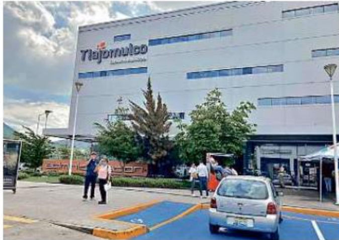
■ Tlajomulco avaló un crédito hasta por 100 millones de pesos.

“El Covid evidentemente nos ha traído un problema serio de recaudación, las participaciones, inclusive federales, disminuyeron radicalmente ya en el mes de julio,