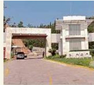
■ México Inversiones es desarrolladora de El Cielo Country Club.

Sobre al despido de dos funcionarios acusados de corrupción por avalar la urbanización de El Cielo, México Inversiones señaló que se dieron en medio de un ardid publicitario del Alcalde para justificar su actuación ilegal en su contra, y en búsqueda de notoriedad ante la ausencia de resultados.