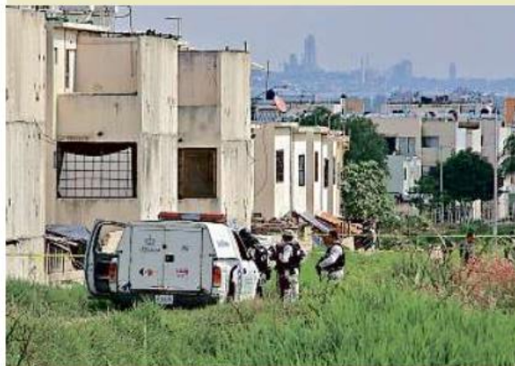
■ A las 9:50 horas hallaron el cadáver carbonizado de un hombre en Villa Fontana Aqua, en Tlajomulco.