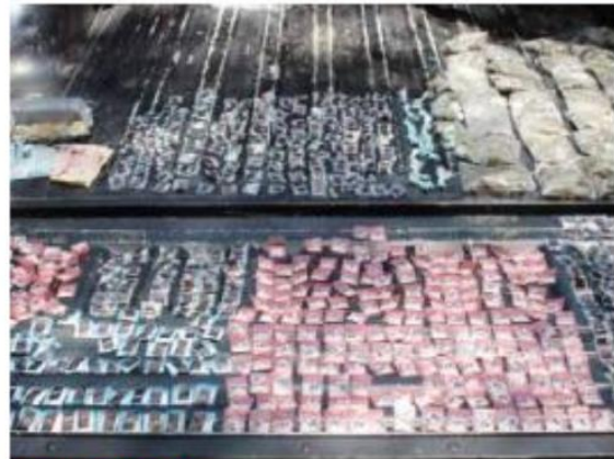
ES CUARTO NACIONAL. Jalisco sumó 261 casos de delitos contra la salud.

Asimismo, la incidencia en Jalisco de 453 delitos violatorios a la Ley Federal de Armas de Fuego y Explosivos le merecieron el quinto lugar en México con respecto a un primer lugar de Baja California, que tuvo 652 investigaciones.