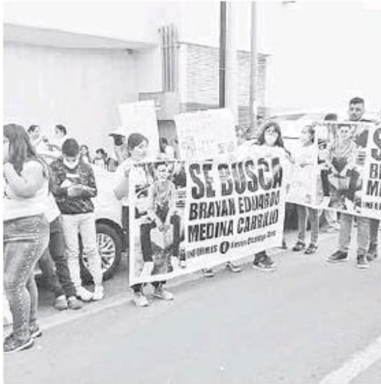
Se manifestaron afuera de Casa Jalisco.