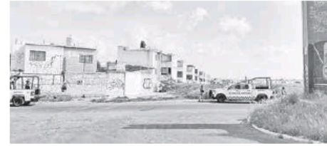
Ambos cuerpos fueron abandonados en la vía pública.

Fueron socorristas de la Cruz Verde, quie-