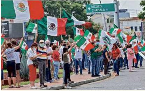
■ Frena convoca a manifestar contra AMLO en La Minerva.