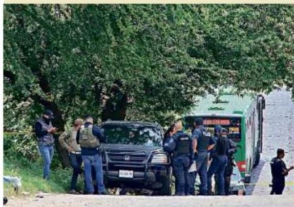
■ Un individuo fue asesinado a tiros en La Jauja, Tonalá, y otro más en la Colonia 1 de Mayo, Guadalajara (foto).