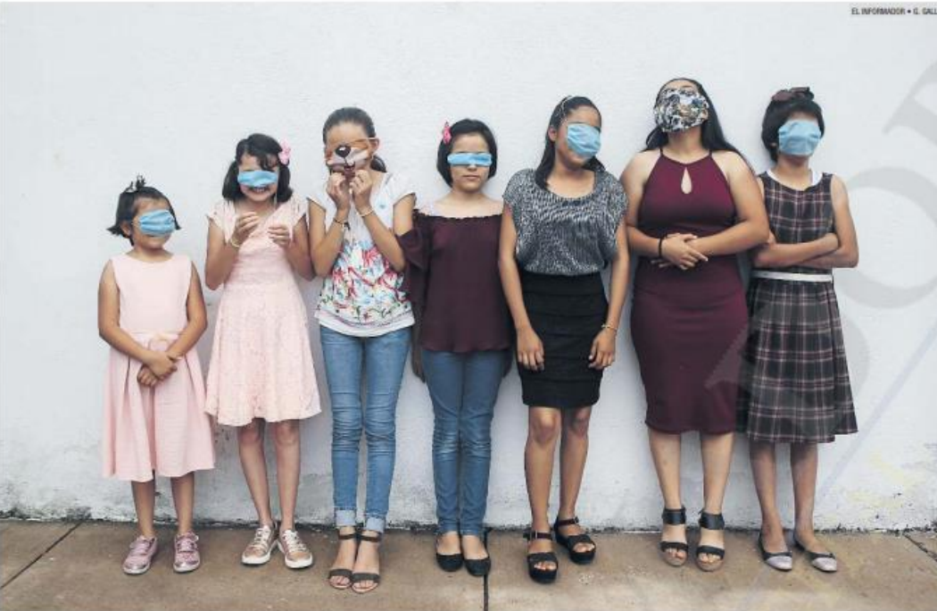
POR UN HOGAR. En el albergue Florecitas del Carmen, en Zapotlanejo, viven 20 niñas. Algunas esperan la oportunidad de integrarse a una familia.

Para recibir más informes, marque al teléfono 33-3030-8200, en las extensiones 48591 y 48441.