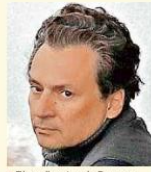
El ex director de Pemex dejó el hospital ayer.

Una fuente cercana a Lozoya aseguró que los males de salud del ex director de Pemex, relacionados con el reflujo y problemas de esófago, debilidad generalizada y anemia, son anteriores a su llegada a México e incluso, poco antes de su extradición, fue exacerbadamente de la presión