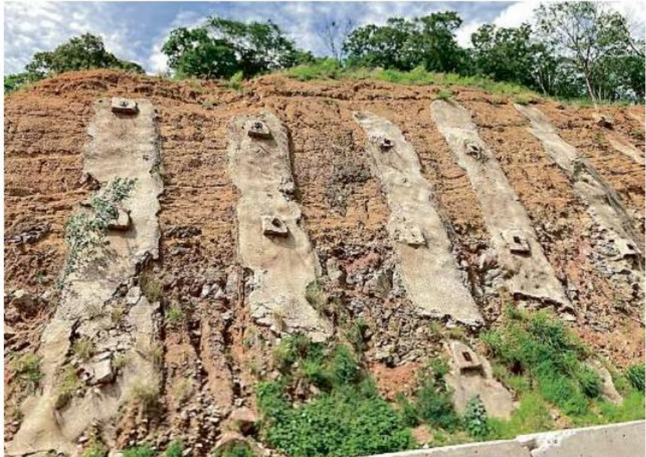
■ En la autopista Jala-Compostela se presentan derrumbes con las lluvias.

Es así como a partir del kilómetro 25 con dirección a Compostela se mantiene infraestructura vial que desvía el tránsito vehicular hacia un carril del otro sentido de la carretera que se habilitó a contraflujo.