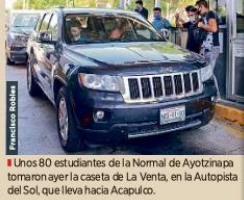
Unos 80 estudiantes de la Normal de Ayotzinapa tomaron ayer la caseta de La Venta, en la Autopista del Sol, que lleva hacia Acapulco.