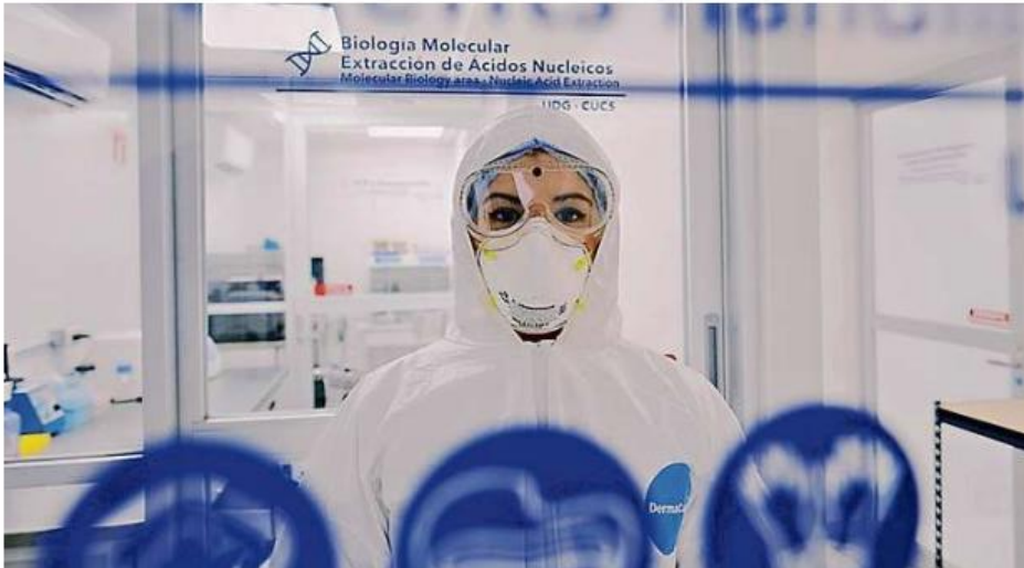
En el CUCS de la UdeG realizan pruebas de coronavirus previa cita vía telefónica.

Llegué 15 minutos antes a la cita en el Centro Universitario de Ciencias de la Salud. Una docena de carros hacían fila sobre la Calle Monte Cáucaso, a unos metros de la Calzada Independencia, y aunque lento, todos avanzábamos con nuestra cara de angustia con el apoyo de un