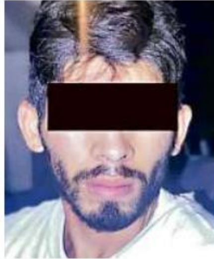
Rostro cubierto por la autoridad