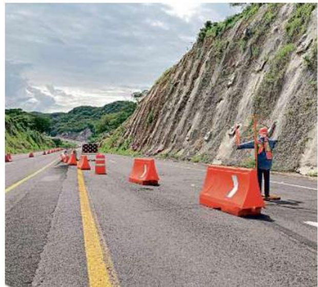
■ La Operadora MRO realizaba labores de mantenimiento en la autopista y cerró dos carriles.

Esta carretera de Guadalajara a Puerto Vallarta comenzó a construirse en 2012 y suma seis años de retraso para su conclusión. Registra un incremento del 89.4 por ciento en el costo para la SCT, según observó la Auditoría Superior de la Federación (ASF).