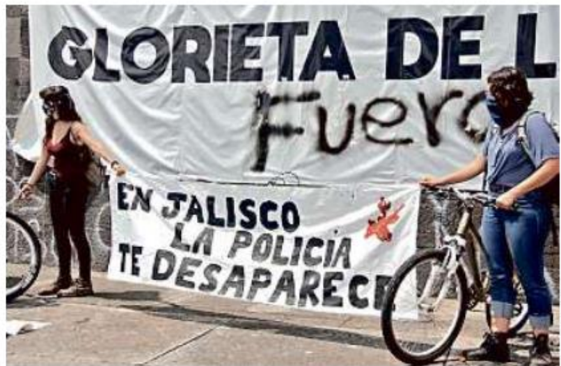
■ Familiares de desaparecidos se manifestaron ayer en la Glorieta Niños Héroe y en Casa Jalisco.