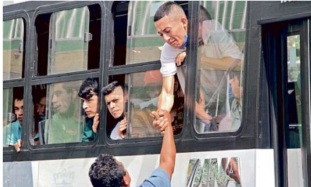
AL BORDE DEL LLANTO. Antes de ser llevado a la Fiscalía para ser entrevistado, un joven estresado le toma la mano de su familiar. En el centro de rehabilitación presuntamente había maltratado.

“Localizamos el vehículo del compañero abandonado, así como otros dos vehículos: un taxi y una camioneta Journey en color plata, que