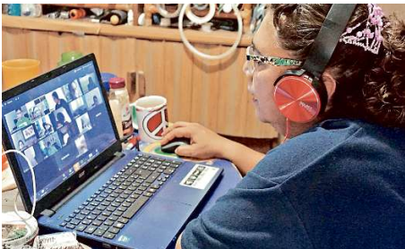
El próximo lunes regresan los estudiantes a las clases virtuales.

"Muchos de nuestros alumnos ni siquiera cuentan con equipo propio (como computadora o tablet) o conexión a Internet desde casa, en el ciclo escolar pasado como tres meses estuvimos con clases virtuales y vimos