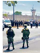
El asesinato ocurrió el pasado 22 de mayo.

MATAN A TRES EN EL ESTADO Entre el jueves y la madrugada de ayer, tres hombres murieron de manera violenta. Uno fue asesinado a golpes y con un arma blanca en Tepetitlán. En Lagos de Moreno se halló otro cadáver, mientras que en un hospital falleció un hombre atacado a balazos en Las Huertas, en Tonalá, el 18 de agosto. Staff