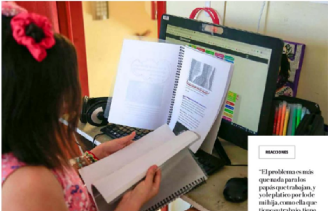
Los niños iniciarán el ciclo escolar de forma remota. ESPECIAL

"Se me hace ilógico, no sé cómo lo vean los maestros, es de pedirles tantos útiles, al menos