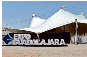
El evento será el 2 y 3 de septiembre en Expo Guadalajara.

"Tenemos expositores muy interesantes, desde proveedores de arcos sanitizantes, de cabinas sanitizantes, de las cuales se checan incluso temperatura, te sanitizan todo el cuerpo al mismo