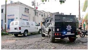
Al lugar acudió personal del grupo de reacción de la Comisaría de Zapopan, en un vehículo blindado.