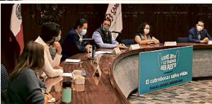
Empresarios y asociaciones civiles presentaron ayer la campaña "Para que no dejen de aprender".