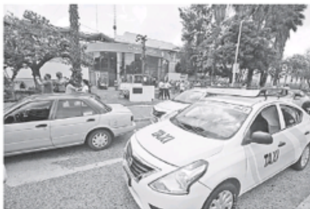
Presencia de choferes en las instalaciones de la Secretaría de Transporte. FRANCISCO RODRÍGUEZ.

Pero el único detalle que tienen es que la careta que les piden utilizar de forma obligatoria desde el martes de esta semana