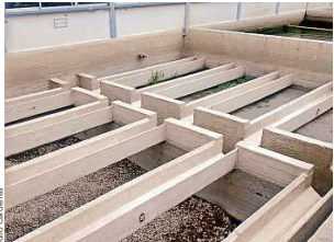
La planta 1, ubicada en Miravalle, potabiliza unos 5.3 metros cúbicos por segundo de agua, el 62 por ciento del líquido tratado para la ZMG.