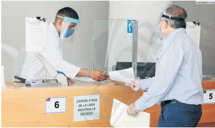
SALDO. Desde 1993 se han sancionado a 340 jueces. La mayoría consiste en extrañamientos, amonestaciones y suspensiones temporales (en la foto, Ciudad Judicial).

"De las anteriores que no fueron resueltas por tu serviduría, sí hemos tenido algunas modificaciones, pero no son tantas. A lo mejor la mitad sí puede ser revocada".