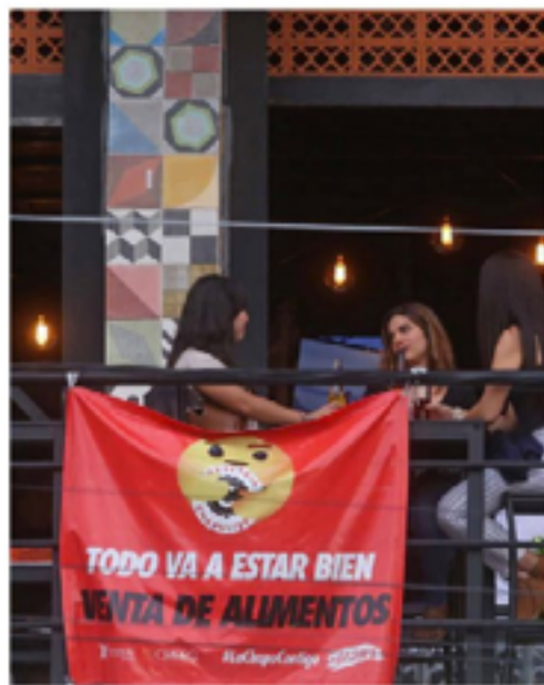
El consumo en bares es insuficiente. F.CARRANZA