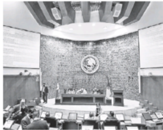
Los interesados entregarán la documentación entre el día primero y tres de septiembre.

Flores Gómez informó que se incluyeron las propuestas enviadas por el Comité