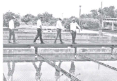
Supervisión de la planta potabilizadora.

El director del organismo, explicó que el agua que se abastece en la zona de cobertura del Siapa es potable y cumple al cien por ciento