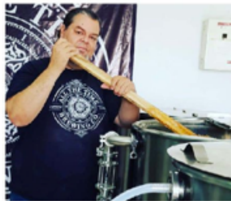
Cervecero en jefe de All The Time Brewing Co.

Los planes a futuro para All The Time Brewing Co. son mejorar los procesos y cuidar la calidad ante todo y en cada una de las fases de producción para ofrecer una gran experiencia al cliente que le gasta el consumo de la cerveza artesanal. ■