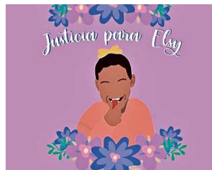
En redes sociales se pidió justicia por la menor de edad.

Los interesados en acudir deberán registrarse en exposaludehigiene.com . También se podrá ingresar presentando el gafete de Internomada, que se celebrará simultáneamente en Expo Guadalajara.