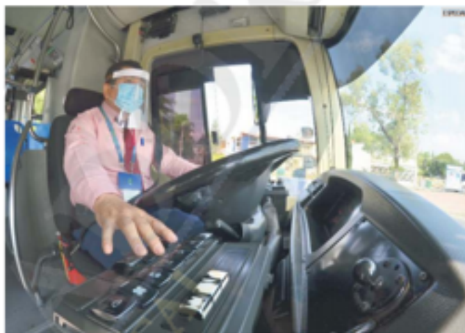
BARRERA. La protección facial con la que deben contar los operadores del transporte público.

Desde el jueves el uso de careta es obligatorio para todos los operadores de transporte público, taxis y plataformas que ofrecen traslados en Jalisco, como medida para mitigar los contagios de coronavirus.