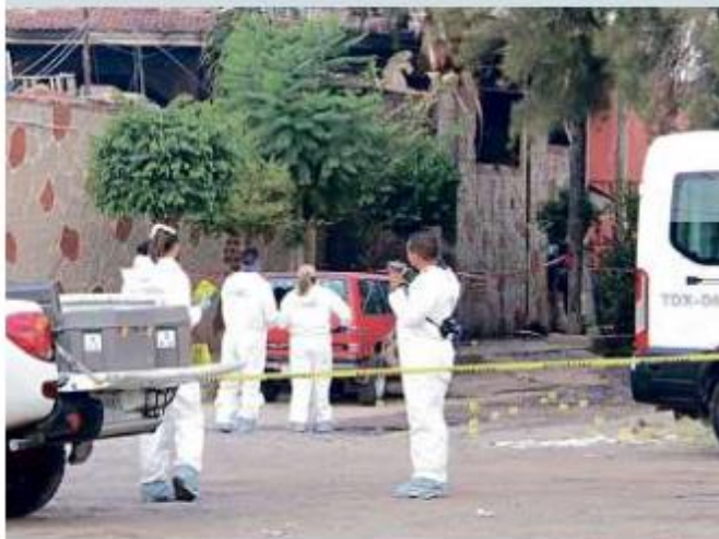
El viernes fueron asesinadas 6 personas en Santa Paula.

El multihomicidio estaría relacionado con el tráfico de terrenos ejidales, informó de manera preliminar el Fiscal del Estado, Gerardo Octavio Solís.