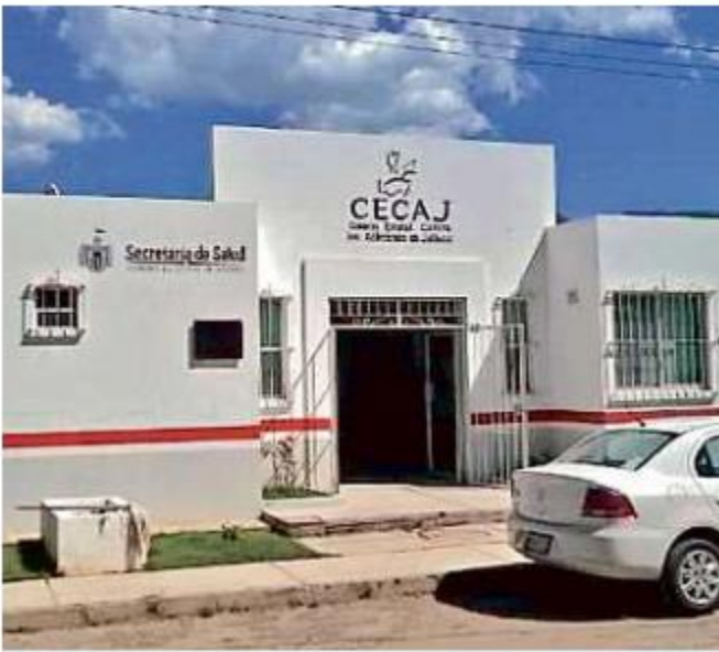
El Cecaj brinda apoyo de rehabilitación.