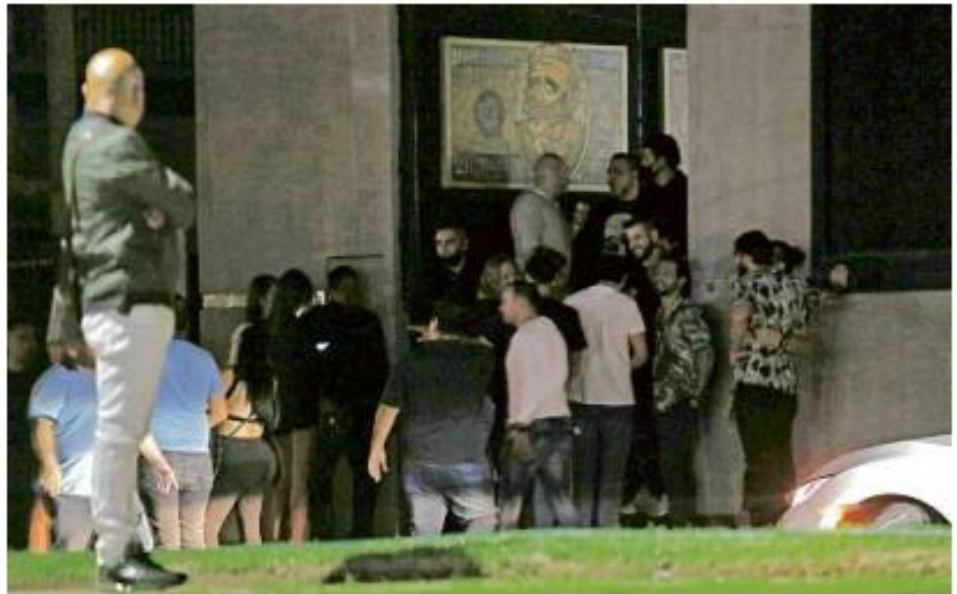
Personas esperan su ingreso al Bar K, que opera después de la medianoche en Providencia.

La música no paraba tampoco a la 1:23 horas en Condesa Cantina, ubicada en Rubén Darío 1045-A, de