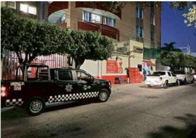
Elementos de la Guardia Nacional y la Policía de Guadalajara tomaron las instalaciones de la lechera.