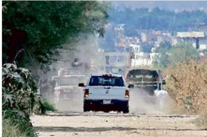
■ En Santa Cruz del Valle fueron localizados dos cadáveres.

Antes, a las 9:00 horas, los trabajadores de un regulador de agua en Santa Cruz