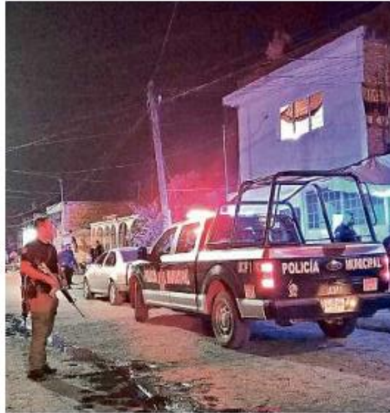
La atención de un homicidio representa papeleo y varias horas de espera para los uniformados.

Por su parte, la Comisaría de Tlaquepaque justificó que existe una vigilancia