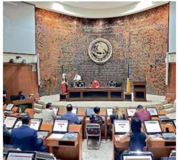
La mayoría de peticiones de enjuiciamiento contra funcionarios terminan siendo de claradas improcedentes.

Mencionó que prevé presentar una iniciativa ante la Asamblea, para impulsar la difusión de las exigencias que tienen los trámites de juicio político.