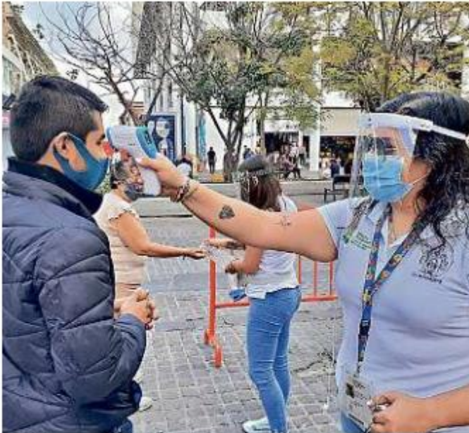
■ Filtro sanitario del Gobierno de Guadalajara instalado en el Centro de la Ciudad.