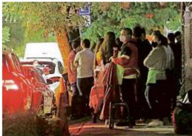
La madrugada de este sábado había fila en el exterior del Luccas para ingresar fuera del horario límite para operar.