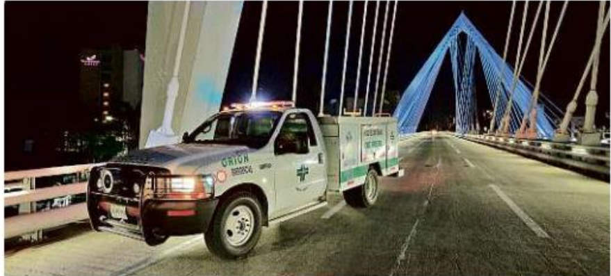
El escuadrón Orión regresó renovado al servicio de los tapatíos.

Para formar parte de Orión, uno de los requisitos fue haberse desempeñado como paramédico por al menos tres años.