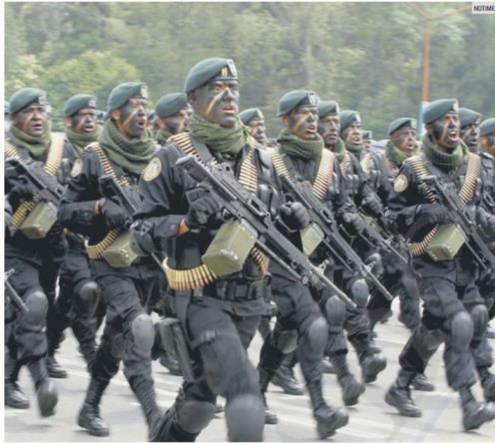
EJÉRCITO MEXICANO. La influencia de las fuerzas armadas es importante en la administración de López Obrador.

“Las fuerzas armadas no anhelamos ningún poder”, dijo Luis Crescencio Sandoval, cabeza de las fuerzas armadas durante los festejos por el 110 aniversario de la Revolución Mexicana. Sin embargo, las palabras del general secretario contrastan con la realidad. El Ejército mexicano lleva al menos 14 años siendo el cimiento de la estrategia de seguridad del país. Y durante la Presidencia de Andrés Manuel López Obrador, los militares se han empoderado como nunca antes. Dinero, impunidad y atribuciones, todo a cambio del sometimiento y apoyo del Ejército a la autollamada Cuarta Transformación.