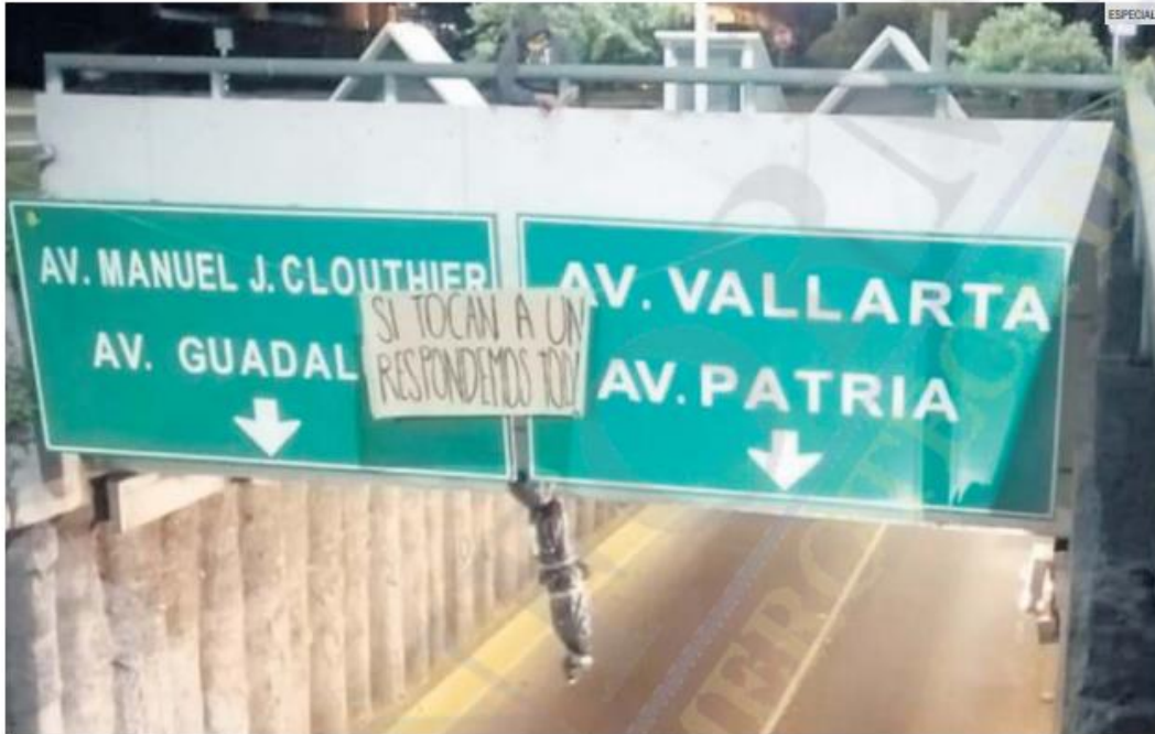
MENSAJE. Uno de los dos bultos colgados en la Zona Metropolitana de Guadalajara durante la madrugada de ayer.

Bultos similares a un cuerpo humano, envueltos en bolsas negras y amarrados con cinta, fueron colocados en dos puntos de la Zona Metropolitana de Guadalajara (ZMG) para protestar contra los feminicidios en Jalisco.