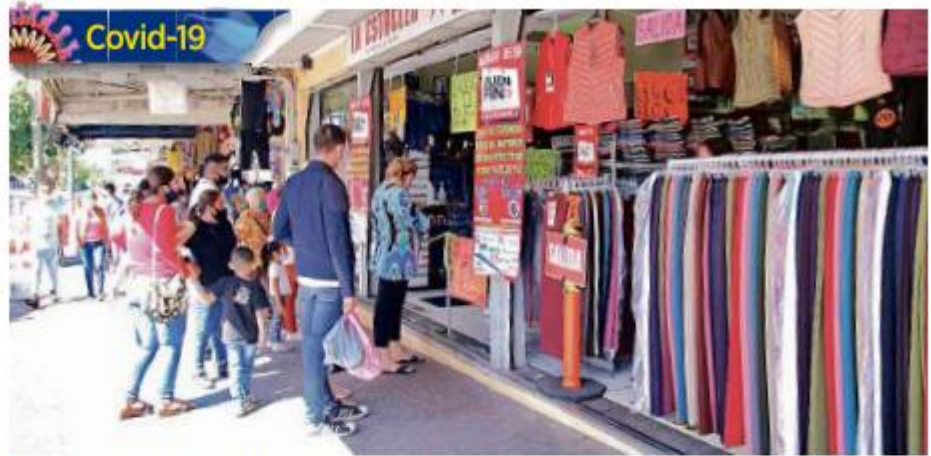
■ En Medrano los comerciantes se organizaron para colocar aparatos de toma de temperatura.

Los corredores comerciales de Javier Mina y Obregón recobran su apogeo al acercarse las fiestas decembrinas: el tráfico y el estacionamiento