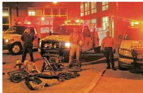
La unidad de rescate se fundó en 1996.

“Necesitamos tener cierta experiencia, primero como paramédicos, para pertenecer al escuadrón Orión”, ex-