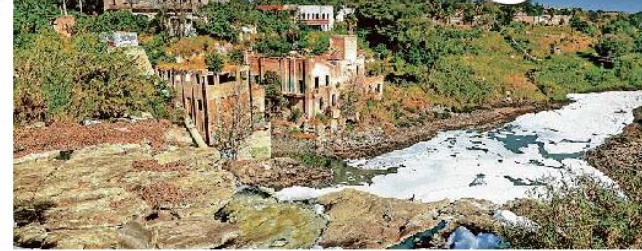
En la cascada entre El Salto y Juanacatlán, la espuma es evidencia de la contaminación que viaja por el río.

Laxa regulación en descargas de tona males renales, gastritis, daño fetal... JULIO CÁRDENAS