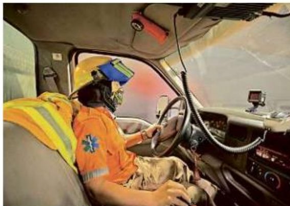
Los integrantes pueden atender emergencias diversas.