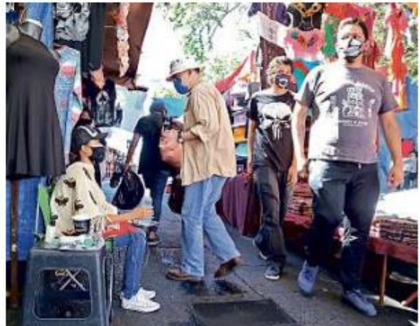
■ En el Tianguis Cultural han mantenido los cuidados sanitarios hasta mantener la sana distancia entre puestos.

En la Zona del Vestir de Medrano los comerciantes se organizaron para colocar aparatos de toma de temperatura en diferentes puntos, así como encargados de revisar que todos usen la mascarilla de protección y se apliquen gel antibacterial.