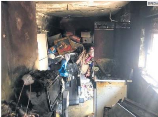
DAÑOS. Recuento de los destrozos que dejó el incendio en el hogar afectado.