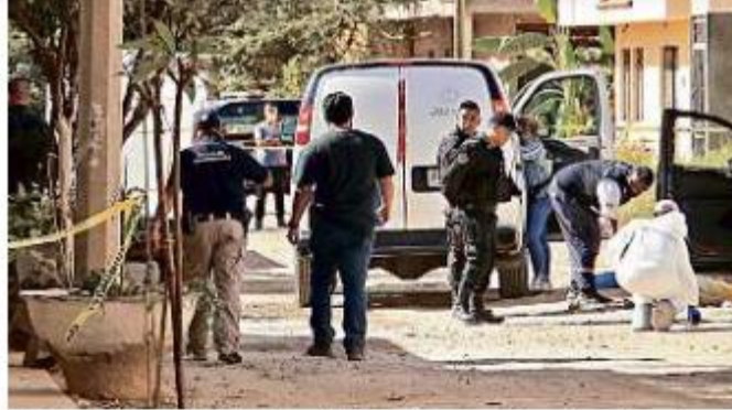
■ En la Colonia Arboledas de Tonalá fue asesinado un hombre.