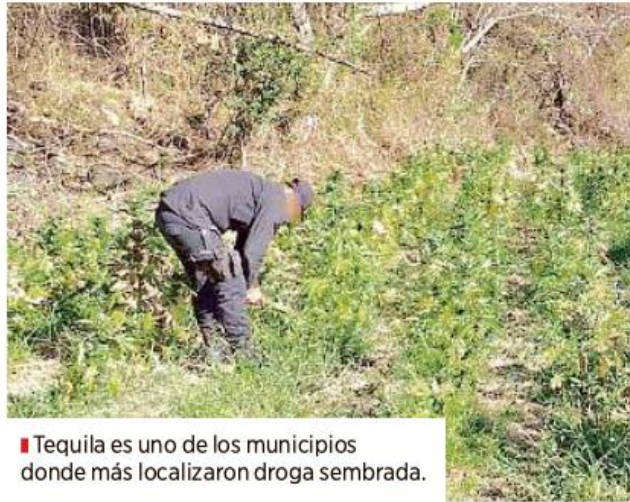
■ Tequila es uno de los municipios donde más localizaron droga sembrada.

Según el testimonio de "Aldo", quien es policía del Estado, la Región Valles tiene