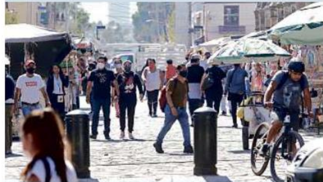
Tras Navidad, volvió la afluencia de visitantes a Plaza de las Américas frente a la Basílica de Zapopan.