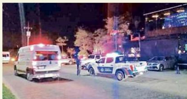
■ Escoltas y sujetos armados se enfrentaron afuera del bar.

Luego de la agresión, los doctores ingresaron al agente a cirugía y tuvieron que extraerle uno de sus riñones, pues resultó severa-