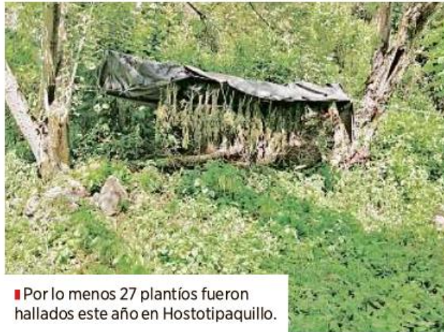
■ Por lo menos 27 plantíos fueron hallados este año en Hostotipaquillo.

áreas de difícil acceso, lo cual hace que el alcance de la autoridad sea limitado.