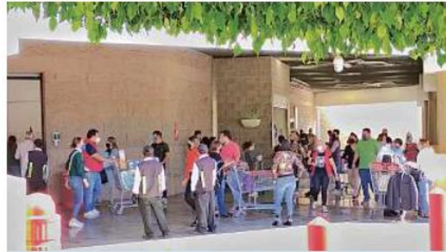
El Club de precios ubicado en el cruce de Avenida Rafael Sanzio y Vallarta en Zapopan, registró filas a su ingreso.

Las medidas de confinamiento parcial, permanecerán hasta el próximo 10 de enero en la Zona Metropolitana de Guadalajara y Puerto Vallarta, aunque a diferencia del pasado periodo de botón, el transporte público y la plataformas de transporte privado operarán con normalidad.