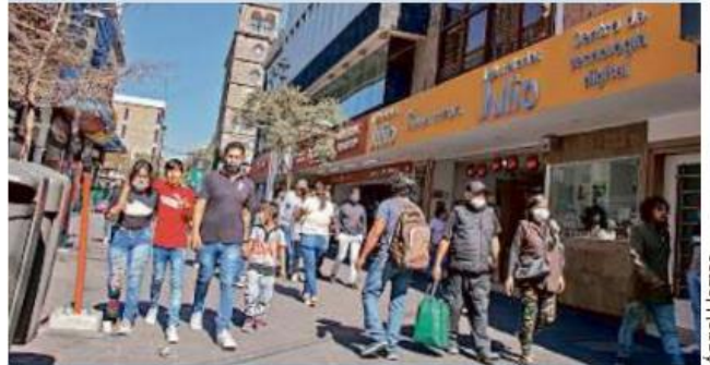
Las compras tras la Navidad no terminan en la Calle Colón, en el Centro de Guadalajara.