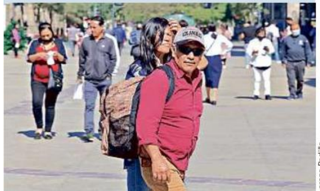
Pese al llamado de las autoridades de Salud, todavía muchos rechazan el uso del cubrebocas.