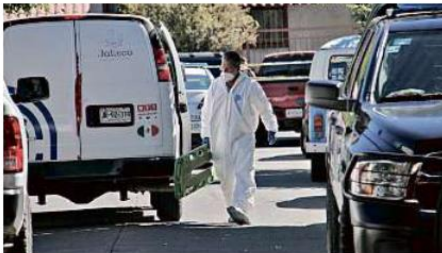
■ En una finca de Jardines de la Cruz fue asesinada una mujer.

En Ocotlán, la Fiscalía registró a las 15:00 horas el deceso de otro sujeto que fue acuchillado.