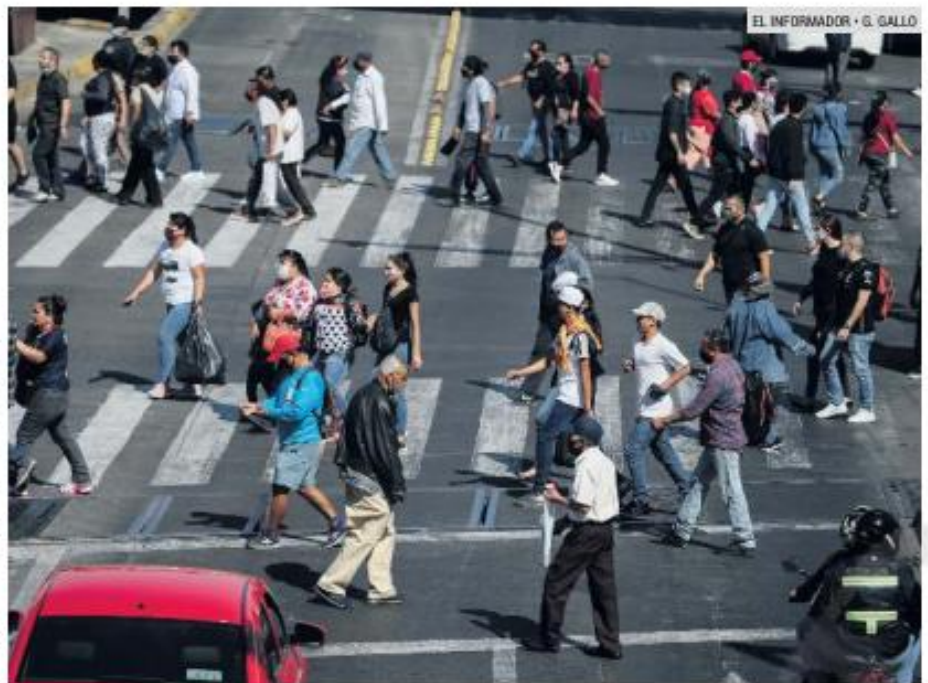
CIERRES. Buscan reducir la afluencia de gente, que ayer llenó el Centro tapatío (en imagen).

“De acuerdo a lo emitido por el Estado, acerca de los nuevos protocolos para evitar la aglomeración de gente los fines de semana, le hemos pedido