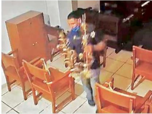
■ El ladrón fue captado cuando tomaba cuatro candelabros de la capilla de la Adoración Perpetua.