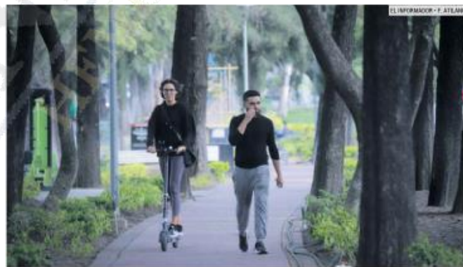
CONSERVADO. El parque lineal de Pablo Neruda recibe mantenimiento por parte de los vecinos de la zona.

Materiales Las principales características de los "parklets" es que son removibles, usan materiales como madera o reciclables, estructuras de metal o contenedores.