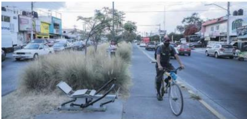
DESCUIDO. Pero la postal en la Colonia López Portillo es completamente opuesta.

La Avenida Colón, en el Sur de la Metrópoli, marca una clara división del parque lineal Patria Sur.