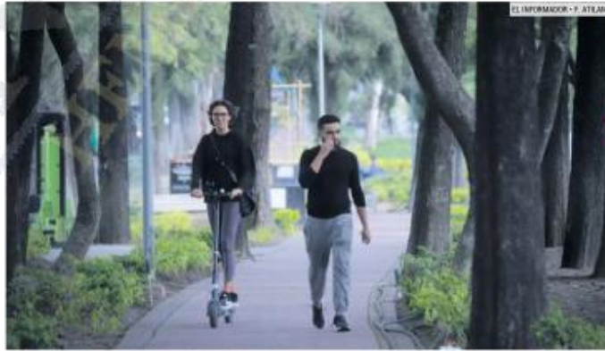
CONSERVADO. El parque lineal de Pablo Neruda recibe mantenimiento por parte de los vecinos de la zona.

Insistió en que se requiere de más espacios como éstos para brindar un respiro a la ciudadanía, sobre todo en la metrópoli donde hay "mucho densidad de construcción".