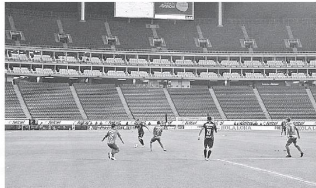
La liga de futbol cerró sus puertas a los aficionados.

tomaban las avenidas de Guadalajara un día histórico, las mujeres vencieron el miedo, rompieron el silencio y salieron a protestar "Unidas, Jamás Seremos vencidas" en el Día Internacional de la Mujer tras el grito "alto a la violencia" y "quiero ser libre no valiente". 9 de marzo se realiza el primer "paro de actividades de Mujeres" en protesta por la violencia de género y los feminicidios que ocurren en todo el país. Ese día, las oficinas de gobierno, de universidades, y de algunos sectores privados laboraron sin la presencia de la fuerza femenina. En salud se abría el telón una crisis permanente: la Contraloría de Jalisco presentaba ante la Fiscalía denuncias por irregularidades en el servicio de salud entre la pasada administración y actual, luego de detectar nueve millones de pesos en faltantes de fármacos, ex trabajadores del Seguro Popular denunciaban despidos y la Covid19 comenzaba a invadir a las y los jaliscienses.