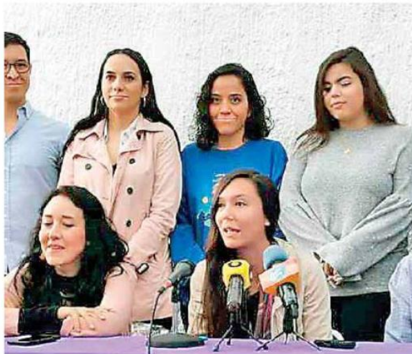
Abrirán espacios. ESPECIAL