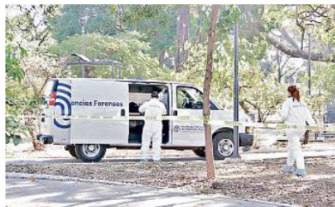
La maleta con el cuerpo fue abandonado en un pequeño parque de Guadalajara, en Colón Industrial.

Hasta el cierre de la edición no se precisó si la víctima en efecto era una mujer, las lesiones que presentaba, las causas de muerte, ni si ya había sido reconocida por algún familiar.