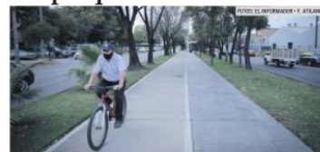
MANTENIMIENTO. En la Colonia El Sauz, el recorrido puede hacerse fácilmente.