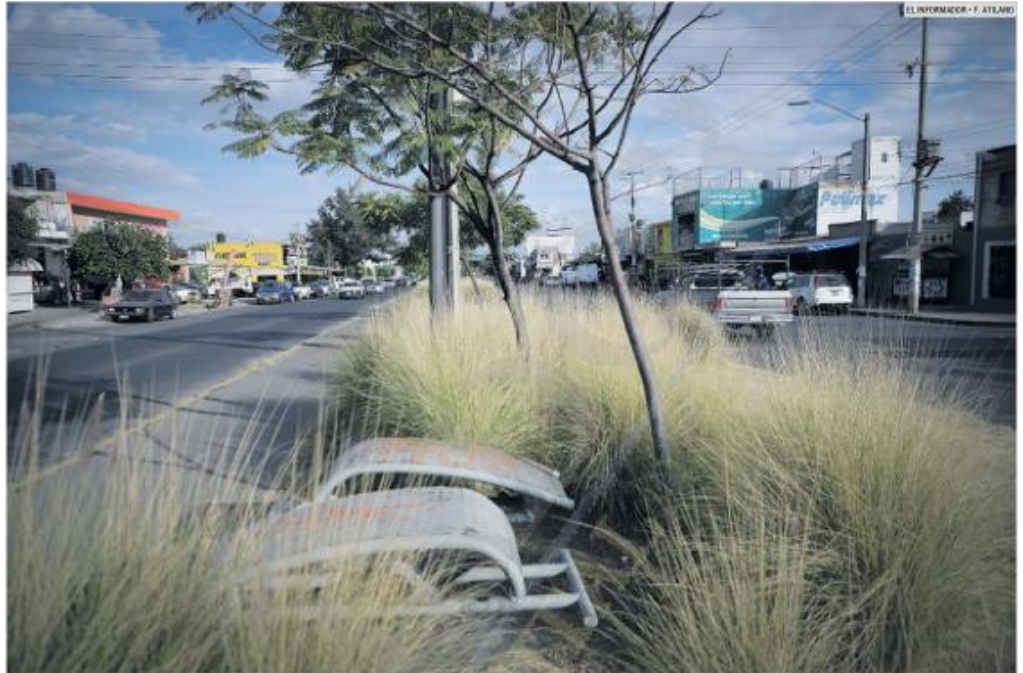
EN EL OLVIDO. El parque lineal Patria Sur luce descuidado en el tramo ubicado entre las avenidas Colón y Jesús Michel González.

A partir de esa experiencia, las autoridades municipales y estatales dieron continuidad a ese tipo de obras para recuperar los espacios públicos de algunos sectores de la Zona Metropolitana de Guadalajara (ZMG).