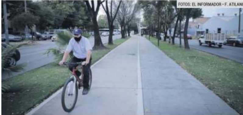
MANTENIMIENTO. En la Colonia El Sauz, el recorrido puede hacerse fácilmente.