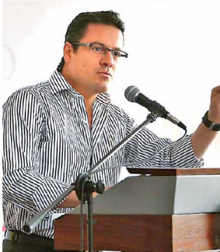
El 18 de diciembre fue ejecutado.