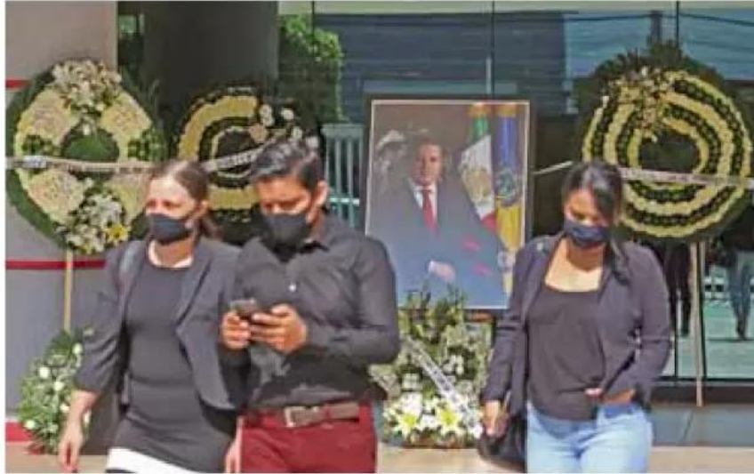
Historial. El inculpado por el ataque al ex gobernador tiene antecedentes.