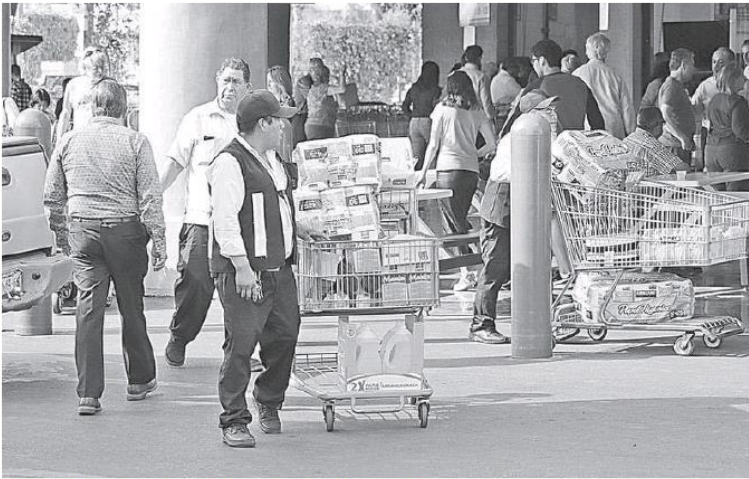
Compras de pánico con el anuncio de confinamiento.