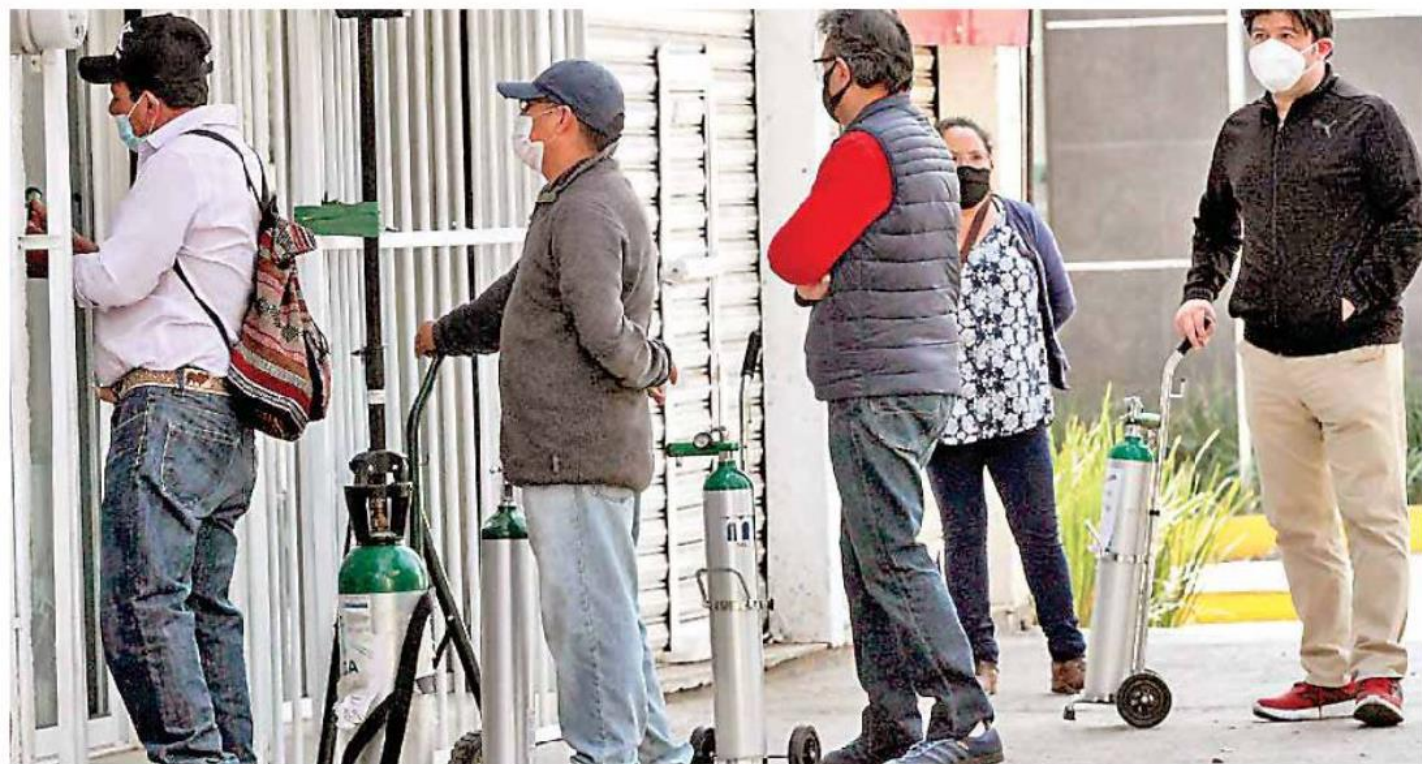
Vendedores aseguran que la disponibilidad es de tres a cuatro piezas en stock.