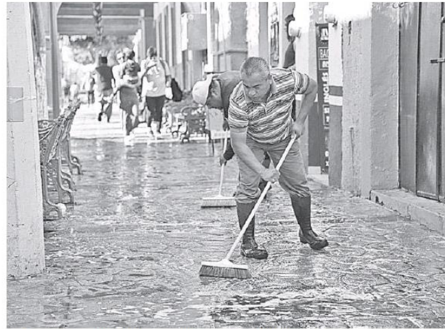
El término de sanitización se empezó a popularizar.