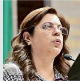
■ Hortensia Noroña es diputada federal del PRI por Jalisco.

Consideró que es un burla lamentable la falta de sensibilidad del Gobierno federal. La iniciativa se turnó a la Comisión de salud de la Comisión Permanente y deberá iniciar su estudio y discusión el próximo 1 de febrero.