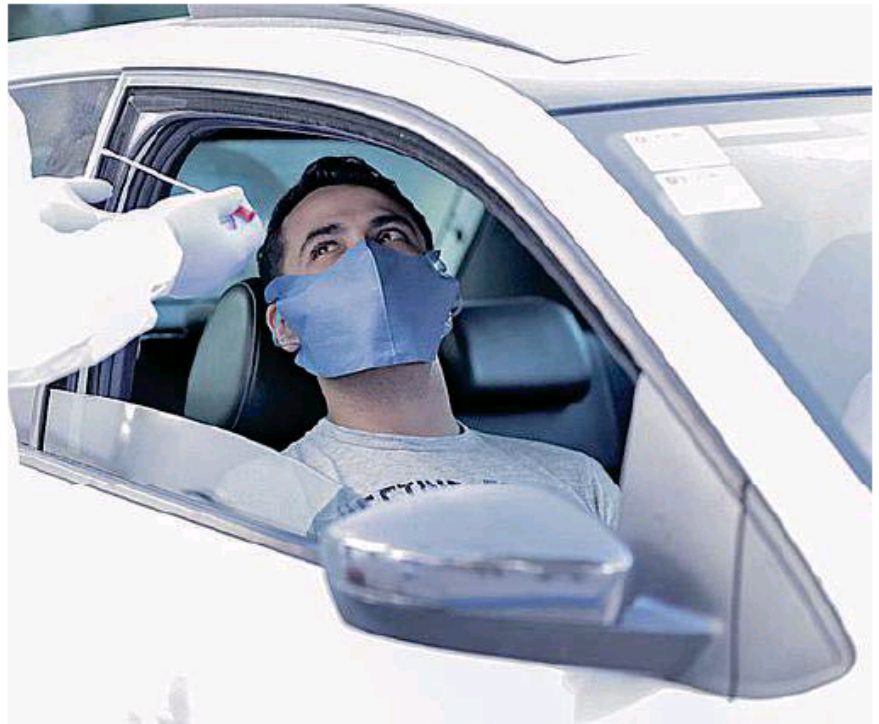
La demanda en Jalisco se disparó en los últimos días.

A través del Sistema Radar Jalisco, indica que se han detectado 90 mil 201 casos confirmados más con relación al Sistema Centinela imple-