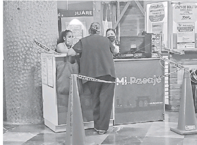
Varias semanas se quedarán sin el apoyo los adultos mayores. AURELIO MAGAÑA

Si bien varios de quienes platicaron para El Occidental refirieron que entendían que la tarjeta tendría vigencia, no creyeron que se quedarían sin el apoyo por varias semanas -ya que una nueva convocatoria saldrá hasta finales enero-, ni que no alcanzarían a gastar los pasajes. "Vine al módulo para que me la activaran pero ya me explicaron cómo está la situación, que necesito recargarla y con dine-