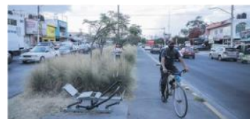
DESCUIDO. Pero la postal en la Colonia López Portillo es completamente opuesta.

La Avenida Colón, en el Sur de la Metrópoli, marca una clara división del parque lineal Patria Sur.