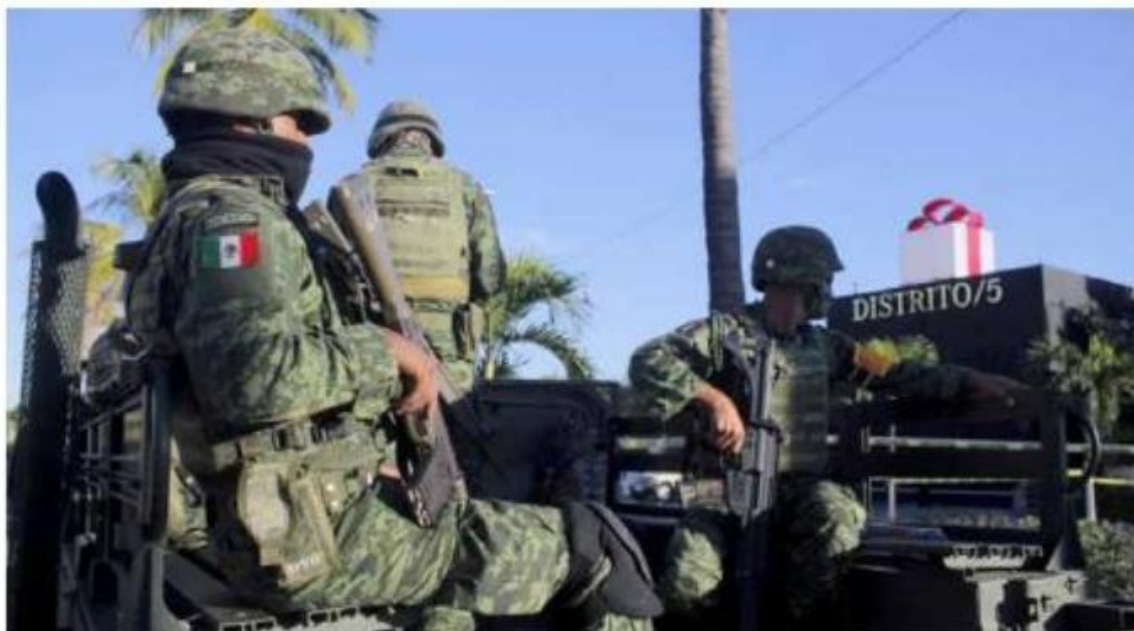
JORGE ALBERTO MENDOZA

El gobernador fue asesinado el viernes 18 de diciembre en el restaurante Distrito 5.