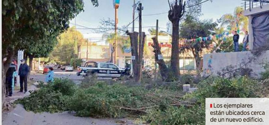
■ Los ejemplares están ubicados cerca de un nuevo edificio.

Habitantes de la zona, quienes pidieron anonimato, denunciaron que en días pasados, pese a la pandemia, hubo un “open house” para mostrar los departamentos.