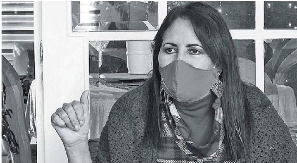
Ramos aseguró que quienes cometen estos crímenes saben que no les pasará nada. EMG