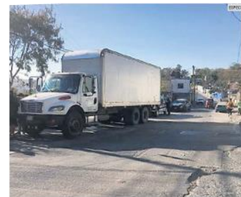
DELITO. Dependiendo de la zona, el robo de vehículos de carga pesada puede denunciarse ante las autoridades federales o estatales.

“Si la unidad es robada de una pensión, del patio o si ya está estacionada afuera de donde va a descargar, pero dentro de la ciudad, ese robo es del fuero común”