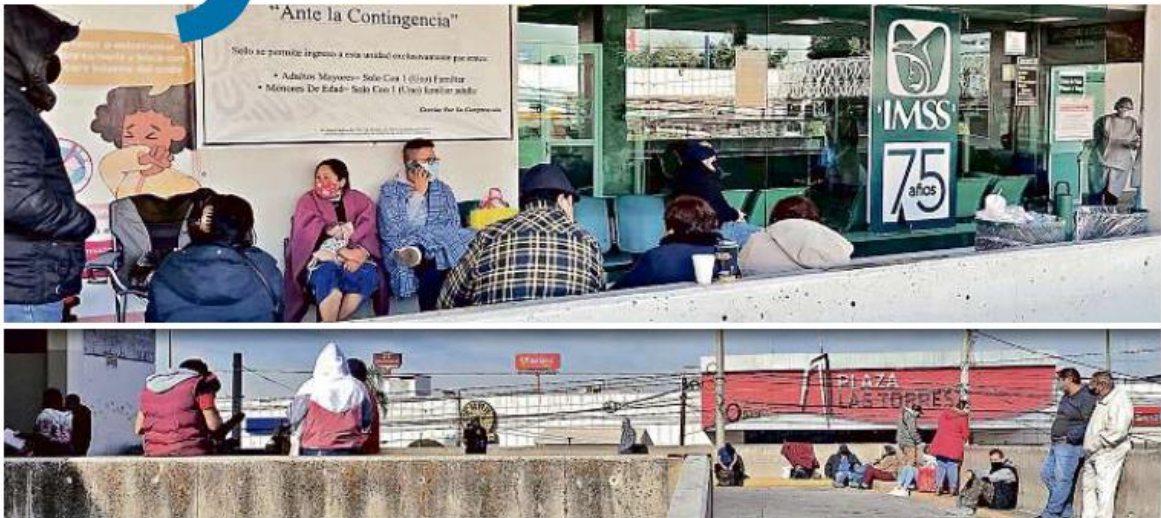
■ Varias personas aguardaban ayer noticias de familiares y conocidos del área Covid, a las afueras del Hospital General Regional 46 del IMSS, en Guadalajara. El instituto tenía al cierre del jueves 723 hospitalizados por coronavirus en Jalisco, nivel récord.