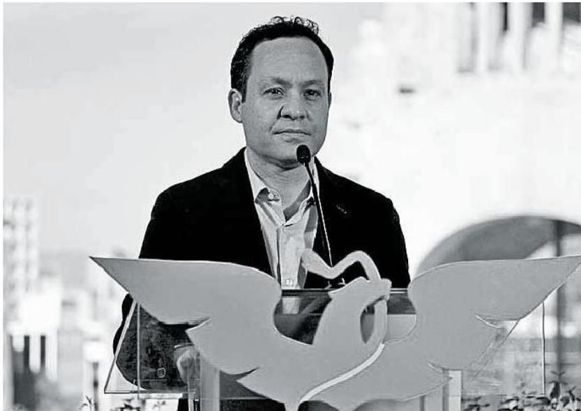
Clemente Castañeda, dirigente nacional de Movimiento Ciudadano.

puede leer que el partido defiende la postura que ha tenido la entidad ante el actual Gobierno Federal como la forma de construir el futuro buscando eliminar las políticas centralistas.