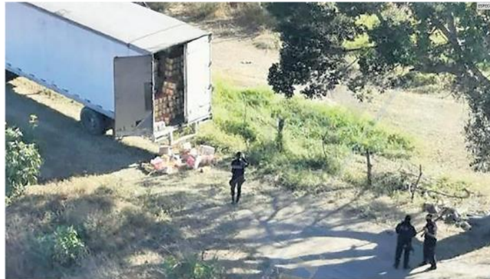
RECUPERACIÓN. Tlaquepaque es también el municipio de la ZMG con más recuperación de transporte de carga robado; en éste se aseguran seis de cada 10 unidades.