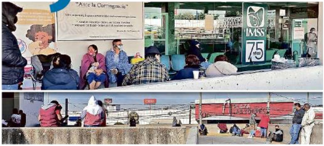
Varias personas aguardaban ayer noticias de familiares y conocidos del área Covid, a las afueras del Hospital General Regional 46 del IMSS, en Guadalajara. El instituto tenía al cierre del jueves 723 hospitalizados por coronavirus en Jalisco, nivel récord.