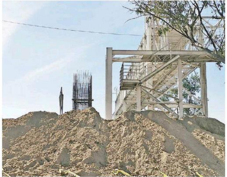
Este año no es del todo alentador en tema de construcción. ISAURA LÓPEZ

MILLONES DE pesos será el presupuesto de infraestructura para este 2021.