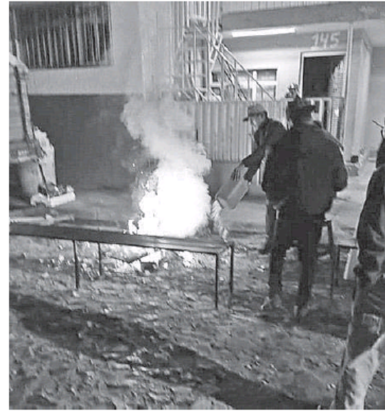
Asadores y fogatas, son la causa de la contaminación del aire.

Pintas y Santa Fe tenían un registro de B5 y B6 puntos en el Índice Metropolitano de la Calidad del Aire (IMECA). Según las recomendaciones que se dan en la misma página se piden a los grupos sensibles no realizar actividades al aire libre. Acudir al médico si se presentan síntomas respiratorios o cardíacos. En el caso de toda la población de cualquier edad se solicita evitar realizar actividades físicas modera-