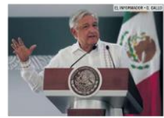
TEQUILA. El Presidente asistió a ese municipio a inaugurar una base de la Guardia Nacional.

La metrópoli ha enfrentado problemas en la distribución de agua y decenas de colonias se han quedado sin el servicio, lo que ha desencadenado abusos en el costo de pipas y manifestaciones.