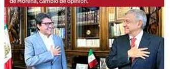
8 DE MARZO 2019