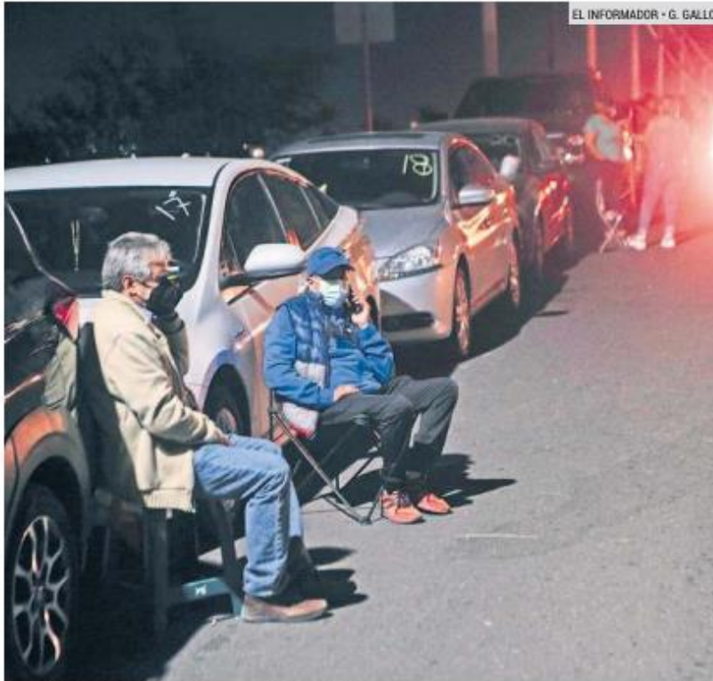
CENTRO UNIVERSITARIO DE TONALÁ. Las personas comenzaron a formarse desde ayer por la tarde en las instalaciones ubicadas en Avenida Nuevo Periférico 555.