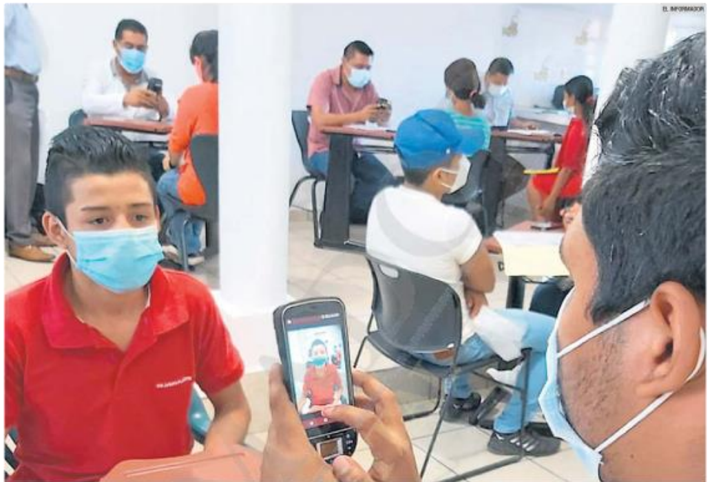
APOYOS. Las becas educativas federales benefician a 364 mil alumnos de todos los niveles en Jalisco.

Por ejemplo, en un grupo de Facebook creado para compartir experiencias entre los beneficiarios, una joven expuso: "Yo sé que todos estamos bien emocionados porque nos adelantaron la beca (ante el periodo electoral) y estamos pensando en cómo gastar ese dinero. Pero hay que tomar buenas decisiones que nos beneficien a largo plazo, ya que ese dinero no durará mucho. Hay que poner un negocio".