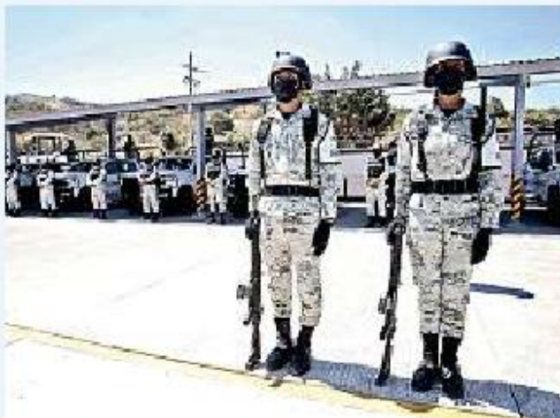
En Jalisco, la Guardia Nacional prevé contar con 30 bases.

“No van a faltar las vacunas Gobernador. Me da mucho gusto porque no fue fácil que se consiguieran las vacunas que se necesitan, pero ya tenemos contratos para garantizar que todos los mexicanos, todos los adultos mayores de Jalisco van a quedar vacunados a más tardar a finales del mes de abril, cuando menos con una dosis”, prometió.