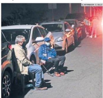
CENTRO UNIVERSITARIO DE TONALÁ. Las personas comenzaron a formarse desde ayer por la tarde en las instalaciones ubicadas en Avenida Nuevo Periférico 555.