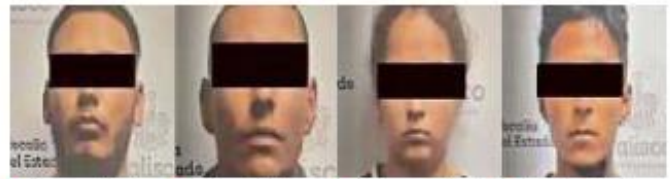
■ Brayan "N" ■ César "N" ■ Yarency "N" ■ Martín "N"

mara Guadalupe "N", se le dictaron medidas diversas a la prisión.