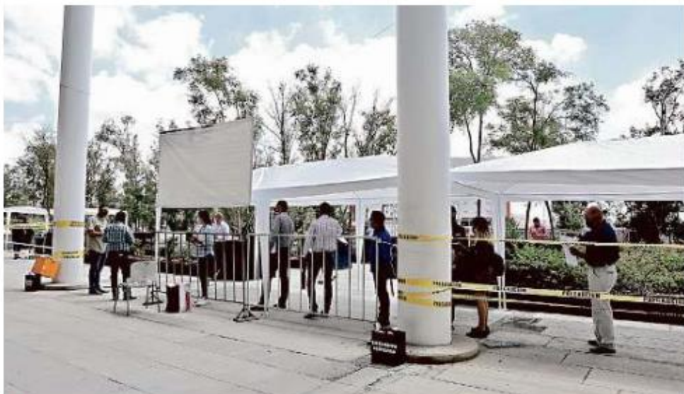
■ Pese a la apertura parcial, abogados reportan problemas para acceder a expedientes.

“Eso implica que sólo se puede acceder al expediente con cita, y hay veces que el día de la cita no se puede ver el expediente porque es-