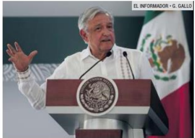
TEQUILA. El Presidente asistió a ese municipio a inaugurar una base de la Guardia Nacional.

La metrópoli ha enfrentado problemas en la distribución de agua y decenas de colonias se han quedado sin el servicio, lo que ha desencadenado abusos en el costo de pipas y manifestaciones.