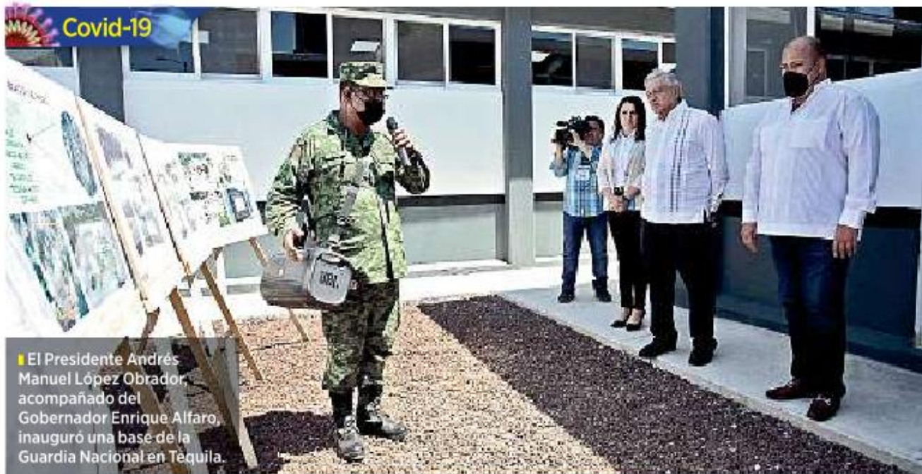
El Presidente Andrés Manuel López Obrador, acompañado del Gobernador Enrique Alfaro, inauguró una base de la Guardia Nacional en Tequila.