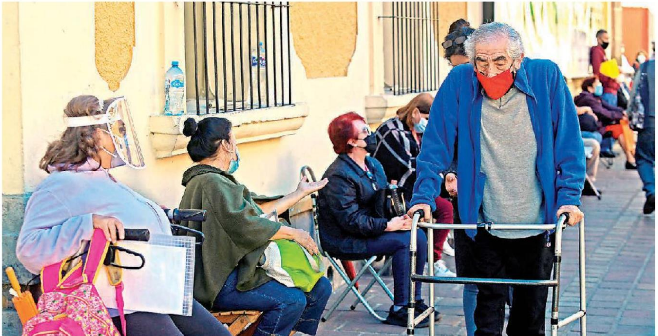
López Obrador espera que para abril se cumpla en Jalisco la primera etapa. FERNANDOCARRANZA