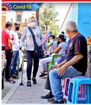
Covid-19 Desde las 9:00 horas de ayer hubo gente que comenzó a hacer filas a las afueras de los módulos.