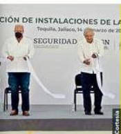
ACCIÓN DE INSTALACIONES DE LA Tercera Instalación de la Acción de la Seguridad