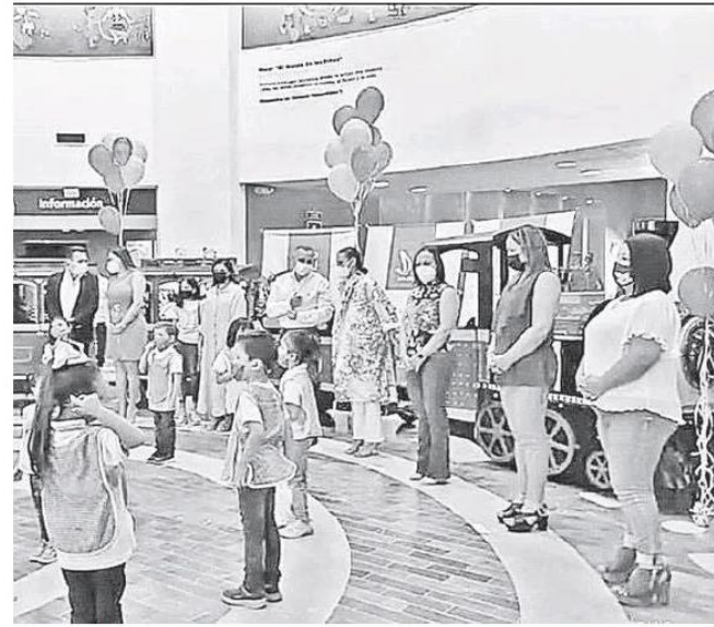
Sus pasillos y salas recibieron este jueves de nuevo a decenas de pequeños

El costo de ingreso al Museo Trompo Mágico es de 40 pesos por persona, pero los jueves será gratuito, con actividades atracti-