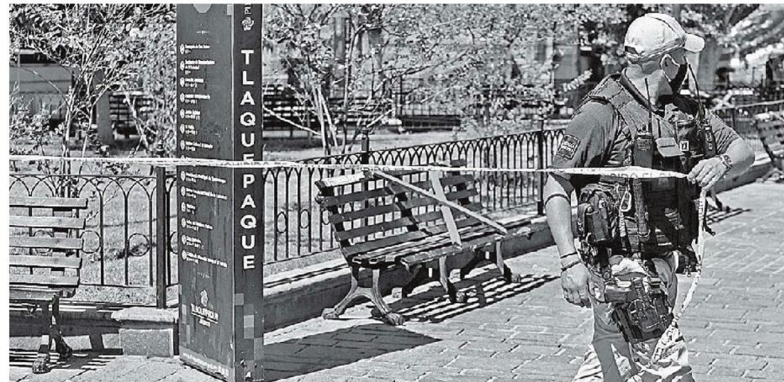
El cuerpo fue dejado en una banca ubicada en el Jardín Hidalgo, en el Centro de San Pedro Tlaquepaque.

Violencia. Sujetos bajaron de una camioneta de carga algunas estructuras de metal y el cuerpo de un hombre; las autoridades investigan si la víctima es El Cholo , quien fuera parte del Cártel Jalisco