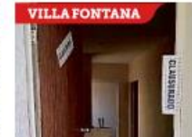
VILLA FONTANA En la narcoguerra, aumentaron las fosas adentro de casas.