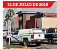
31 DE JULIO DE 2019 El CNP asesinó a uno de los fundadores del CJNG en una plaza.