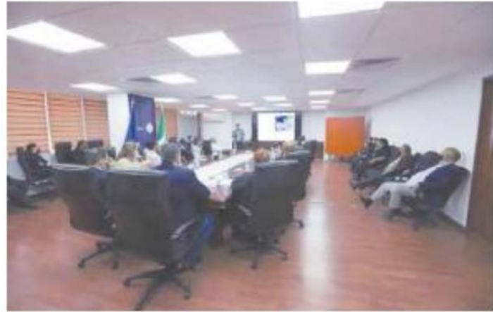
A OTROS. Los agentes capacitados fungirán como replicadores.

“El objetivo fue la coordinación interinstitucional. La eficacia de