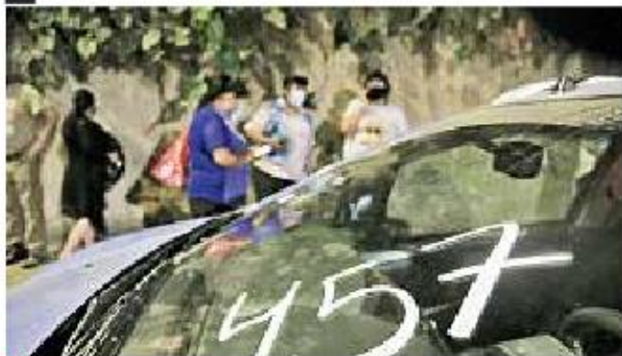
Los vehículos han sido numerados conforme llegaron; hasta las 22:00 horas iban cerca de 500.