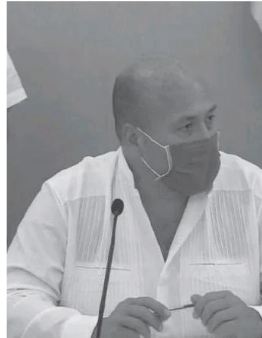
Enrique Alfaro, Gobernador.

saneamiento del Río Santiago “la verdad es que creemos que todavía la autoridad federal tiene mucho por hacer, se requiere de una inversión mucho mayor, de un esfuerzo sostenido en el tiempo y que evidentemente un gobierno subnacional no puede solo con un reto de esta dimensión”. Es así que Durante la firma del convenio en materia de conservación ambiental.