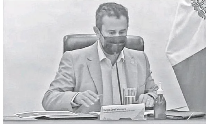
Sergio Graf Montero, secretario de Medio Ambiente.

En el primer eje denominado generación y aplicación del conocimiento aborda el líneas de acción con el objetivo de generar una base de conocimiento de la biodiversidad de la entidad pero también definir áreas prioritarias de acción a través del monitoreo y las prácticas regionales.