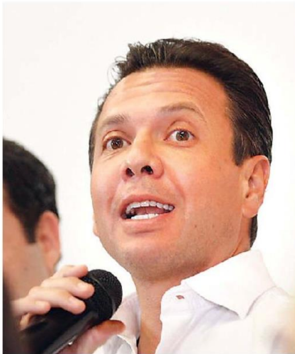
Aseguró que ganará la elección.