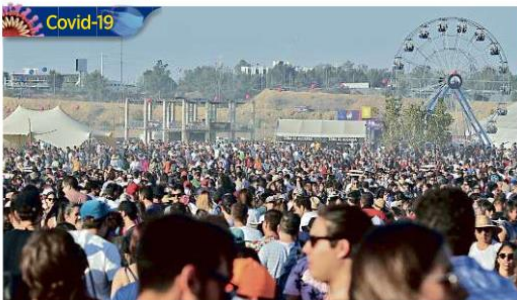
En la última edición del Corona Capital Guadalajara, en 2019, así lucía la explanada del Akron.

"El riesgo de contagio disminuye al aire libre, pero no desaparece, la gente no va a ir a estar parada callada sin