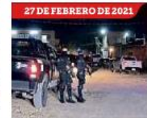
27 DE FEBRERO DE 2021 "El Cholo" se adjudicó la matanza de 11 personas en La Jauja.