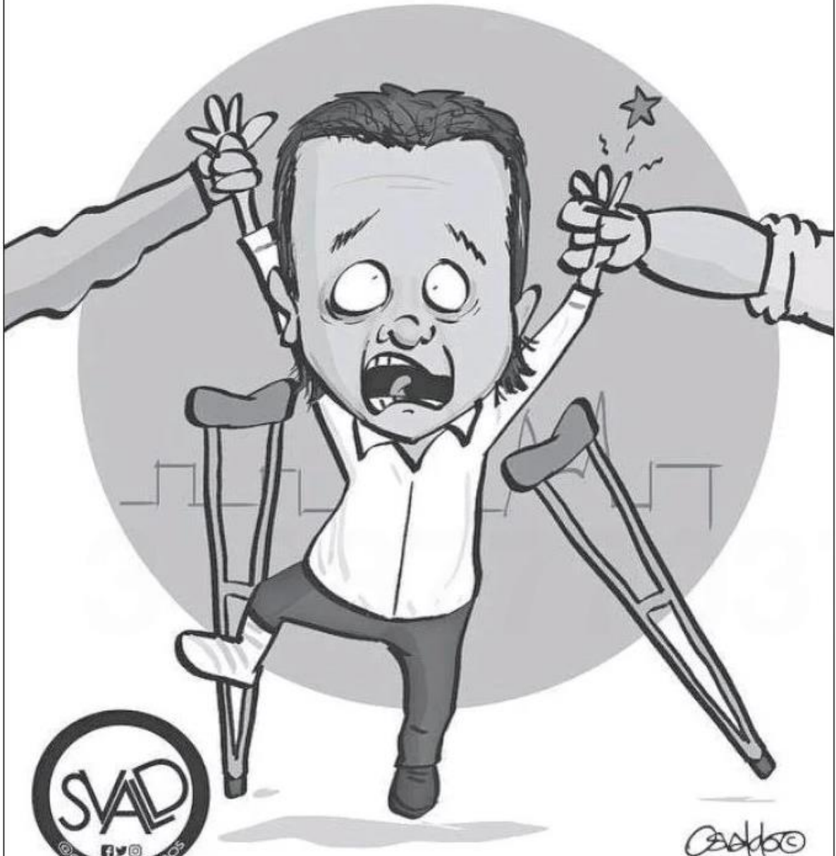
Título: Pablo El Ungido