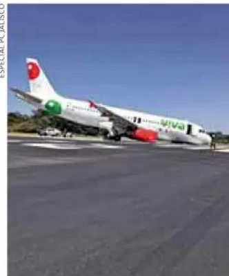
ESPECIAL PC JALISCO

La aeronave que partiría a Monterrey tuvo fallas en el tren de aterrizaje de la nariz; los pasajeros están bien. Pág. 02