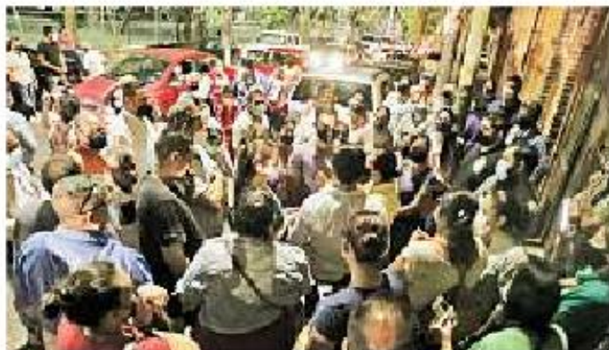
Ante la falta de información oficial, las personas se han organizado afuera del centro universitario.