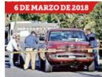
6 DE MARZO DE 2018 Hallaron 8 cuerpos en una camioneta en la Colonia Morelos. Se hacía referencia a "El Cholo".