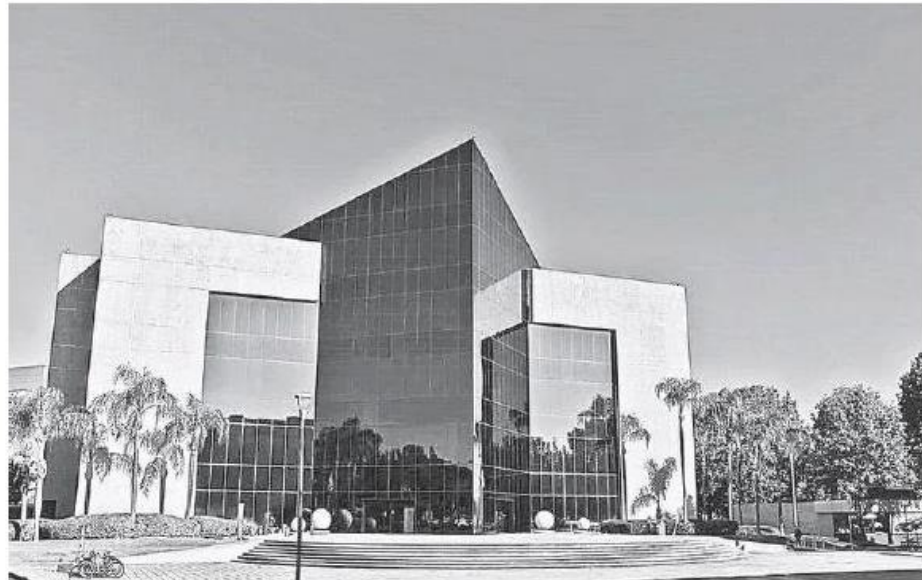
El Gobierno de Jalisco es el beneficiario de esta iniciativa.

Lo que se busca es transformar la sociedad, al resolver desafíos de Jalisco a través del uso de Inteligencia Artificial.