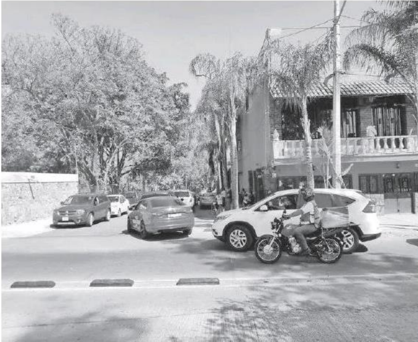
Es mucho el ímpetu por ser los primeros en ser vacunados.