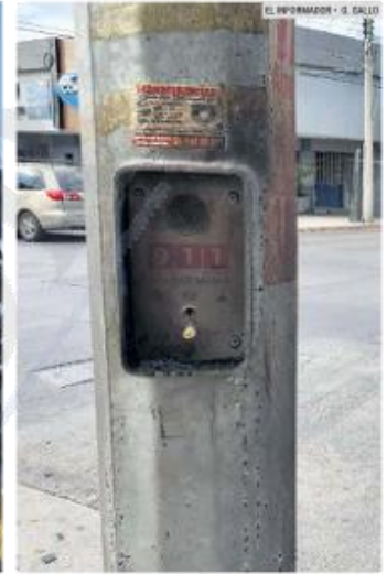
AFECTACIONES. En los últimos meses, los ataques contra la infraestructura del C5 suman 180 puntos dañados. En la foto, poste afectado recientemente entre las calles Guadalajara y Juan Manuel Rivalcaba en la Colonia Auditorio (Zapopan).