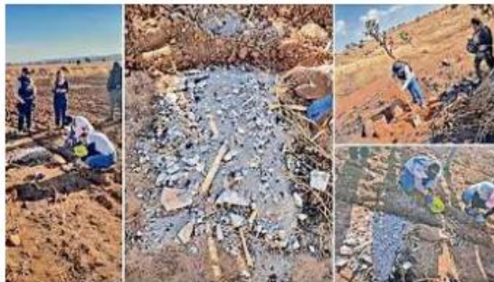
En el trabajo de localización participan la Fiscalía, Policía estatal, así como la Comisión de Búsqueda.

Fue entonces cuando les avisaron que en La Barca, a unos 100 kilómetros de distancia, se había hallado a una