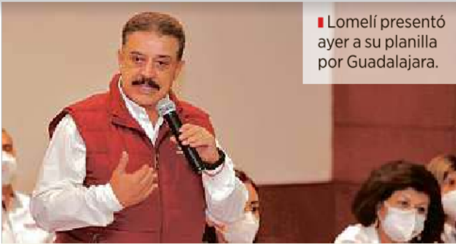
■ Lomelí presentó ayer a su planilla por Guadalajara.