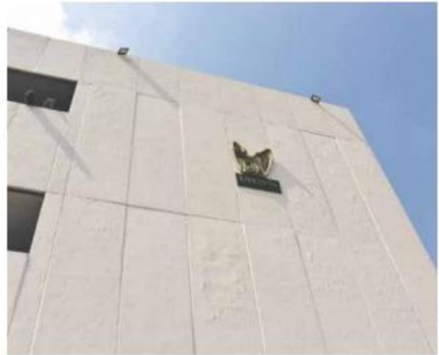
FORMALES. En la estrategia estatal sólo podrán participar micro y pequeñas empresas con trabajadores registrados ante el IMSS.

El experto recalzó que los programas deben continuar paralelos a las campañas electorales, pero sin difu-