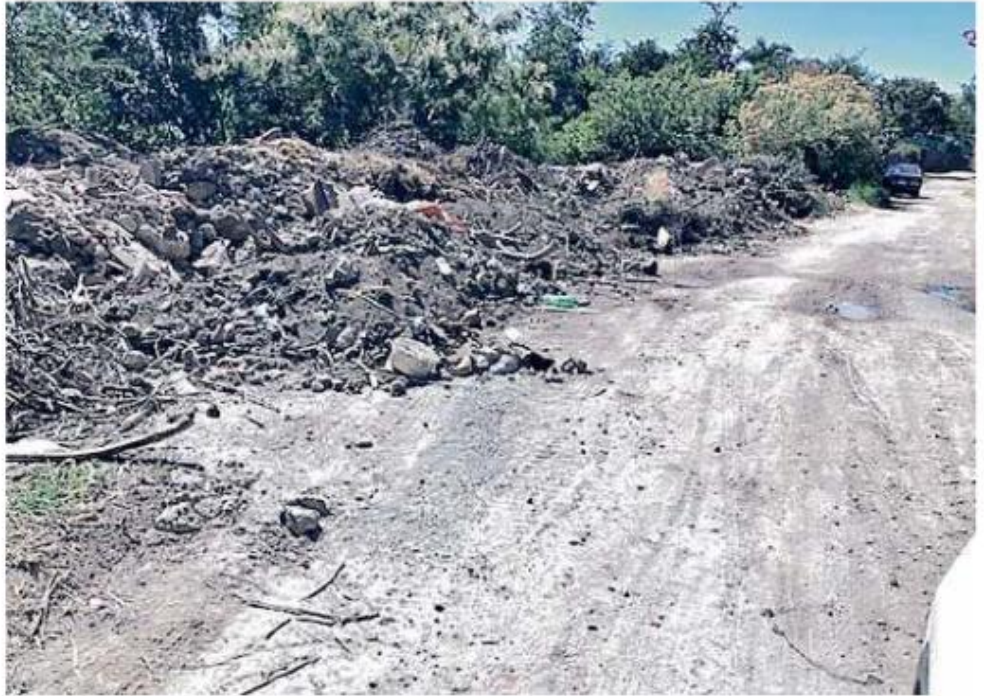
■ Vecinos denunciaron que este escombros fue tirado por la Calle Morelos.

“En algunos casos se ven las copas de los árboles, prácticamente en el relleno, es de