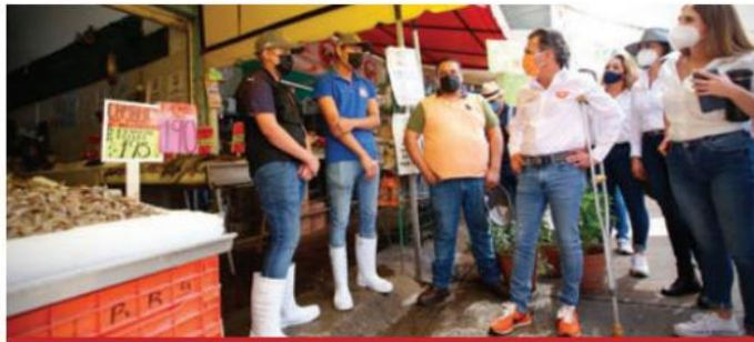
Locatarios y del mercado Del Mar le expusieron sus carencias.

Ante locatarios del Mercado del Mar "Higuerillas", el candidato de Movimiento Ciudadano a la alcaldía de Guadalajara, Pablo Lemus Navarro, se comprometió a que, de ganar la elección de junio próximo, no cobrarán los impuestos municipales en su primer año de gobierno a locatarios de mercados, tianguis y giros A.