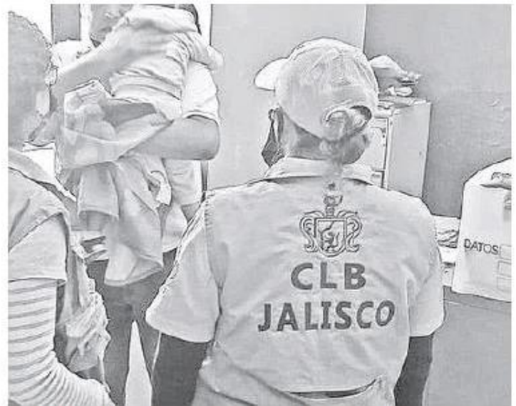
La infante fue encontrada en la Barca, Jalisco.

Los cinco se desplazaban en una camioneta Mazda 2019, color blanco, con placas JPK2293, misma en la que fueron interceptados presuntamente por policías del municipio de Acatic. Cabe recordar que por la desaparición de la familia hay siete policías municipales detenidos..