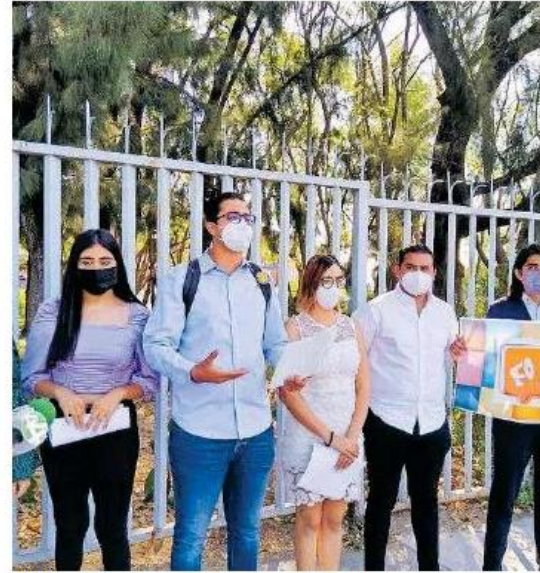
Líderes estudiantiles presentan el programa.

Tras leer el manifiesto con el que comenzarán estas actividades, el líder estudiantil explicó que los foros contarán con la participación de académicos y demás expertos. En tanto los debates, al menos se realizarán dos, con miras a hacer más, con todos los que buscan un cargo de representación en el Área Metropolitana de Guadalajara, con actividades que empe-