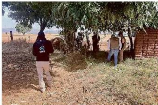
El operativo para encontrar al resto de la familia desaparecida continúa en Acatic.