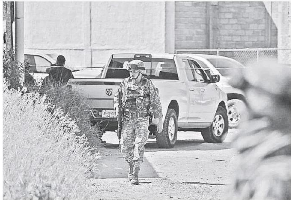
Hay 12 mil 105 personas que encontrar, desde el 2018 a la fecha.

Reconoció Alejandro Encinas que esto es consecuencia de actos principalmente