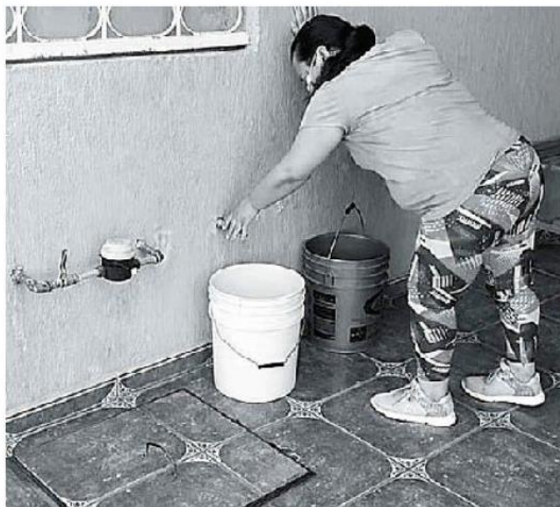
Vecinos piden garantizar el servicio.