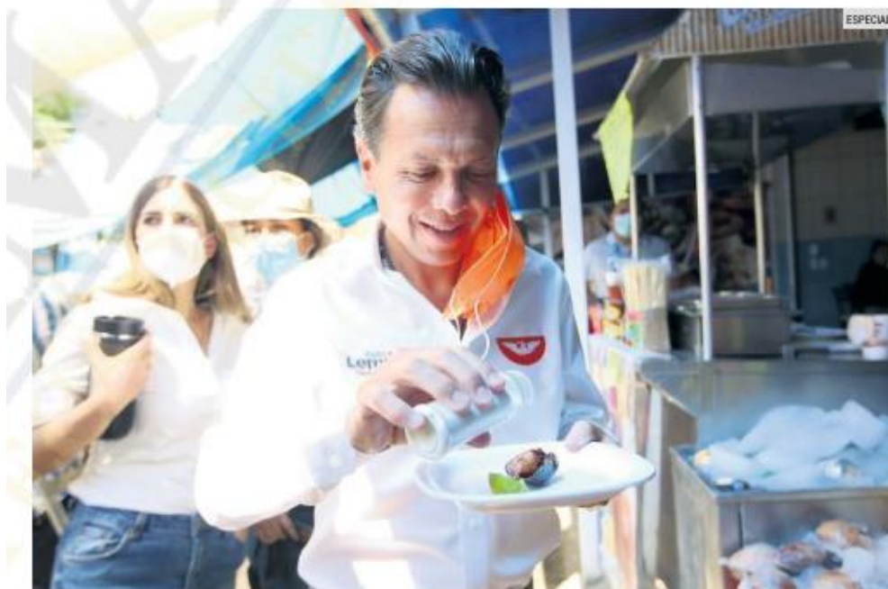
APOYO. Lemus aseguró que su trayectoria empresarial le permite entender las necesidades de los comerciantes.

Los ciudadanos de esa zona del municipio le pidieron que dé continuidad a las obras que ya hicieron sus predecesores de MC. Entre éstas destacaron dos: el embellecimiento de las torres de departamentos y la dotación de servicios públicos.