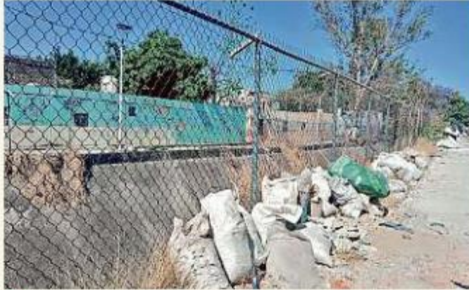
■ En el lugar las personas dejan sus desechos.

De acuerdo con la legisladora, son los vecinos de las Colonias Patria Nueva, López Portillo, Francisco Villa, Miravalle y 5 de Mayo quienes padecen la contaminación del canal; por esa razón, presentó an-