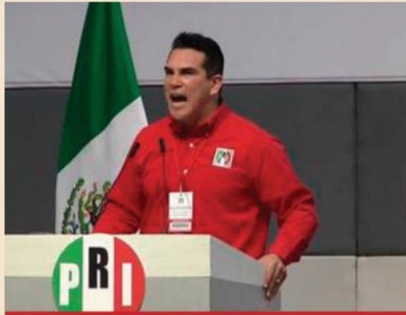
Buscan que se valore el aporte de las mujeres en la construcción.

Añadió que va por México se construyó por una causa: quitarle el poder a Morena, por lo que acusó el partido Movimiento Ciudadano de ser un "esquirol" de este al no sumarse a la alianza, pronóstico que perderán el registro a nivel nacional y se quedarán como un partido local de Jalisco.