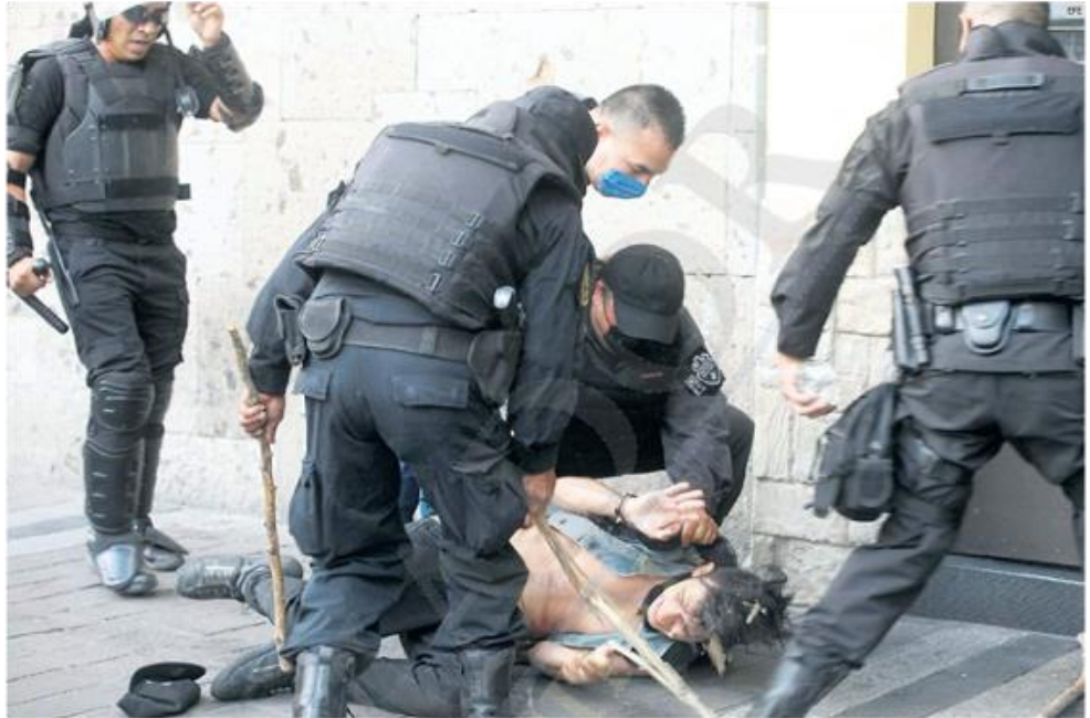
ESTUDIO. Según el Modelo Óptimo de la Función Policial, los cuerpos de seguridad presentan rezago e incumplen con los protocolos de prevención y reacción, violencia de género y uso legítimo de la fuerza.

"En los últimos años ha proliferado una legalidad garantista que se inserta en una cultura política, civil y judicial, que no es respetuosa de los derechos humanos... es una cultura que tolera la violencia y que suspende de facto la posibilidad de aplicar esa misma legalidad garantista. La tortura se ejerce, de este modo, en un contexto estructuralmente contradictorio".