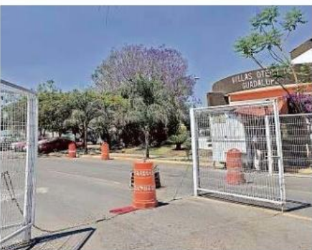
■ Villas Otero es otro de los implicados.