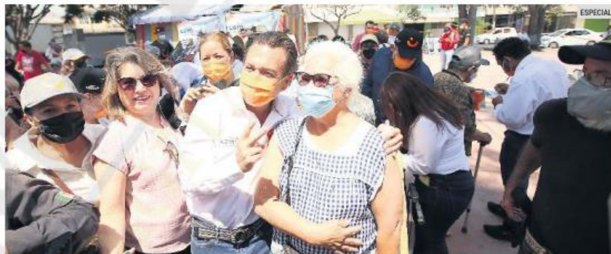
CONVIVENCIA. El candidato de MC estuvo con simpatizantes.

Otra de sus propuestas, agregó, es la creación de un fideicomiso para el impuesto del Incremento al Coeficiente de Utilización del Suelo, donde el 50% se emplee en la zona de influencia y el 50% restante se use en las colonias con mayor vulnerabilidad de Guadalajara. El aspirante afirmó que esto permitirá un incremento en los recursos destinados a la inversión en infraestructura y obra pública en servicio de la gente.