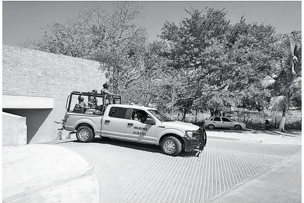
La estrategia llegó a su fin el 13 de abril pasado. MILENIO

Añaden que "también es motivo, de curiosidad, que el fin del convenio de seguridad en los tres niveles, se presenta, justo el mismo día que los policías municipa-