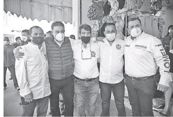
El candidato de Morena junto a líderes comerciantes.