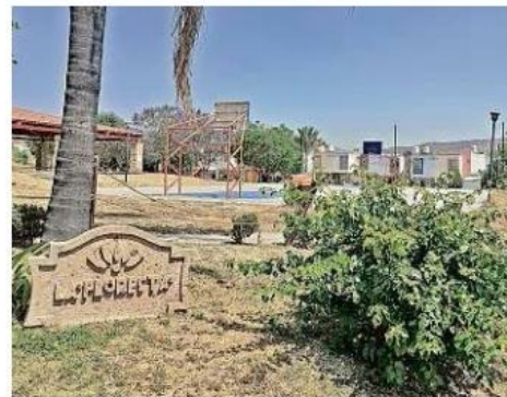
■ La Floresta es uno más de los involucrados.