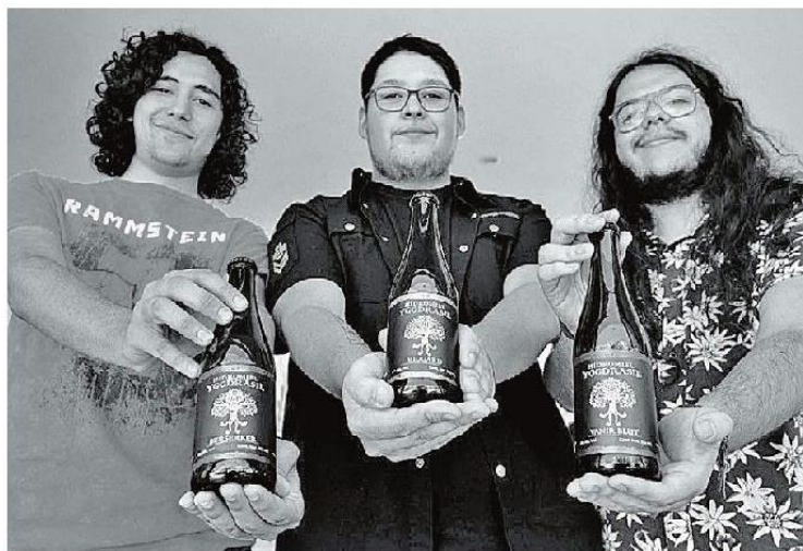
Existen tres estilos de hidromiel. ESPECIAL

"Antes ejercía en Europa y Canadá, pero vino todo lo de la pandemia y muchos restaurantes cerraron, de hecho, el sector restaurantero fue uno de los que les cayó mucho más pesado la pandemia. Yo de un día para otro perdí mi trabajo y me tuve que regresar a mi país, en vez de quedarme con los brazos cruzados volví a mi hobby que siempre ha sido, mi hobby porque en realidad llevo haciendo hidromiel desde ha-