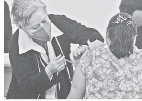
Maestros serán vacunados en los próximos días.

manifestado, porque varios maestros han fallecido, y así expresaron que se necesitaba la vacuna, para poder regresar.