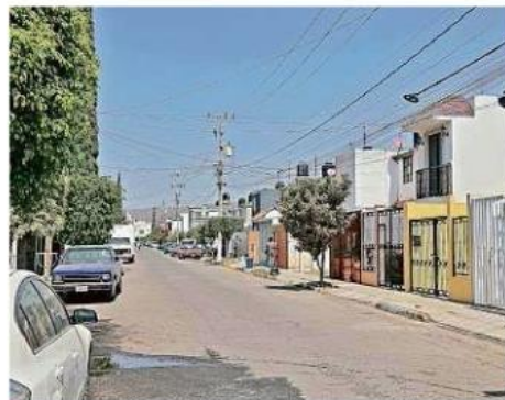
■ Valle de San Nicolás también está en disputa.