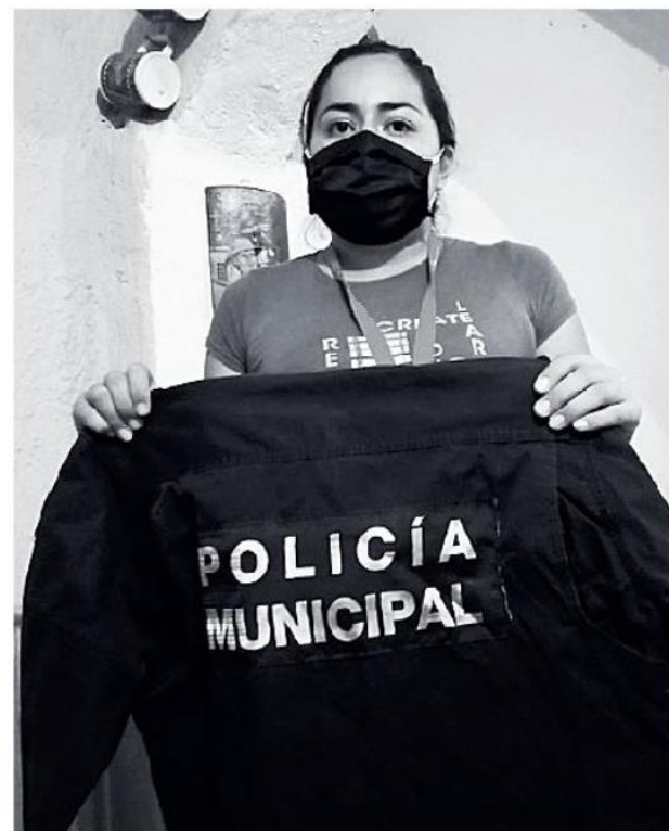
El oficial fue visto por última vez el pasado 9 de abril.