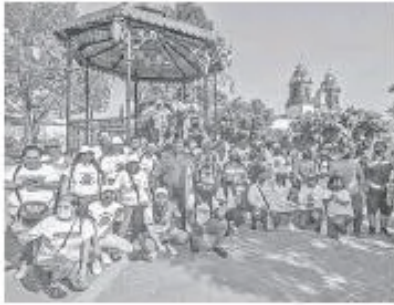
La campaña del morenista.