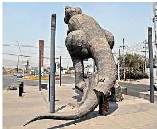
■ El tiranosaurio rex tiene la cola fracturada.