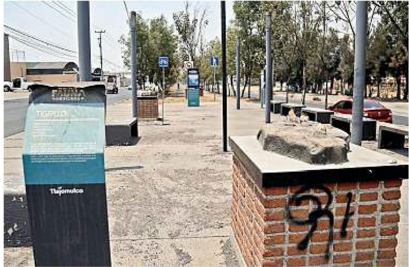
■ En este lugar se encontraba el tigrillo. Sólo quedó la base con graffiti y el tótem informativo.

Al zorro gris le robaron las orejas mientras que a la iguana verde le “fracturaron” las patas traseras y la cola.