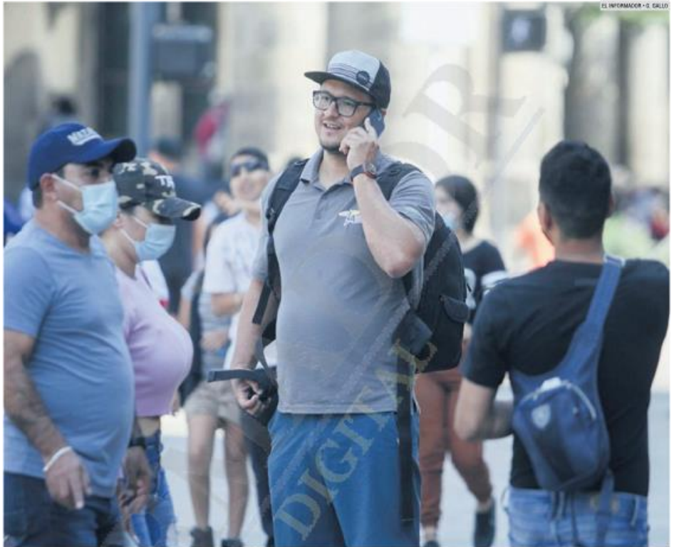
PADRÓN. En México hay 122 millones de líneas del servicio móvil. Las líneas corporativas o de empresas disparan el uso de celulares.

En el documento se precisa que los titulares de seguridad y procuración de justicia designarán a los servidores públicos encargados de gestionar los requerimientos que se realicen a los concesionarios y recibir la información correspondiente, mediante acuerdos publicados en el Diario Oficial de la Federación.