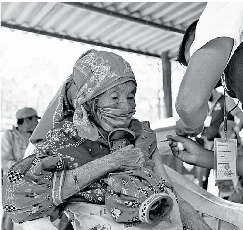
Las brigadas en la sierra continuarán hasta el 30 de abril. ESPECIAL

La Secretaría de Salud Jalisco informó que ayer se confirmaron 421 personas más contagiadas de coronavirus, por lo que suman 240 mil 613 casos acumulados desde el 14 de marzo de 2020, cuando se notificó el primer paciente por el virus. Por complicaciones de la enfermedad, 26 personas perdieron la vida; van 11 mil 574 decesos en la entidad.