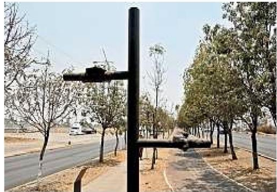
■ Aquí estaban unas aves, pero fueron arrancadas.

En cuanto al alumbrado, personas que viven en la zona aseguraron que es deficiente y en ocasiones pasan meses a oscuras. Las luces arquitectónicas de las piezas ya no existen.