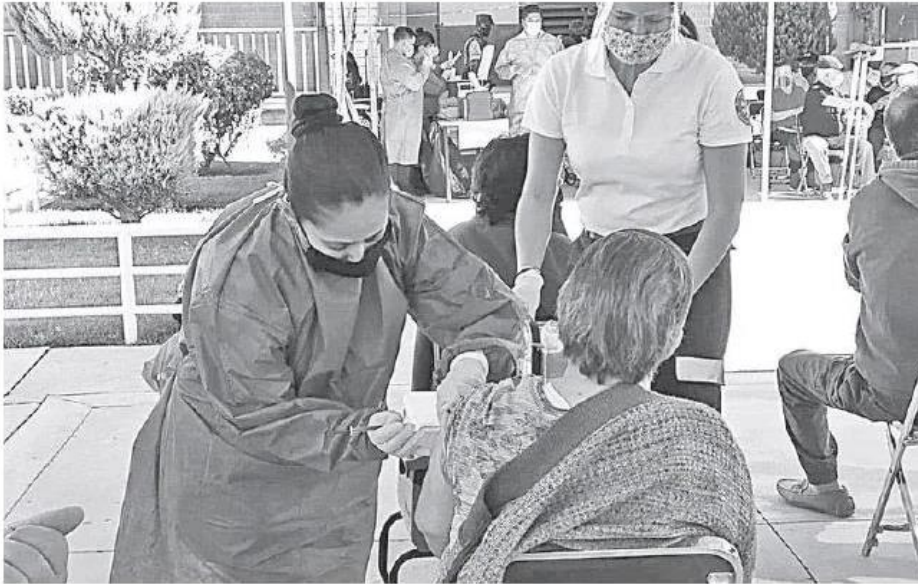
El plan nacional de vacunación considera a los docentes.