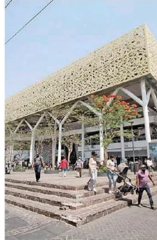
Tapatíos acusan de inseguridad en el Centro de la ciudad. FRANCISCO RODRÍGUEZ

De acuerdo con sus datos, es San Juan de Dios, Obregón, Parque Morelos, Plaza Tapatía, Dos Templos, Mercado Corona y andador Pedro Moreno, donde se carece de vigilancia, se ha detectado negligencia policíaca, asaltos, prostitución, así como personas bajo los influjos de alcohol o drogas, generando que 86 de cada cien tapatíos se sientan inseguros al transitar por ahí.