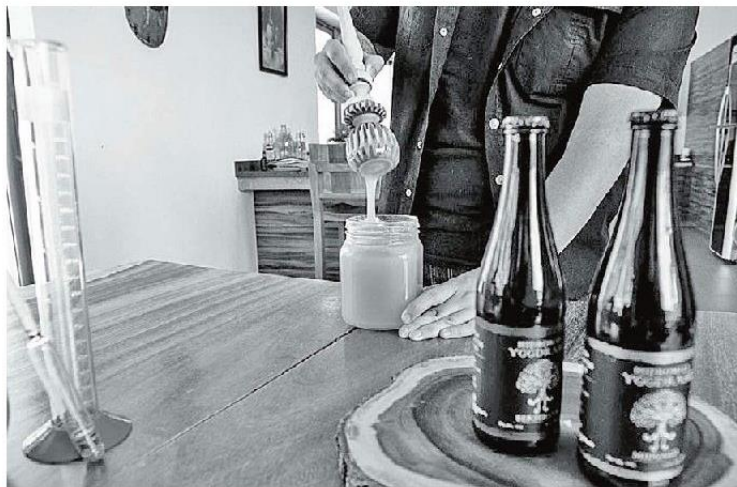
La bebida está preparada en base a miel y su fermentación. ESPECIAL