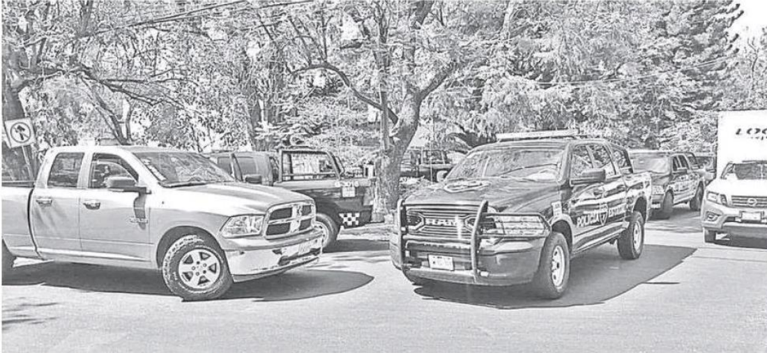
Siguen las investigaciones tras lo ocurrido en la colonia Chapalita. ROMÁN ORTEGA

ASEGURO QUE NO DESCANSARÁN HASTA LOGRARLO