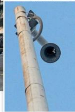
FALLAS. El 1 de febrero un hombre fue privado de la libertad en el cruce de Periférico Sur y Prolongación Colón, en la Zona Metropolitana de Guadalajara (ZMG). En ese punto hay un poste del sistema C5, pero no una cámara.