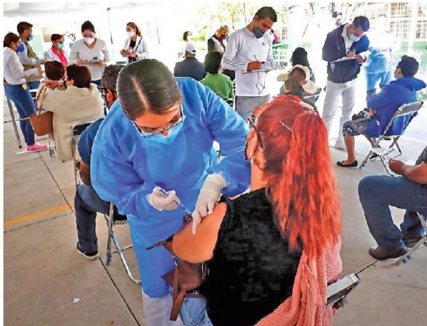
Continúa la inmunización en Tonalá.