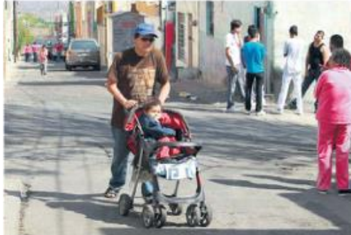
PANORAMA. El Distrito 9 de Guadalajara tiene de los porcentajes más altos de la población económicamente activa en Jalisco.