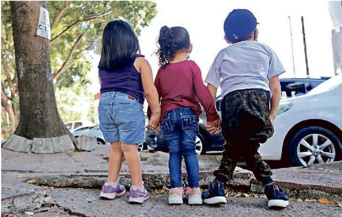
Las familias de tres pequeños que padecen la enfermedad se manifestaron ayer en la Secretaría de Salud Jalisco.

Dejaron de recibir medicamento para síndrome de Morquio