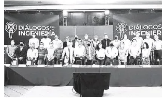
El candidato a la presidencia municipal de Zapopan se reunió con integrantes CICEJ.

El Colegio sugirió que un miembro de su gremio sea quien encabece la Dirección de Obra Pública de Zapopan, al tiem-