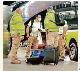
■ Tres integrantes de SAMU viajaron a París.

Este traslado, informó la dependencia estatal, es la primera intervención que se hace tras la firma del Convenio de Cooperación entre la Asistencia Pública Hospitales de París y la SSJ, que busca reforzar los sistemas de formación prácticos y académicos del personal operativo y administrativo de SAMU.