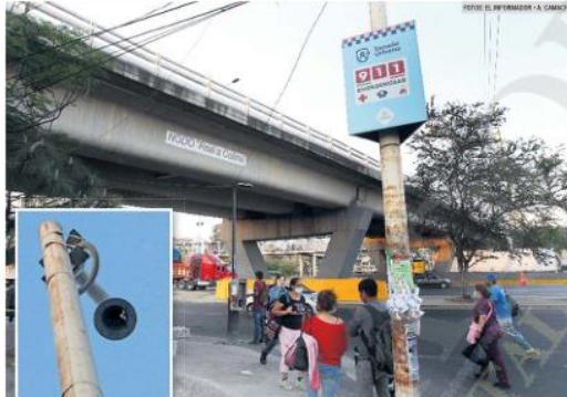
FALLAS. El 1 de febrero un hombre fue privado de la libertad en el cruce de Periferico Sur y Prohonoración Colón, en la Zona Metropolitana de Guadalajara (ZMG). En ese punto hay un poste del sistema C5, pero no una cámara.