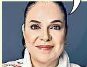
Senadoras por Morena