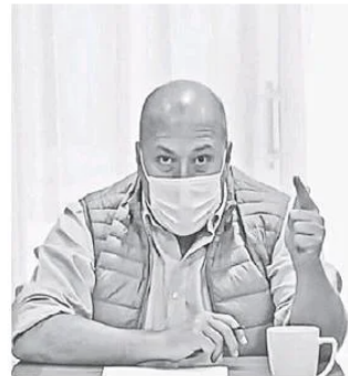
Enrique Alfaro, gobernador de Jalisco.

Destacó el actuar de la autoridad y calificó la acción como “un duro golpe contra la delincuencia” que ha dejado hasta ahora el aseguramiento de un total de tres fincas y de 33 personas detenidas, 20 originarias de Jalisco, 12 de otros esta-