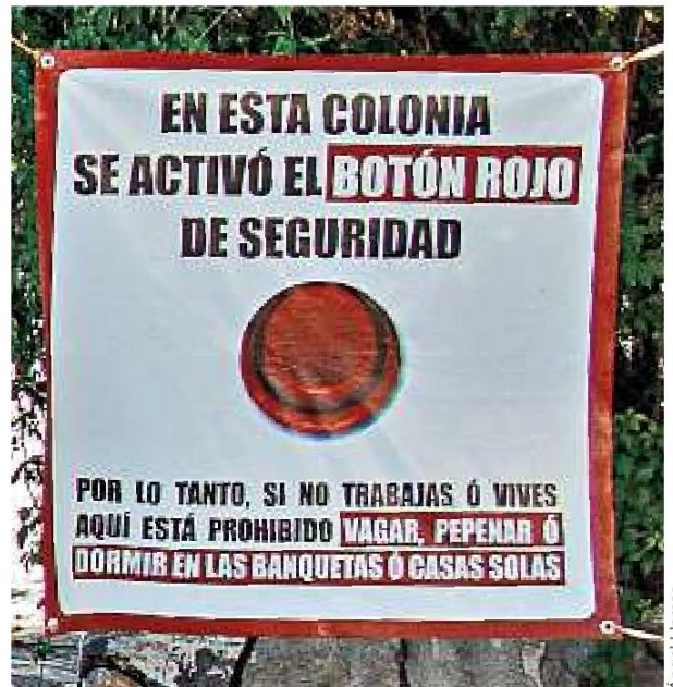
La lona fue colocada en el cruce de las calles José Guadalupe Montenegro y Simón Bolívar.

“Por tratarse de una lona sin fines comerciales, puede permanecer en el sitio. No obstante, autoridades tapatías mantienen comunicación con las y los vecinos en torno a su denuncia pública”, refirió el Municipio a través de su área de Comunicación.