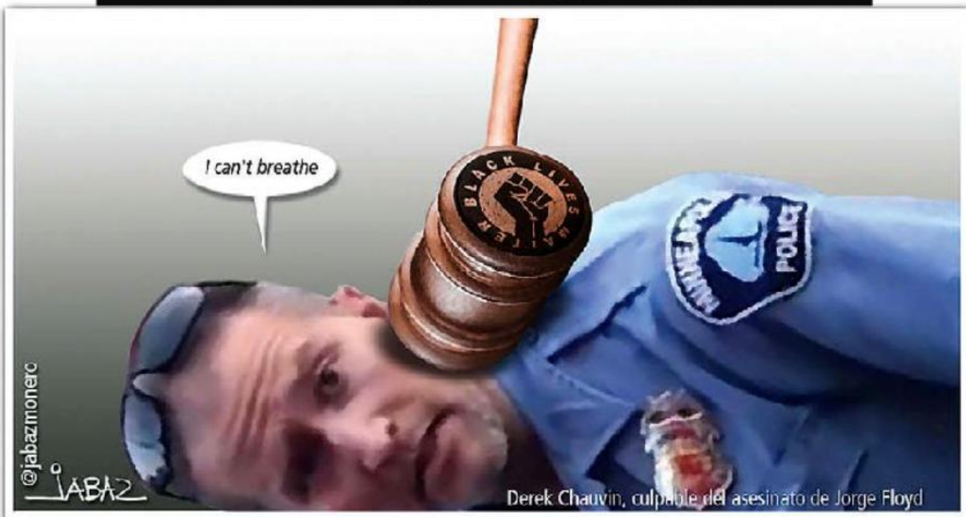
Derek Chauvin, culpable del asesinato de Jorge Floyd