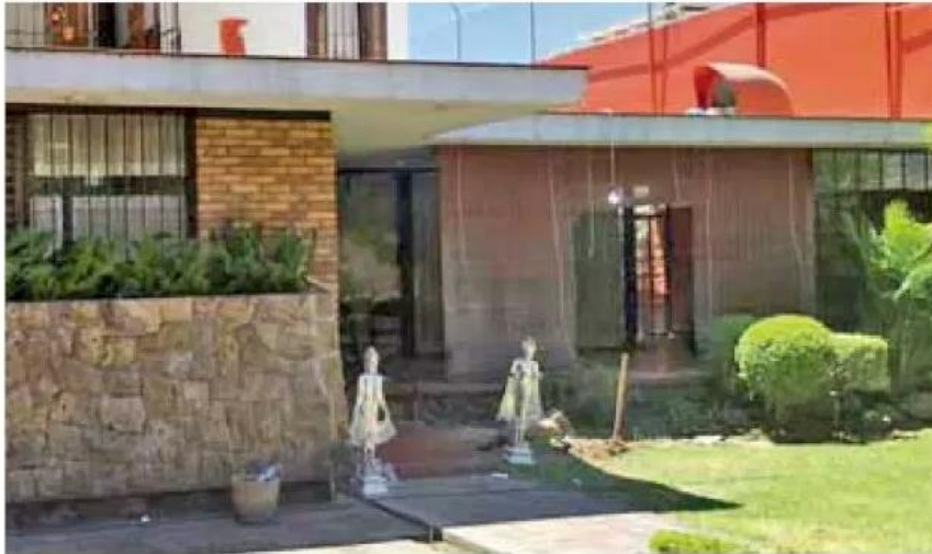
Daños. Así luce el interior de una de las casas en Chapalita, tras la balacera.