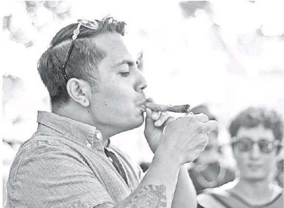
Se llevó a cabo la mesa de diálogo en torno a las políticas públicas en materia de cannabis. FRANCISCO RODRÍGUEZ

"Existe poca voluntad desde el legislativo, del Congreso de la Unión, para comprometerse en serio con este tema. No hay voluntad, este tema no les importa. Se puede poseer 28 gramos de marihuana y con eso no habría delito, pero después de los 200 gramos hay sanciones económicas y de cárcel". Dijo que esto no evitará que los jóvenes se alejen de la cárcel, ya que más del 50 por ciento de las personas