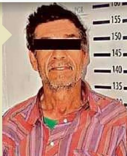
Rostró cubierto por la autoridad