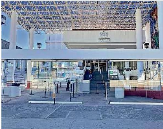
■ En el ISSSTE los pacientes con enfermedades crónicas y graves se han quedado sin sus medicamentos.

“Hago mi listado de lo que necesito y en mis carpetas es pura tachadera de no hay y no se le pone al paciente”, expuso una enfermera del nosocomio.