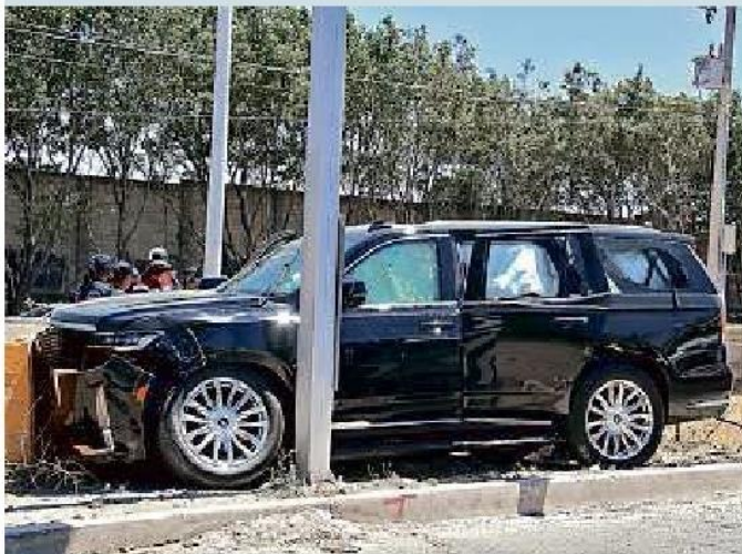
■ Aún no hay una línea de investigación clara en el multihomicidio de la familia Olivas.

Los primeros dos lugares son Tlajomulco, con 277 víctimas, y El Salto, con 199; en cuarto y séptimo están Zapopan con 156 y Tlaquepaque con 95, respectivamente.