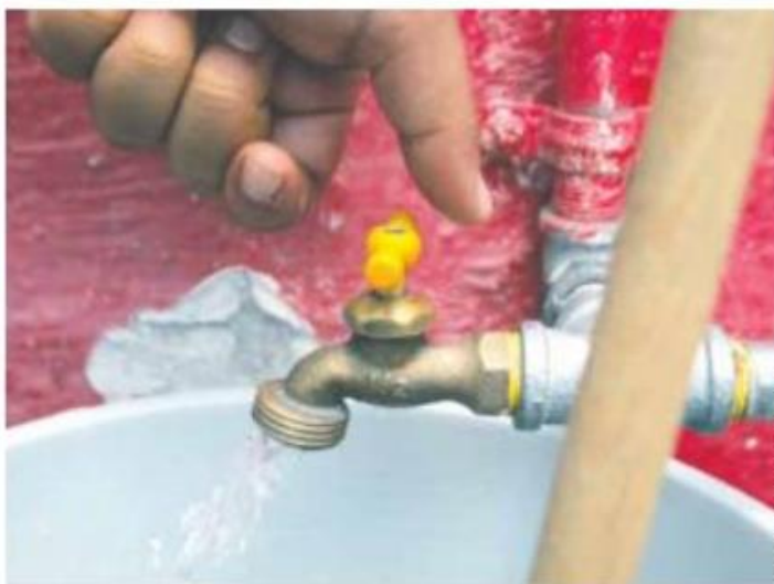
SIN EL LÍQUIDO. Entre los temas a atender como parte del problema se encuentra la falta de agua en el Área Metropolitana de Guadalajara.

El gobernador detalló ayer que el 68 por ciento del territorio estatal presenta sequía severa; sin embargo, el Monitor de Sequía en México de la Conagua señala que son 102 los municipios de Jalisco los que presentan esta condición. Uno más –Degollado– padece