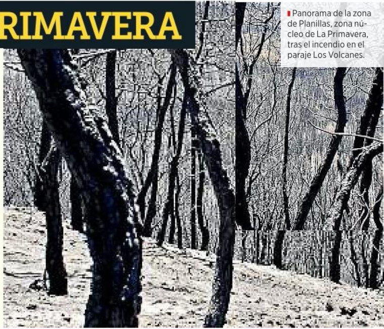
■ Panorama de la zona de Planillas, zona núcleo de La Primavera, tras el incendio en el paraje Los Volcanes.

En un comunicado, la Semadet informó que en este segundo siniestro que alcanzó una de las zonas núcleo tuvo una severidad de moderada a alta en el 38 por ciento del polígono, mientras que el resto fue baja.