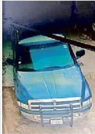
■ Esta es la camioneta en la que viajaba la víctima.

“Pusieron un retén falso en el cual participaron dos patrullas municipales de Tequila, dos camionetas que fueron las que lo intercepta-