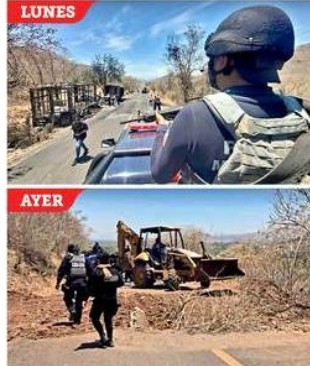
La Policía estatal envió a 100 elementos para liberar 7 tramos de la carretera Apatzingán-Aguililla. Ayer los criminales nuevamente bloquearon diferentes tramos.