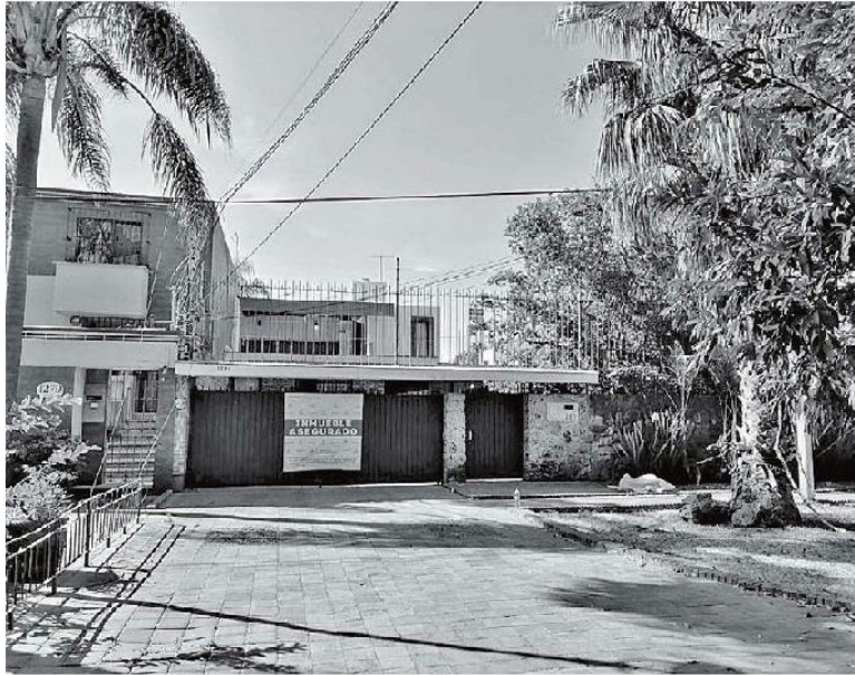
El inmueble asegurado está en la avenida Chapalita número 1285. JORGE MARTÍNEZ