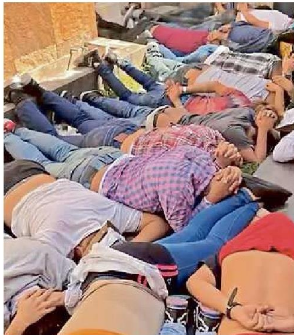
■ Las personas detenidas seguían a disposición de un agente del Ministerio Público ayer.

No obstante, una de ellas, presuntamente menor de edad, pereció a causa de una lesión, aunque no se precisó en qué circunstancias resultó