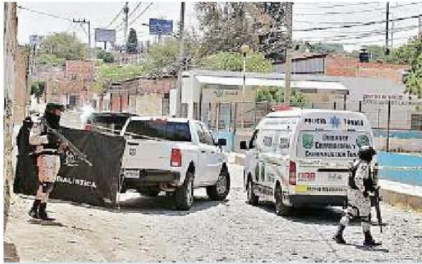
■ En Santa Cruz de las Huertas fue localizada una mujer sin vida.