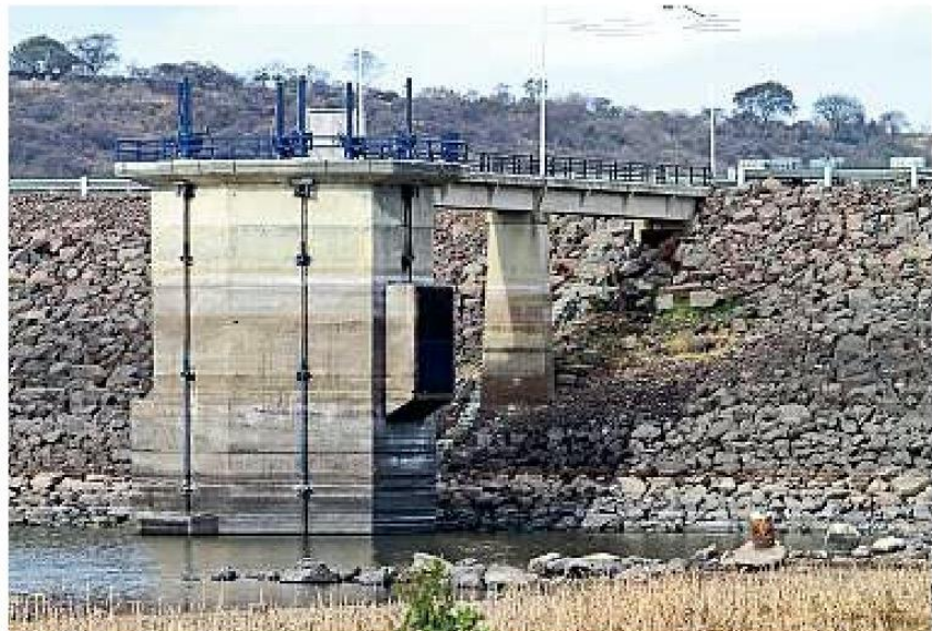
■ En Jalisco, 22 municipios atraviesan sequía moderada; 102 experimentan una condición severa, y solo en uno, Degollado, es extrema, de acuerdo con un informe de Conagua.

“Es por La Niña que este año fue más seco, más caluroso incluso en la temporada de invierno (...). Es una oscilación que ocurre cada ciertos años y puede volver a ocurrir. No quiere decir que sea el cambio climático, es cíclico, periódicamente ocurre”, explicó.