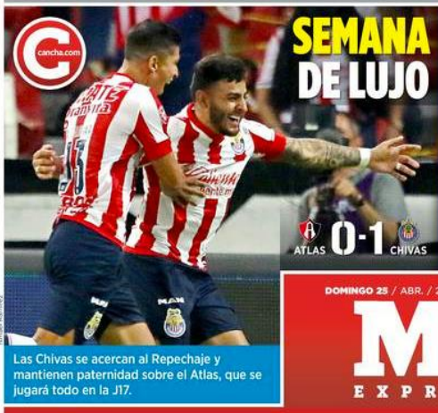
Las Chivas se acercan al Repechaje y mantienen paternidad sobre el Atlas, que se jugará todo en la J17.