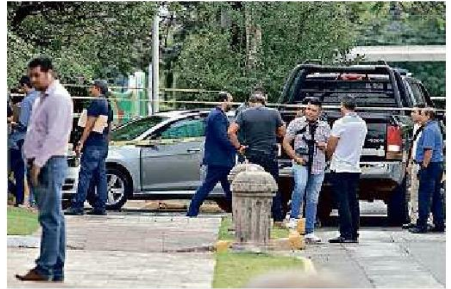
■ El feminicidio ocurrió frente a Casa Jalisco.

De acuerdo con el Secretariado Ejecutivo del Sistema Nacional de Seguridad Pública, en 2019 se recibieron 23 mil 836 llamadas en el 911 que estaban relacionadas con violencia de pareja en Jalisco. En 2020 se registra-