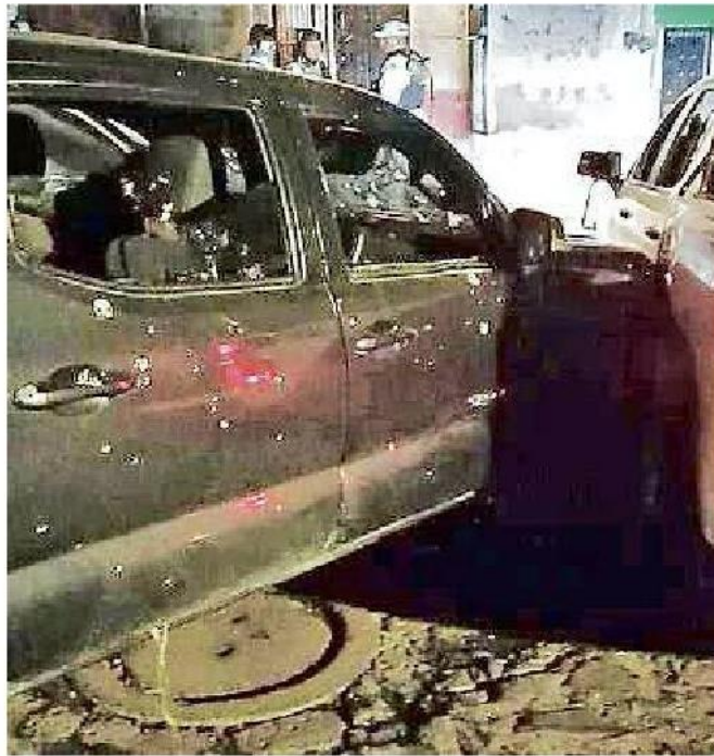
El 3 de febrero se registró en Guadalajara un tiroteo entre sicarios y elementos de la Guardia Nacional.

Comentarios como estos, que reflejan ambos lados de la moneda, inundan las redes todo el tiempo. Por un lado hay desprecio por los actos criminales, pero también