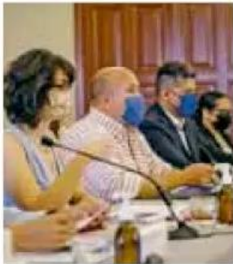
Respaldan la viabilidad del regreso a las escuelas con el semáforo verde.

Autoridades de Jalisco informaron que al darse el retorno presencial a las clases en Jalisco en el mes de agosto, los padres de familia podrán determinar su quieren que sus hijos acu-