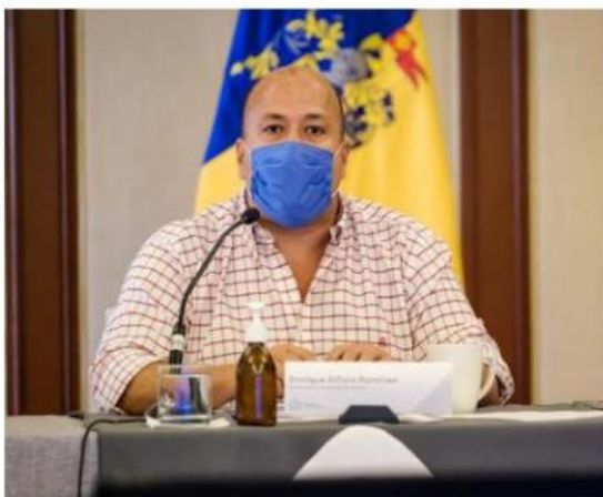
El gobernador Enrique Alfaro hace corte de caja.

Jalisco está listo y preparado para volver a las aulas el próximo ciclo escolar 2021-2022, aseguró el Gobernador del Estado, Enrique Alfaro Ramírez, al dar el corte de caja del regreso a clases presenciales durante el cual se precisó que será opcional la asistencia de los alumnos a las aulas, esto a consideración de los padres de familia. Jalisco se ha mantenido por 6 semanas en semáforo verde, registrando alrededor del 3% en su tasa de positividad y 5.8% en su ocupación