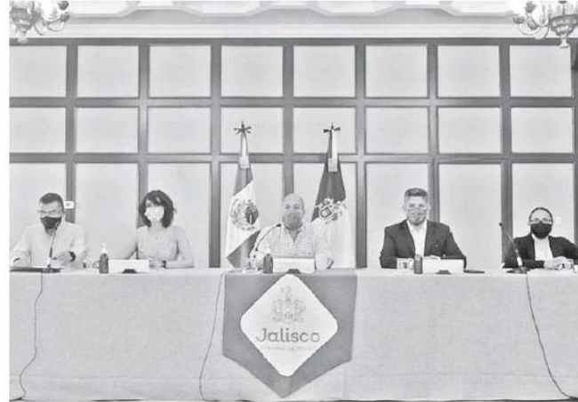
Se requerirá de una reconstrucción total de los daños y no reparación de detalles.

tervenido 47 instituciones de las cuales 24 están proceso y se concluirán la última semana de agosto, mientras que las otras 23 ya están listas para ser usadas en