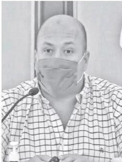
Enrique Alfaro, gobernador de Jalisco.

Para detectar posibles brotes de Covid-19 en el regreso a clases de manera presencial a partir del ciclo escolar 2021-2022 y que será opcional, se aplicarán una serie de pruebas aleatorias para detectar casos positivos y evitar brotes de la enfermedad, anunció el gobernador de Jalisco, Enrique Alfaro Ramírez.