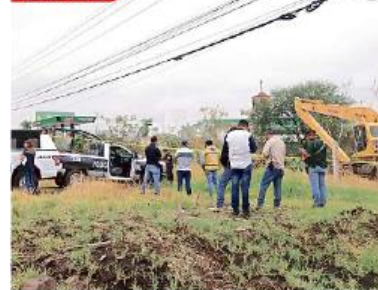
■ Se indagan las causas de muerte de la persona hallada en un canal de Tlajomulco de Zúñiga.