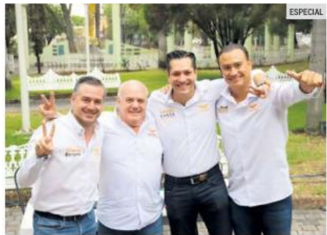
UNIÓN. Los candidatos a diputados federales de Movimiento Ciudadano se dicen listos para la elección.

Aunado a ello, destacaron la importancia que se dará a las micro, pequeñas y medianas empresas a fin de regularizar los ingresos y generar nuevas fuentes de trabajo.