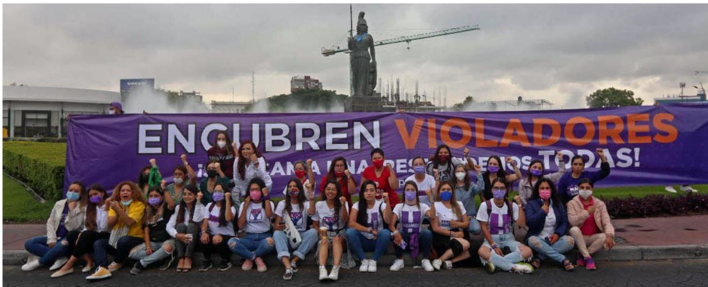
Ayer se manifestaron en la Glorieta de La Minerva. FERNANDO CARRANZA