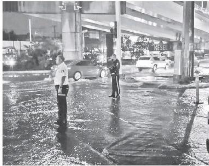
La lluvia dejó árboles caídos, y algunos coches varados.

Hoy se prevén lluvias muy fuertes con descargas eléctricas y condiciones para la caída de granizo en Guanajuato, Hidalgo, Querétaro, San Luis Potosí y Tlaxcala; fuertes en Aguascalientes, Chiapas, Ciudad de México, Colima, Durango, Estado de México, Guerrero, Jalisco, Michoacán, Morelos, Nayarit, Quintana Roo, Yucatán y Zacatecas. La recomendación es tomar precauciones.