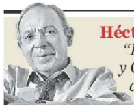
Héctor Aguilar Camín "Bertrand Russell y Confucio sobre la democracia" - P.3