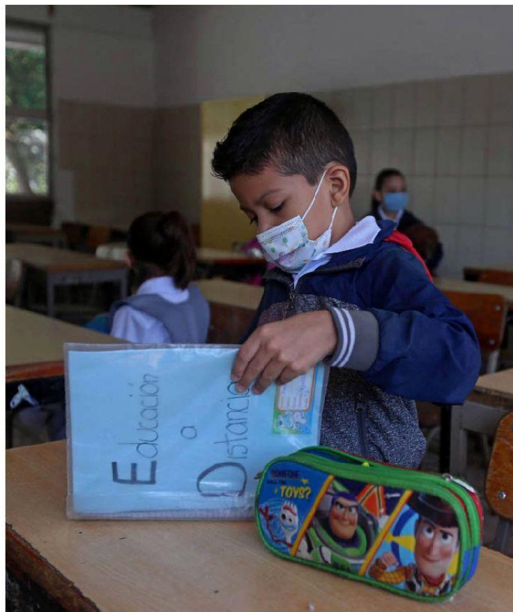
Desde el 17 de mayo reabrieron los planteles para brindar orientación a estudiantes.