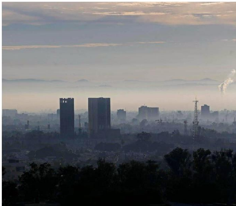
En todo el año no se ha registrado un día con buena calidad del aire. FERNANDO CARRANZA

Situación. Faltan herramientas para monitoreo y políticas públicas en Jalisco para mitigar la contaminación atmosférica