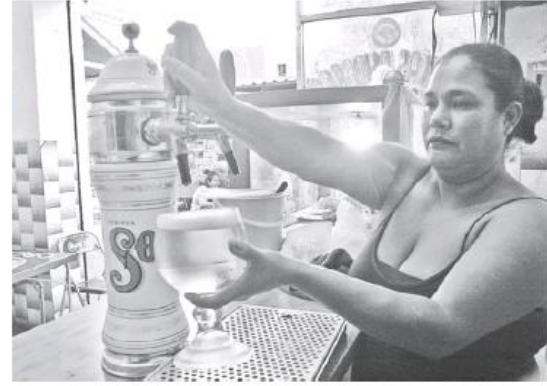
Este próximo fin de semana no habrá Ley Seca en el municipio de Guadalajara. ANTONIO MIRAMONTES

A decir de autoridades municipales, los inspectores llevarán a cabo recorridos en establecimientos de diferentes zonas y corredores comerciales como Chapultepec, Americana, Providencia, Oblatos, Cruz del Sur, zona Centro, Río Nilo, Circunvalación, Revolución, y Olímpica, para garantizar que los comercios cierren en el