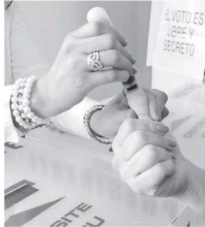
Todos a votar el próximo domingo.

En la guerra de encuestas que se han publicado durante la campaña, llama la atención