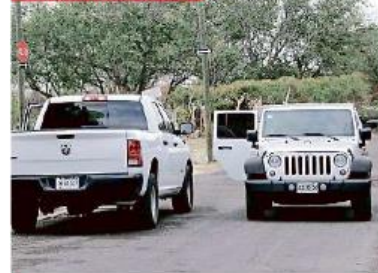
■ La víctima se encontró atada y cubierta con una cobija.