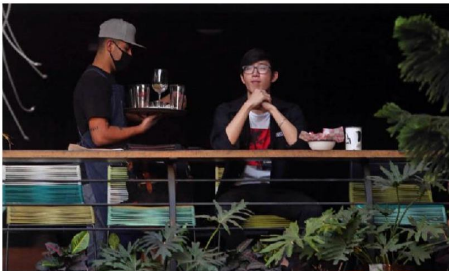
Los restaurantes son el primer vínculo entre los turistas y los destinos. FERNANDO CARRANZA