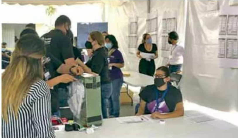
Revisión. El patio del IEPC fue dispuesto para realizar el conteo de algunos votos.