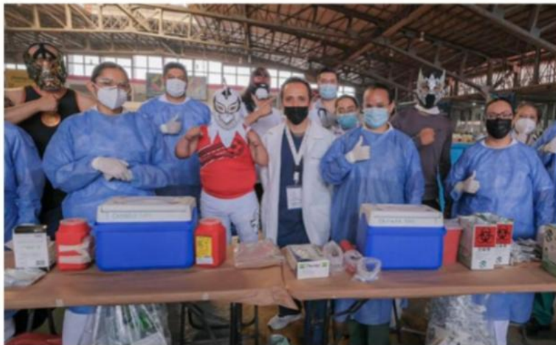
El equipo de vacunación tiene aliados incondicionales en los enmascarados.

Esta mañana acudieron los luchadores y luchadoras para ayudar a las personas mayores que tengan una movilidad reducida a trasladarse y con ello agilizar el proceso. “Venimos de diferentes partes de la República Mexicana para traer ayuda de manera altruista. Jalisco es el primer Estado que nos convoca para realizar estas actividades, lo que es muy bueno para todos nosotros ya que nos debemos al pueblo y esto es un