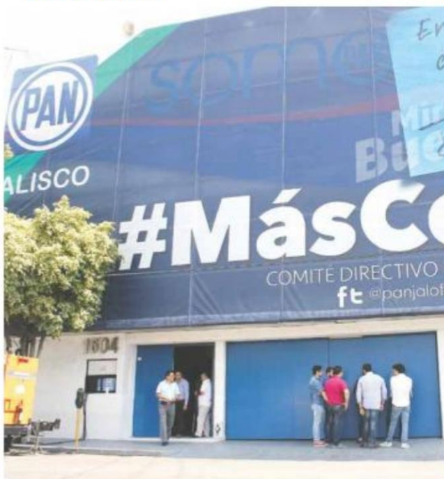
DE ACUERDO CON LOS DATOS DEL PREP APUESTAN POR UN CAMBIO