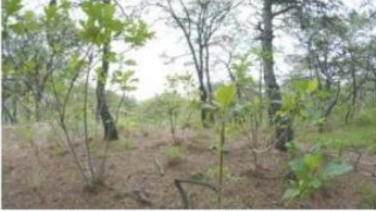
UBICACIÓN. El terreno que pretende subastar el Instituto para Devolverle al Pueblo lo Robado se encuentra en el cerro Pelón, en el área del cerro del Tajo.