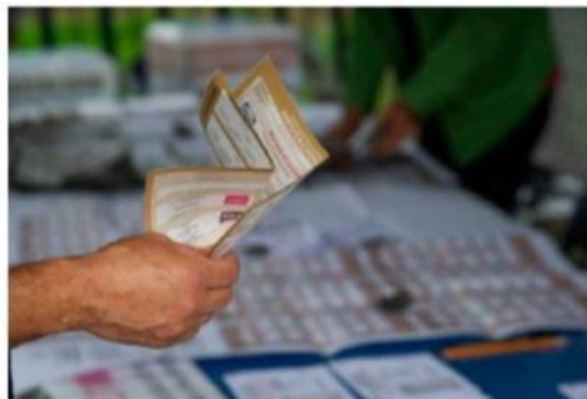
Voto por voto para no dejar dudas electorales.

“De cualquier manera le quiero decir que las instituciones relacionadas con la seguridad públicas, están atentas al desarrollo de las tareas del INE, sin una consideración de carácter