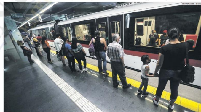
AFECTACIÓN. Al menos 11 rutas se quitan usuarios a la Línea 3 y ocasionan que esté subutilizada.

En agosto pasado, en sesión extraordinaria del Consejo de Administración del Siteur, se informó que se tiene en proceso la contratación de algunos instrumentos jurídicos con