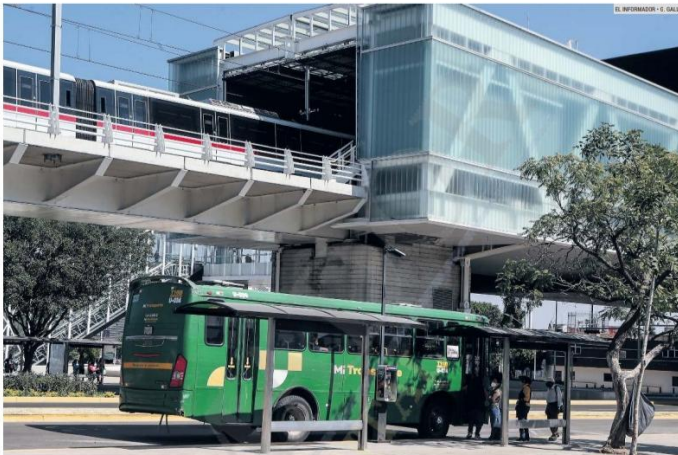
PANORAMA. En diciembre pasado se registró el mayor número de usuarios, pero la cifra quedó lejos de la meta.

Sobre las "fallas" en la infraestructura de la Línea 3, como parte del proceso de garantía, "se han detectado 360 puntos a subsanar, atendidos por la SCT", según el Siteur.