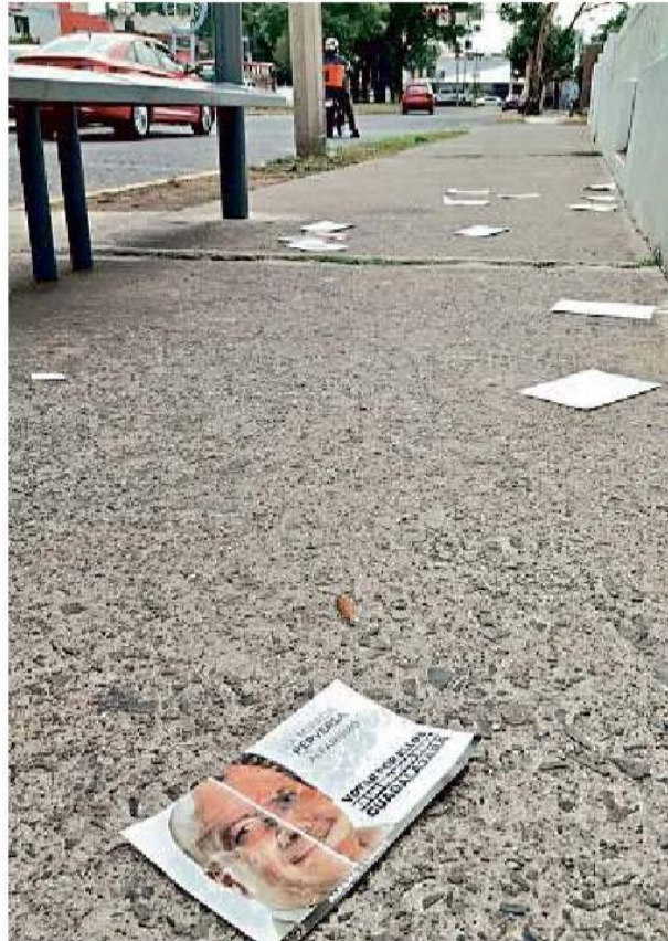
■ En paradas del camión se repartieron volantes para denostar a candidatos.