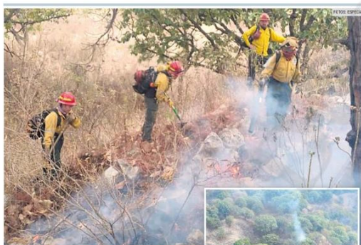
ACCIÓN. Luego de que el responsable de prenderle fuego al bosque fue trasladado al Ministerio Público, las brigadas forestales se enfocaron en controlar el incendio, lo cual se logró en poco tiempo debido a que lo detectaron con anticipación.

Sugerencias, quejas y comentarios 33-3678-8893 comentarios@informador.com.mx