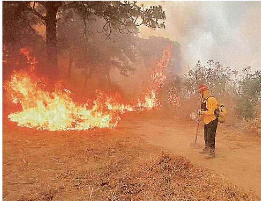
Los incendios con mayor área afectada han sido el de Las Canoas y Los Volcanes.