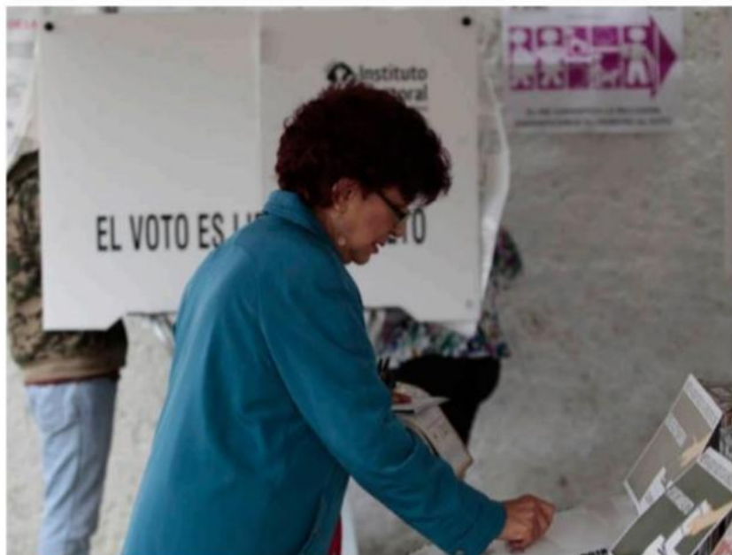
Sólo una mujer se perfila para ganar una presidencia municipal.

La investigadora de la UdeG agregó que en general, en las alcaldías de Jalisco hay un retroceso respecto al 2018, en materia de paridad electoral, ya que de 474 candidatas a presi-