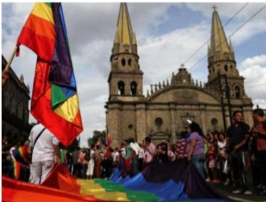
Únicamente 10% de este sector social recibió apoyo gubernamental.