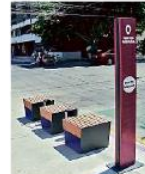
En una primera etapa se colocaron 13 Puntos Púrpura.