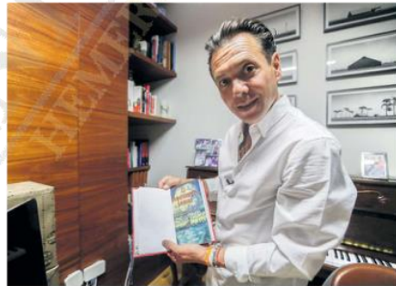
EJEMPLAR. En la foto muestra el libro “El Presidente Lemus”, un regalo que recibió de uno de sus amigos.