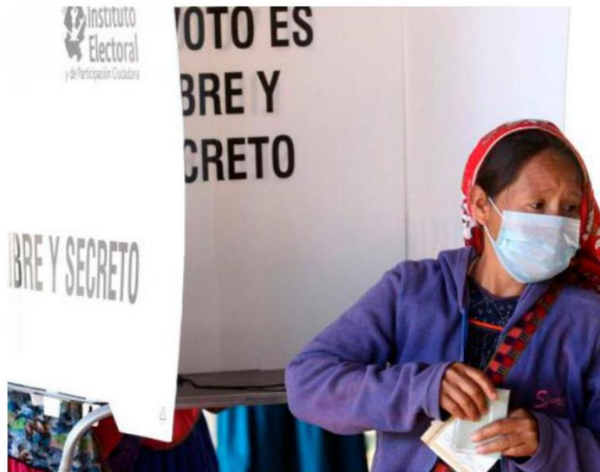
El INE es un instrumento de los ciudadanos que todos deben cuidar.

“Se reafirma también el INE como una institución del Estado mexicano, fundamental para el desarrollo de las elecciones en nuestro país y que es una garantía de legalidad, imparcialidad, ante partidos polí-