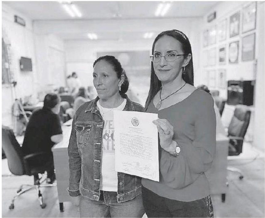
La diputada federal Laura Imelda Pérez Segura repetirá en el Distrito 16.

Otro punto es que sus medidas y colindancias no coincidían con lo que aparece en el certificado de libertad de gravámenes; su ubicación alejaba a fraccionamientos clausurados y ahora un decreto que lo declara zona de amortiguamiento y protección para el bosque de la Primavera. Esto implica que nadie seguramente pagará dicha suma solo para ir a contemplarlos o pasear por ahí, nunca podrán urbanizar y lo mejor sería es que el gobierno federal -como un "regalote" para los jaliscienses- ceda los derechos o los deje para fines ecológicos, porque si alguien tenía la pasión de hacer casas ahí.....mejor que se le borre.