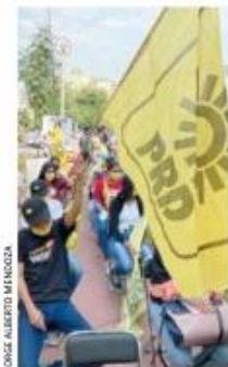
JOSÉ ALBERTO MENDOZA

● INSISTIRÁ. A pesar de que no cuenta con mayoría calificada para la próxima Legislatura en la Cámara de Diputados, el presidente Andrés Manuel López Obrador adelantó que enviará reformas, aunque vayan a ser rechazadas, para fortalecer a la CFE. EL FINANCIERO