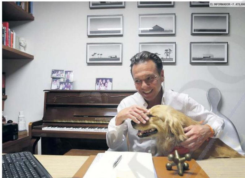
APERTURA. La entrevista con el ganador de la elección para alcalde de Guadalajara y actual presidente municipal de Zapopan con licencia, Pablo Lemus Navarro, se llevó a cabo en su casa. En la imagen, acaricia a su perra Mafalda.

Por ese motivo, subraya que su victoria se debió a una mezcla entre la confianza de los ciudadanos y un rechazo al partido presidencial (Morena). “Hubo un voto masivo a la persona, pero también hay que decirlo: hay un mensaje muy claro en la elección de que aquí Morena no entra, sobre todo en los municipios principales. En Guadalajara, Zapopan, Tlaquepaque, Tlajomulco es ponerle un muro a Morena. Y lanzar un mensaje a nivel nacional que desde Jalisco estamos iniciando un despertar ciudadano importantísimo”.