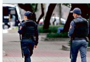
■ Algunos vecinos de la Colonia Americana aseguran que hay más robos en la zona.

"Estamos desesperados porque es una persona, es una vida, es un ser humano".