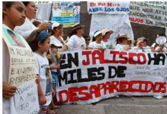
En el tema de personas desaparecidas Jalisco se ubica en el primer lugar.

«Es importante que esos mensajes lleguen justo a quienes están dirigidos que es a las personas que van a asumir un cargo de elección popular y que triunfaron en esas boletas, porque al final ese es el sentido de la protesta y justo lo espontáneo que nosotros entendemos del acto en sí mismo, de este acto político porque al final las familias también son ciudadanos que ejercen su vo-