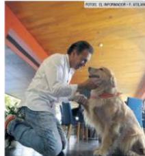
COMPañÍA. Una de sus mascotas es Mafalda, nombre elegido en honor al caricaturista Quino.