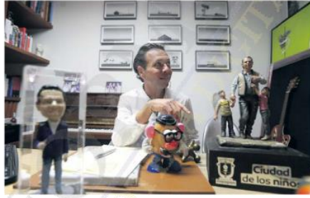
AFICIONES. “El Señor cara de papa lo tengo desde hace muchos años. Siempre lo llevo a mis oficinas”.