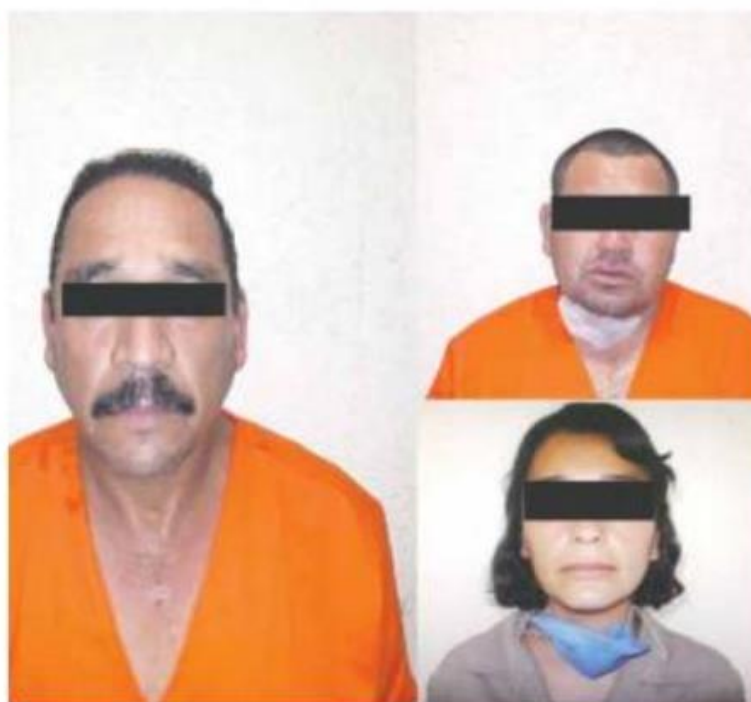
LUEGO DEL ESCÁNDALO. Los tres implicados fueron detenidos el 6 de junio de 2020.