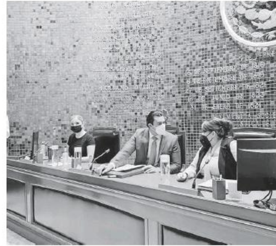
La Mesa directiva del Congreso en la sesión solemne.

Realizó un recuento de la historia y los momentos más importantes, por lo que subrayó que hoy en medio de la polariza-