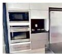
■ Finca en La Rioja que sorteará la Lotería Nacional.