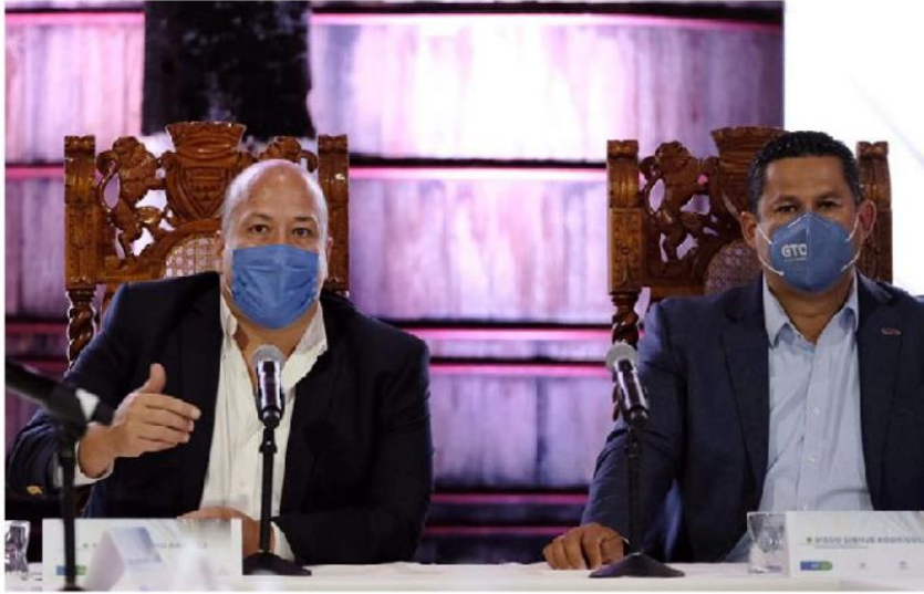
Los mandatarios estatales sostuvieron ayer una reunión.