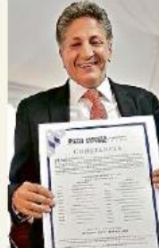
■ Frangie señaló que arrancará su gestión como Alcalde con obra pública.

"Me voy unos cuatro, cinco días fuera, me voy mañana (jueves), he estado trabajando