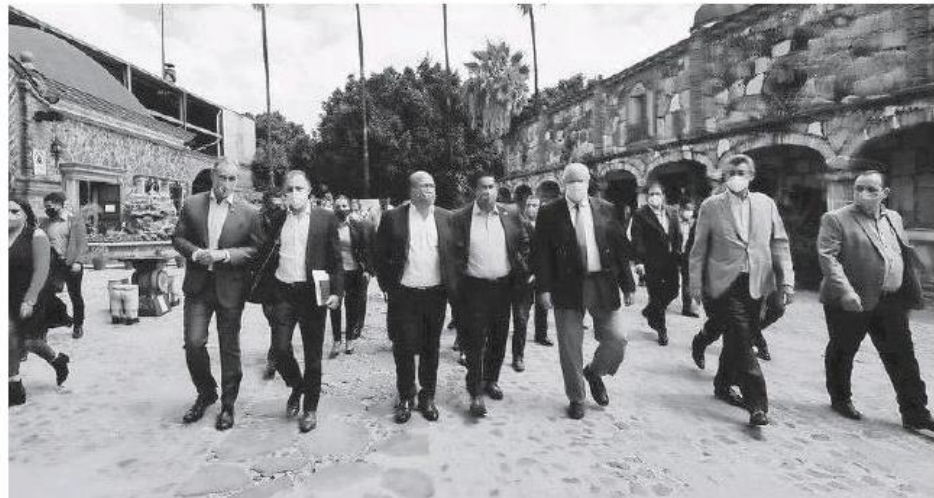
La firma del acuerdo en una hacienda tequilera en Pénjamo, Guanajuato.

Zonas deforestadas o incendiadas no podrán ser campo de cultivo de la planta del tequila