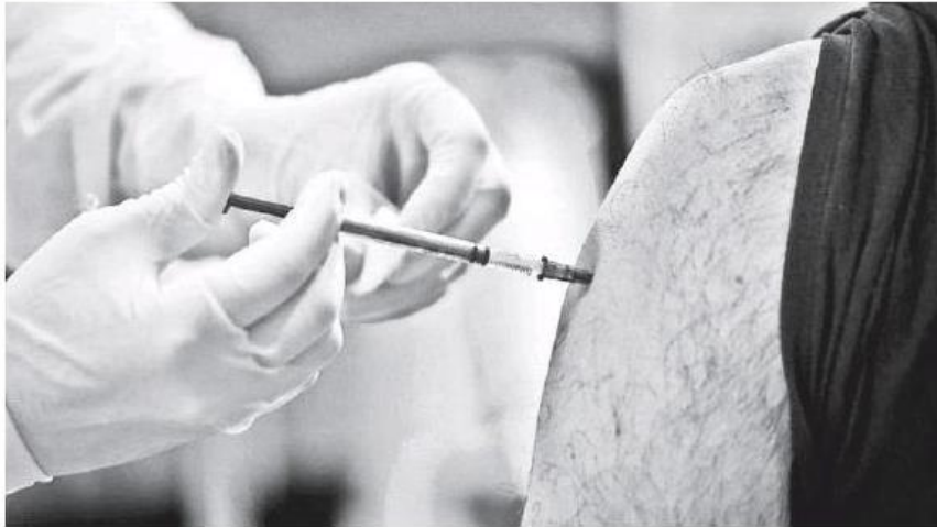
Se aplicaron mil 793 dosis de vacunación contra Covid-19 de CanSino.