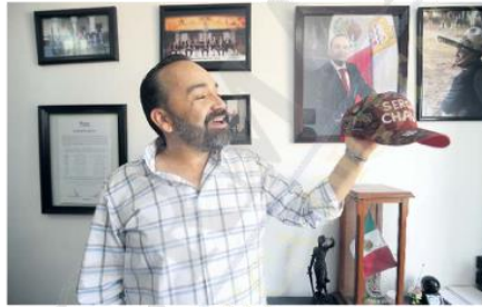
APRECIO. En la imagen sostiene una gorra pintada a mano que le regalaban durante la campaña.