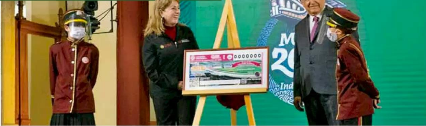
Sorteo. Es el primer año que habrá premios en especie y en efectivo, tras rifa del avión presidencial.

AMLO ahora rifará palco del Azteca por fiestas patrias Pág. 03