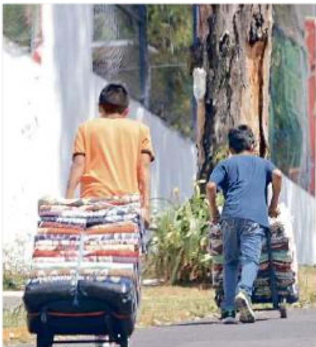
Ante la crisis, los niños tuvieron que comenzar a trabajar.

también se acentúa en primaria indígena, en secundarias generales y técnicas, así como en las regiones Norte, Costa Sur, Lagunas y Altos Norte”.