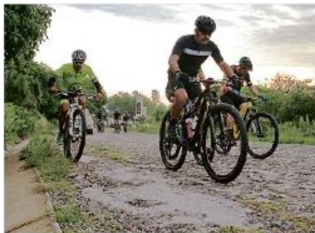
Los robos ocurren cerca de la caseta de ingreso al bosque.

Ante esto, llaman a las autoridades a reforzar la vigilancia a temprana hora y piden a la población no comprar bicicletas robadas para frenar el mercado negro.