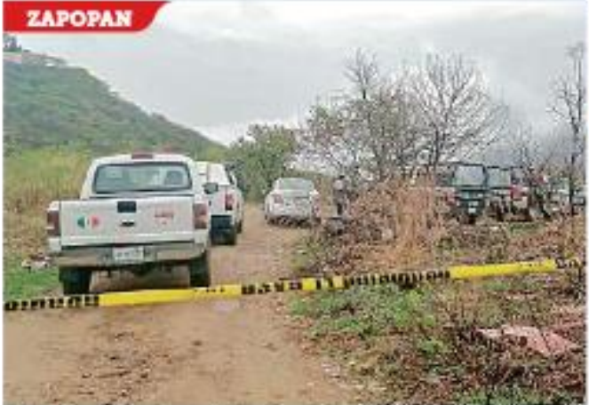
Dos mujeres fueron baleadas en La Coronilla.