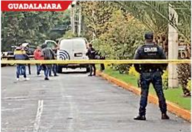
En Chapalita se localizó un cuerpo en un carrito.