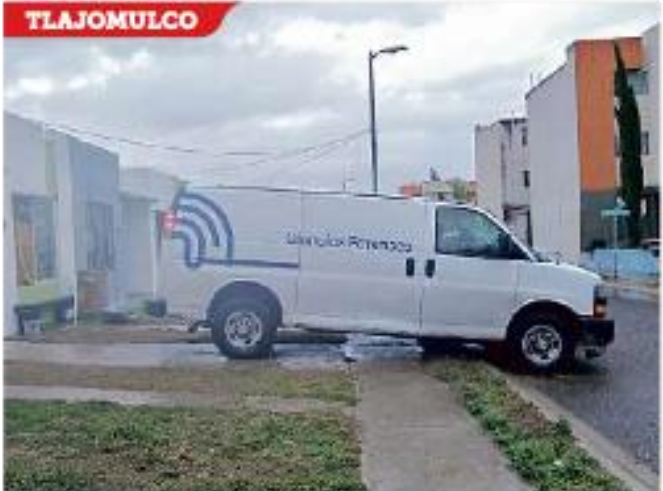
En Lomas del Mirador fue hallado un cadáver.