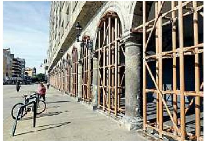
■ Protección Civil y Bomberos de Guadalajara ordenó este viernes el desalojo del Hotel One, en el Centro tapatío.

Además especifica que en caso de un sismo de gran magnitud, el hotel puede sufrir daños severos que comprometen la seguridad de huéspedes y trabajadores, por lo que Protección Civil estableció una mesa de trabajo con los encargados del inmueble.