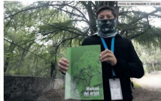
IMPORTANCIA. En el Manual del árbol se incluyen nueve ejemplares patrimoniales.