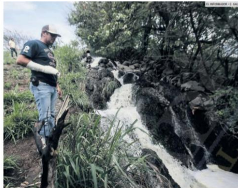
PROBLEMA. Cuando llegaron a comprar viviendas en los fraccionamientos de El Vado, en Tonalá, los colonos no fueron advertidos de que ni los desarrolladores ni las autoridades locales se harían cargo de sus aguas negras.

Sugerencias, quejas y comentarios 33-3678-8893 comentarios@informador.com.mx