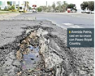
Avenida Patria, casi en su cruce con Paseo Royal Country.

Su derecho Si su auto sufrió daños al caer en un bache, haga su petición de indemnización. El escrito debe llevar: ■ El Municipio al que se dirige, su nombre, domicilio para recibir notificaciones, descripción de los hechos, su petición con cálculo estimado del daño, su firma y pruebas (fotos). ■ El escrito debe presentarse ante el municipio presuntamente responsable.