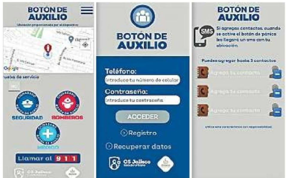
La aplicación del Botón de Auxilio pretende hacer más rápida la atención de reportes.

“Considero que se tienen que hacer reuniones con líderes de vecinos para decir cuáles son las estrategias. Las policías municipales y otras dependencias podrían hacer ese trabajo; inclusive incluir a la Universidad para que hagan este tipo de campañas que son para la prevención”.