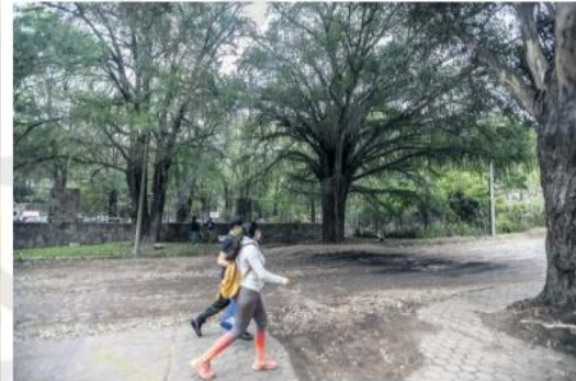
POSTULACIÓN. Se propusieron 86 árboles para formar parte del listado.

Se prevé que Corredores Verdes capturarán 36.72 toneladas de dióxido de carbono