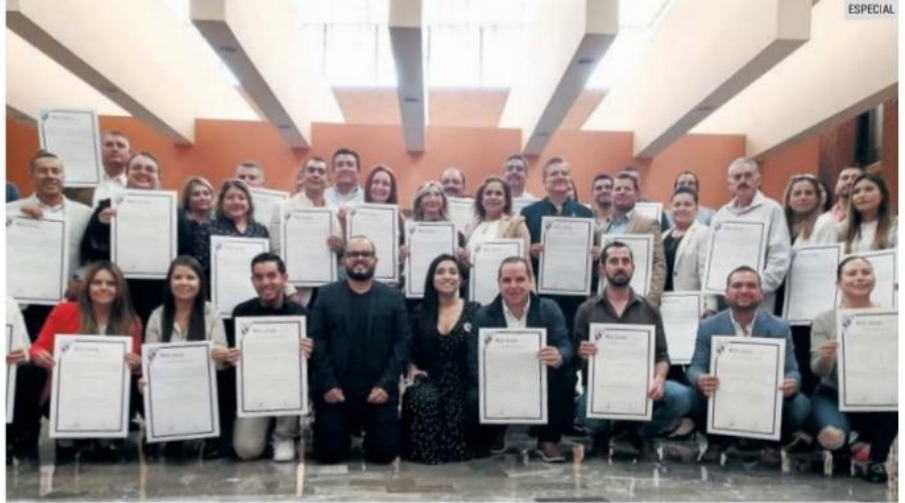
RESULTADOS. Hagamos obtuvo el apoyo de los habitantes en las pasadas elecciones.

“Hoy me da mucho gusto estar con ustedes y verles después de haber recibido ya la constancia de que, en sus comunidades, la