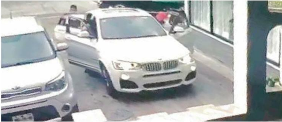
El video de la agresión fue difundido en redes sociales.