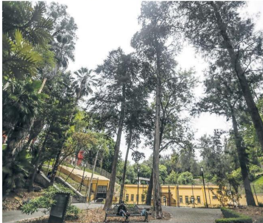
ANTIGÜEDAD. En Los Colomos están dos de los árboles más longevos.