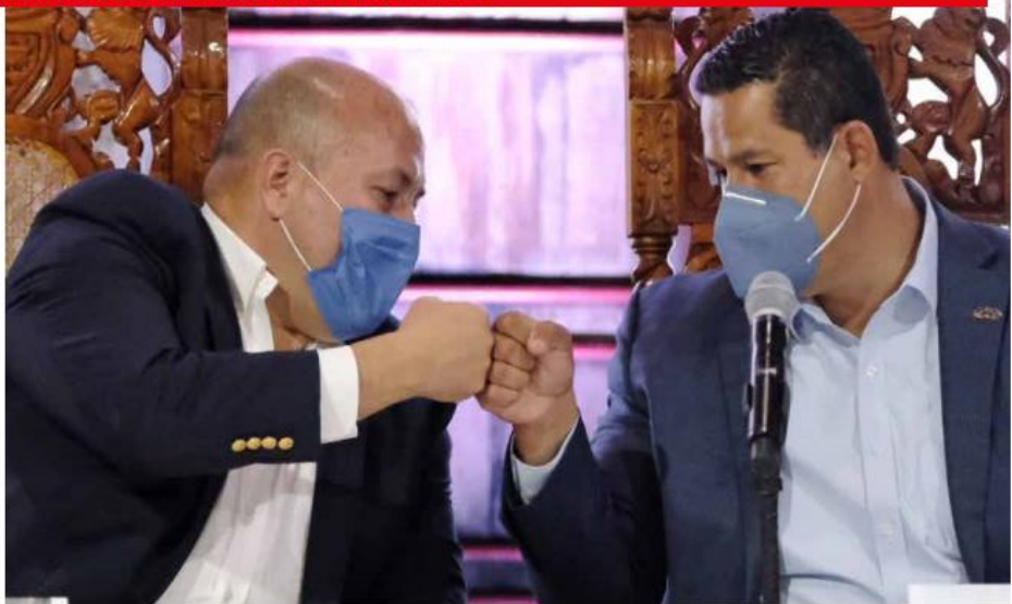
Los gobernadores de Jalisco y Guanajuato, Enrique Alfaro y Diego Sihnue, están de acuerdo de cómo distribuirse el agua que alberga la presa de El Zapotillo.

Es decir, la gran decisión estaría en invertir esta multimillonaria cifra en beneficio de una obra de la que no se sabe si puede servir o no, ya que todos los pronósticos, incluidos los estudios de la UNOPS, realizados por instrucciones del ex gobernador, Jorge Aristóteles Sandoval Díaz, se han hecho con base en un caudal estimado de 16 metros cúbicos por segundo, una referencia de hace 30 años para el río Verde y hay duda que ese caudal se mantenga.