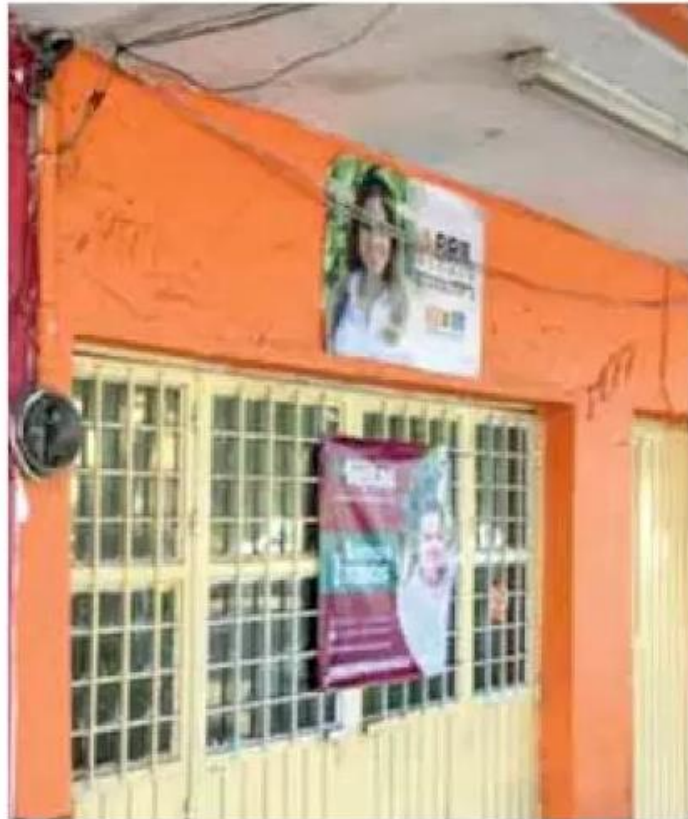
Aviso. La autoridad revisa las ubicaciones.

“Hubo incumplimiento, lo que hicimos en un primer momento fue revisar que estuviera esta propaganda y luego regresamos porque primero re-