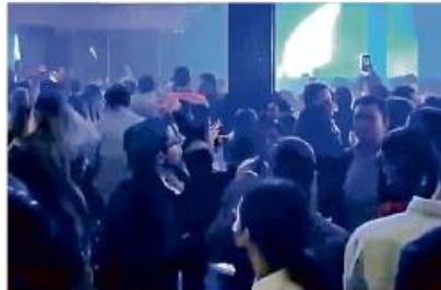
Sin cupo para más estuvo el sábado un lugar en Av. Acueducto, Colinas de San Javier.

En un antro ubicado sobre la Calle Bernardo de Balbuena, en Guadalupe, los empleados continuaban per-