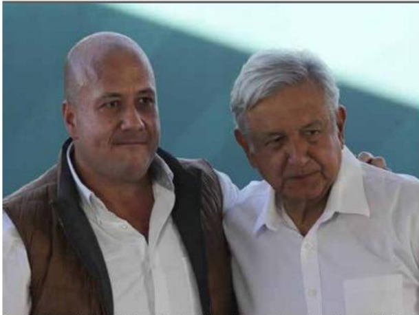
Presidente Andrés Manuel López Obrador. "Si no llegamos al acuerdo, dejamos ahí toda la inversión", dijo en la semana a propósito de las demandas de los pobladores de Temacapulín, Acasico y Palamaré que se oponen a la presa.