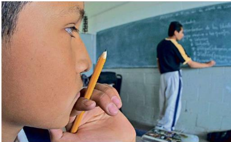
La educación tradicional en México debe modificarse para poder competir en el mundo globalizado, advierte el experto.

“Nos dimos cuenta que el sistema educativo no estaba preparado para lidiar con una circunstancia como la del Covid-19, ni los profesores ni los alumnos estaban utilizando las pedagogías educativas ni las tecnologías que en muchos otros países se están dando.