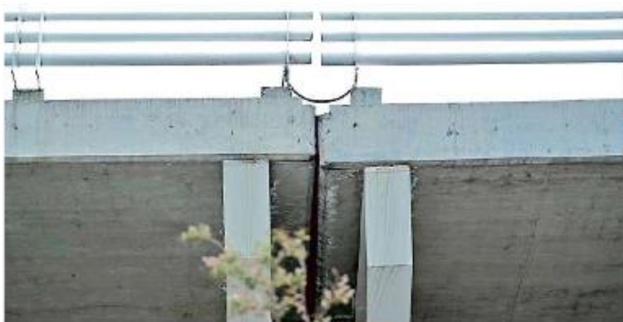
Desnivel de la trabe ubicado en Avenida Revolución y Calle 62.

Por su parte, el usuario compartió imágenes de las traveses y vigas que deberían estar a la par, sin embargo, lucen desfasadas. Ante lo cual advirtió que podría ser un riesgo y afirmó que el paso