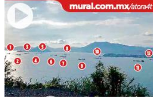
En el Puerto de Manzanillo ayer había por lo menos 12 buques fondeados. La imagen corresponde al 24 de junio.

Señalan que demoras son por inexperiencia de Administración de puerto de Manzanillo