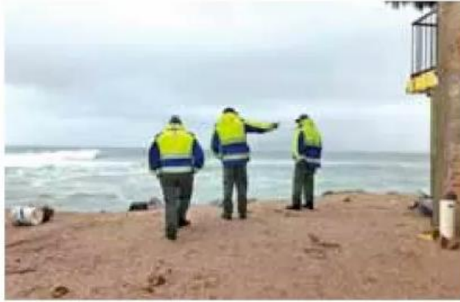
Cierre. Debido al incremento del oleaje, restringen las actividades en las playas.

Autoridades estatales informaron que se mantiene el plan de emergencia en la costa de Jalisco por el paso del huracán "Enrique" y donde sus efectos se han comenzado a notar. Desde las 13 horas de este domingo el ojo del huracán categoría 1 (y que podría subir a categoría 2 conforme se acerque a la costa de Nayarit), se desplaza paralelo a Jalisco.