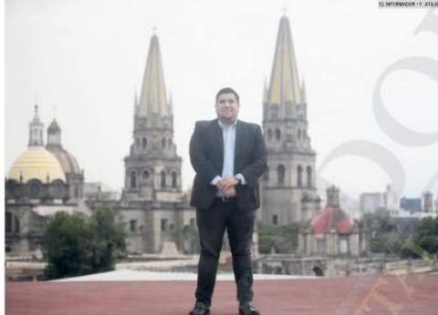
EDUARDO MARTÍNEZ LOMELÍ. El presidente municipal interino de Guadalajara dice que trabajará en la recuperación del espacio público y que atenderá las demandas de la ciudadanía.

En el arresto también cayeron siete presuntos implicados en la matanza. Aseguraron ocho vehículos, 16 armas de diversos calibres, dos de ellas de alto poder y más de tres mil 900 cartuchos útiles de diversos calibres. Además de 80 cargadores, ocho chalecos balísticos, dos granadas y equipamiento táctico, así como un paquete con marihuana. Al respecto, el Papa Francisco envió sus condolencias a los familiares de las víctimas y condenó la violencia. El religioso ofreció sus oraciones en memoria de los fallecidos.