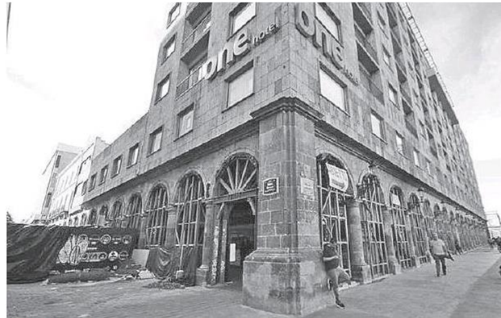
Autoridades pidieron apuntalar el lugar. Francisco Rodríguez

Ubicado en paseo Fray Antonio Alcalde, frente a Plaza de Armas, cabe recordar que este ha sido uno de los inmuebles que más ha sufrido afectaciones por las obras de la Línea 3 del Tren Eléctrico. "Inicialmente nosotros hicimos una revisión de medidas de seguridad, de estructurales del