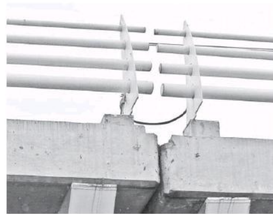
Así es como luce una de las estructuras por donde pasa la Línea 3. AURELIO MAGAÑA

A través de redes sociales, varios usuarios denuncian que la placa de cemento se está hundiendo, junto con la estructura de acero, y al parecer hay un desnivel en la parte de arriba y "rieles están haciendo un tipo de cuneta" y cuando pa-