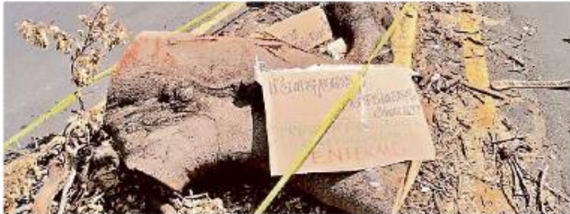
Vecinos lamentan la tala de un árbol que se ubicaba sobre el camellón de Avenida Sierra de Mazamitla, casi esquina 18 de Marzo.

Se trata de un ejemplar de más de 30 años de edad que se ubicaba sobre el camellón de avenida Sierra de Mazamitla, casi esquina 18 de Marzo, que según veci-