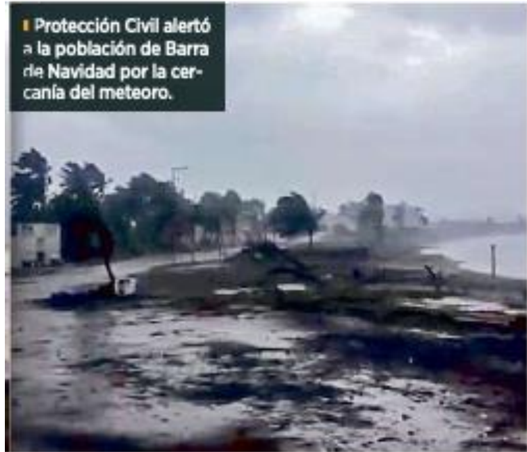
Protección Civil alertó a la población de Barra de Navidad por la cercanía del meteoro.