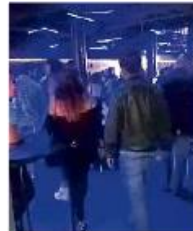
El otrora Salón Veracruz tuvo un evento el 18 de junio al máximo de su capacidad.