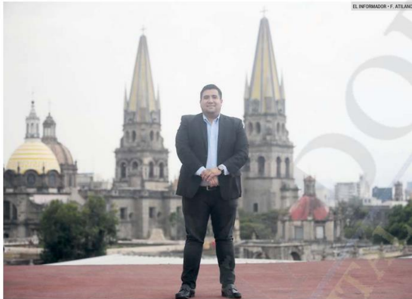
EDUARDO MARTÍNEZ LOMELÍ. El presidente municipal interino de Guadalajara dice que trabajará en la recuperación del espacio público y que atenderá las demandas de la ciudadanía.

Ésta será una campaña permanente en los barrios y colonias de Guadalajara, en la que los sábados se estará sumando la participación de funcionarios trabajando en conjunto con la ciudadanía.