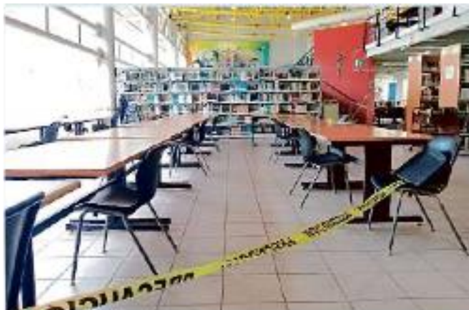
En el CUCBA condicionan el uso de la mesa de la biblioteca a que el usuario esté vacunado contra el Covid-19.

Además, en el caso de la biblioteca del CUCBA, no contaba con afluencia debido a que las clases siguen siendo mayoritariamente virtuales, pese a ello no facilitaron las condiciones para permanecer en el espacio.