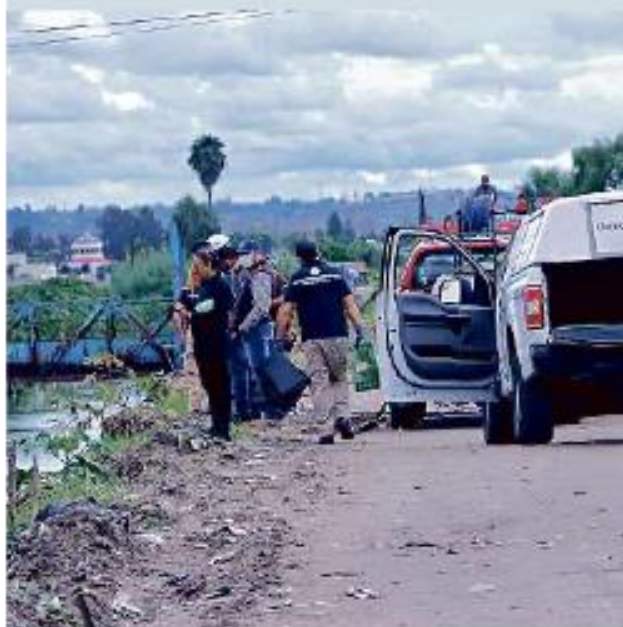
■ Bomberos usaron una soga para asegurar el cuerpo.

De acuerdo con registros oficiales, entre enero y mayo se abrieron 96 carpetas de investigación por homicidios ocurridos en Tlajomulco.