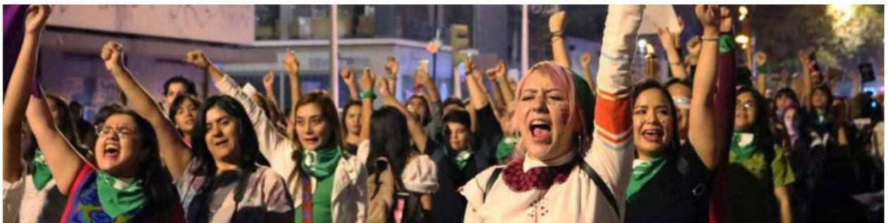
La lucha de las paritaristas por la equidad en la postulación de candidatas a las alcaldías se estrelló con la voluntad ciudadana que para municipios votó más a favor de hombres que de mujeres.

Y recaló: "Pero yo sí puedo decir que no cumplió con su propósito, es decir, la ley no funcionó esta sentencia del tribunal a obligar a los partidos a poner a un hombre y una mujer en los 10 municipios más poblados de Jalisco".