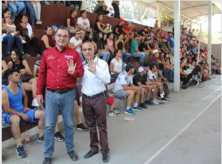
José Manuel Cárdenas Flores, presidente municipal electo de Jilotlán de los Dolores.