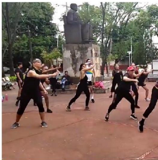
Ofrecieron clases de zumba y baile.

Alrededor de las 11 de la mañana se reunieron en la Plazuela José Clemente Orozco, entre los Arcos Guadalajara y La Minerva; desde ahí comenzaron a pedalear para visibilizar su lucha y tomar los espacios públicos, en los que tienen derecho de transitar con libertad y sin servilismos