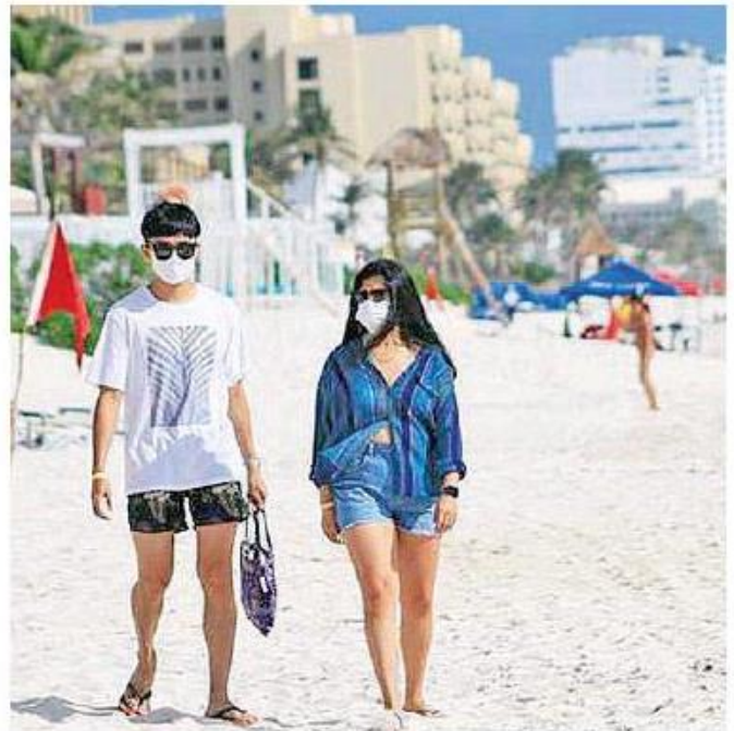
Poco a poco se ve más afluencia de turistas en Vallarta.

mente en agosto llegue el primer cruce-ro de la línea Carnival, Ralis Cumplido dijo que las posibilidades son altas y eso generará derrama importante, pues un crucerista deja alrededor de 115 dólares durante las ocho horas que permanece en el puerto. Desde hace casi ocho semanas, el semáforo epidemiológico de Jalisco se ubica en verde.