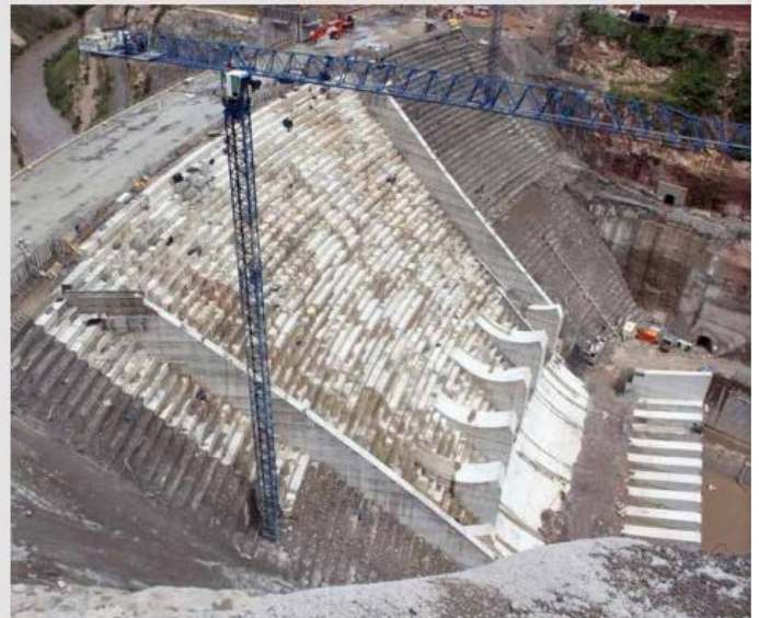
Será el Presidente Andrés Manuel López obrador quien dirá el destino final de la presa de El Zapotillo y si los pueblos de Temacapulín, Acasico y Palmarajo viven o mueren.

La construcción del acueducto a León, Guanajuato, está contemplada dentro de las obras de mejoramiento de la infraestructura económica del país a mediano plazo (2021-2025), con una inversión de 13 mil millones de pesos, según la Secretaría de Hacienda. Representa casi el doble de los siete mil millones proyectados en 2011. La obra beneficiará a 1.4 millones de habitantes de León y a 350 mil de Los Altos.