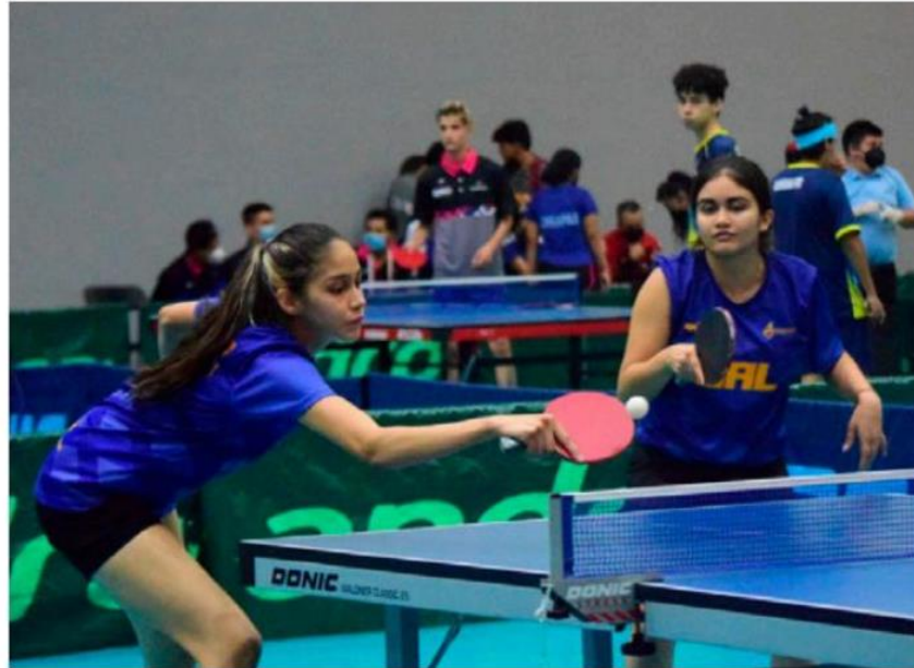
Muy destacada labor de las jaliscienses Sub-19.