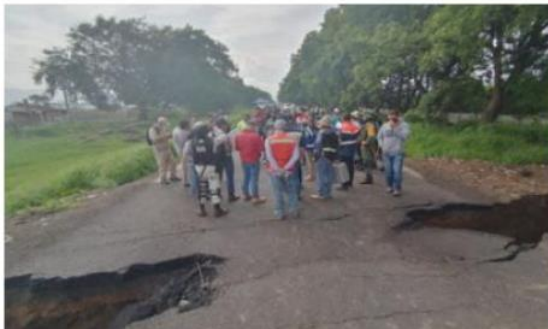
Autoridades iniciará a la brevedad los trabajos de reconstrucción de la carretera estatal 401 que comunica a Sayula con Zapotlán el Grande.

Con el objetivo de poder reabrir la vialidad y no seguir afectando ni la conectividad ni la economía de la región, la Secre-