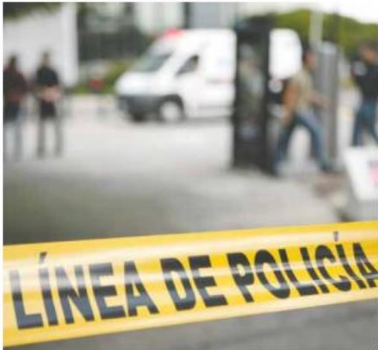
EL TOTAL. En los primeros cinco meses del año se han contabilizado mil 159 víctimas de homicidio.

Hasta mayo de este año se ha reportado el asesinato de 126 mujeres en Jalisco , cifra que representa el 10.9 por ciento del total