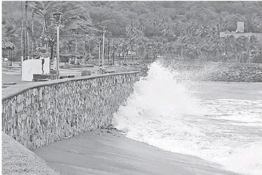
Alto oleaje se vio en algunas playas de Jalisco.

Por su parte el Servicio Meteorológico Nacional (SMN) informó que el punto de