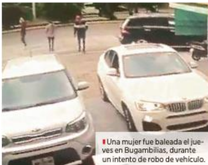
Una mujer fue baleada el jueves en Bugambilias, durante un intento de robo de vehículo.

Entre las colonias azotadas por este ilícito están El Palomar, El Campanario, Nueva Galicia, Tulipanes y La Tijera, y de ellas, sólo esta última supera en cantidad de denuncias a Bugambilias, pues sumó 50 casos.