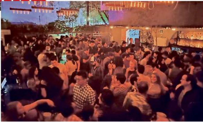
El antro ubicado en Calle Bernardo de Balbuena, rebasó por mucho el 40 por ciento de aforo, como se ve en la imagen.

Rebasan centros nocturnos aforo permitido