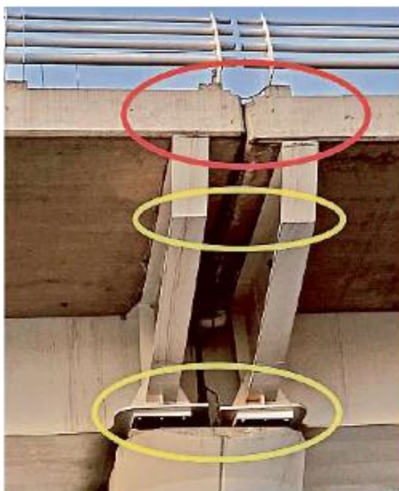
Siteur realizó una inspección visual técnica de traveses de la Línea 3 acompañado por personal de la SIOP, la SCT y el constructor OHL.

Estas denuncias se dan luego de que la Línea 12 del Metro de la Ciudad de México colapsó, a pesar de ser la más nueva de todo el sistema en esa ciudad, por causas que preliminarmente estarían relacionadas con deficiencias constructivas, así como en el ensamblaje de las estructuras.