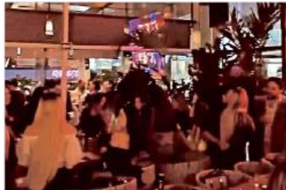
En zona de Acueducto, un concierto con Bobby Pulido abarrotó uno de los antros.

mitiendo la entrada de las personas, a pesar de que ya no contaba con la capacidad suficiente para mantener distancia entre los asistentes.