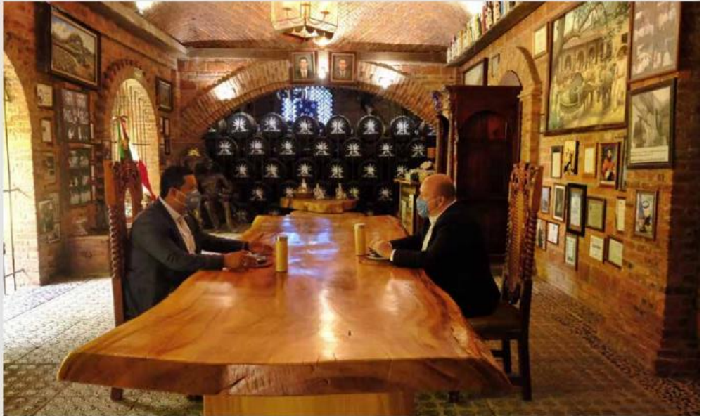
En la sede de la fábrica de Tequila San Ramón los gobernadores de Jalisco y Guanajuato se pusieron de acuerdo para convencer al Presidente López Obrador de por qué debe apoyar la terminación y funcionamiento de la presa de El Zapotillo.

Dice este acuerdo, que la Federación deberá desarrollar con recursos propios la infraestructura necesaria que permitirá el aprovechamiento de 11.58 metros cúbicos sobre segundo (365 millones 186 mil 880 metros cúbicos anuales), que se requieren para satisfacer las necesidades de Los Altos de Jalisco, Tepatlán, Área Metropolitana de Guadalajara y León, Guanajuato.