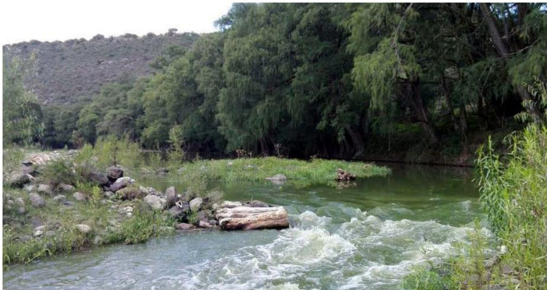
Estudios señalan que el Río Verde pasa por un estrés hídrico.