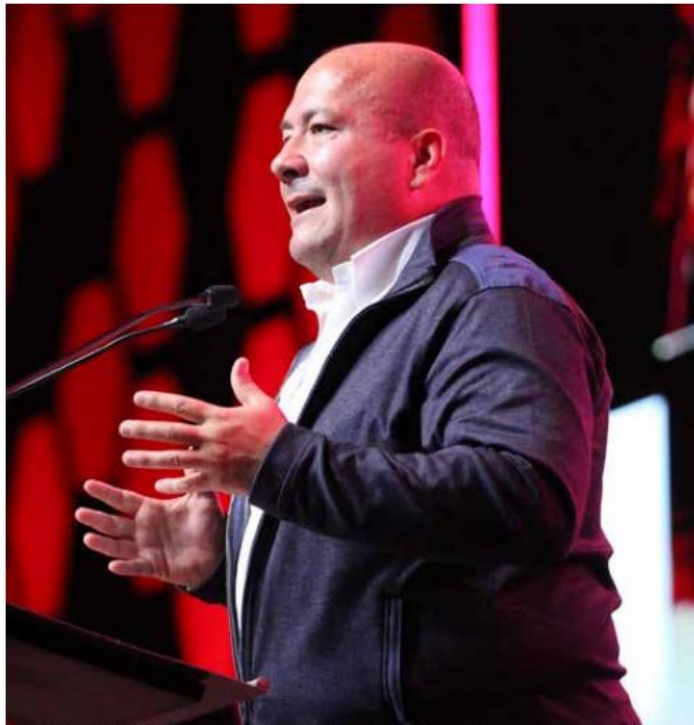
Las ínfulas presidenciales de los propagandistas del Gobernador

Por ejemplo, el tema de la revocación de mandato del Gobernador. Mucho se ha discutido en redes y en columnas de opinión la pertinencia o no de la renuncia del gobernador Enrique Alfaro debido a la situación de inseguridad que vive el estado, (y en la que el gobierno estatal se niega de manera patológica a aceptar cualquier cosa parecida a la responsabilidad o ya de menos corresponsabilidad), por el desorden inmobiliario, los escándalos como A Toda Máquina, la Fiscalía Infiltrada en la que después no pasó nada, el C5 inoperante, los incendios imparables en el bosque y muchas otras cosas; pero más allá de las pifias, es pertinente hacer esa pregunta tan sólo porque Alfaro prometió un ejercicio de ratificación o revocación de mandato, “El que no cumpla se va”, dijo y no estaría mal empezar a cumplir preguntando lo que prometió que preguntaría y no nada más lo que le