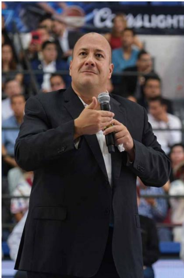
El 4 de enero del 2019 el Gobernador Enrique Alfaro anunció que ese año invertirían 200 millones de pesos en la operación de 50 escuelas de educación básica de tiempo completo y anunció que el objetivo en el cierre de su sexenio será que la totalidad de planteles educativos (más de 13 mil) funcionen mediante dicho modelo. Y hoy guarda silencio ante el cierre de más de 900 escuelas.

Por otro lado, la interpretación errónea de la autoridad educativa local agrava más el contexto de las Escuelas de Tiempo Completo (ETC), pues asumen que con la eliminación del presupuesto directo a través de las Escuelas, sin embargo, pareciera que desconocen el marco normativo que hay al respecto y que desde su constitución estableció lineamientos muy claros para la operación y el funcionamiento de las mismas. Dicho lineamiento está fundamentado desde el marco constitucional, en la ley general de educación artículo 9, fracción VIII establece la continuidad de las ETC y el propósito de incrementar tanto el presupuesto como el número de éstas, para cumplir con lo establecido en el Artículo Tercero Constitucional. Los lineamientos establecen en las Disposiciones Generales, punto 4, que "las Escuelas que sean incorporadas a ésta mo-