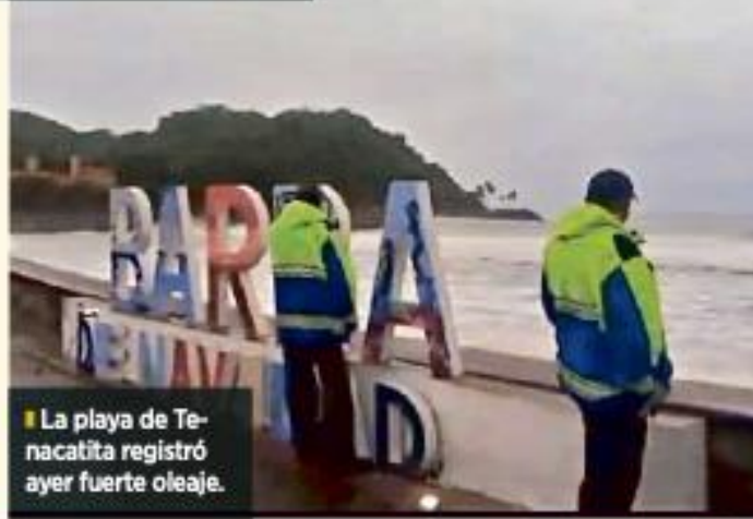
La playa de Tenacatita registró ayer fuerte oleaje.

Aunque permanece la alerta en la costa, para el resto del Estado se esperan lluvias.