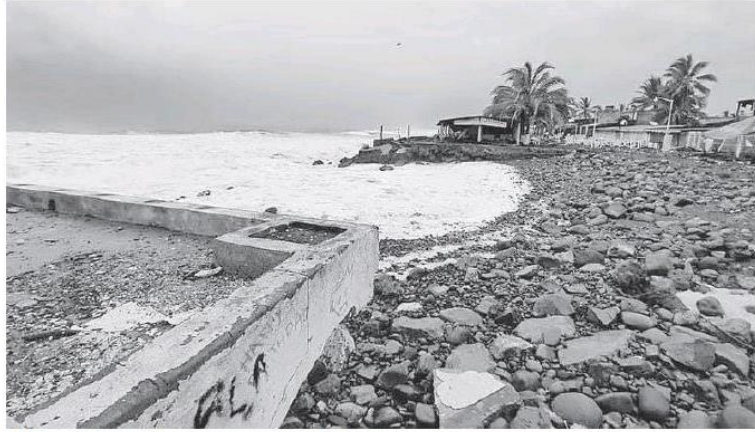
Afectaciones en las playas de Manzanillo. Colima.

Al final no se reportaron víctimas humanas.