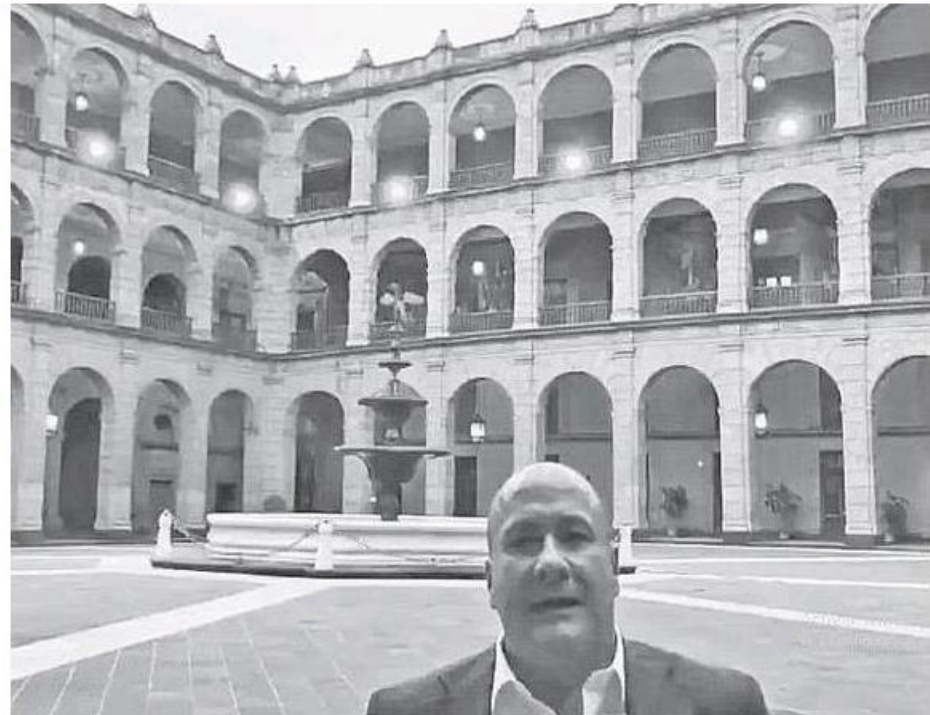
Enrique Alfaro, gobernador de Jalisco, estuvo en Palacio de Gobierno.

A través de un video indicó que fue "una muy buena reunión, con un buen ánimo del presidente de nuestro país, platicamos de muchos temas, se abordaron distintas agendas y pudimos avanzar en algunos acuerdos que van a ser afinados y revisados el próximo martes en una reunión que vamos a tener con una parte del gabinete del Gobierno de la República y con una parte del Gabinete estatal para poder desahogar algunas cuestiones en