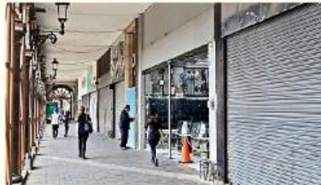
Fueron 21 comercios del Edificio Plaza los desalojados ayer. No hay fecha de regreso.