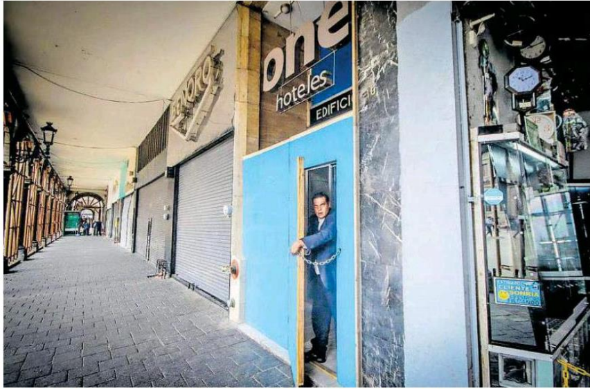
Las puertas del céntrico hotel se cerraron y están a la espera de lo que procede al cierre de operaciones.