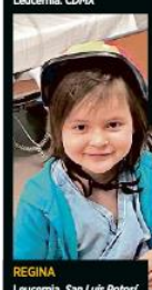
REGINA Leucemia, San Luis Potosí