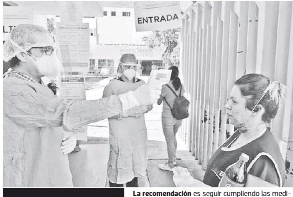
La recomendación es seguir cumpliendo las medidas sanitarias.

En casos activos, hay 986 personas que han sido confirmadas en los últimos catorce días, detectados mediante pruebas de antígeno y 289 a través de test PRC que al inicio de la pandemia era la herramienta principal de diagnóstico. De este