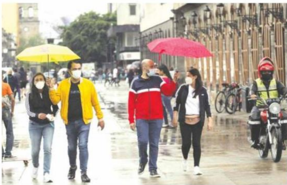
EL 15. El temporal 2021 inició a mediados de mayo, según el Instituto de Astronomía y Meteorología de la Universidad de Guadalajara.