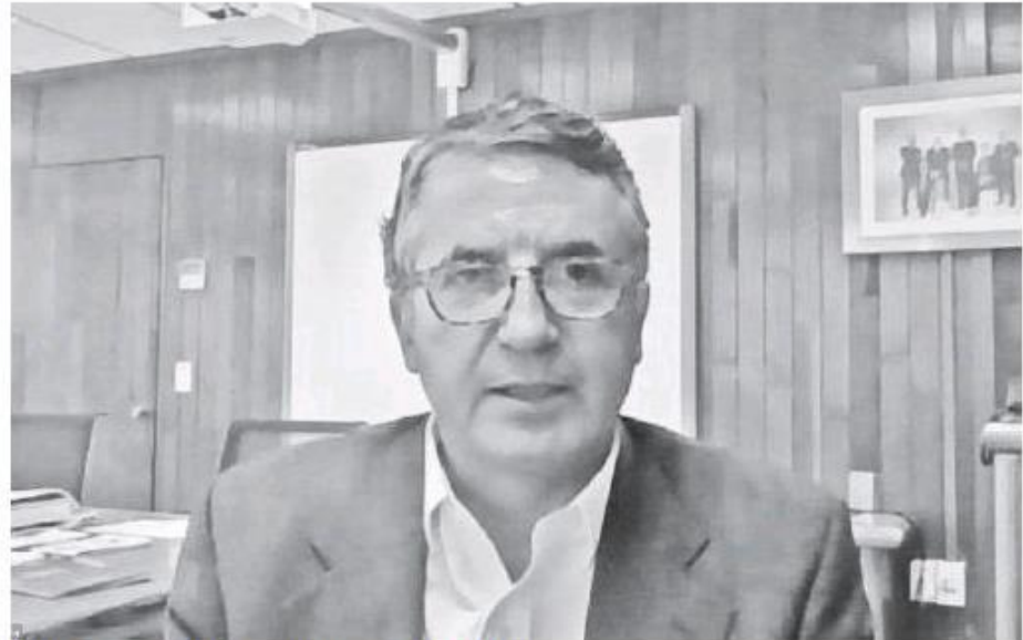
Julio Santaella , presidente del INEGI.

En cuanto a la población no económicamente activa, las mujeres li-