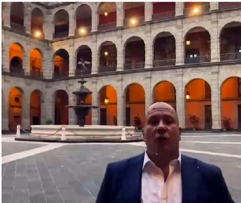
El mandatario estatal publicó un video en el que ofreció detalles de la reunión.

Encuentro. Funcionarios estatales y federales dialogarán de seguridad, agua, transporte y carreteras en los próximos días