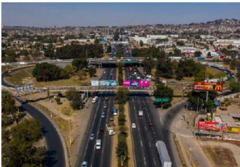
Realizarán trabajos de pavimentación. MILENIO

La Secretaría de Seguridad del Estado, a través de la Comisaría de la Policía Vial, recomienda a la ciudadanía atender las indicaciones de los oficiales viales, así como considerar el tiempo en sus trayectos, para evitar tráfico en la zona y demora en los traslados. —