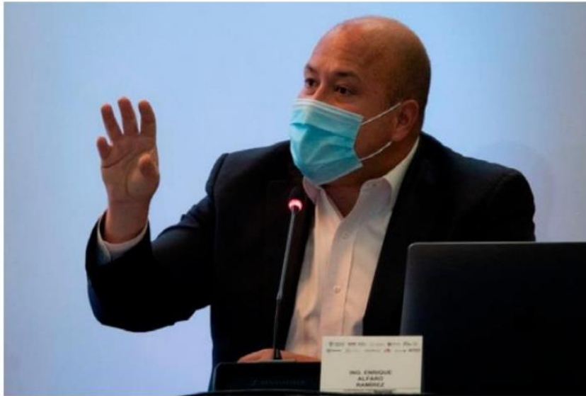
el gobernador de Jalisco, Enrique Alfaro.

Enrique Alfaro dio a conocer que el encuentro fue bueno, “con un buen ánimo del Presidente de nuestro país”.